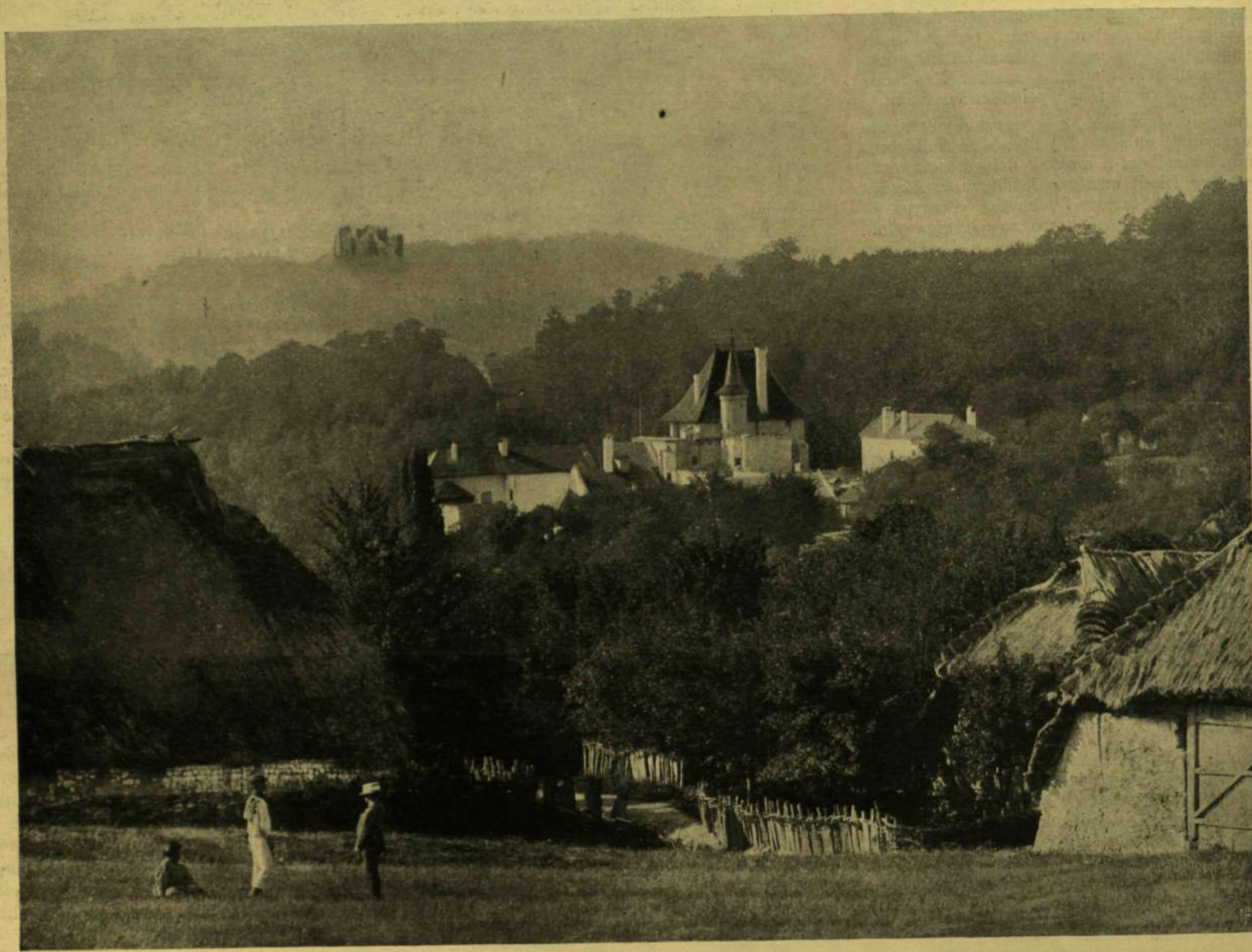
A SZKICZÓI KASTÉLY.

* A korai házasságok Kelet-Indiában most is szokásban vannak. A legutóbbi népszámlálás alkalmánál