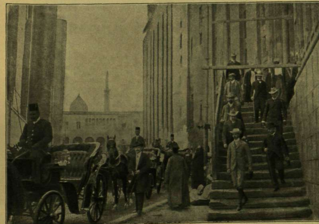
A NÉMET TRÓNÖRÖKÖS ÉS ÖCCSE KAIRÓBAN, EGY TÖRÖK MECSETBEN TETT LÁTOGATÁSÁRÓL TÁVOZVA.

De nemcsak New-Yorkban, az ottani milli mosok körében üznek ilyen pazarlást a virággal. Ugyanez történt például pár évvel ezelőtt St.-Louisban, midőn egy előkelő berlini család egyik tagja tartotta esküvőjét egy dús-gazdag st.-louis-i szerzőző leányával. A templom, melyben a szertartás végbement, virágdíszben úszott. A nászszakomat az egyik ottani szállóban rendezték, miután az após palotája nem volt elégséges a roppant vendégsereg befogadására. Az óriási szálloda első emeletének fele volt e czélra kibérelve és tündérieren felszerelve. Az a terem pedig, hol a jegyespár a jókívánságokat fogadta, valóságos virágtenger volt. A falakat és a mennyezetet teljesen elfődte a halványzöld sassaparilla, melyből művészi csoportosításban gyöngyvirágok és rózsák mosolyogtak elő. Azon hely felett, hol a jegyespár állott, hatalmas