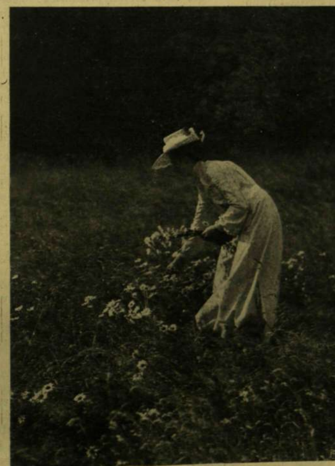
Rawlings W.: Szászországi közt.

Miniszterek háta megborzonek, ha olvassák. A kombináló politikusok esze megáll. A bécsi Burg termeiben suttogva tanakodnak a korona emberei: Was sollen wir machen? A politikai bonyodalmak gourmandjai lihegve futják át a lapokat, mint az érzékeny varrólányok, mikor a regénynek ahhoz a fejezetéhez értek, hogy Arthurt vagy megölik, vagy kimenekül a bonyodalmas helyzetből. Hát még a klub! Oh, a klub! A kulisszák titokzatos, beláthatatlan szagokkal össze-vissza font világa. Hogy szövik itt apró, finom hálójukat a kis és nagy pókok. Bizonytalanul állnak a stréberek. Csalétekkel megtűzdelt horgaikat a zavaros vizekbe mélyesztik a halászok. Némelyik horgon k a