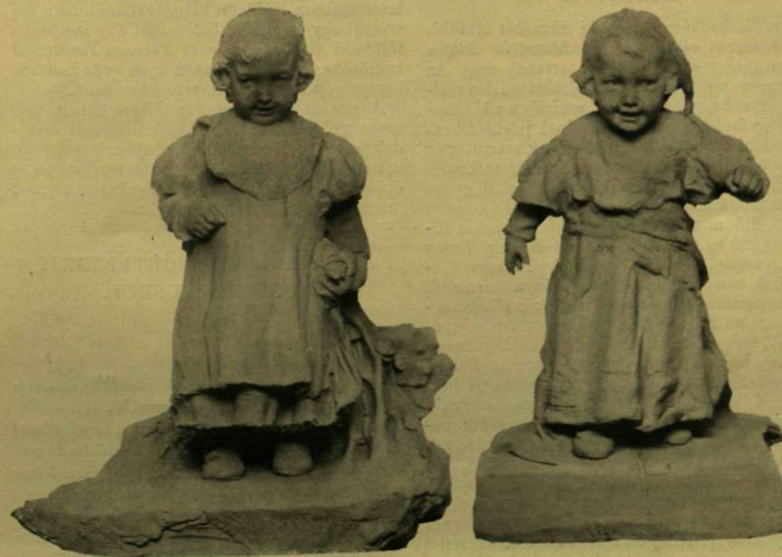
Radnai Béla: A baba járnai tanúl.

Londoni tudósítók írják a következő esetet: Londonban egy nagynevű főúri család elszüült ivadéka élt, kinek egyedüli vagyona egy