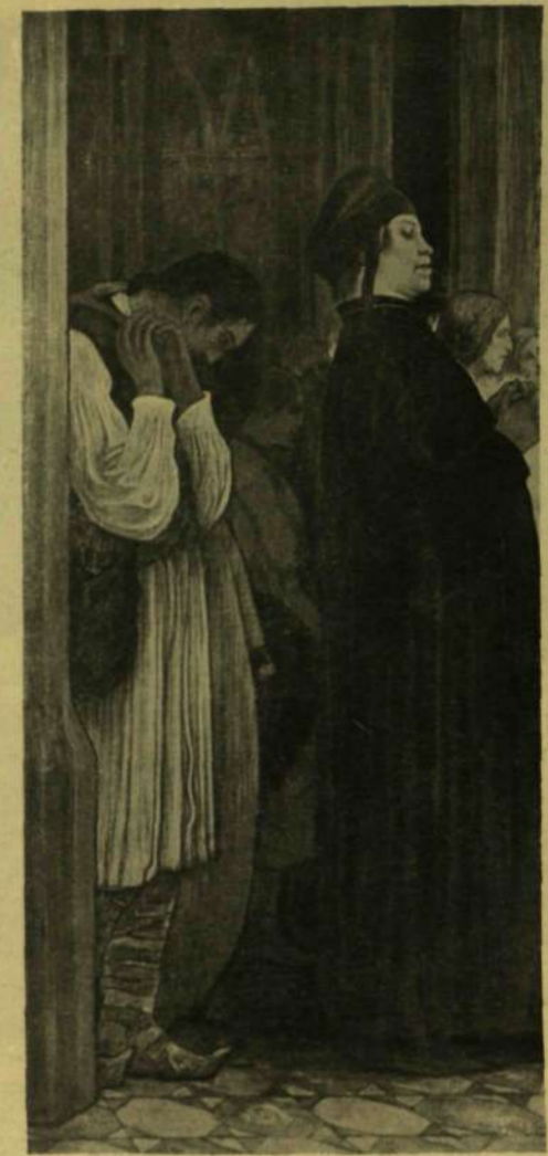
Kriesch Aladár: A farizeus és a publikánus.

osatákban viselt, arannyal kirakott aczél mellvérték mai napság minden jómódú angol kastélyában található.