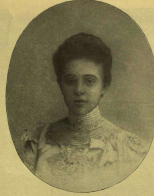
LIECHTENSTEIN ALAJOS HERCEG ÉS MENYASSZONYA ERZSÉBET AMÁLIA FŐHERCEZGNŐ.

remek régi kastély volt, melynek értékét azonban a jelzőleg bekebelezett adósságok tisztesen túlhaladták. A kastély az ország egyik távoli grófságában feküdt és bútor alig volt benne.