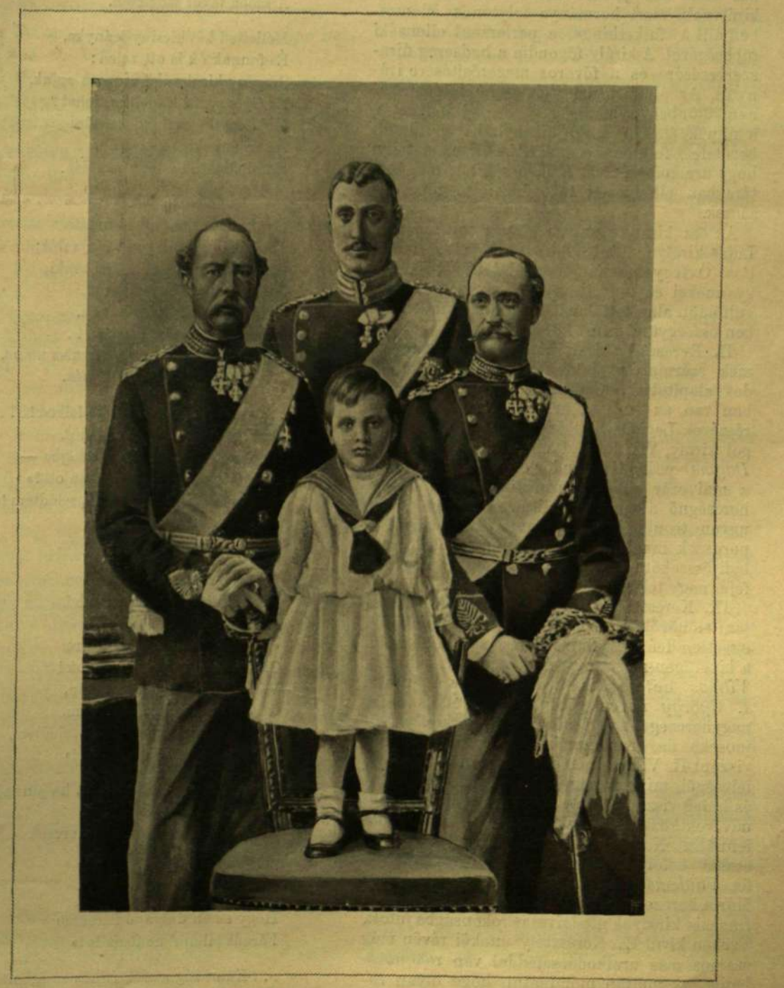
NÉGY NEMZEDÉK: IX. KERESZTÉLY DÁN KIRÁLY, FIÁVAL, A TRÓNÖRÖKÖSSÉL, UNOKÁJVAL ÉS DÉDUNOKÁJÁVAL.

E magatartásával mintegy előkészítette, a mit a királyi családdal való rokonsága és házassági összeköttetése is előmozdított, hogy a dán uralkodóház akkor küszöbön állott kihalása esetén reá szálljon a királyi korona. És csakugyan az 1851-iki varsói, majd az 1852-iki londoni jegyzőkönyv, mely utóbbi az összes