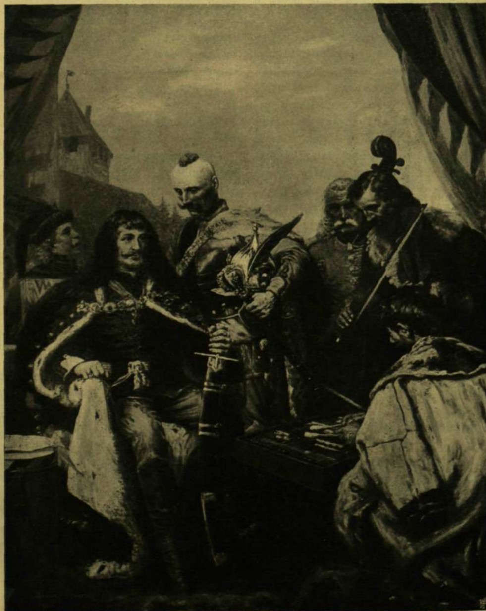
Greguss Imre: «1703.» II. Rákóczy Ferencz indulója.

A tárlat genre-szobrai közt kedélyességével is feltűnik Radnai Béla két kisebb kompozíciója: «Jár a baba!» Az egyik szobormű a megindulni készülő apróság habozását mutatja, míg a másikon már az imbolygó mozdulatot látjuk, a féltékenységnek az arczon is megjelenő bájos kifejezésével.