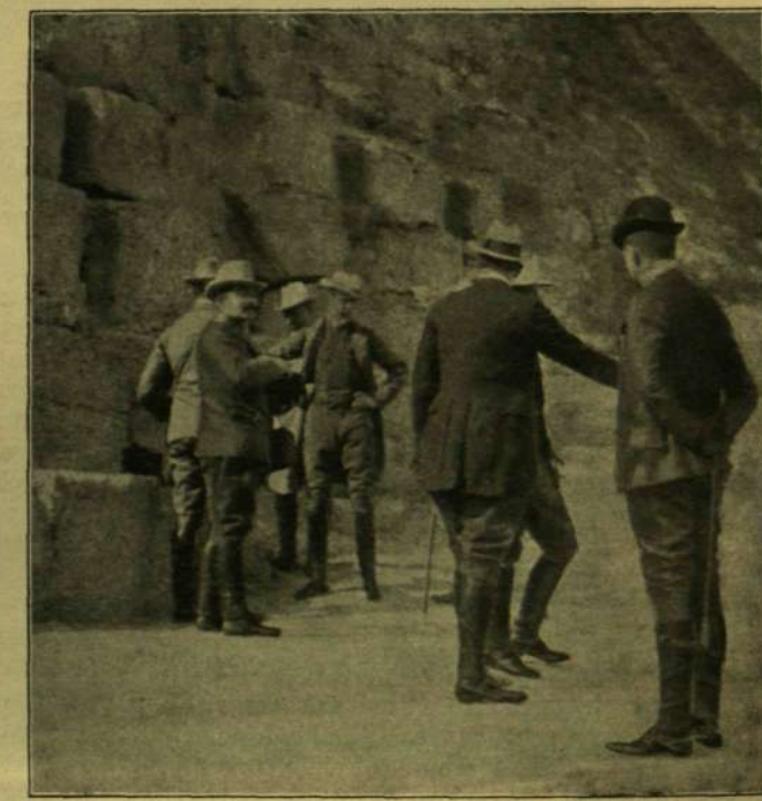
A NÉMET TRÓNÖRÖKÖS ÉS ÖCCSE A KHEOPS-PIRAMIS ALJÁN.