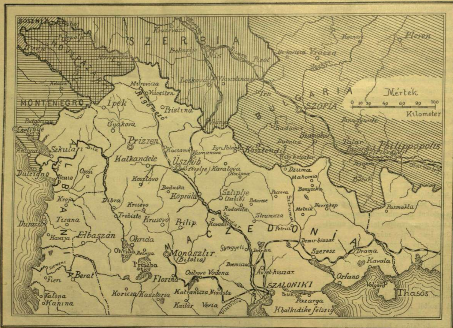
ALBÁNIA ÉS MACZEDONIA TÉRKÉPE.

kon örülnek is. Ösmerni kell az asszonyi lelkét. Én nem hiszem például, hogy a paradicsomban a kigyó tanította volna meg Évát az almaevésre, de élek azzal a gyanúval, hogy Éva tanította meg a kigyót a sziszegésre és marásra.