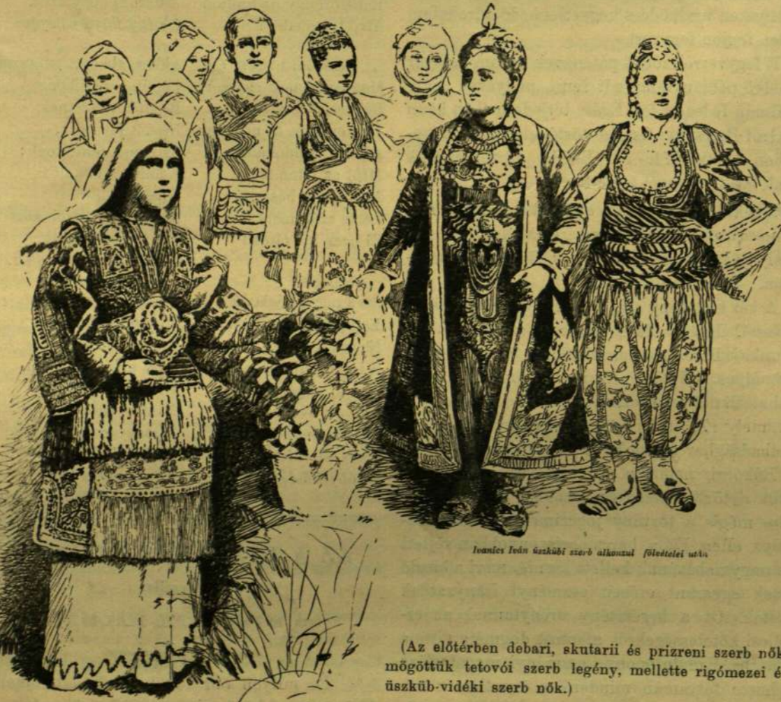
(Az előtérben debari, skutari és prizreni szerb nők, mögöttük tetovói szerb legény, mellette rigómezei és úszkub-vidéki szerb nők.)

De már ezt fenhangon kacagták meg a falakat megszállt vitézek. Ösztönszerűleg menekült rogyadozó inakkal, fogvaczogva a ház felé.