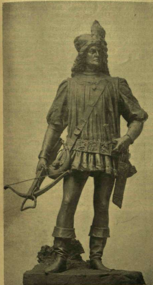
Strobl Alajos: Mátyás király a vadászaton.

«Macedonia» tulajdonképp elavult történelmi fogalom. A török közigazgatás e nevet nem ösméri, hanem azt a területet, mely az európai térképeken Macedonia névvel van jelölve, három vilajetre (tartományra) osztja. Ezek a szalonikii, bitolia-monasztiri és koszovói vilajetek. Az elsőnek a székhelye Szaloniki, a másodikik Bitolia-Monasztir, a harmadik Prisztina. Minden vilajet több szandzsákságra (kerületre) oszlik, ezek ismét kázákra (járásokra) és nahijekre. A vilajetek kormányzóit válnak, a szandzsákokot muteszarrifnak, a kázákát kajmakánnak és a nahijekét mudirnak nevezik. A három vilajet lakossága a legújabb adatok szerint 2.350,000 főre becsülhető; ebből 400,000 török, 1.050,000 bolgár, 340,000 szerb, 250,000 görög, 80,000 albán, 140,000 kuczo-oláh és 90,000 spanyol-zsidó. A bolgárok nagyobb tömegben a Rhodope-hegység déli részén, a szalonikii vilajetben laknak, azonkívül a koszovói vilajet délkeleti csücskén, az Oehrida-tó körül stb.; az albánok Monasztir környékén és a koszovói vilajetben; ez utóbbinak Szerbiával határos részén a szerbek; a görögök a szalonikii vilajetben, a kuczo-oláhok a monasztiri tartományban. Az albánok nagyrésze mohamedán hitű, valamint a bolgárok közt is vannak izlam követők. Ezeket