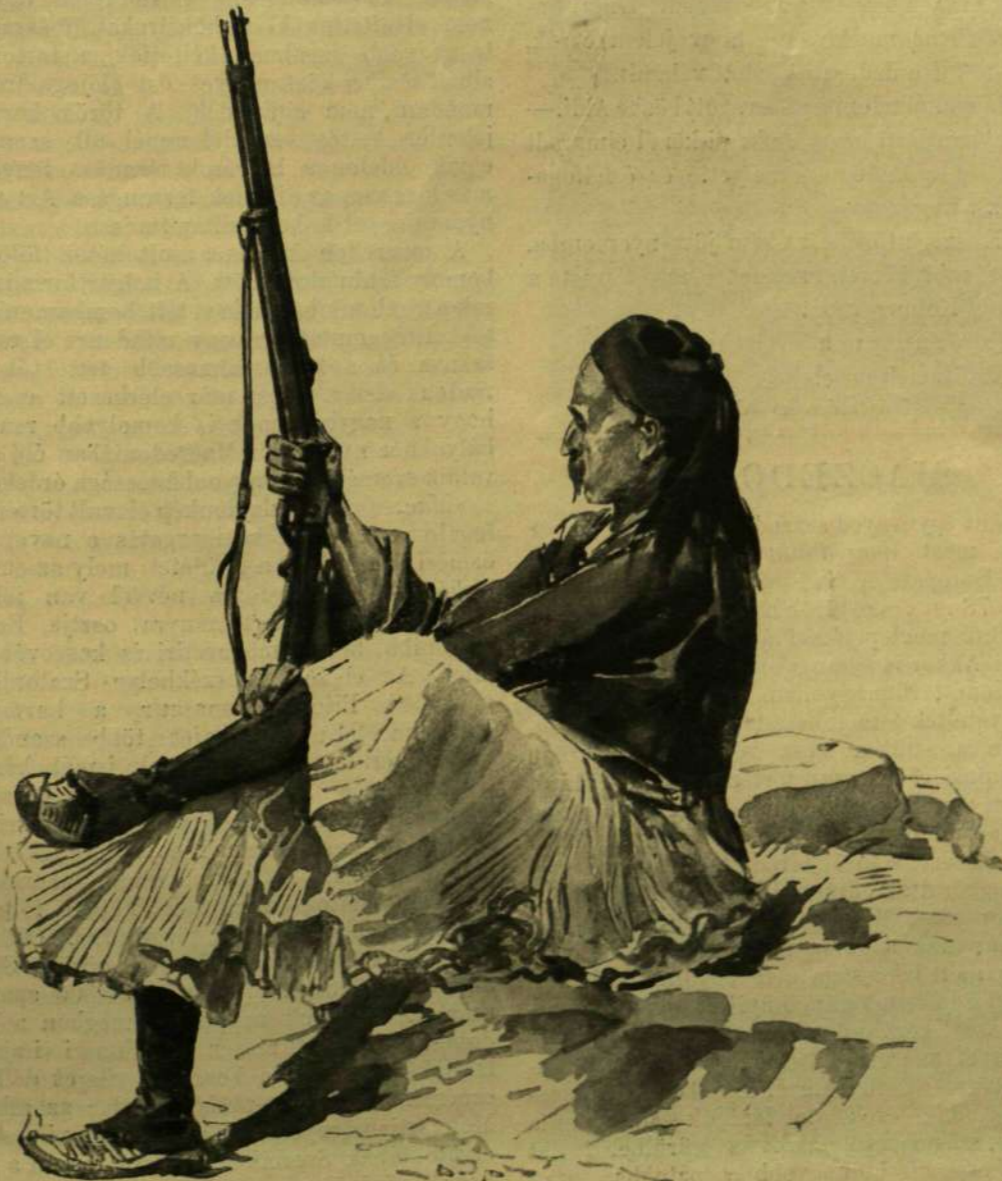
MOHAMEDÁN ALBÁN PRIZRENBŐL.

— Fogadni mernék, — szólát Bajmódy. — hogy a fruskák egy részének tetszik a veszedelmes kaland lehetősége. Sikítoznak, de tit-