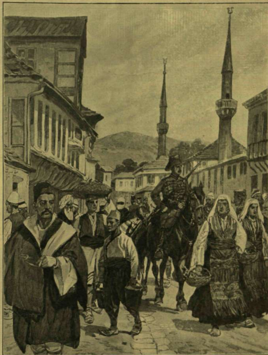
MONASZTIR (BITOLIA) FŐUTCAJÁ.

Majd hogy meg nem hasadt a Dimitri szive