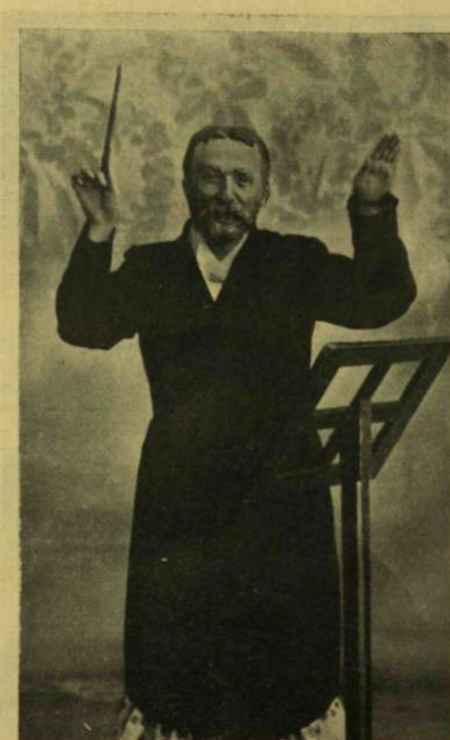
KURY KLÁRA MINT KARMESTER.

A Magyar Tudományos Akadémia május 5-ikén kezdte meg évi nagygyűlését, melyet 10-ikén vasárnap az ünnepi közlés fog befejezni. Az első napon