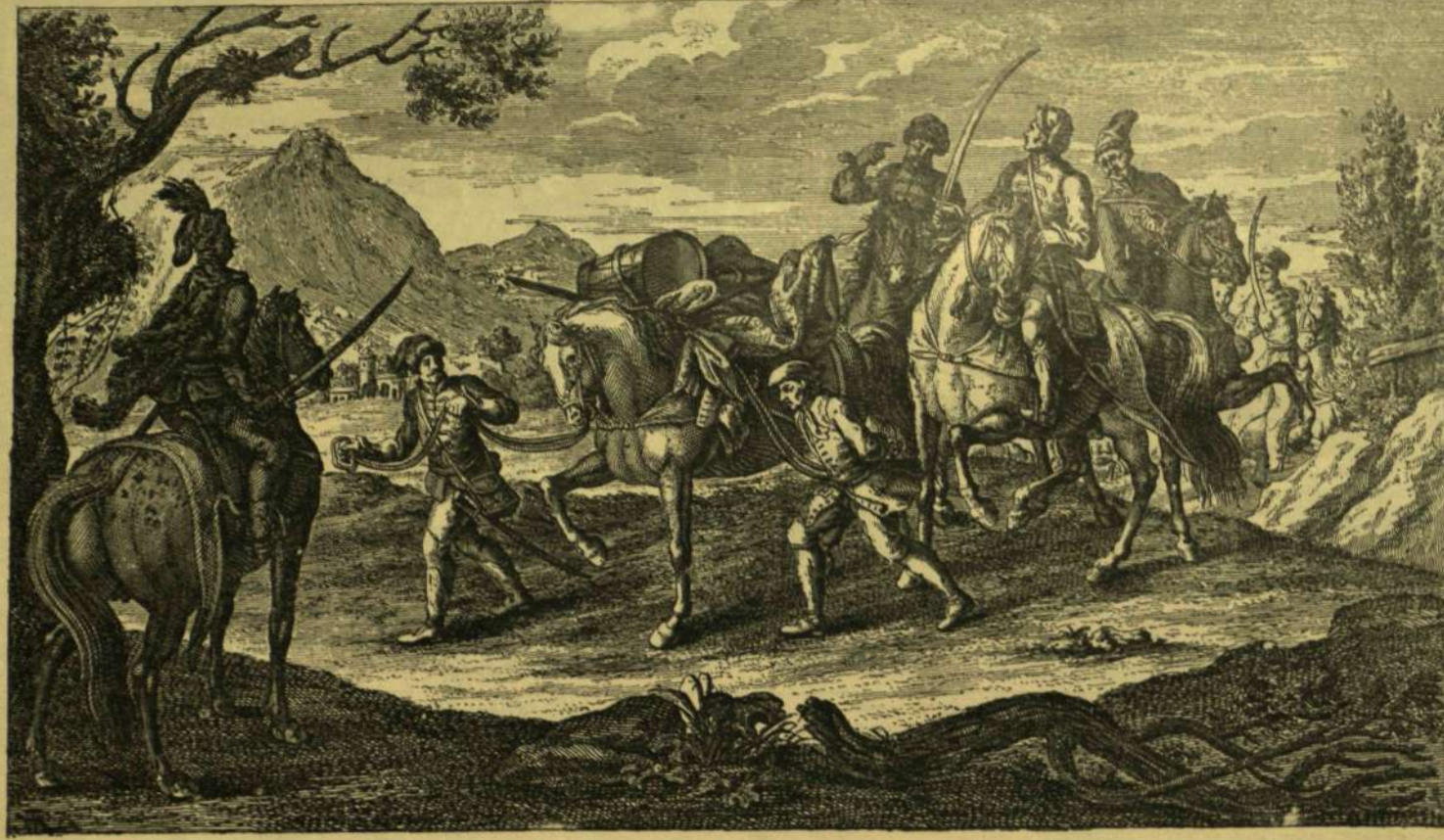
PORTYÁZÓ KURUCZOK FOGOLY LABANCZOT HAJTVÁ MAGUK ELŐTT.

ságharcz kiinduló pontjának, II. Endre arany bullája záradékának eltörlése, mely szerint ha a fejedelem megszegi a törvényt, az ország rendinek szabadságában áll, hűtlenségi vétek nélkül, összesen és egyenként ellenállani és ellenmondani örökre.