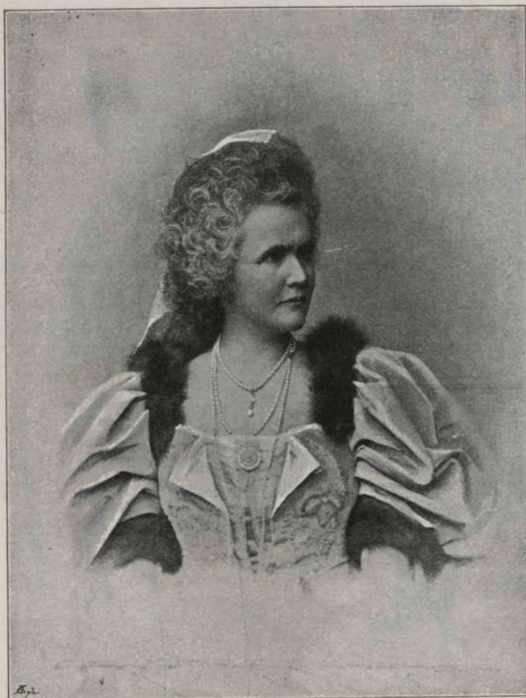
ERZSÉBET ROMÁN KIRÁLYNÉ.