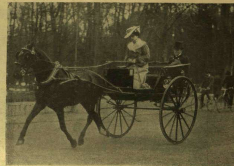
A BOIS DE BOULOGNEBAN.