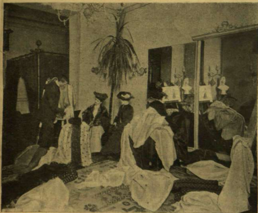
SZÖVETVÁLASZTÁS A DIVATTEREMBEN.

gerparti városok, mióta a czápák ritkábbak lettek, már szinte arról tanácskoznak, miképen lehetne a város közelében házi czápat tartani mint tisztasági faktort, a ki főlegye a besett mindenféle emberi és állati testeket és hulladékokat, melyek a tengert elpiszkítják. Egy czápa olyan szükséges rosz a tengerben, mint egy kormányzó a szárazföldön.