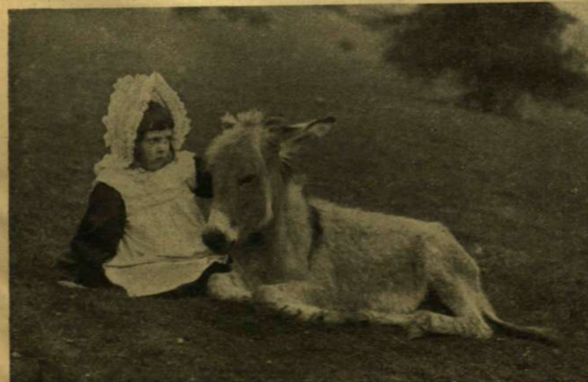
IDILL A KASTÉLY PARKJÁBAN.

Kétségtelen, hogy az asszonynak ép oly joga van a megélhetésre, mint a férfinak, de a női