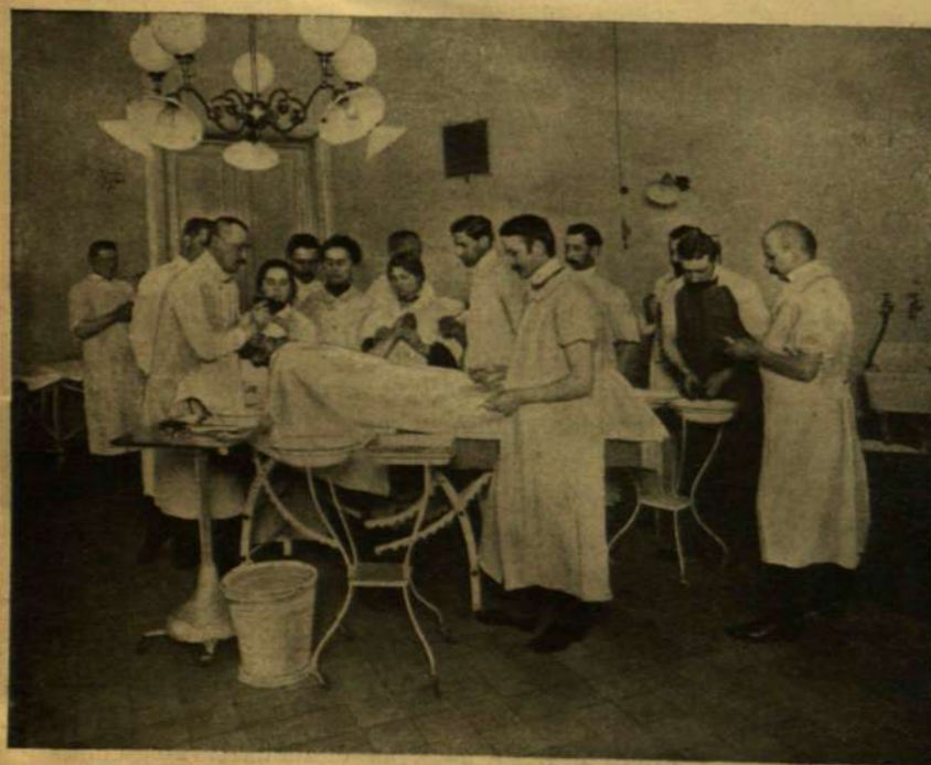
ORVOS KISASSZONYOK EGY MŰTÉTNÉL BUDAPESTEN.