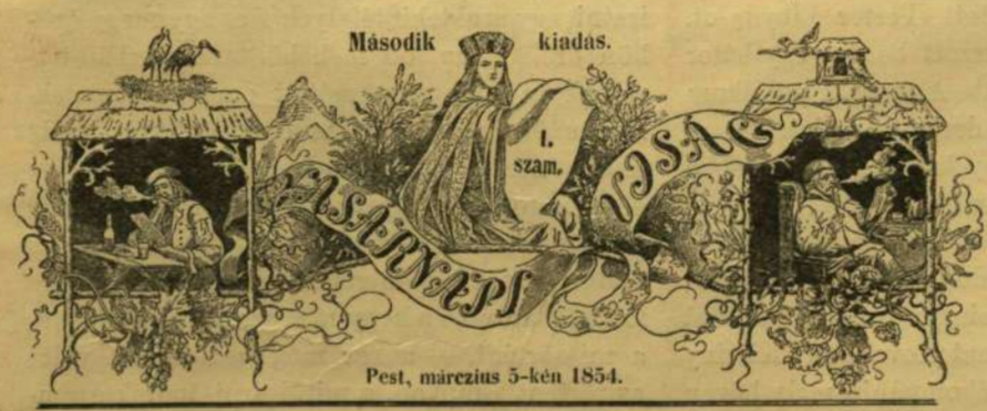
Pest, március 5-kén 1854.