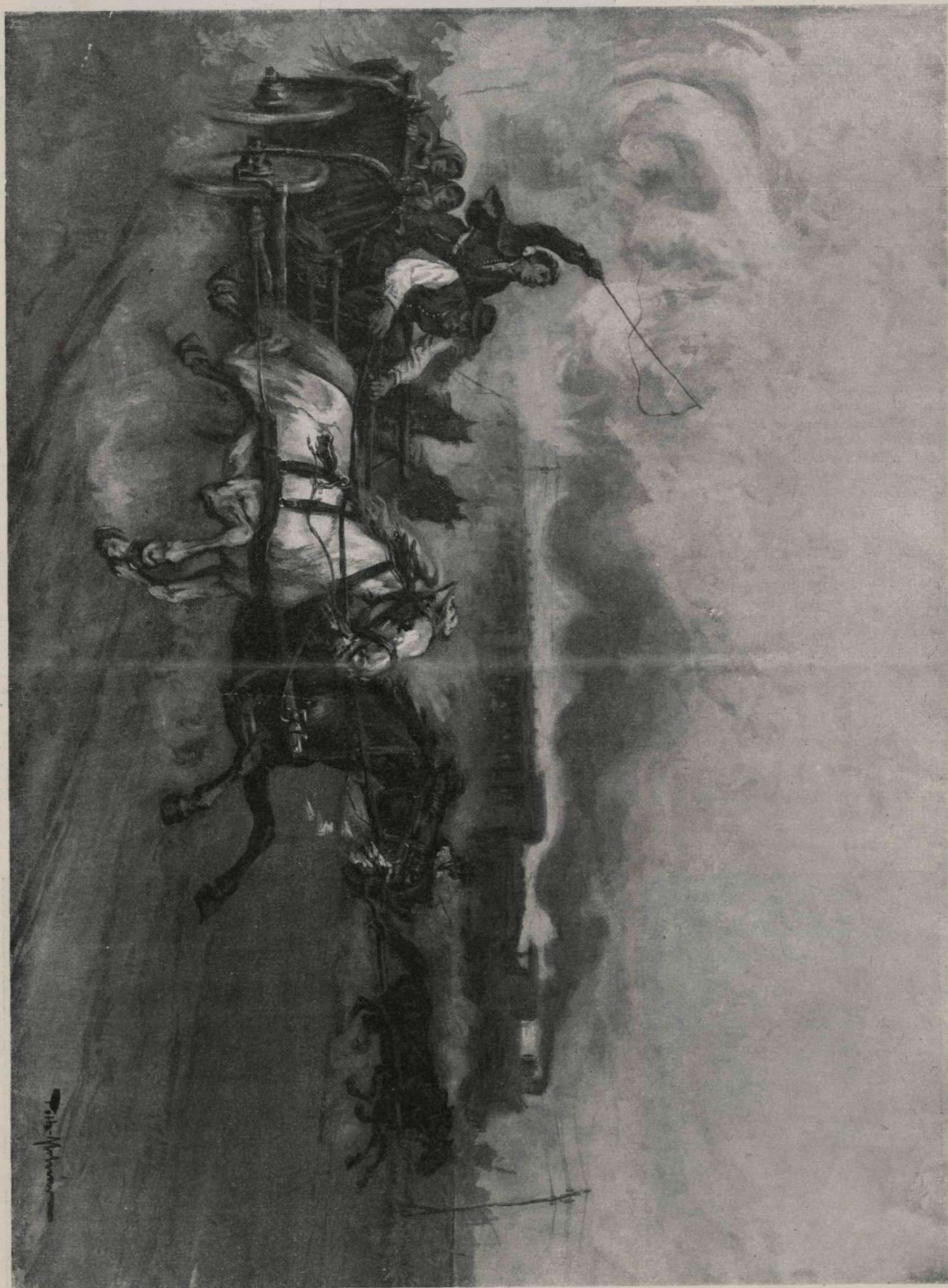
VÉRSENYFUTÁS A VICINÁLISSAL — TÖTH-MOLNÁR FERENCZ RAJZA