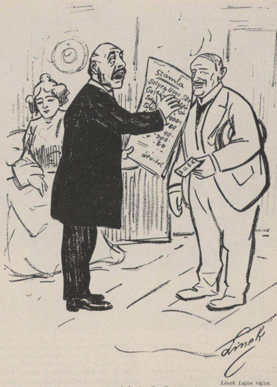
A SZABÓ ÚJ-ÉVI ÜDVÖZLETE.