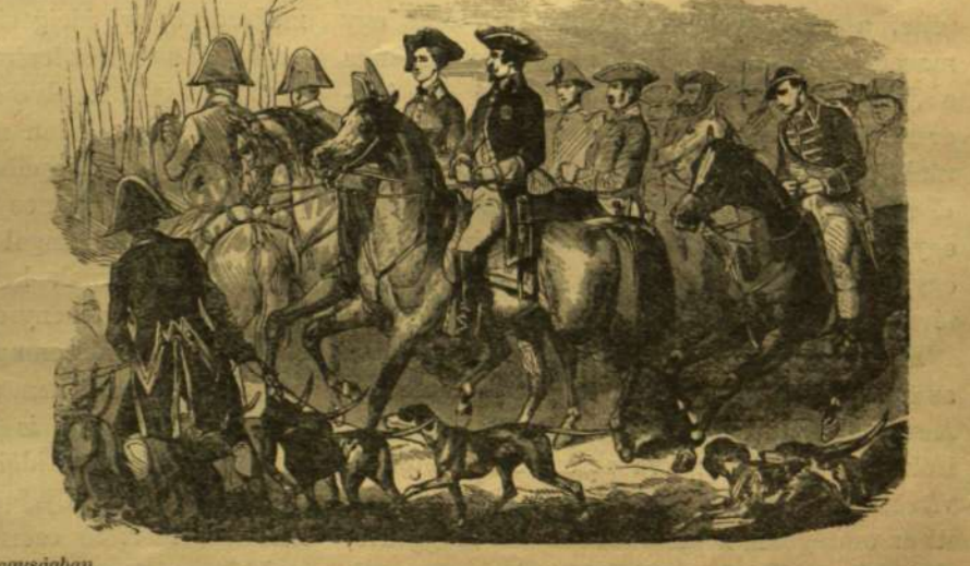
A 'VASÁRNAPI UJSÁG' 1854. ÉVI 2-K SZÁMÁNAK ELSŐ LAPJA.