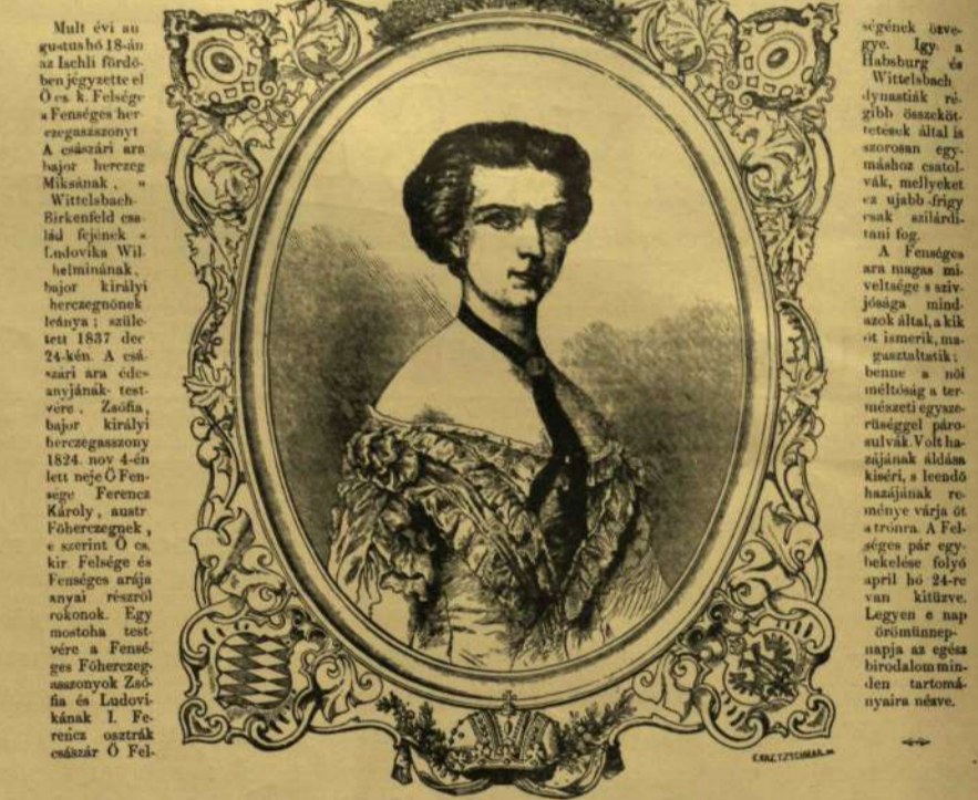
Negyedrés nagyságban. A 'VASÁRNAPI UJSÁG' 1854. ÉVI 4-IK SZÁMÁNAK ELSŐ LAPJA.

4. *A hol állam, s'érpa fényes-éneget... 5. *Bádog érek szép emlékekben... 6. *Oh, teremtés, oh dicső teremtés!