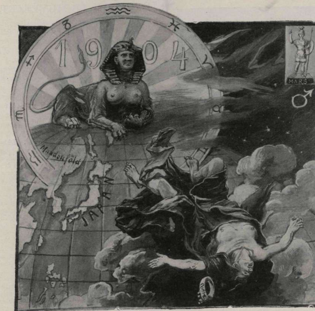
Kinnach László rajza.