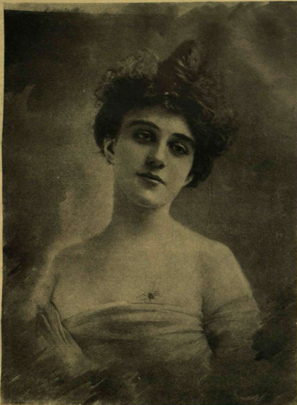
TETOVÁLT AMERIKAI DIVATHÖLGY.

munka új és új bonyodalma teremtett a keresztviszonyokban s itt rejlik a nőkérdés rendkívüli fontossága.