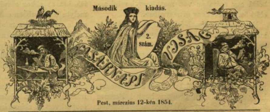
Pest, március 12-kén 1854.