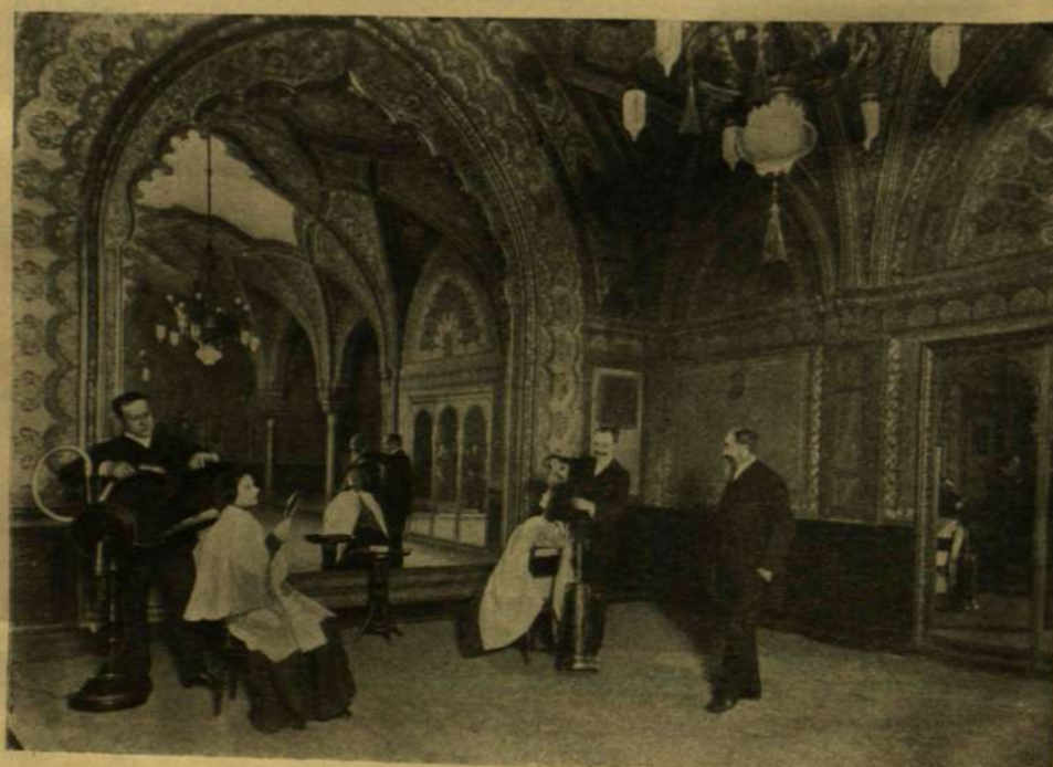
A HAJMŰVÉSZ KEZEI KÖZÖTT.