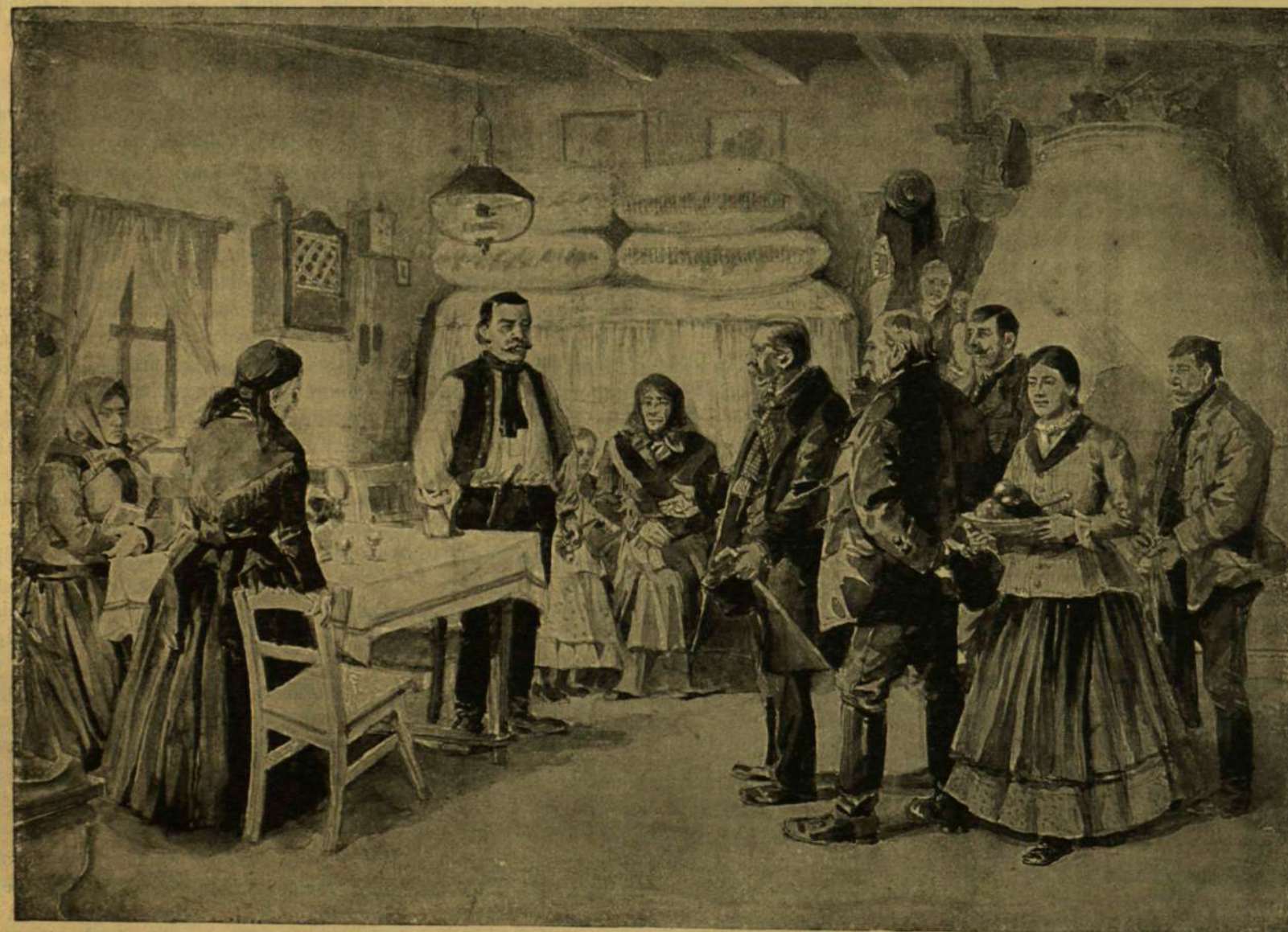
TISZTELGÉS AZ ÚJ BIRÓNÁL.