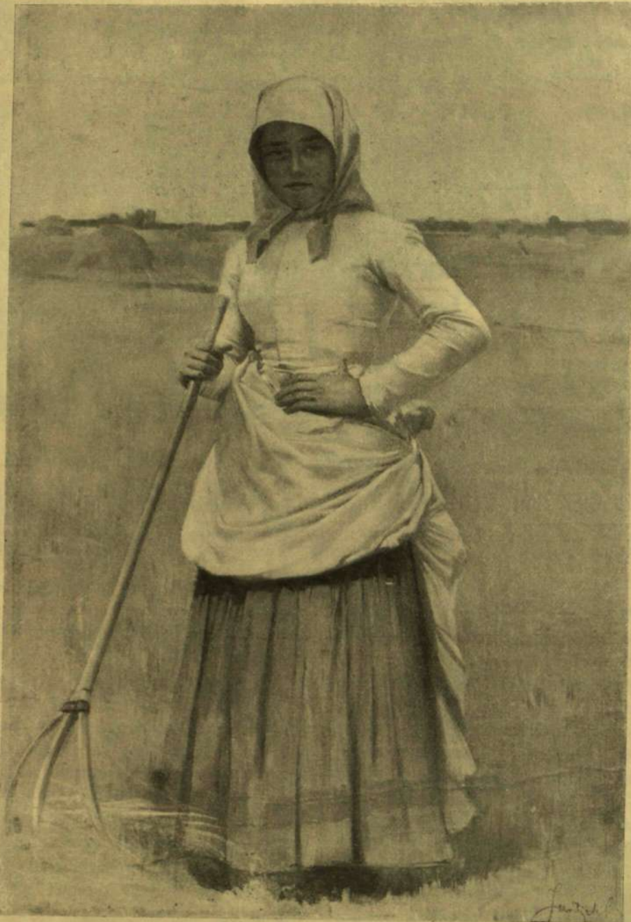
SZÉNAGYÚJTÓ LEÁNY. — Jantyk Mátás festménye.

narchia irásban és képen» című vállalat számára találó hű életképek egész sorát készítette, sőt alkalmi illusztrációkat is.