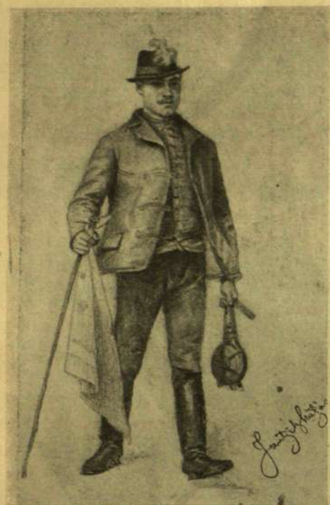
Jantyk Mátysa rajza.