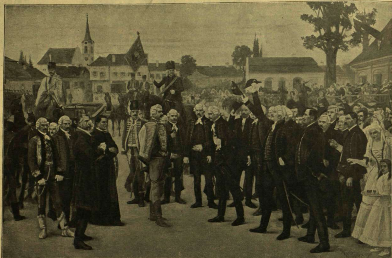
SZABADKA MINT SZABAD KIRÁLYI VÁROS FOGADJA MÁRIA TERÉZIA KIRÁLYI BIZTOSÁT. — Jantyk Mátys festménye.