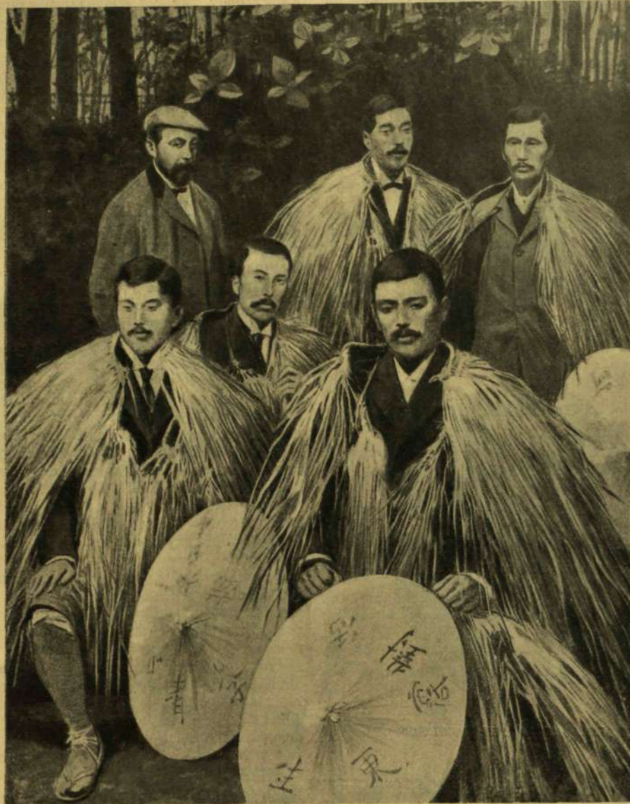
AZ OROSZ-ELLENES JAPÁN LIGA TAGJAI.

nak sikerült a kikötő előtt több úszó torpedót elhelyezni, a melyek esetleg még nagy veszedelmére lehetnek az oroszok hajóinak, ha csak ki nem tudják őket halászni, a mi pedig a mostanában mindig háborgó tenger miatt talán csak hetek alatt sikerülhet.