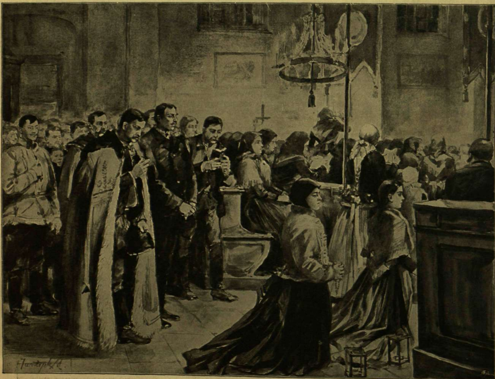
ÉJFÉLI MISE. — Jantyk Mátys rajza.