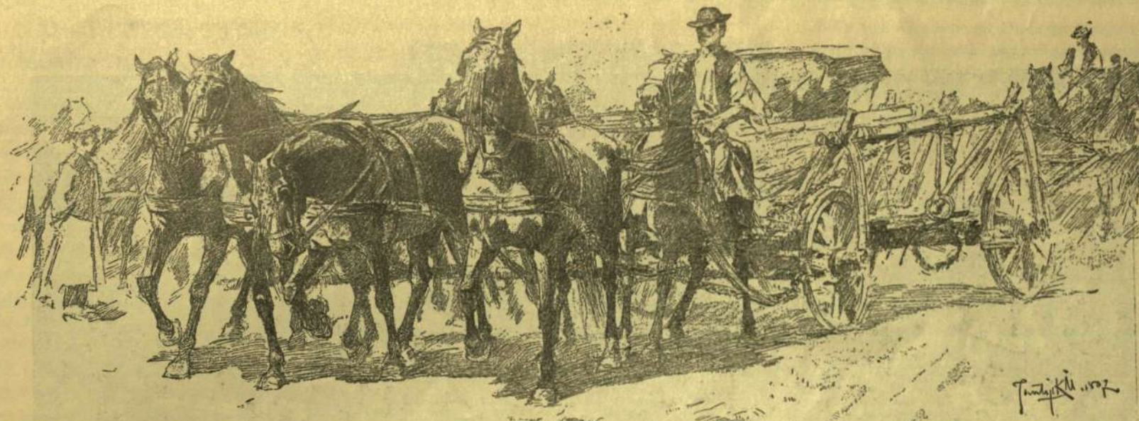
HORTOBÁGYI HETESFOGAT. — Jantyk Mátysa rajza.

Eleinte a gyakorlott üzletember száraz higadtsága szól ki belőle: «Háromezer arany — három hónapra», dűnyyogi látszólagos egykedvűséggel. Aztán megtudja, hogy Antonio lesz a kezes. Hangulata nyomban más árnyalatot vesz. «Háromezer arany — három hónapra és Antonio a kezes» ismétli nagyobb lélegzetet véve a kérdést. Aztán simit egyet a hosszú szakállán, mint a kiben az ész szava mellett a szíve körül is megdobbann valami. «Antonio nekem jó», — adja a pillanat közvetlen hatásaúl, habozás nélküli készséggel mintegy önmagának a választ és csak azután mérlegeli a kockázat esélyeit. «Háromezer arany — meg-lehetős kerek összeg — nehéz összehozni — nekem most nincs — de Tubalnak lesz — — — — —. A mi meg a kezeset illeti, igaz, hogy sok gabonával telt hajója jár a tengeren; azonban a hajó csak deszkafa, a hajósok csak emberek — — — — — útjukban kalózkodnak, szikla, vihar és vész — — — — — de Antonio nekem mégis jó».