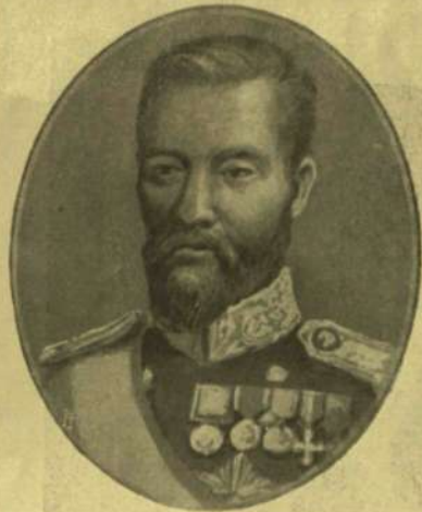
TOGO, JAPÁN TENGERNAGY.

Jantyk Mátjának, az oly korán elhunyt jeles festőművésznek műveiből, azon alkalmából, hogy most a Műcsarnokban ki vannak állítva, mai számunkban ismét bemutatunk egy nagyobb sorozatot, összesen tíz kisebb-nagyobb festményt, vázlatot, rajzot. Ezek között nincsenek a művész legnagyobb szabású munkái, mert azokat halálakor, mult évi 43, 44. és 46-ik számunkban közöltük, nevezetesen az új országház főrendiházi terme számára készült nagy falfestményét: «Az aranybulla kihirdetése»-t, továbbá «Buzaszentelés» című népeleti