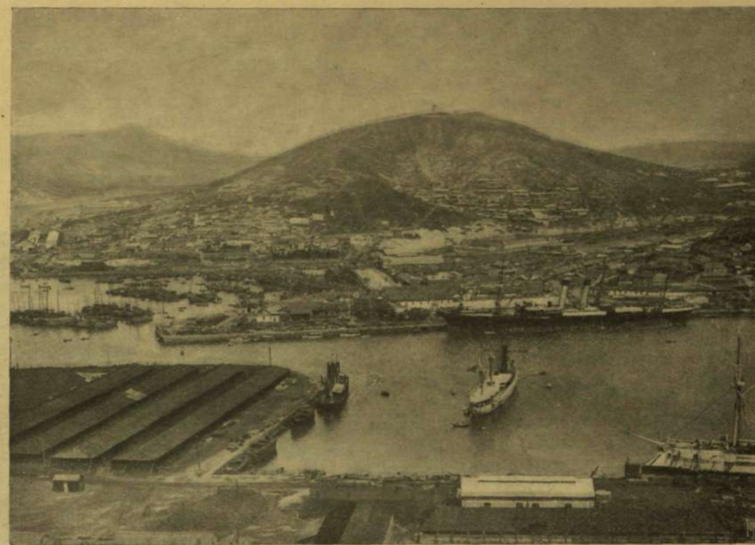
PORT-ARTUR AZ ARANYHEGYRŐL NÉZVE.

A Wallenstein-trilógia alap gondolata is, bár milyen jár s harsány szavakban nem tör útát, minden szarnokság, armány és udvari intrika ellen való hadüzenet. A költő, ki a harmincz éves háború történetét megírta, úgy választotta meg a szemben álló feleket, hogy egyiknek se kelljen pártjárta állania; tudta jól, hogy még az irtózatos, borzalmakkal, mérszálásokkal, rablással és gyújtogatással tele háborúknak is vannak rokonszenves hősei, maga Wallenstein jellemzi őket Wrangel ezredesnek, t. i. a svédnek, kik meggyőződéssel, igaz hittel eszmékért küzdenek és nem politikából, vagy hatalmi vágyból. De Schiller nem ezeket választotta küzdő felekkül,