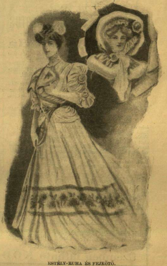
ISTÉLY-RUHA ÉS FEJKÖTŐ.