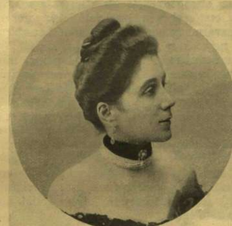
DELLMANICS LAJOSNÉ. (Nagybecskerek.)