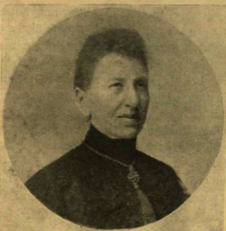
MÜNSTER TIVADARNÉ. (Kassa.)