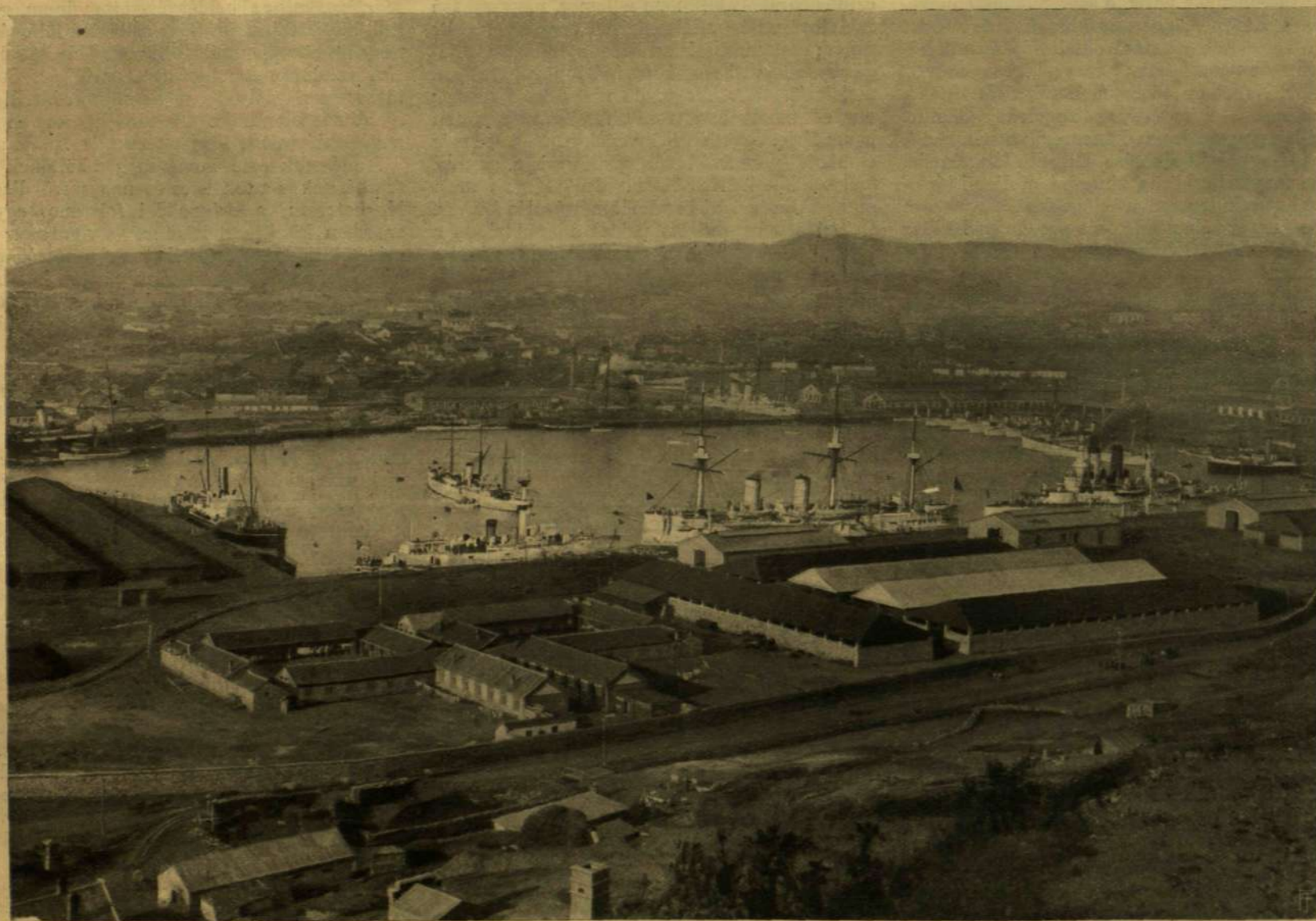
A RÉGI VÁROSRESZ ÉS A BELSŐ KIKÖTŐ RÉGI RÉSE.