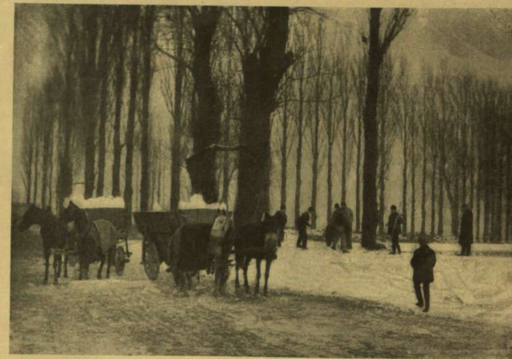
JÉGHORDÁS A FŐVÁROS HATÁRÁBAN.

Ha a tavasznak enyhe napja süt, Ha majd hímes virág nyílik a réten, Ha felragyog az élet mindenütt, Kibajt a remény is a nép szívében.