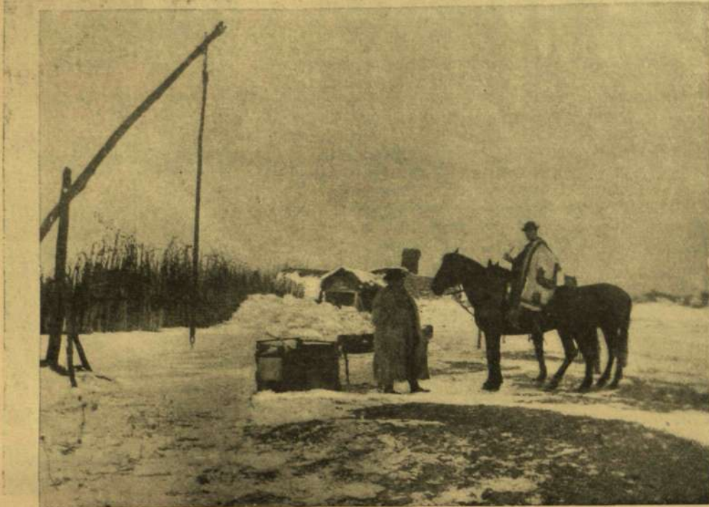
TÉL A PUSZTÁN. A Debrecen melletti Állgálló osárá tájéka.