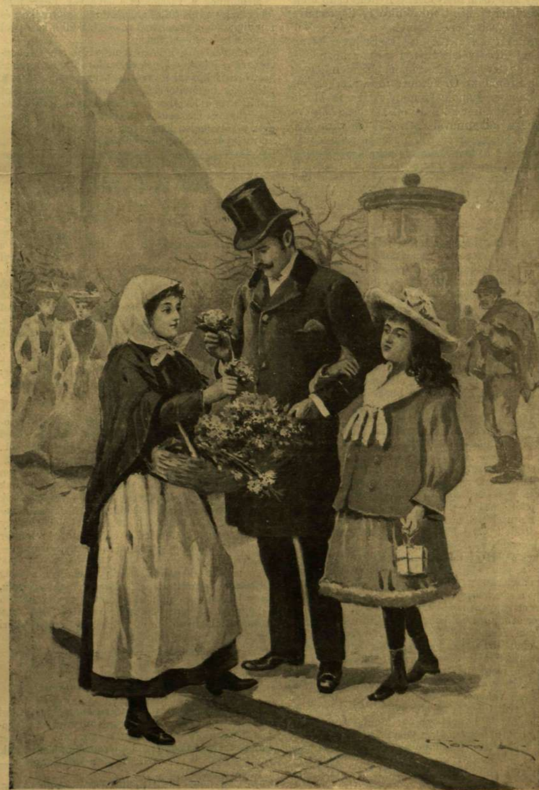
UTCZAI VIRÁGÁRUS LEÁNY TÉLEN.

1873-ban Máramaros vármegye szolgálatába lépett mint aljegyző, 1894-ben főjegyző lett és 1899 óta alispán. Szorgalma, tehetsége, szónoki képessége révén gyorsan emelkedett a közigazgatási tisztségek lépcsőfokain. Igen buzgó munkásságot fejtett ki közegészségügyi téren, sokat fáradozott a Máramaros vármegyei köz-kórház építése érdekében, s a jövő tavasszal építendő vármegyei elmeógyógyintézet létesítésében is ő volt az egyik fő mozgató erő. A kívándorlási ügyekben, vármegyei utak építésében s egyéb közérdekű dolgokban is hasonló erélyvel munkálkodott. Közben mindig foglalkozott