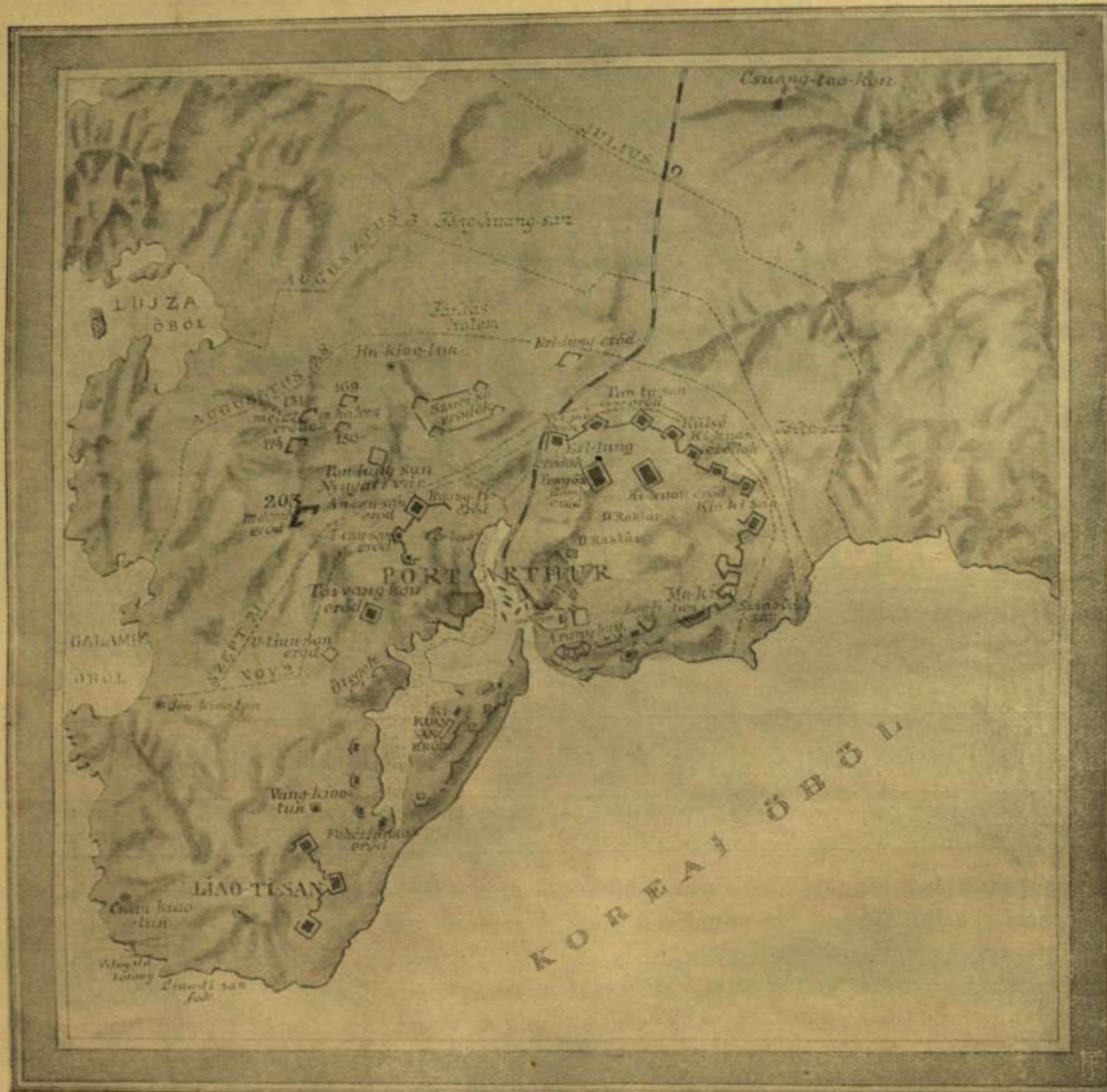
PORT-ARTUR ÉS ERŐDEL. — A japánok ostromlását pontosított vonalak jelzik.

s napról-napra látniok kellett, hogy mint szorult mind szűkebbre és szűkebbre az a kegyetlen gyilkos gyűrű, a mit ostromzárnak neveznek; mint kerül az ellenség kezére egyik halom a másik után.