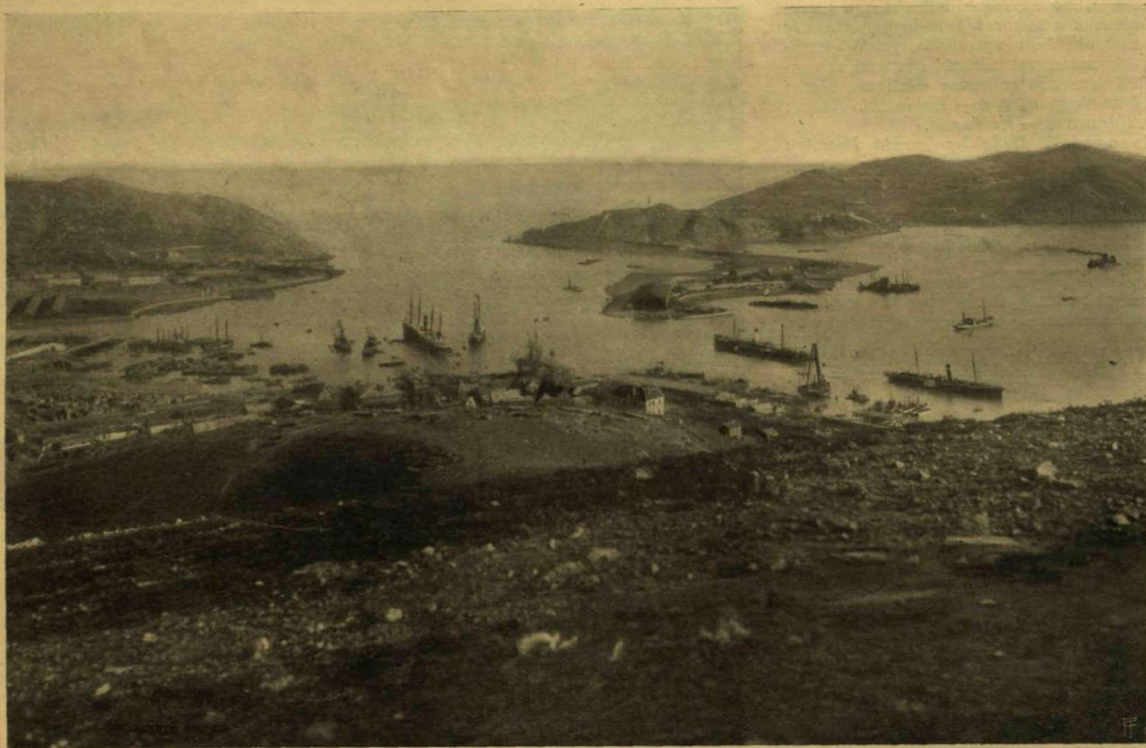
A KIKÖTŐ BEJÁRATA.