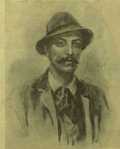
Gyulai Kálmán (+1899).