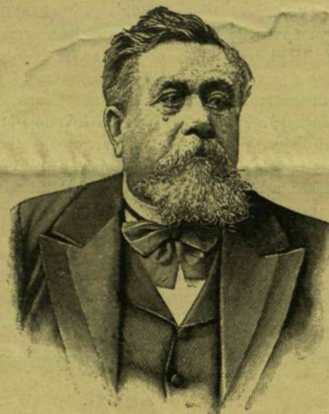
Fallières Armand, a francia köztársaság új elnöke.

Ebben a néhány sorban egy világ van lefestve és ma már — részben legalább el is temetve. A rossz cseléd és a jó barát mint zsúrterma még nem tűnt le végleg a szereplés színpadjáról, de a kizárólagosság jogát már rég elvesztette. És közeledik az idő, mikor nem is az emberszólás lesz a zsúrokon a legkedveltebb — teasütemény. A mi nem a zsúr halálát akarja jövedőlni. A zsúr él és virul már nemcsak a szalonokban, hanem — a kávéházakban is. Ezt elpusztítani nem tudták nemcsak az ellenségei, a kik távol maradtak, de még a barátai sem, a