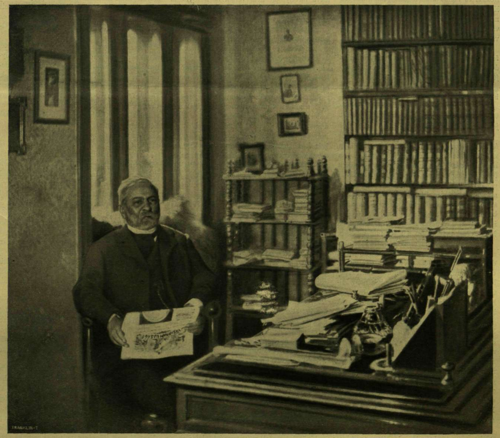
GYULAI PÁL DOLGOZÓ-SZOBÁJÁBAN.

VASÁRNAPI UJSÁG 3. SZ. 1906. (53. ÉVFOLYAM.) SZERKESZTŐ HOITSY PÁL. FŐMUNKATÁRS MIKSZÁTH KÁLMÁN. BUDAPEST, JANUÁR 21. Szerkesztőségi iroda: IV. Reáltanoda-utca 5. Előfizetési feltételek: Egész évre — 16 korona. A „Világkrónika“-val Kalföldi előfizetéseken a postailag meg- Kiadóhivatal: IV. Egyetem-utca 4. Félévre — 8 korona. negyedévenként 80 fillérrel határozott viteldij is csatolandó. Negyedévre — 4 korona. több.