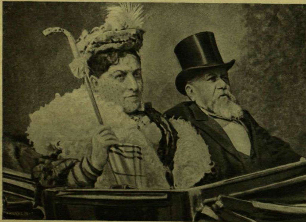
FALLIÈRES ÉS NEJE.

Valóságos hadisáncz volt minden barrikád, s oly kitűnően megcsinálva, hogy ez teszi csak érthetővé a hosszas ellentállást, a melyet a kommunárdok ki bírtak fejteni. Mikor a kormány csapatai már bekerültek Páris falai közé, több mint két hétig tartott még az utcai harc. Minden városrészt, sőt minden utcát külön ostrommal kellett megvenni, pedig ez nem a vér kimelése révén történt. Hiszen fejbe löttek minden kommunárdot, a kit fegyverrel kezében kerítették meg. Május 25-ikén már minden elveszettnek látszott, csak a Chateau d'Eau meg a Bastille tartotta még magát, s az ellenállás szervezője Delescluze elérkezettnek tartotta a végső pillanatot, sétabotjával kezében a barrikád tetejére lépett, hogy agyonlője az ellenség.