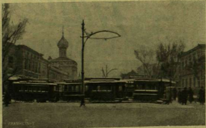
BARRIKÁD VASÚTI KOCSIKBÓL.