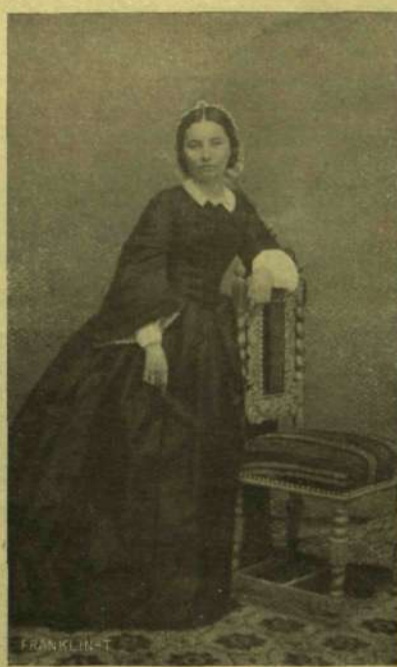
PETŐFINÉ SZENDREY JULIA.

Az ötvenes évek végétől való fényképek után.