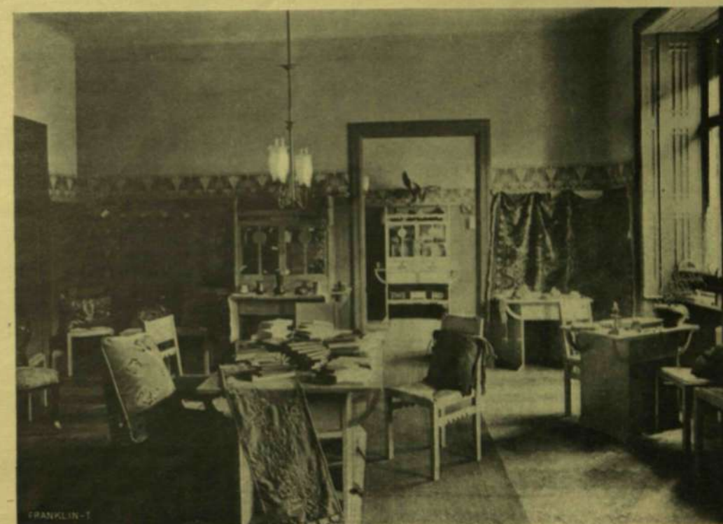
A «MŰVÉSZET ÉS MŰVELŐDÉS»-EGYESÜLET ÁLLANDÓ IPARMŰVÉSZETI KIÁLLÍTÁSÁRÓL.

Erkel Ferencnek, a nagy zeneszerzőnek volt a fia s 1849-ben született. Fiatal korában, mint családjának minden tagja, zenei pályára akart lépni. Megpróbálkozott a színpadon is mint énekes, de nem sok sikerrel. Ezóta teljesen nagynevű apjának szentelte magát, hűséges, gondos titkára lett Erkel Ferencnek, soha nem mozdult mellőle, betegségeiben önfeláldozón ápolta, egyéb foglalkozást nem is