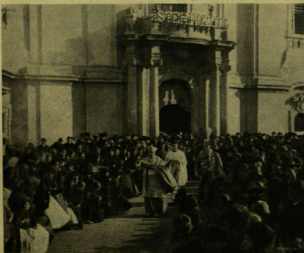
VÁROSY GYULA KALOCSAI ERSEK BEIKTATÁSÁRÓL.

Huszon született 1844-ben. Alapos nevelésben részesült s az egyetem mind a négy fakultását látogatta. Eredetileg tanárnak készült, tanult külföldön Tübingában, Berlinben, Párisban, Londonban, Rómában. Mikor egy kiállott nagyobb betegsége után 1871-ben haza érkezett, letett azon szándékáról, hogy egész életét a philosophiának szentelje. Barátja Törs Kálmán bemutatta Jókainak, a ki neki a «Hon» szerkesztésében adott alkalmazást, a hol a tanügyi rovatot vezette. E mellett szorgalmasan írogatott a «Vasárnapi Ujság»-ba, mely lapnak egy negyed századig (1875—1900) belső munkatársa volt, külföldi ethnografiai, földrajzi, művelődéstörténeti és más ismeretterjesztő cikkeket írván bele; továbbá sokat írt a Szana