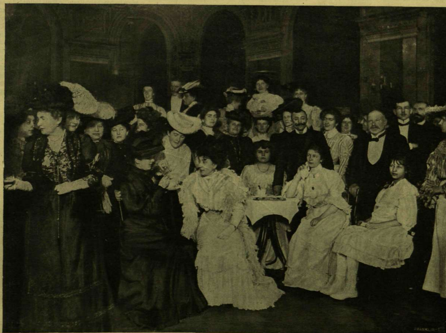
A «MŰVÉSZET ÉS MŰVELŐDÉS» EGYESÜLET ZSÚRJÁRÓL.

tartozik. Akárhogy alakulnak is egy országban a politikai viszonyok, a hatalmat, s vele a meggazdagodás feltételeit azok a pártok foglalják le a magok számára, a melyek elég erősek hozzá. Az «egyiptomi húsos fazekakhoz» nem engednek telepedni idegen elemeket. S Franciaországban a polgárság pártja oly annyira erős, hogy más jelölt, se most, se az előző választások alatt nem csak hogy nem győzhetett, hanem komolyan még csak szóba se jöhetett. Ez magából a helyzetből folyik. Kevésbé világos, hogy az uralmon levő «mérsékelt» párt