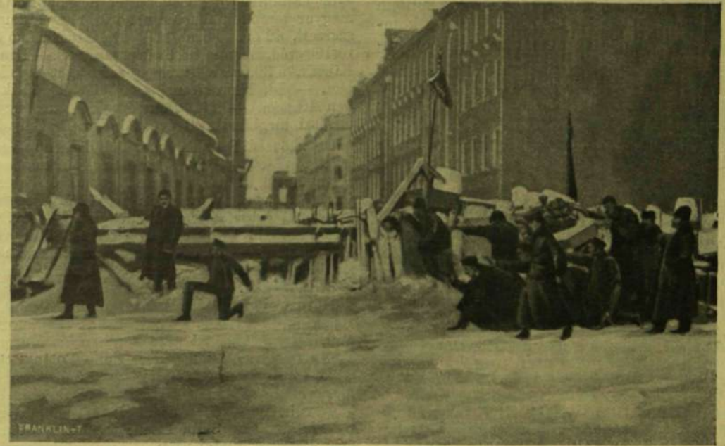
FORRADALMÁROK A BARRIKÁD MÖGÖTT VÁRJÁK A TÁMADÁST.