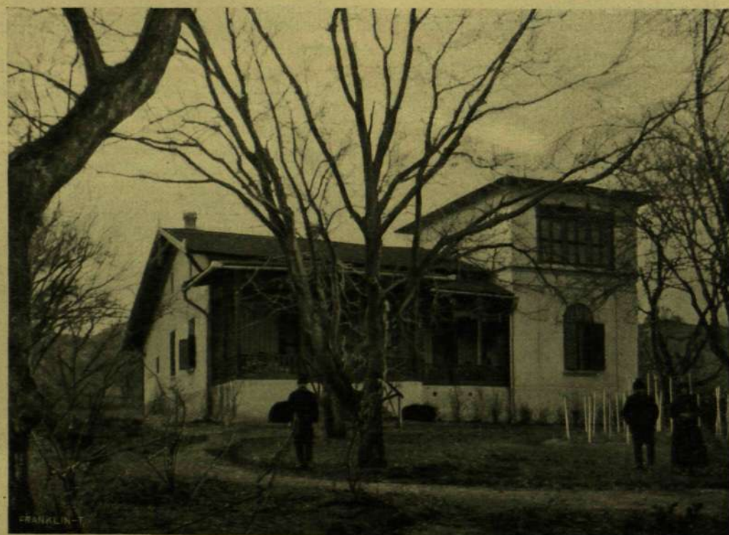
GYULAI PÁL LEÁNYFALVI HÁZA A DUNA FELŐL.

— Nagyon megijesztett, György. . . De hát, Istenem, mikor mi utójára láttuk egymást, — emlékszik-e, ott a prágai kir. színházban, a hol én a drámai szende szerepét játszottam, — egyikünk se gondolta, hogy ilyen nagyot for-