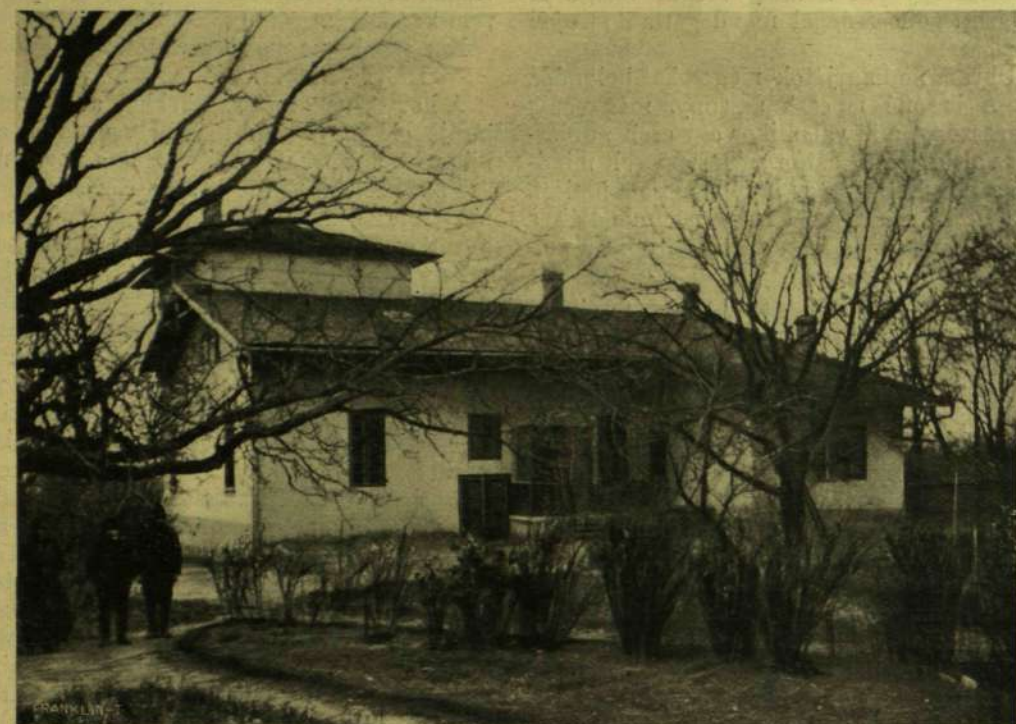
GYULAI PÁL LEÁNYFALVI HÁZA A KERT FELŐL.