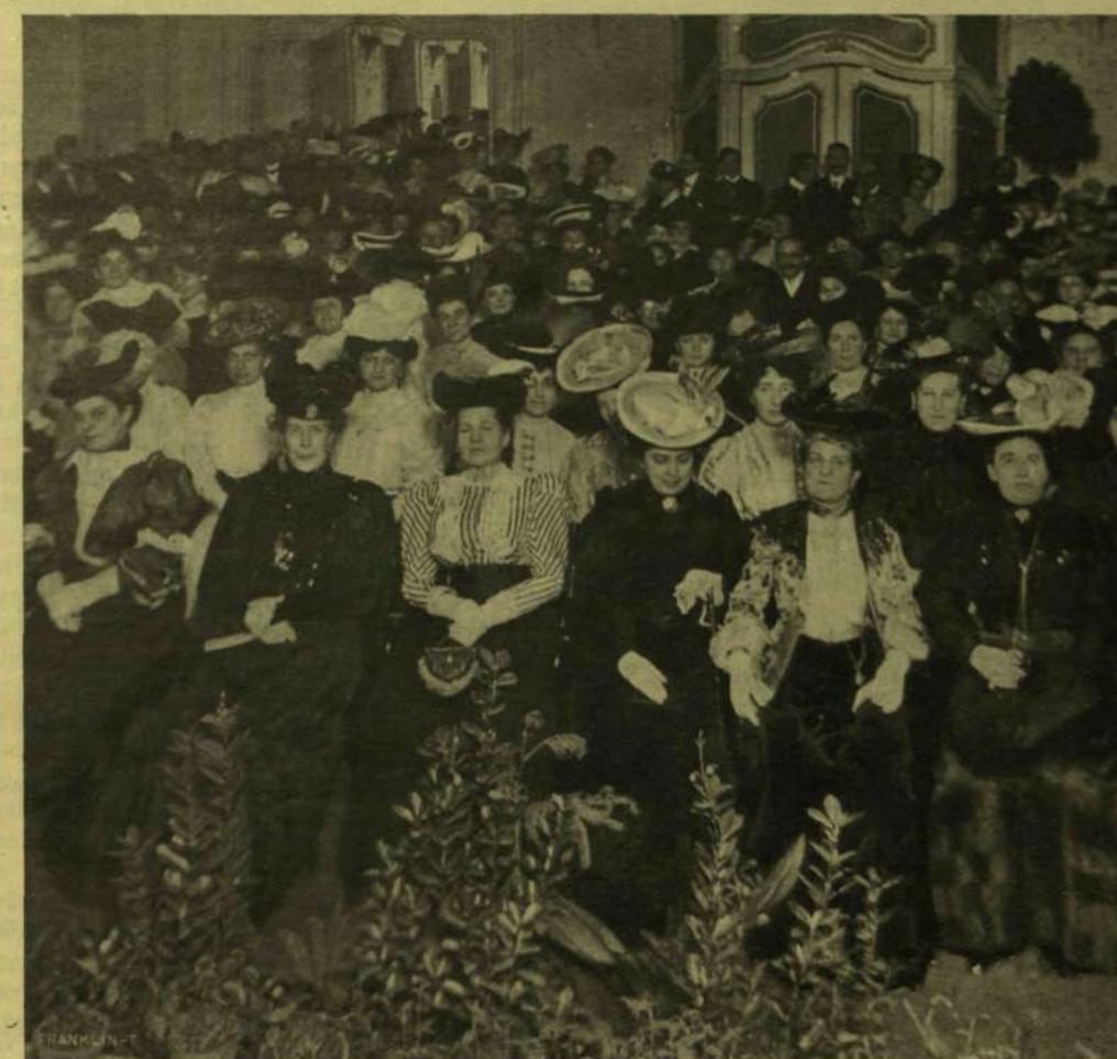
A «MAGYAR NŐK KÖZMIVELŐDÉSI KÖRE»-NEK ZSÚRJÁRÓL.

Az új francia elnök. A francia köztársaság megválasztotta a maga új elnökét, s választása ezuttal is, mint harminczöt esztendő óta mindig, olyan közepes tehetségű férfira esett, a ki az ugynevezett burzsoa osztályhoz, a nagy forradalomban felszínre került harmadik rendhez