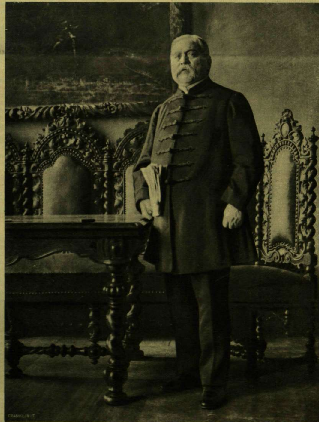
GYULAI PÁL AZ AKADÉMIA TANÁCSTERMÉBEN.

Gyulai munkássága a maga egészében a forradalom utáni irodalom legnagyobb szabású és legjelentékenyebb hatású jelensége közé tartozik. Erkölcsi tartalmában pedig nagy és föl-emelő tanulságokat rejt magában. Mert az ő tolla mindig az igazságnak volt fegyvere, minden vonását jóhiszemű meggyőződés vezette. Ebben szinte a puritán merevségig megy; ki mondja a szót, ha úgy érzi, hogy ki kell mondania, hallgatással sem vét az igazság ellen, de soha oly szót ki nem mond, mely nem meggyőződéséből fakad. Ezért állott be az irodalomhoz és a nagyközönséghez való viszonyában az a különös jelenség, hogy a ki egész férfikorában harcolt a népszerű túlzások ellen, a ki kiméletlen ellenőrzője volt minden léhaságnak, felületességnek, oleszó hatásadászatnak, a ki anynyiakat sebzett meg becsvágjukban, hiúságukban, érdekeikben, a kit annyian s oly hévvel