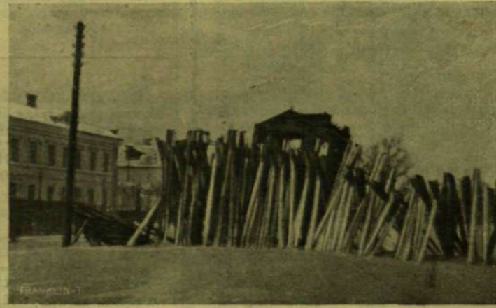
A MOSZKVAI BARRIKÁDOK.