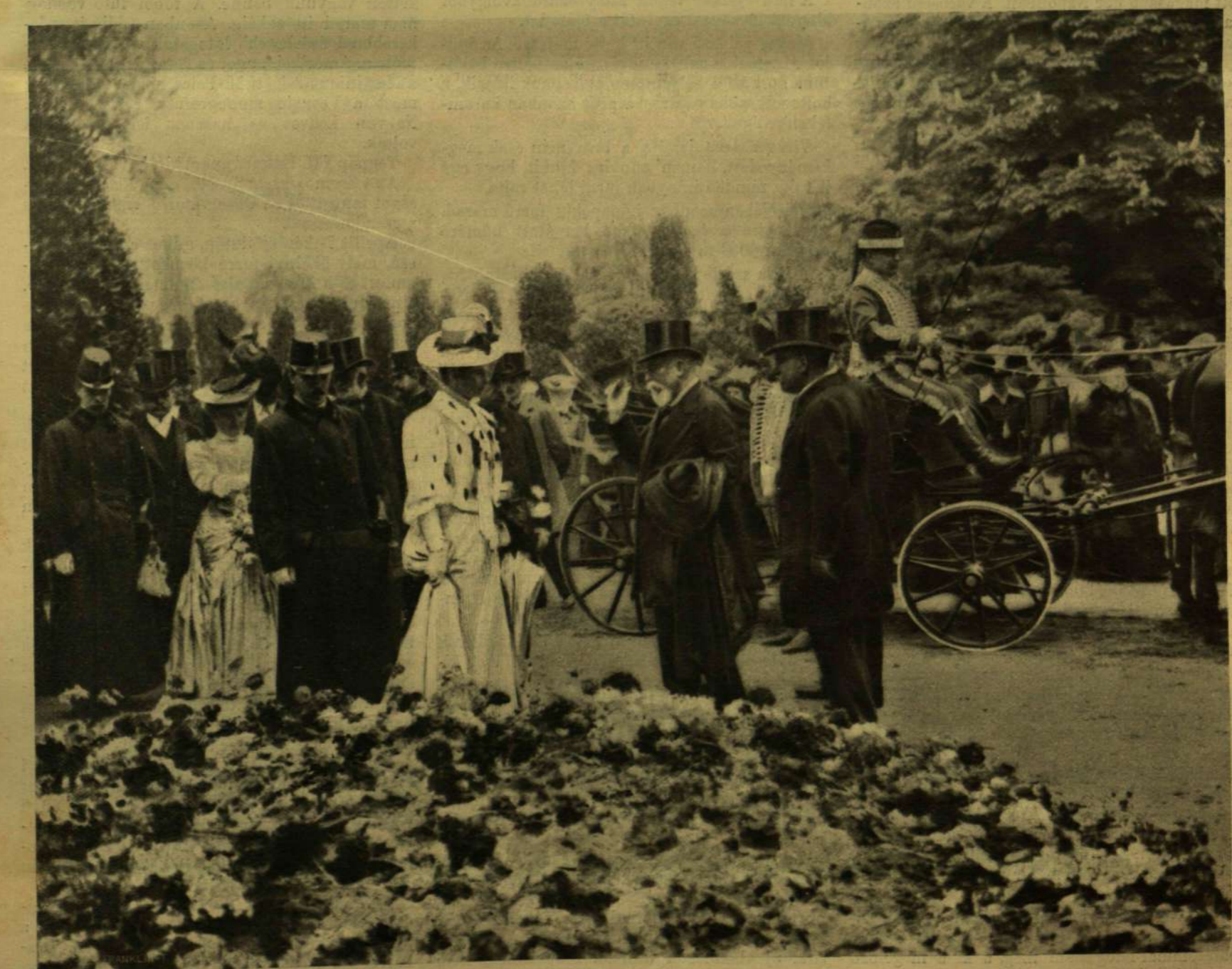
JÓZSEF FŐHERCEG ÉS AUGUSZTA FŐHERCEGNŐ A VIRÁGKIÁLLÍTÁS MEGNYITÁSÁN.

Épen jókor, mert addig olyan felfordulás és rémület uralkodott itt, a Vesuvio is annyira megközelíthetetlen volt, hogy megfigyeléseimben ugyancsak akadályozva lettem volna. Április 25-én Napoli előtt 11 km. távolságban pilantottam meg a hajnali ködön keresztül az öreg Vesuviót. Első tekintetre láttam, hogy nem változtatta meg nagyon 1898-ból előttem ismerős alakját. Ilyen közel Napolihoz alig mutat