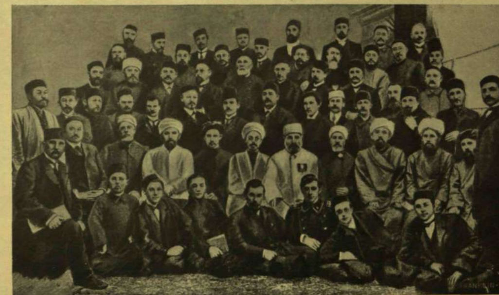
AZ ALKOTMÁNY ÜGYÉBEN: ZENTPÉTERVÁRRA ÖSSZEHOVOTT TATÁR BIZOTTSÁG TAGJAI.

Felkelés után megmosakszik és felöltözik Tolsztoj, aztán dolgozószobájába siet, a hol megreggelizik, sűrűn felbeszakitva étkezését oly gondolatok papírra vetésével, melyek ötlet-szerűen támadnak agyában. Délig még testgyakorlatot, vagy kerti munkát végez szöges dróttal körülkerített óriási gyümölcsösében. Ha az ásás, gyomlálás, nyesegetés már kifárasztotta visszatér pihegni — az íróasztalához. Déli frösztök után és estebed előtt rendszeren messze elszáll, vagy kilovagol kedvence messzeliútjához, a mely wigwám-szerűen van fából összeróva s a honnan messze ellátni a polyánai erdőbe, melyeket a tatárjárás után a palofczok támadásai ellen ültetett volt a szláv lakosság. Esti szürkületkor innen nézi a próféta lelkű nagy álmodozó, a mint a messze távol apránként elnyeli az esthomály; a mint fák, bokrok, kigyózó utak távoli falvak beléolvadnak a szürkés-ségbe s kezdenek megvilágosodni és kigyúlni az ablakok a földön és a csillagok az égen... Hazatérve egy órát alszik Tolsztoj, aztán jó étvágygyal ül az esti ebédhez családja körében, aztán meghallgatja az ügyes-bajos parasztokat, a kik tanácsért, vagy alalmazniért a közeli falvakból, sőt gyakran a messzi távolból is a kastélyba jönnek. Az ebédet nyáron a ház végéhez ragasztott üveges verandán találják és pedig a