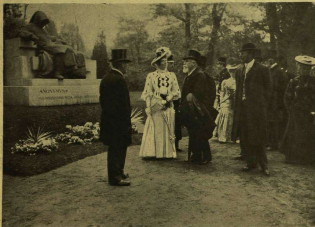
A FŐHERCEGI PÁR MEGTEKINTI A VIRÁGKIÁLLTÁST DARÁNYI MINISZTER KALAUZOLÁSÁVAL.

kozott valami a nagy hamuesőből. De mégis az utolsó előtti állomás perronjáról sepergették a finom port; egy ujnyi vastag lehetett.