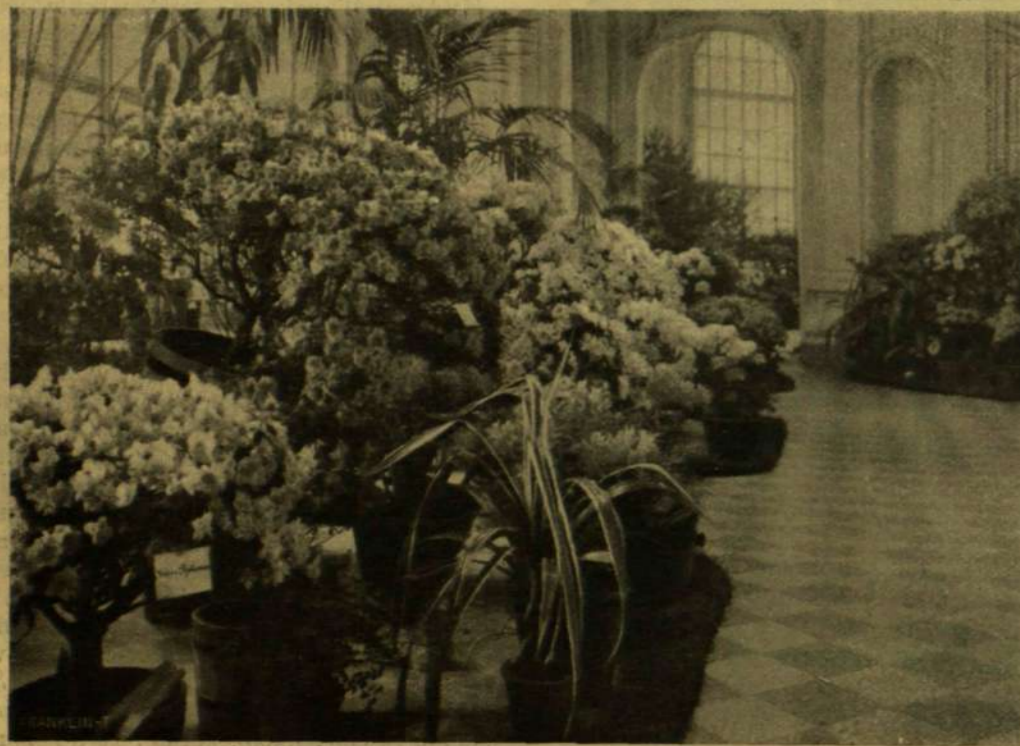
A FŐVÁROS AZALEA- ÉS RHODODENDRON-GYŰJTEMÉNYÉBŐL.