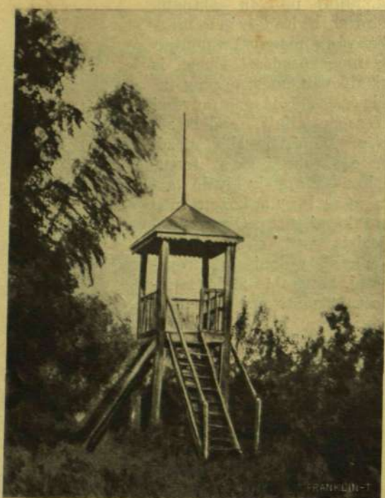
TOLSZTOJ KEDVES MESSZELÁTO-HELYE A JASZNÁJA POLYÁNAI KERTBEN.

Ha a fönti sorok egy általános érvényű szabályt jelentenek, mért volna akkor alóla gróf Tolsztoj Leó, a nagy orosz író kivétel? Mert bármily nagy legyen is, ő mégis csak ember. És legelső sorban: ember! Hányan vannak a „nagyok” közül, a kik ezt a nivót soha el nem érik... Hányan vannak, a kik féltelen hírből állanak, de a tökéletesedés létráján a teljes emberi fokot sem érik el. A nagy Tolsztoj tehát egyáltalán nagy ember is, félruházva az ember minden természetes és jellemző hibáival és ellentmondásaival. És hogy ilyen? De hisz régi igazság az is, hogy az emberen, bármily nemes hajtása is az ő-fának, megérzik a vad-iz, a talajból föl-