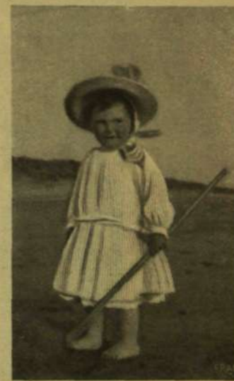
Az olasz királyné jótétele. UMBERTO OLÁSZ TRÓNÖRÖKÖS.