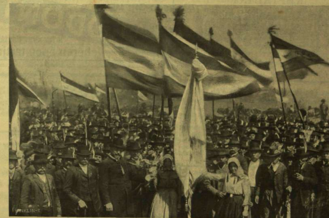
A VÁLASZTÓK ÁTADJAK A FEHÉR ZÁSLÓT.