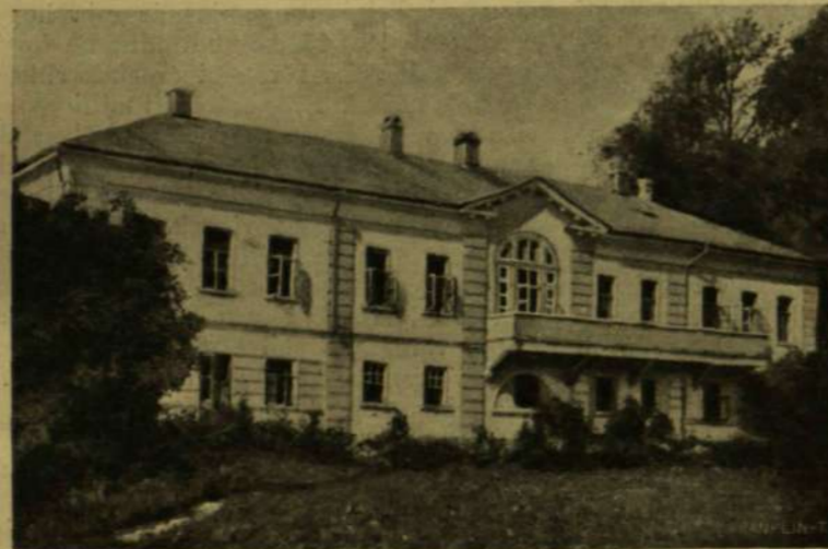
TOLSZTOJ KASTÉLYA JASZNÁJA POLYÁNÁBAN.