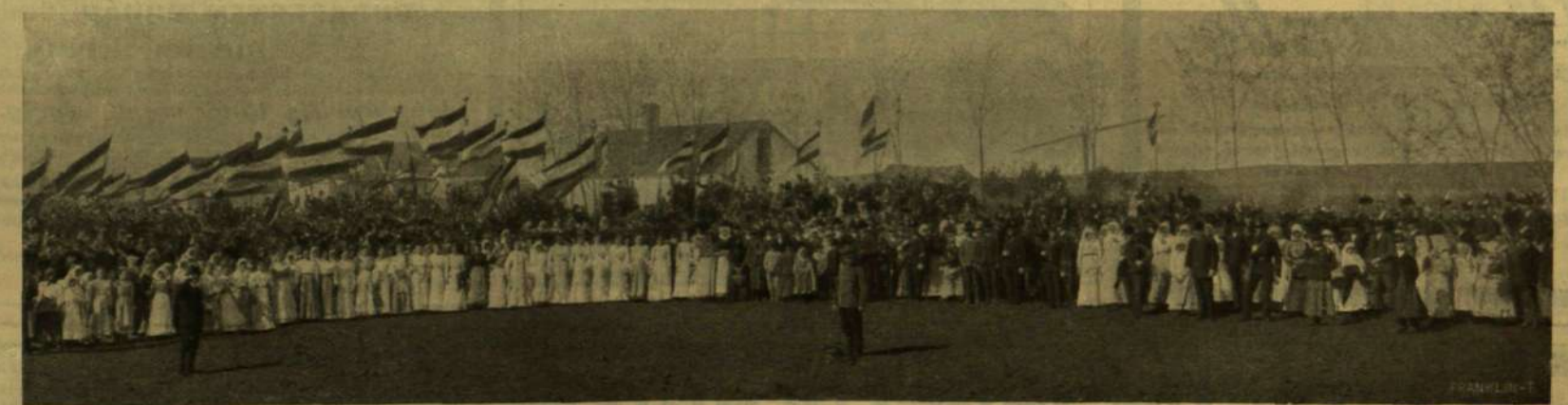
A SZENTMÍHÁLYI NŐK JÖNNEK A VÁLASZTÁSRA.