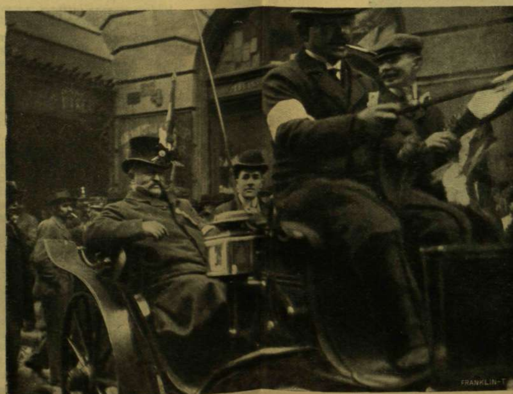
FŐKORTES (BUDAPEST VII. KERÜLET).