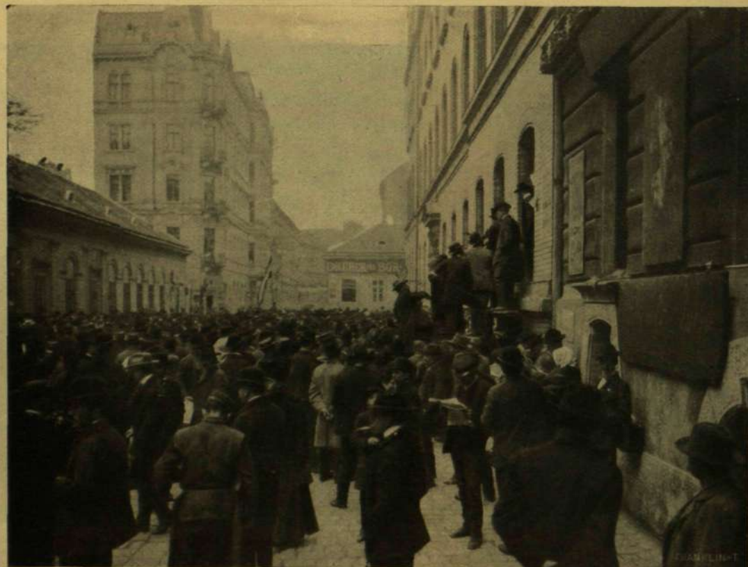
A VÁLASZTÁSI HELYSÉG ELŐTT (BUDAPEST VII. KERÜLET).