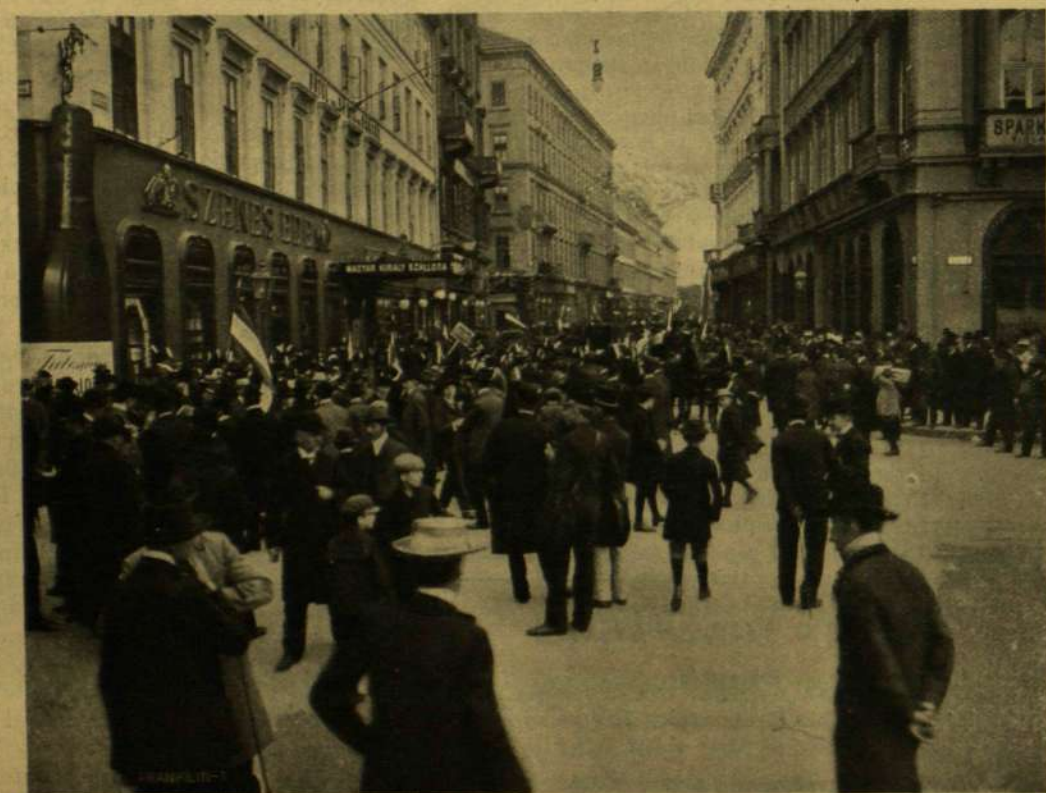
KORTESZTÁNYA A GIZELLA-TÉREN (BUDAPEST V. KERÜLET).