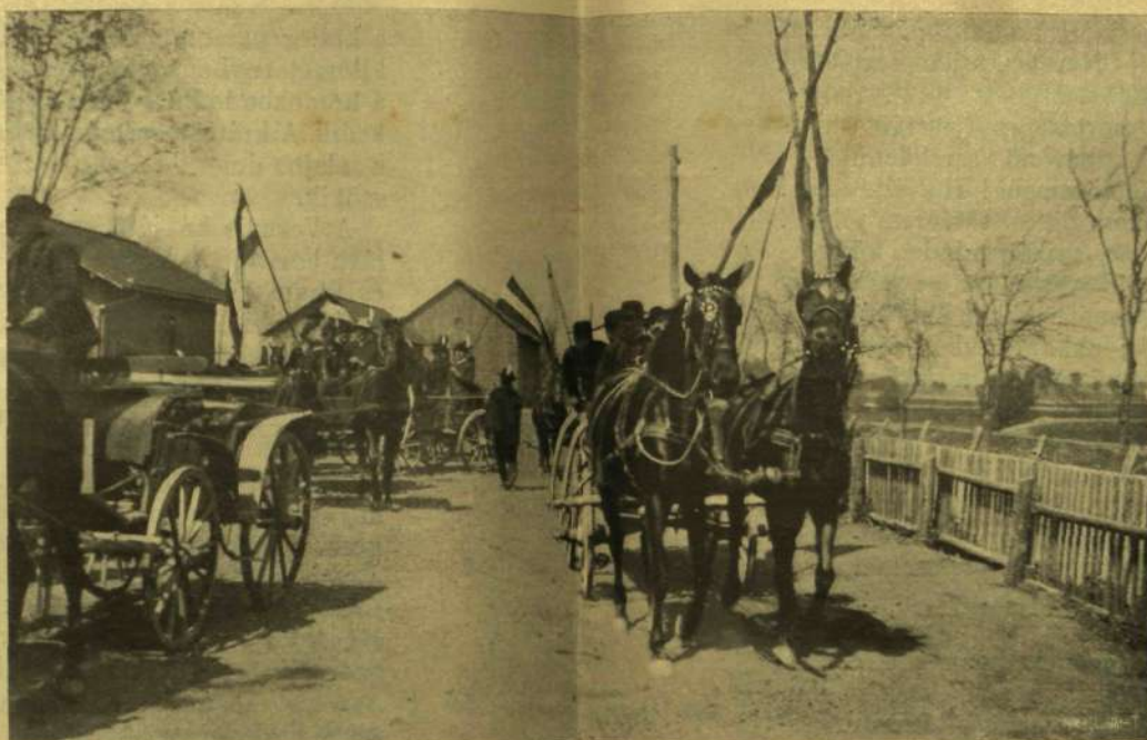
A VÁLASZTÓK ÉRKEZÉSE VASÚTON.