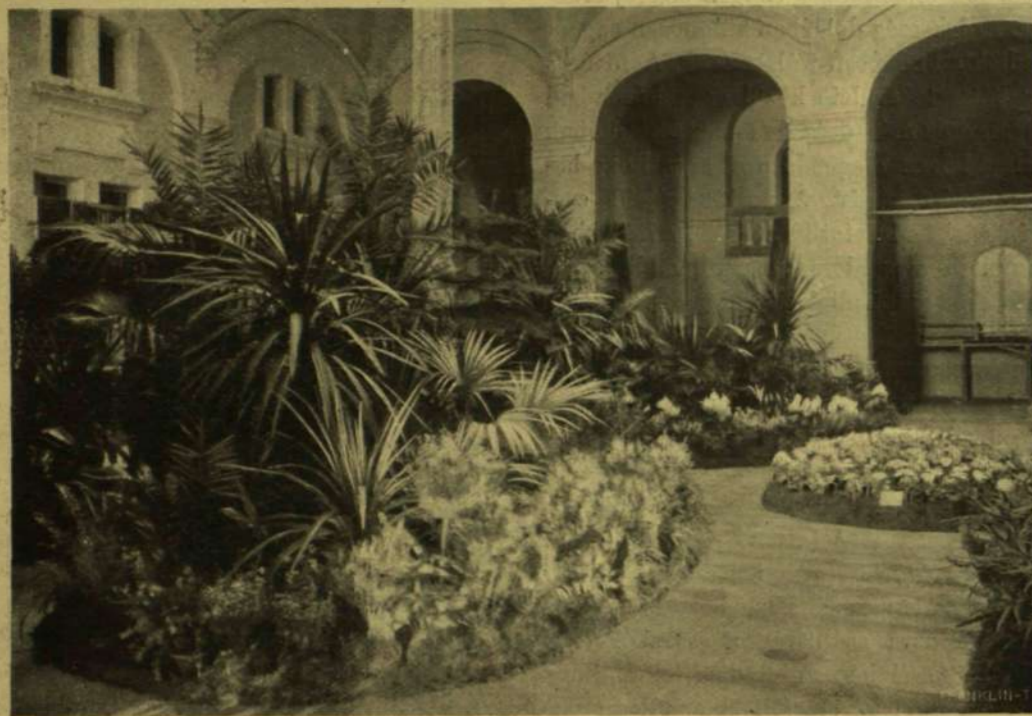
ÜVEGHÁZI NÖVÉNYEK CSOPORTJAI A RENAISSANCE-ÉPÜLET UDVARÁN.