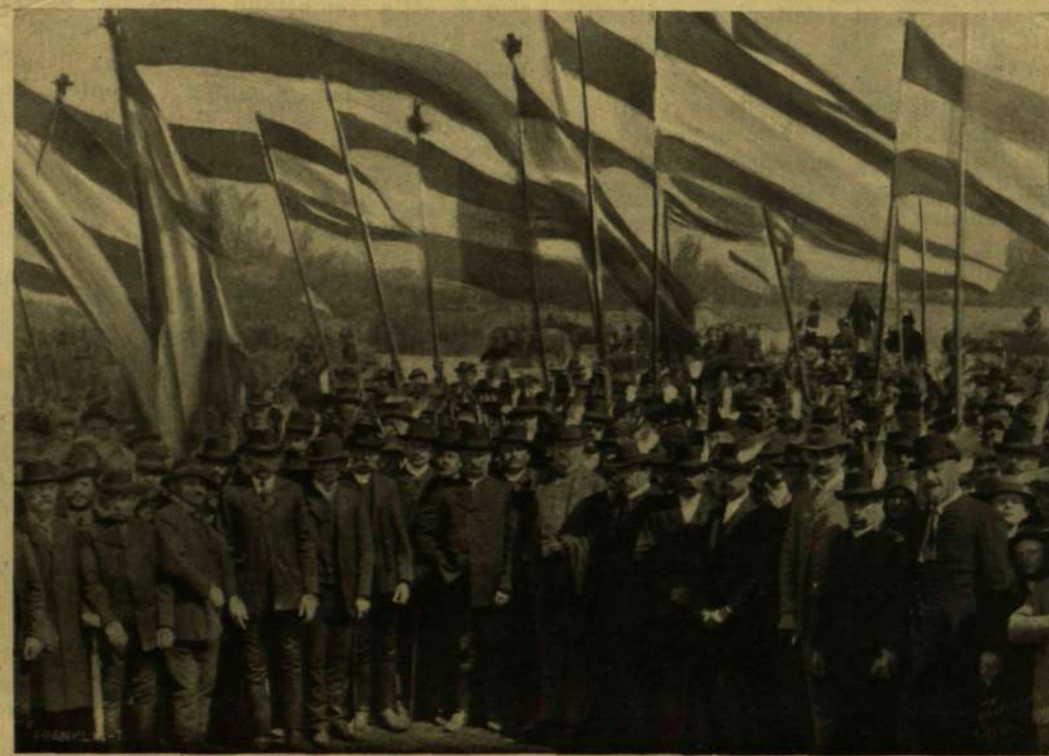
A NEGYVENNYOLCZAS ZÁSLÓK ALATT.

Esteledik, sötétedik a pusztá, Haza indulunk lányok csapatja, Mint az álom, mint a szélő jön velök Messe sűrő búváratos énekek.