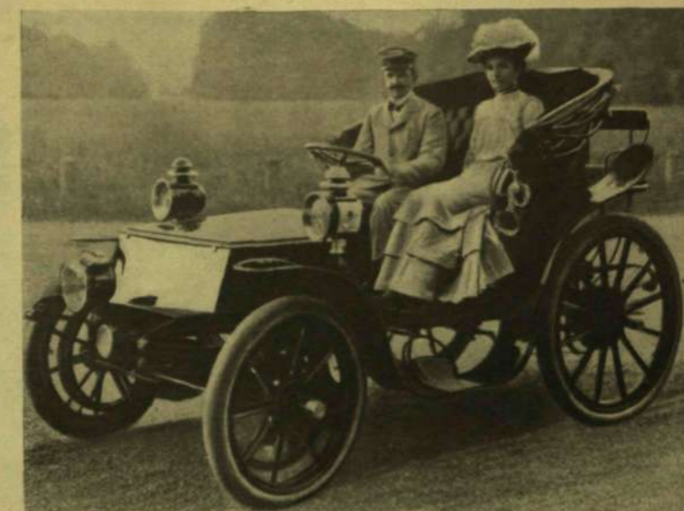
AZ OLÁSZ KIRÁLY ÉS NEJJE AUTOMOBILON.

* Illusztris tudósunk, a budapesti egyetem nagy-hírű tanárának fenti sorai általános érdeklődést fog-nak bizonyítani kelteni, annál is inkább, mert ő az első, a ki e borzalmas katasztrófa hatásának tudományos leírását adja.