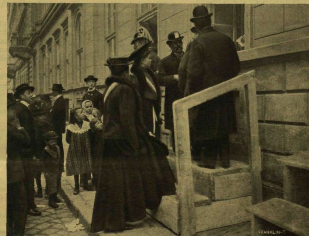
ASSZONY-KORTESEK A PÁRTIRODÁNÁL (BUDAPEST VIII. KERÜLET).