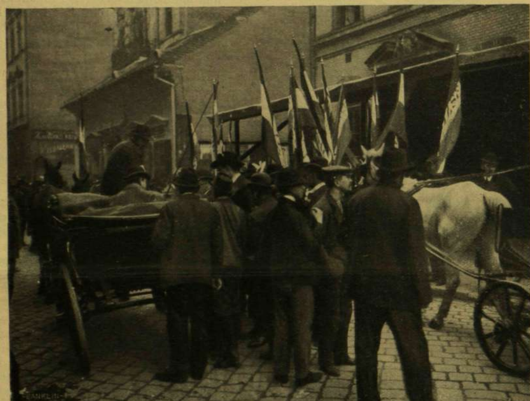
A ZÁSzlÓK KIosztÁSA (BUDAPEST VII. KERÜLET).