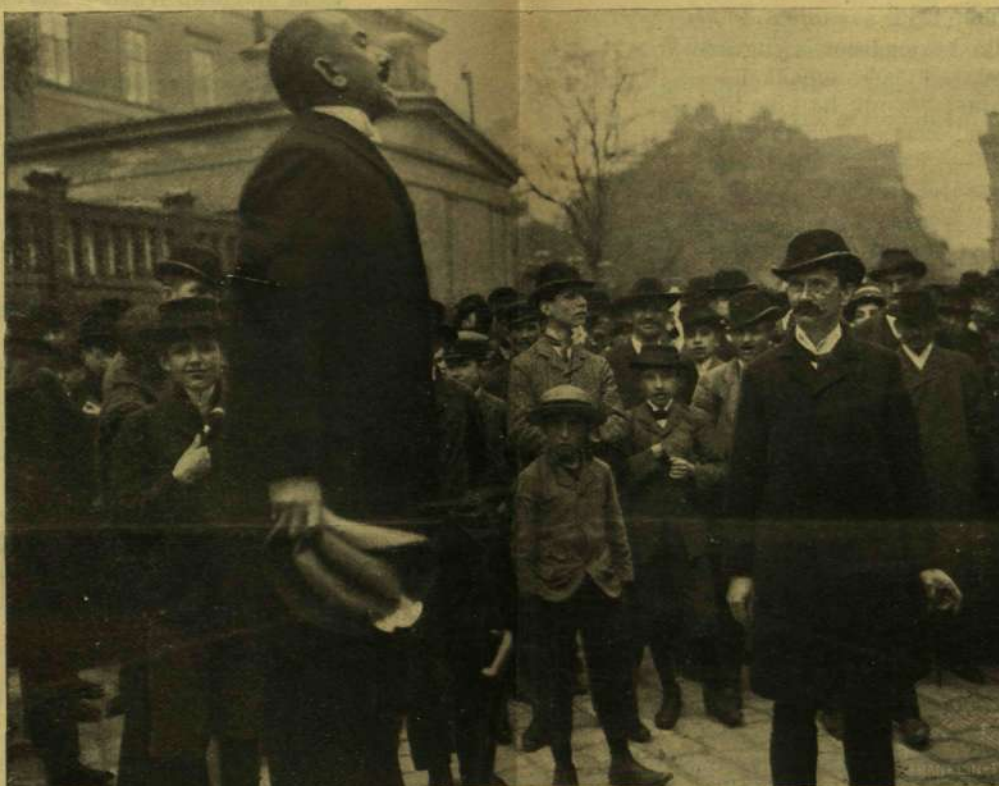
«ÉLJEN A MI SZERETETT KÉPVISELŐJELŐLTÜNK!» (BUDAPEST VIII. KERÜLET).