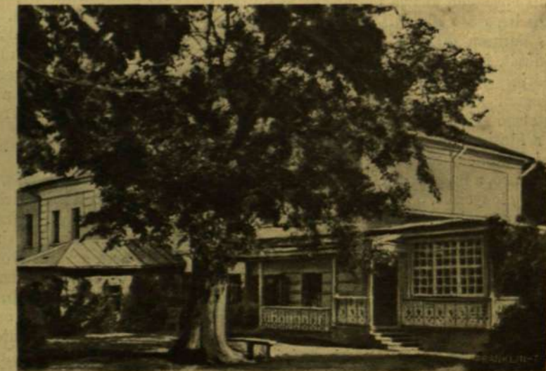
TOLSZTOJ KASTÉLYA A KERT FELŐL.