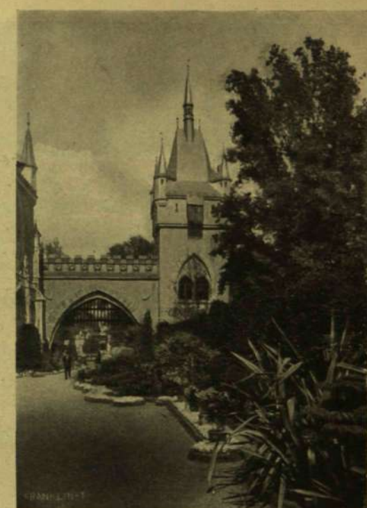
RÉSZLET A VIRÁGKIÁLLÍTÁS KÜLSŐ TERÜLETÉRŐL.

Az Országos Magyar Kertészeti Egyesület fennállásának huszadik évét tavaszi virágkiállítással zárta be. A mezőgazdasági múzeum renaissance-épületében és az előtte elterülő udvarban a székesfőváros kertészetének közreműködésével egy kis paradicsomot varázsoltak elő rövid két nap alatt a budapesti kertészek. A forró és mérsékelt földő legkiválóbb disznóvényei vannak itt összegyűjtve s a szép képnek