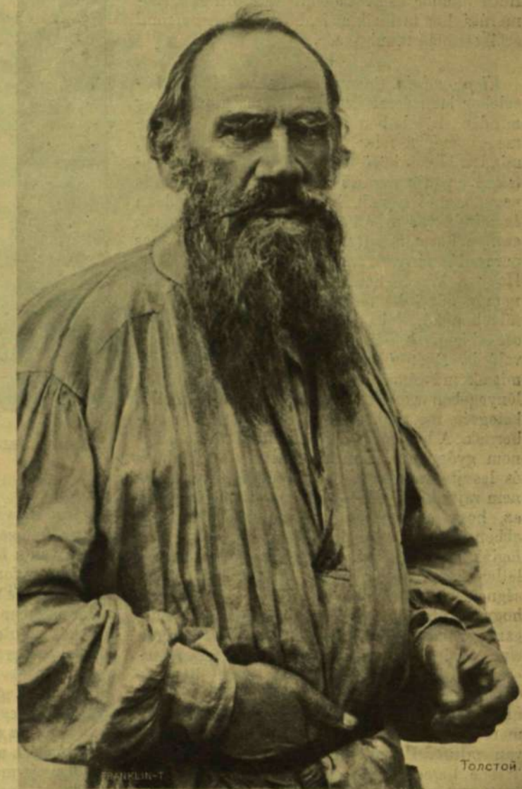
GRÖF TOLSZTOJ LEÓ LEGÚJABB ARCZÉPE.

Egy áldozatról. Egy nagyon szerencsétlen embert temettek el a héten Budapesten. Utólagára temették el, de nem először, sőt nem is másodsor, hanem harmadszor. Eltemették először, a mikor egy rettenetes napon a börtönbe vitték. Akkor a becsülete, a jóhíre és az egzisztenciája halt meg. Utána halt elkeseredett lélekének világossága is. Alig eresztették ki a börtönből, be kellett vinni az örültek házába. Ez volt a második temetése. A harmadik temetése az örültek házából a sírba kísérté. Ennyi halál után már igazán csak a föltámadás következhetik. A boldogtalan embert dr. Róth Sándornak hívták és a szerencsétlenség, a mely elpusztí-