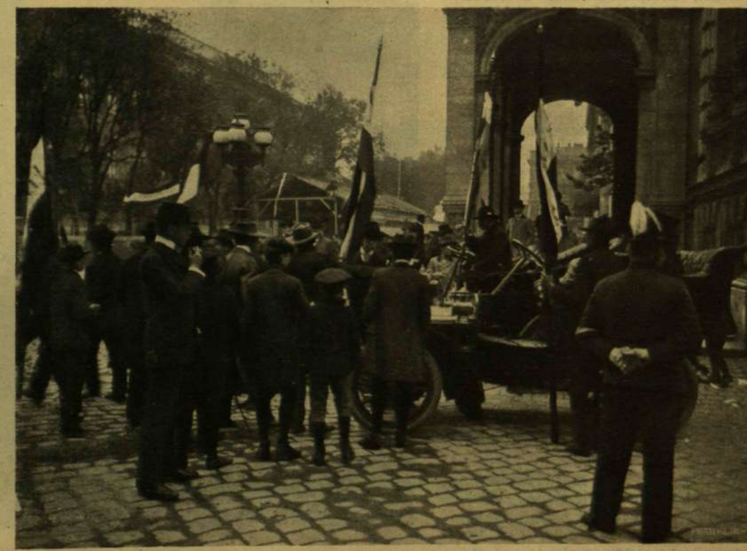
AUTOMOBIL KORTES-SZOLGÁLATBAN (BUDAPEST VIII. KERÜLET).