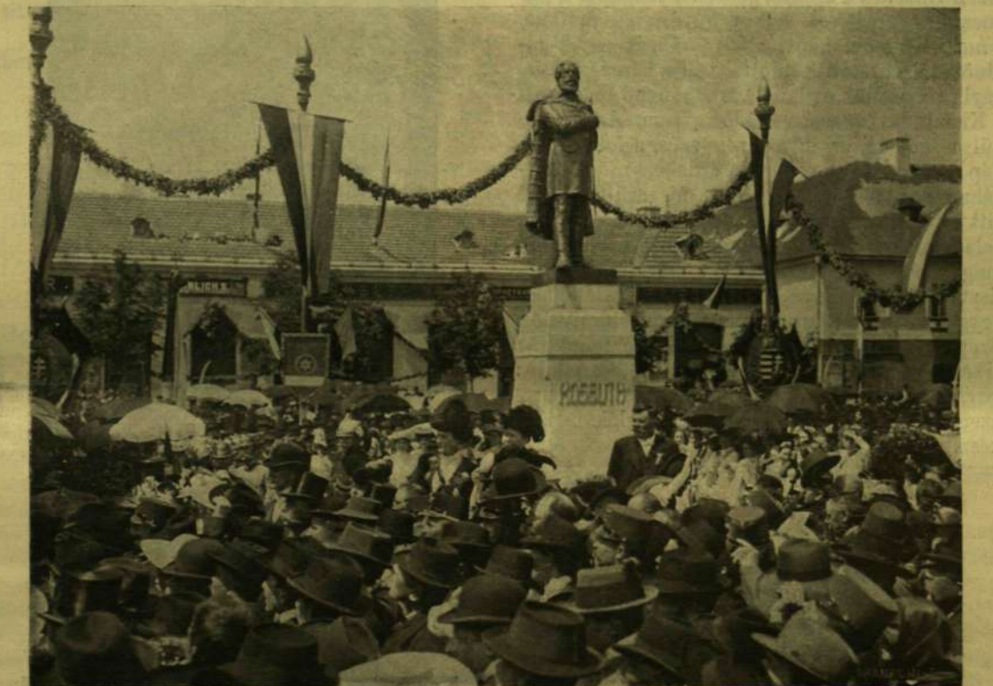
KOSSUTH LAJOS SZOBRÁNAK LELEPLEZÉSE ÉRSEKÜJVÁROTT.

ÉRSEKÜJVÁR nem nagy város, a legtöbb ember alig tud róla többet, mint hogy a budapest-marcheggi vasúti vonal egyik nagy állomása, a hol megáll minden gyorsvonat s a perronon vidám cigányzene fogadja Rákóczi-indulóval az utast. A környék ismerői azonban azt is tudják, hogy gazdaságilag igen fontos hely: a kis magyar Alföldnek, az ország egyik legtermékenyebb s legmagasabban fejlett gazdasági kulturájú vidékének egyik forgalmi központja. A történelemben egyidőben emlékezetes szerepe volt, mint Magyarország politikai és katonai középpontjának a Rákóczi-fölkelés alatt. Itt gyülekeztek a fejedelem hadai, innen intézték mint stratégiai alappól a nagyjelentőségű felvidéki hadjáratokat. Régi híres várát, melynek a törököktől való visszafoglalását (1685) Európaszerte örömmünneppel ünnepelték, III. Károly leromboltatta ugyan s csak egy-két hely-név emlékeztet már rá, — de a nép, és pedig nemcsak a magyar, hanem a tót lakosság is megőrizte a nagy idők hagyományait népdalai-