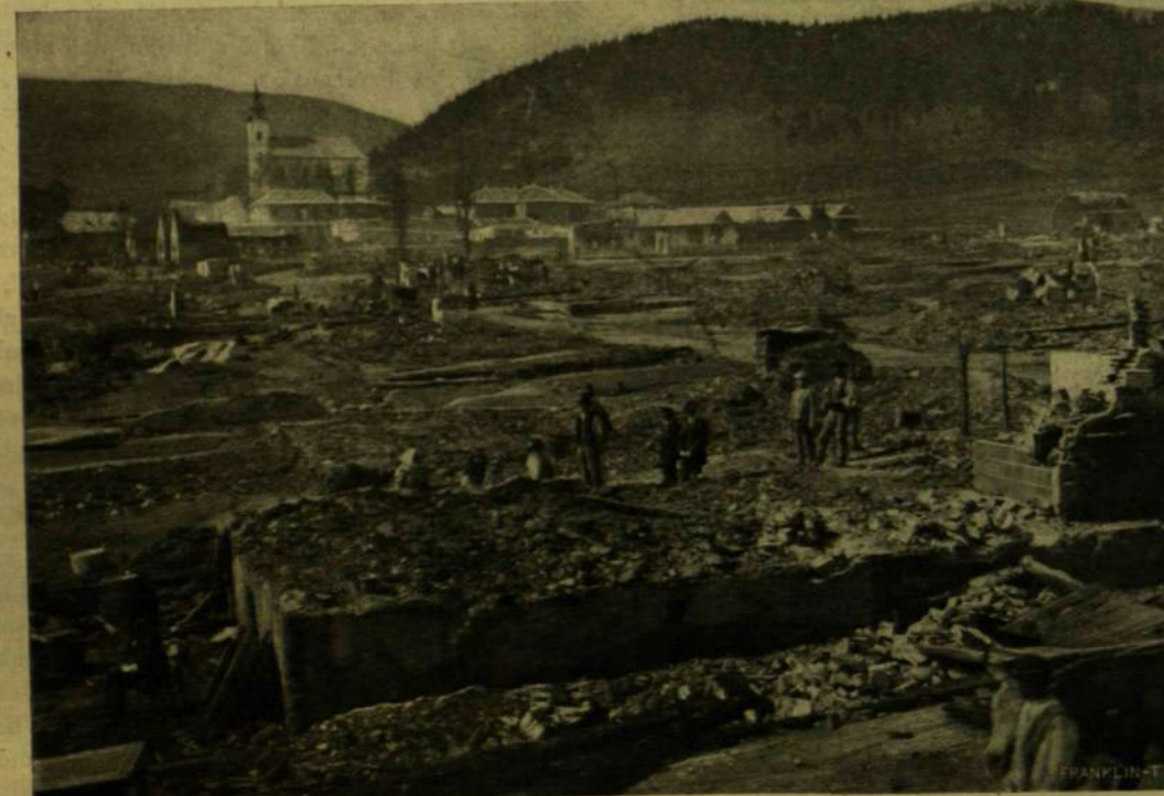
A LEÉGETT FALU, A HÁTTÉRBE AZ ÉPEN MARADT TEMPLOMMAL.