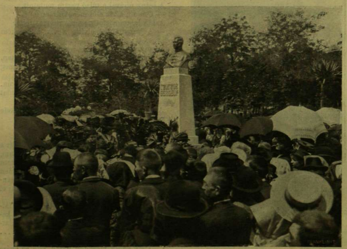
CZUCZOR GERGELY SZOBRÁNAK LELEPLEZÉSE ÉRSEKÜJVÁROTT.

ban. A ma országszerte ismert kurucz-nóták közül több e vidékről került Káldy Gyula gyűjteményébe. Ezeket a hazafias emlékeket ünnepelte meg a város közönsége június 17-ikén lelkes s a helyi érdeken magasan tülelemkedő ünneppel. A régi s a közelmúlt kultusza egyesült ez ünnepen s a politikai történet nagy emlékei iránti kegyelet mellett részt kért belőle az irodalom megbecsülése is. Két szobrot lepleztek le s három emléktáblát. Az egyik szobrot Kossuth Lajosnak állították, kifejezve azt is, hogy a magyar szabadság nagy szónokának és államférfiának tiszteltehez nem kell személyi vonatkozás vagy helyi érdek, egyaránt helyén van ott is, a hol élete pályájának nevezetesebb állomáshelyei voltak, s ott is, a hol csak szelleme és munkájának korszakos nagy eredménye terjesztett áldást. A másik szobor Czuczor Gergely , a költő arczvonásait örökíti meg érzeben. Czuczor a környékről, a nyitramegyei Andódról származott s ott élte gyermekéveit, ott nyerte azokat a benyomásokat, melyeket később úttörő jelentőségű népies verseiben alakított művészi formába. Mint költő és mint hazafi egyaránt