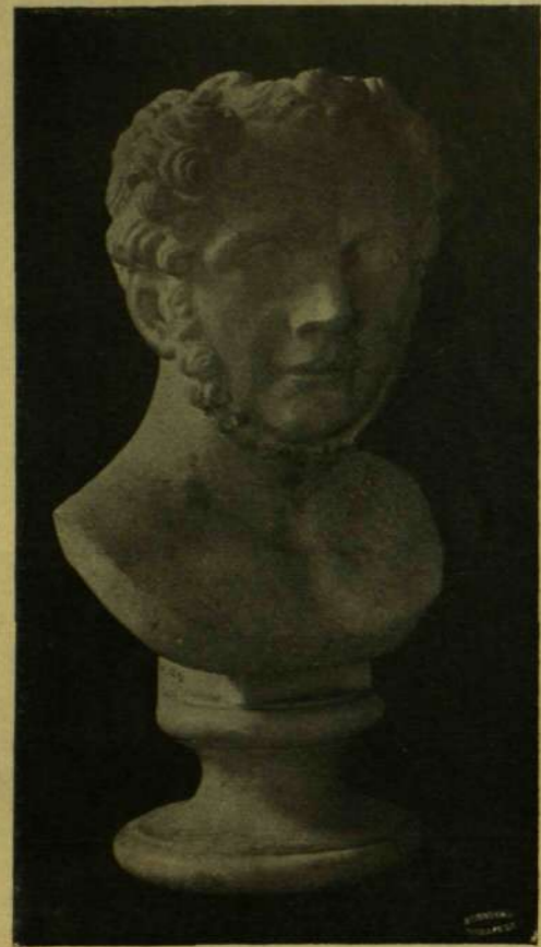
FERENCZY ISTVÁN ÖNARCZKÉPE.

millióit. Nyilvánvaló, hogy az óriási tömeg számára, mely híján van mindenek, a mit a lét követel, a legelső föltétel életének föntartása. Valamennyi magasabb követelésre később jön csak a sor.