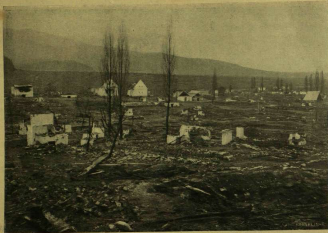
A LEÉGETT FALU EGY RÉSZÉ.

hogyan letagadják róla a költői értéket. Végre is a költészet nem csak azok számára való, a kik már nem fiatalok, vagy sohasem voltak azok. A kötet mélyebb járatú darabjai közül itt adjuk a Borus szerelm címűnek második részét, melyben az aszszony felel a férfinak, ki őt szerelemre hívja: