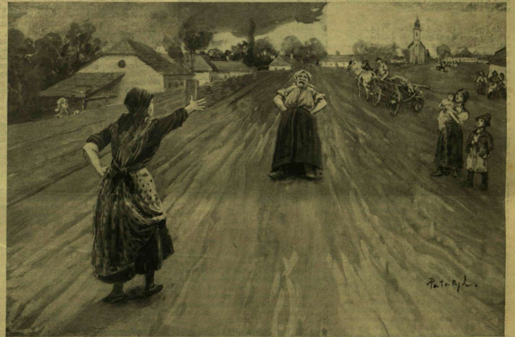
JÓ SZOMSZÉDOK. — Pataky László rajza.

Rang és mód. Népszerűbb államfő alig van a földkerekségen, mint a Torkkó, a komoly nevén Roosevelt Tivadar, az amerikai Egyesült Államok eszes és temperamentumos elnöke. A honfitársai valóságilag rajonganak érte és a hol megjelenik, ünneplik, mint egy primadonnát. És ez a körülrajongott, mindig ünneplést ember a héten magához hivatott egy csomó újságíró és keserve-sen kipanaszkodta magát nekik. A panaszából