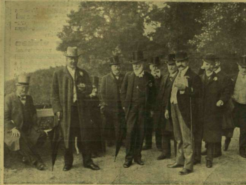
AZ ANGOL VENDÉGEK A MARGITSZIGETEN.