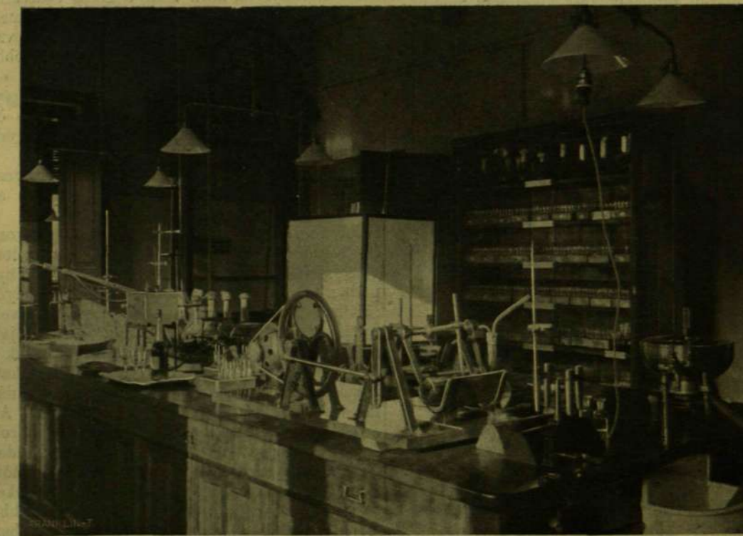
LABORATORIUM A MESTERSÉGES HAJÓVAL.

Aszakadatlan népességi beözönlés az Egyesült-Államokba a XVIII. és XIX. században, kiterjedése és jelentősége tekintetében csakis a népvándorlással hasonlítható össze. Elkerülhetlen, hogy ezen vándorlások néha kárára ne váljanak az illető országoknak vagy egyeseknek. De lehetetlen békóba verni az emberi akarat szabadságát. És ki a megmondhatója, nem magasabb törvény kifolyása-e, nem a mindenek fölött uralkodó gondviselés kezeműve nyilván