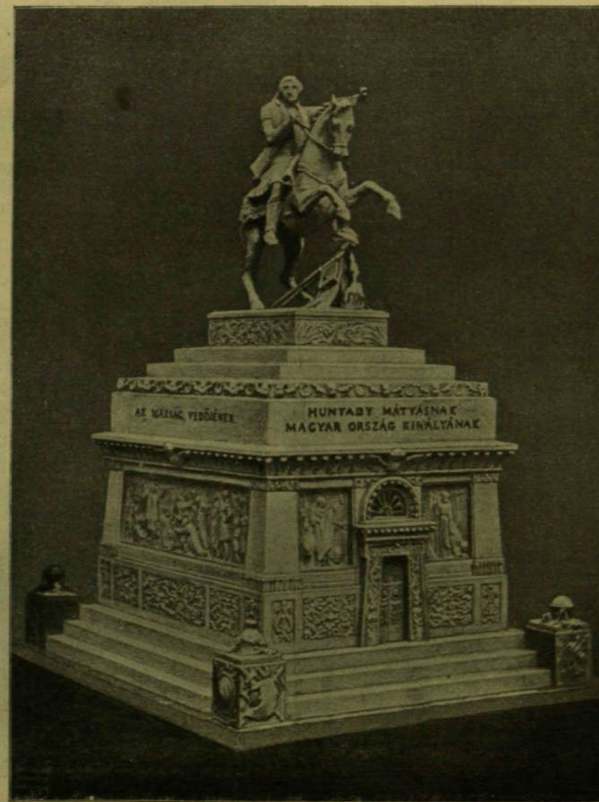
A MÁTYÁS-EMLEK UTOLSÓ GIPSZMINTÁJA FERENCZY ISTVÁNTÓL.