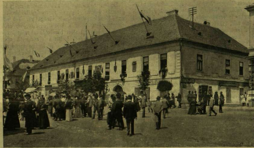
A RÉGI BÁRÓCZY-KASTÉLY ÉRSEKÚJVÁROTT, MELYEET EMLÉKTÁBLÁVAL JELELTÉK MEG.

Elsősorban egy nagyarányú Hunyadi Mátyás-émlék állításának tervét vetették föl. Ferenczy