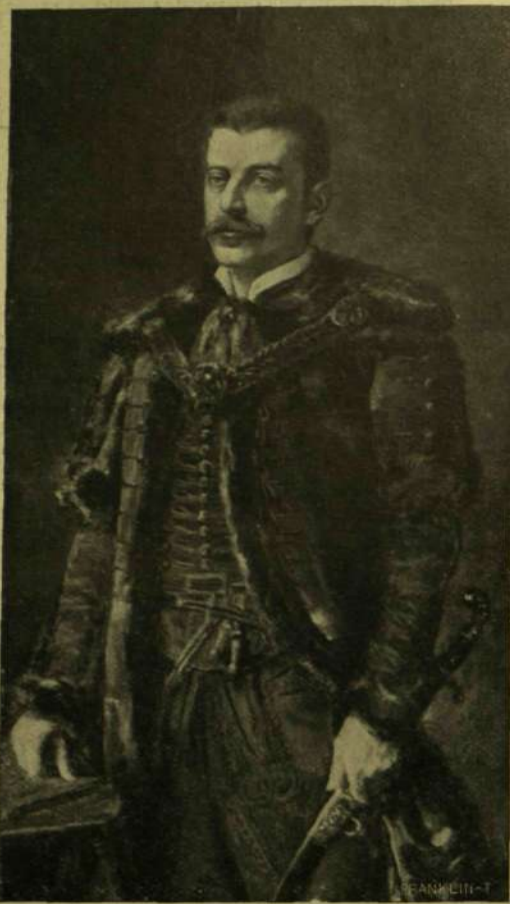
Horváth Andor festménye a Magyar Tanítók Otthonában.

A magyar főváros életében jelentős fordulat a most lezajlott polgármester-választás. Egy fiatal erőt ültetett a polgártársak bizalma a polgármesteri székbe, olyan erőt, a ki szinte példátlanul rövid idő alatt küzdötte ki magának az érvényesülést, nem támaszkodva másra, mint önmagára, a saját munkája eredményeire. Bárczy István még csak ezután fogja betölteni negyvenedik évét s máris olyan nagyhatású s kezdeményezéseiben hosszú jövőnek irányt mutató tevékenységre tekinthet vissza, a milyenre kevés a példa a városi közigazgatás szűkebb és ezerféle nyugókkal beníto gépezetében. Látuk azokon a helyeken, melyeket eddig elfoglalt, hogy fogékony, friss szellem, nem riad vissza bátrabb vállalkozástól sem, igen erős érzéke van a gyakorlati élet, a modern eszmék iránt, van erélye terveit végrehajtani, szerzett tekintélyét és népszerűségét az ügy érdekében tudja kamatoztatni s érti az emberekkel bánás nehézségét, a vezető állásban nélkülözhetetlen műve-