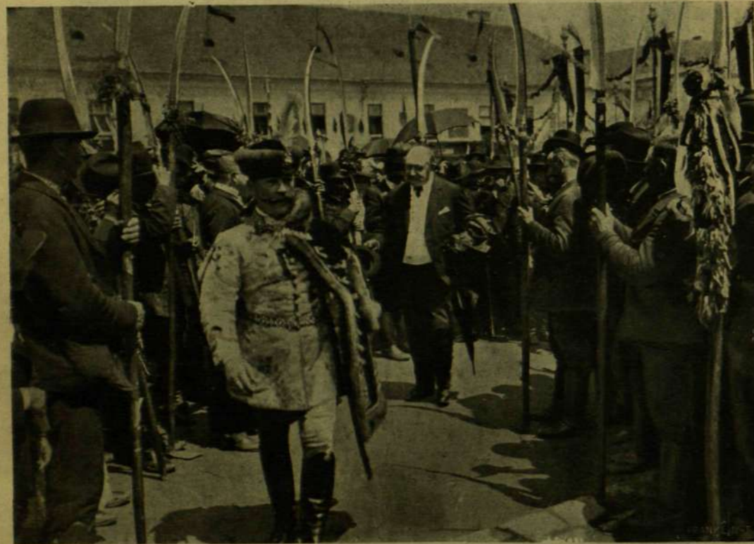
KOSSUTH FERENCZ A KASZÁS LEGÉNYEK KÖZT.