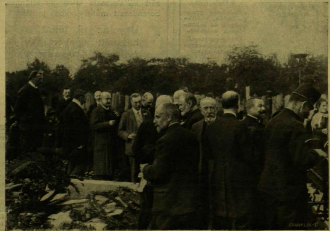
AZ ANGOL VENDÉGEK MEGKOSZORUZZÁK KOSSUTH LAJOS SÍRÁT.

Egykor és most. Volt néked, stb. Bizonyos elnésség akad bennük, bár ez is kissé útszerű; ahhoz a szalon-genrehoz, a melyvel próbálkozik, finomabb elnésség, intimebb rajz és több hangulat kell.