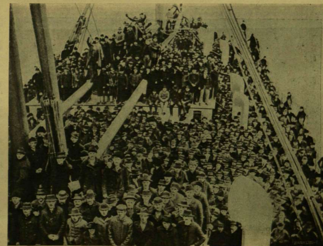
KIVÁNDORLÓK A «PANNONIA» FÉDELZETÉN.

Hirtelen, mintha varázslat lett volna, láthatókká váltak az óriás város körvonalai: épületek, felfüggve valahol az égen, a felhőket áthidaló hidak, a szabadság kolosszális szobrának fenséges feje, mely üdvözli az ujonnan érkező