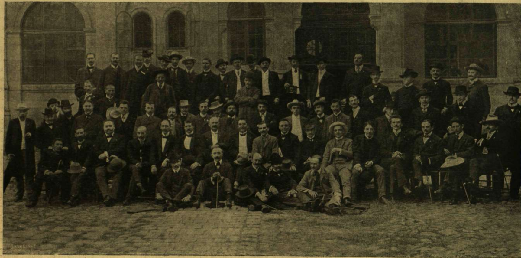
VIDÉKI HIRLAPIRÓK A LEGUTÓBBI ARADI KONGRESSZUSON.

Az első nap sikeresen vadásztunk az új tanyáról. Vagy tizenegy óra hosszat jártunk s negyven mérföldet lovagoltunk. Közben megöltük a botorkáltunk a hóban, míg aztán sok keresés után ráakadtunk egy anyamedve s egy éves bocsra friss nyomaira. Rászabadítottuk az ebeket a nyomra. Nagy vidám ugatással indultak neki. Mi ezalatt megigazitottuk nyergeinket s készülődtünk az eljövendőkre. Teljesen lehetetlen volt a kutyák nyomában lovagolni, de megtettünk minden lehetőt, hogy legalább az ugatásuk zaját el ne veszítsük. Végre kemény küzdelem után hallottuk, hogy a kutyák megálltak s úgy ugattak egy nagy facsoport körül magasan fenn a hegyoldalon. Gyalog kellett fölmennünk, mert a ló nem birt járni a nagy hóban. A bocs egy magas fa tetején volt. Lambert lelötte s aztán tovább siettünk az anyja után. A fiatalabb kutyák nem tudták, mire vélik a dolgot, hiszen már megöltük a medvét, — de a veteránok hangos csaholással iramodtak tovább. Fölkapaszkodtunk utánuk a meredek hegyen, aztán lefelé a szakadékok és sziklák között, a havon át, a míg leértünk a völgybe.