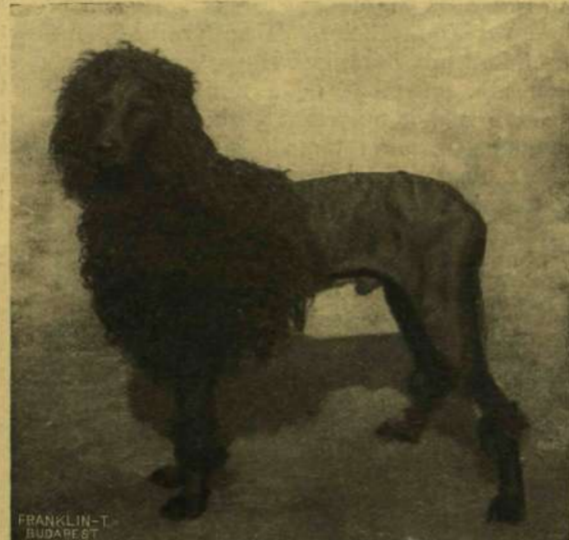
ELSŐ DÍJAL KITÜNTETETT BERNÁTHEGYI, TÖRPE USZKÁR ÉS USZKÁR.