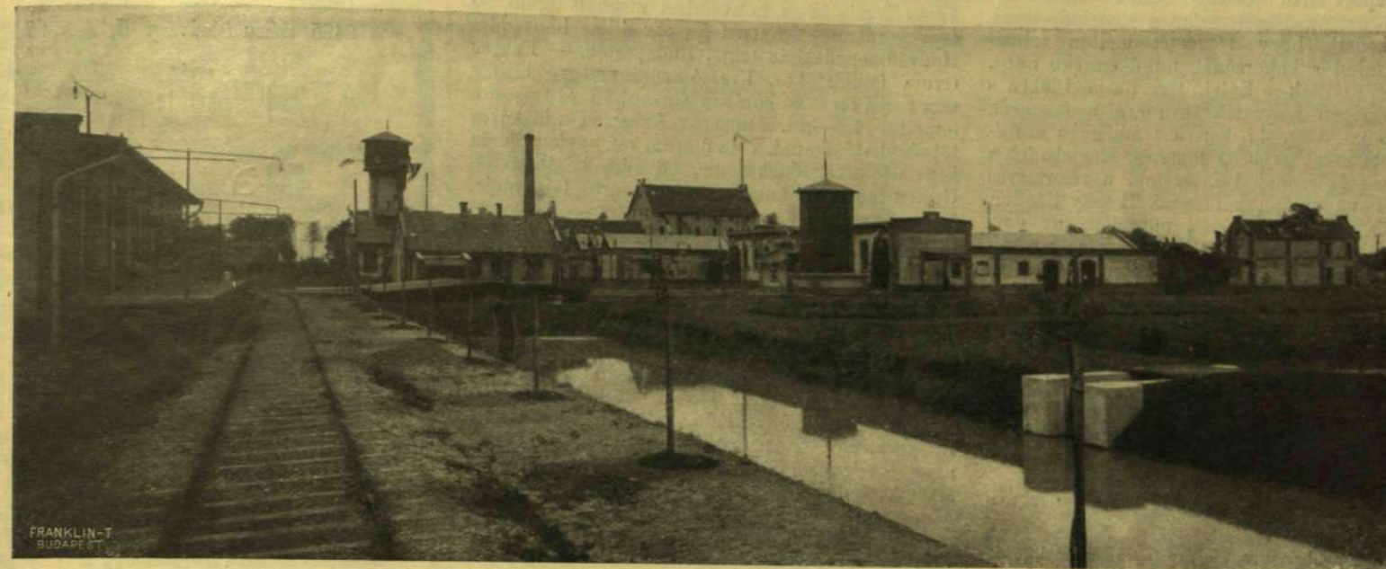
A SÁRVÁRI CHARDONETT-FÉLE MŰHELYGYÁR.

Washington szobra Budapesten. A clevelandi Kossuth-szobor iránt nyilvánult tisztelet viszonzásul az amerikai magyarok Washingtonnak állítanak szobrot Budapesten. A nagy amerikai polgár szobrának gipszmintáját Bezerédi Gyula szobrász elvitte New-Yorkba, a hol a bizottság meglegezővel fogadta el érzebeöntésre. A szoborra magyarul és angolul ezt a mondatot írják: «Washington György emlékének állította az amerikai magyarság 1906.» A szobor 6000 dollárba kerül, s lepezésének napját a bizottság 1906. évi szeptember tizenötödikére tűzte ki. A bizottság pályázatot hirdet egy alkalmi ódára. A pályadíj ezer korona. A pályamunka benyújtásának határideje 1906 május elseje. A pályázaton részt vehet minden magyar író. A pályamunkát Clevelandba, a Budapesti Washington Szobor-Bizottság címzetre kell küldeni.