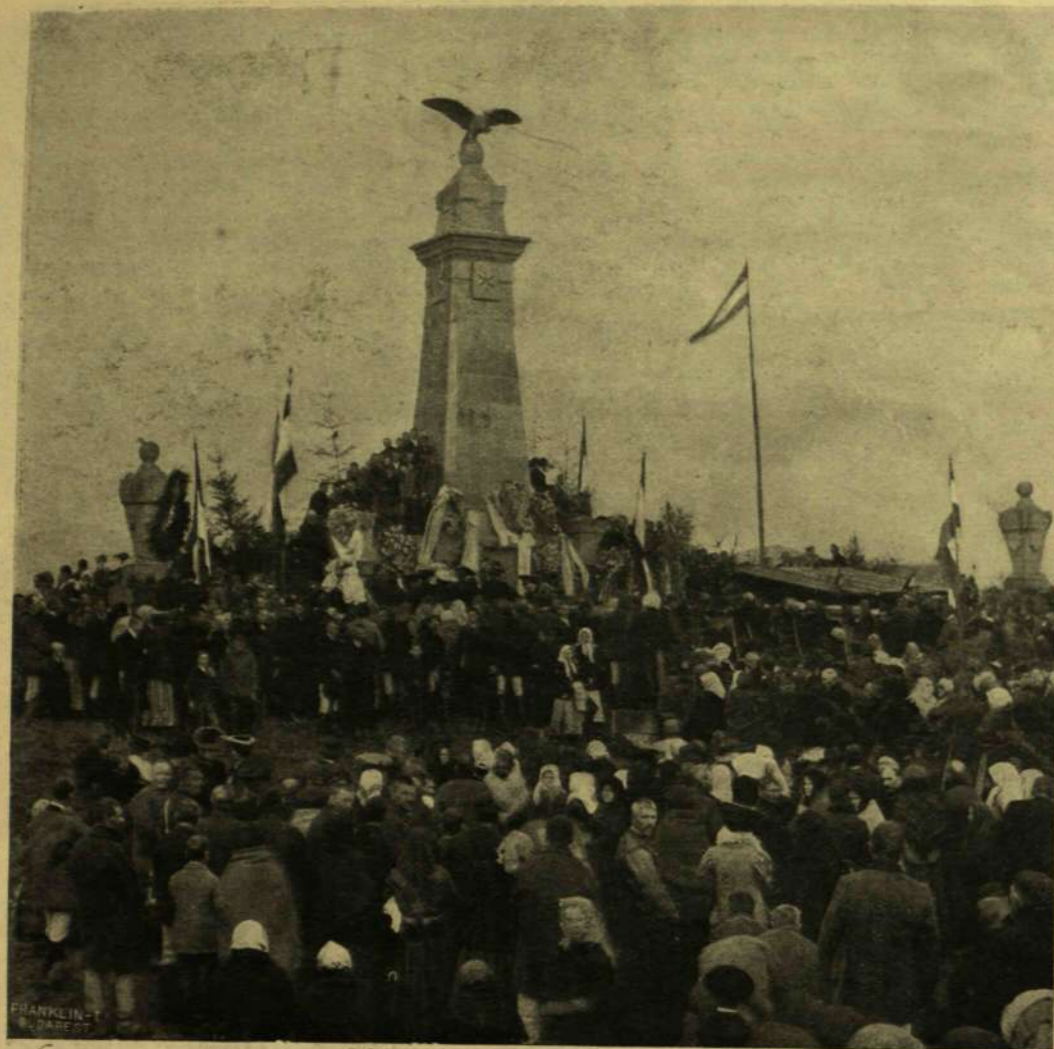
A MADÉFALVI SZÉKELY EMLÉK LELEPLEZÉSI ÜNNEPÉLY.