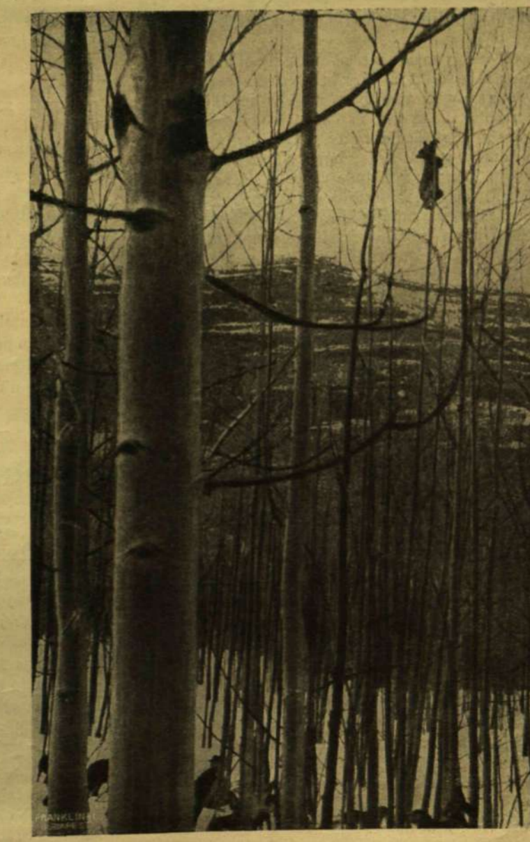
A KUTYÁK FÖLKERGETTÉK A MEDVÉT A FÁRA.