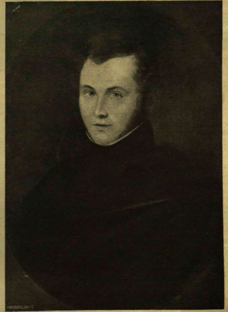
TOLDY FERENCZ FIATALKORI ARCKÉPE. 1830. évi festmény után.

AZ AZ IRODALMI TESTÜLET, melyet ő alapított s a mely talán minden egyebek közt leginkább szívéhez volt növe, a Kisfaludy-Társaság most fáklyát gyújtott Toldy Ferencz emlékezetére, születésének nemrég betelt századik évfordulója alkalmából. Emlékezetét alig volt szükség felújítani, mert élénken él még a nemzet köztudatában s ha egyik-másik munkája elavult is, roppant munkássága s annak hatása ma is friss még irodalmi és tudományos fejlődésünkben. Sirja fölött nemcsak virág nyílik kedves diszül, hanem ott csillog munkájának gyümölcse is, mint a magyar szellemi élet egy még mindig ki nem apadt tápláló forrása. Terjedelemre, tartalomra Toldy munkássága oly óriási, hogy alkotóját a magyar szellem legtermékenyebb munkásai közé emeli. Mint egykor Kazinczy egymaga pótolta egy irodalmi központot, később Jókai egy egész fejlett regényirodalmat, úgy Toldy is egy irodalomtörténetirő