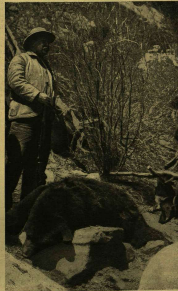
ROOSEVELT ÉS A MEDVE, MELYET LELŐTT.

Gyöngédségből elhallgatta a mondat végét, de az ideges asszony hallani akarta halálos ítéletét; az ő szájából akarta hallani és ingerülten, indulatosan sürgette: