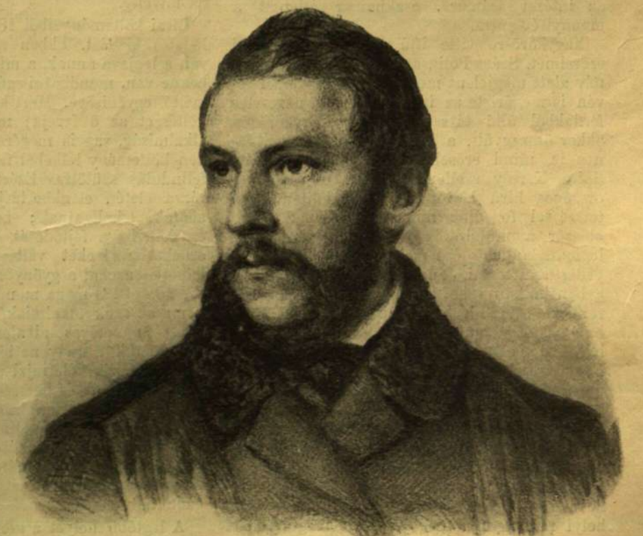
Barabás Miklós rajza az ötvenes évekből

Költő volt a javából, műfordító a legjavából, jó pap, jó polgár, fáradhatatlan munkása mindama sokféle ügyeknek, melyek gondjaira biztattak. Halála mégis első sorban az irodalomra vesztéség, mert bár viselt előkelő állami és egyházi tisztségeket, lelke az irodalom csüggött legelső sorban s e mezőn vetette el a legdúsabban termő