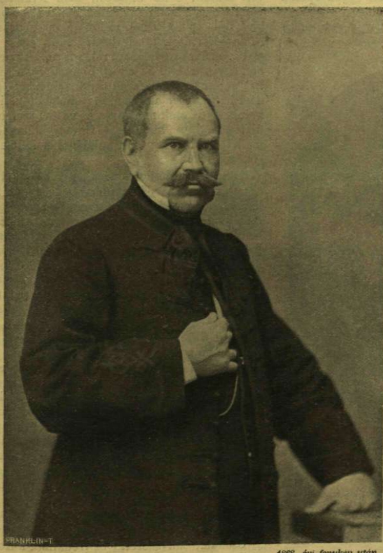
TOLDY FERENCZ. 1868. évi fénykép után.