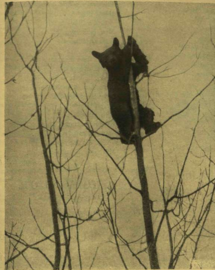
A MEDVE A FA TETEJÉN.

— Ám legyen, házasodjék meg, ha ez a szive óhaja, sokkal jobban szeretem, semhogy ne óhajtanám a boldogságát. Házasodjék meg, barátom, de legalább ne vegye el ezt az asszonyt!... Ne alázom meg annyira, hogy a legnagyobb ellenségemet válaszsza élettársául. Ezt nem tudom elviselni... ebbe belehalok.