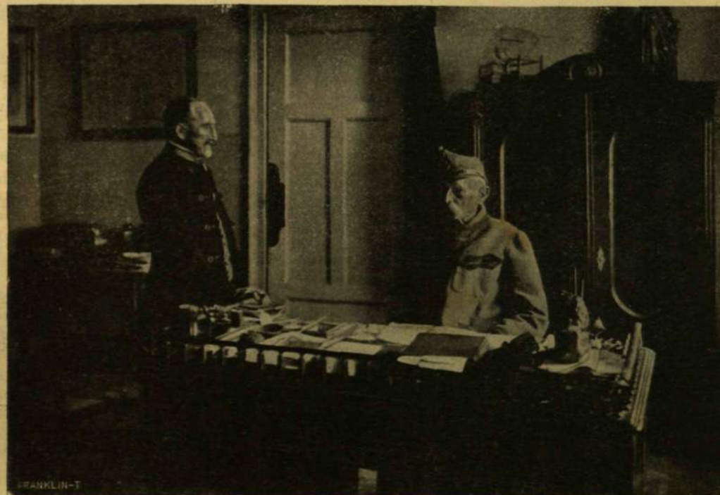
A PARANCSNOK ÉS A SEGÉDITISZT.

A többiek megnyújtottatták izmaikat... Még az esti vonattal visszautaztam Budapestre. Ki voltam pihenve teljesen.