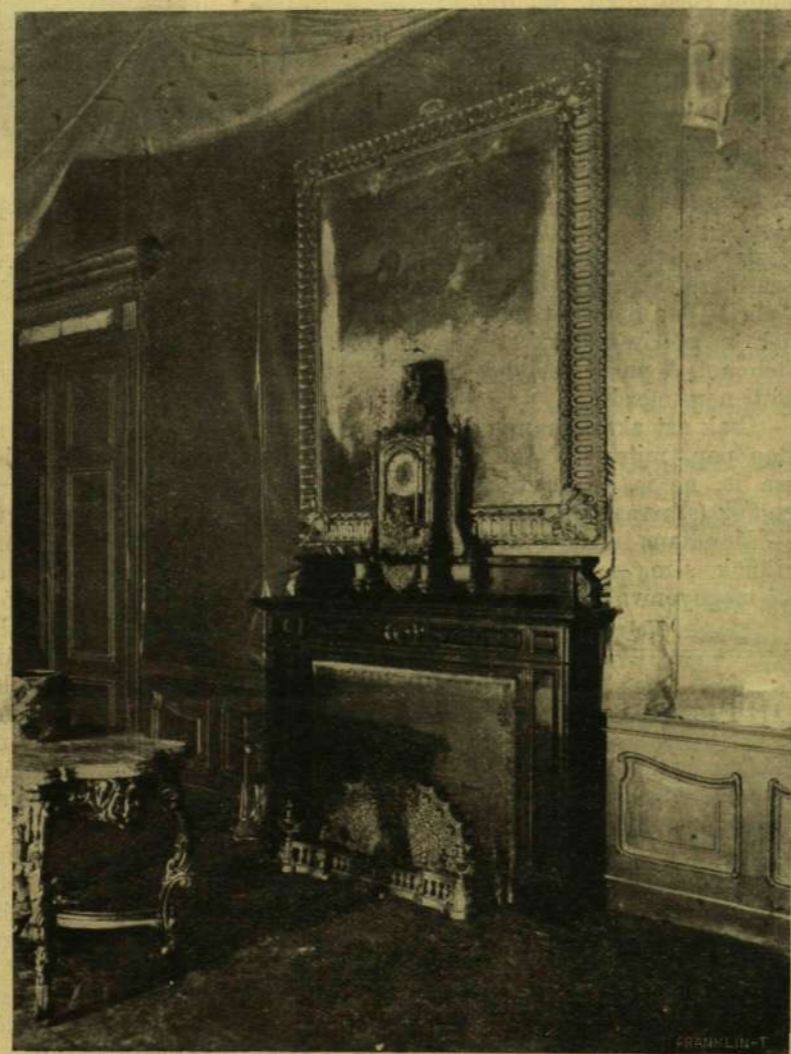
A MOROSINI-TEREM TINTORETTO «KRISZTUS A KÚTNÁL» CÍMŰ FESTMÉNYÉVEL, MELY A TŰZBEN TETEMESEN MEGSÉRÜLT.