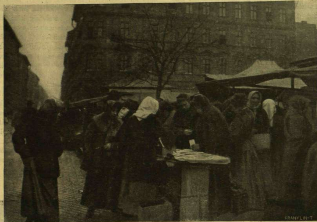
ÚJÉVI LEVELEZŐ-LAP ÁRUSOK AZ UTOZÁN.

sága, mint ma, mert az irodalmon kívül az egyedüli szelep volt, a hol a magyar érzés utat talált magának. Az ötvenes és hatvanas évek társasága ez, a mikor a sirva-vigadás nemzeti intézmény volt s a mikor a jókedvnek, tréfának, meg a duhajkodásnak szinte tragikái mellékiadt a közviszonyok nyomorúságos komorsága. Gróf Vay Sándor tárczáinak fő varázsát éppen az adja meg, hogy ezt a levegőt eleveníti meg előttünk, melynek egyes elemei benne élnek még a mai közérzésben s melynek alakjai, személyükben vagy fiaikban ma is köztünk élnek még. Másik vonzerejük pedig az a kedves biedermeyeres hangulat, mely az alakok, az események fölött lebeg s a melynek az író is egészen átadja magát. Új könyvében gróf Vay Sándor tizenhét pestvármegyei históriát mond el, mulattató vagy érzelmű történeteket, melyek ma is élnek még az idősebb urak és hölgyek ajkán s a melyek annál érdekesebbek, mert csakugyan megtörténtek, vagy megírták valaki valaki.