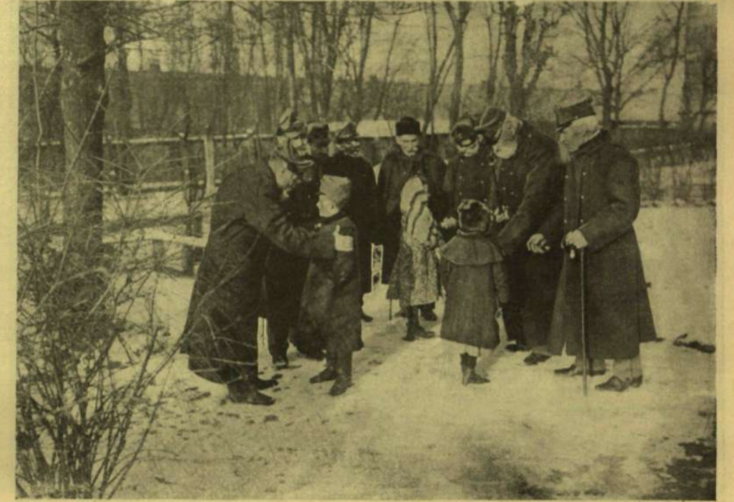
GYERMEKEK AZ ÖREG HONVÉDEK KÖZÖTT.

Persze rákerült a sor a királyra is... Hej, igen fájt nekem, a mit én akkor tapasztaltam. Az az imádszerű hódolat, a mit veriben táplál a magyar király iránt, mintha végkép kipu szult volna a szívekből! Nem fakadt ki senki se, de a visszafojtott indulat ott rezgett