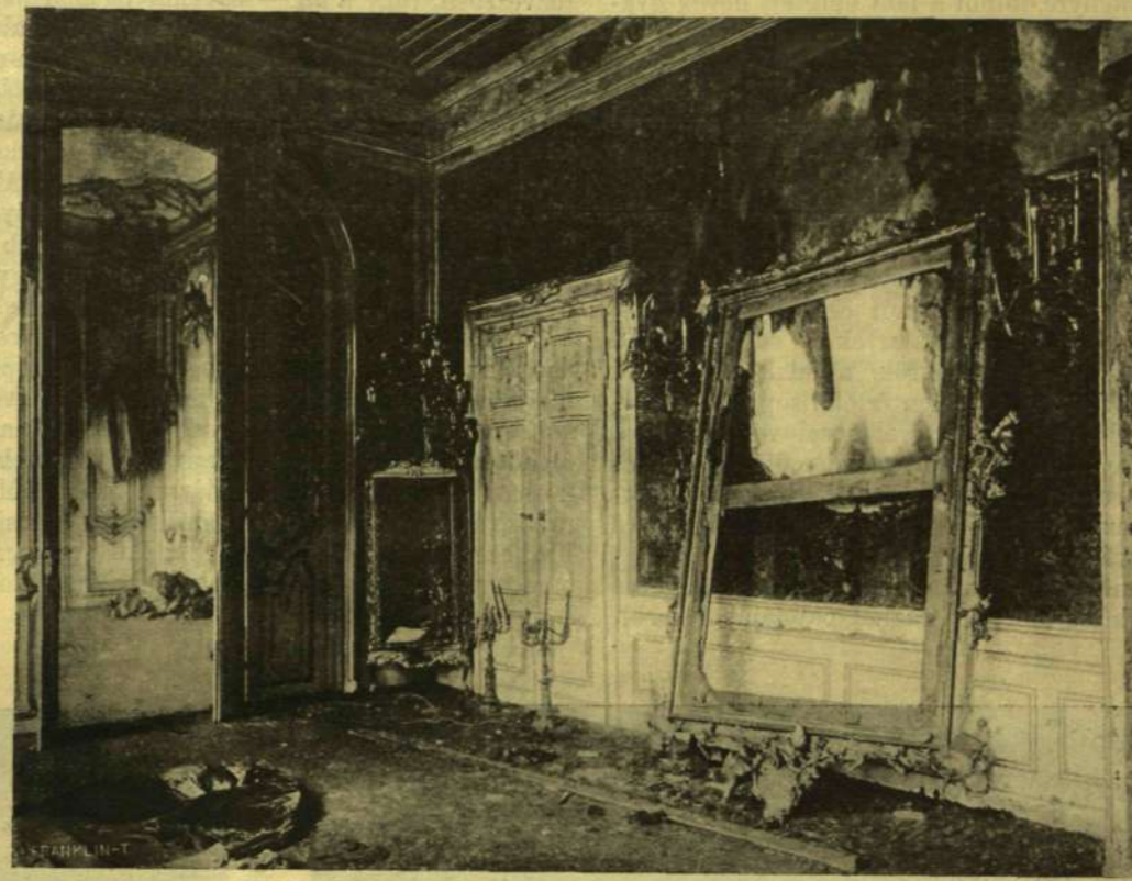
A FOGADÓ-TEREM A TÜZVÉSZ UTÁN, GRIMANI DOGE ARCKÉPÉVEL (LONGHI FESTMÉNVE).

Minden nagyobb országnak érdeke, hogy a fővárosa lehetőség szerint visszatükrözzön valamit külsőségeiben is azokból a historiai motívumokból, melyek fejlődésében kísérték. Ezekből az emlékekből, melyek az évszázados fejlődés folytonosságának dokumentumai, ma-holnap úgy sem marad meg egyéb, mint az utcanev. Nemsokára megkezdik a Belváros újabb szabályozását s ezzel az akcióval az a pár régi eredetű utca is, mely épületeiben megőrizte még a nyegyenyegző leltét, és az 1838-iki árvíz előtti Pest külső képét, eltűnik végképen, hogy megszülessen és kiépítve, vil-