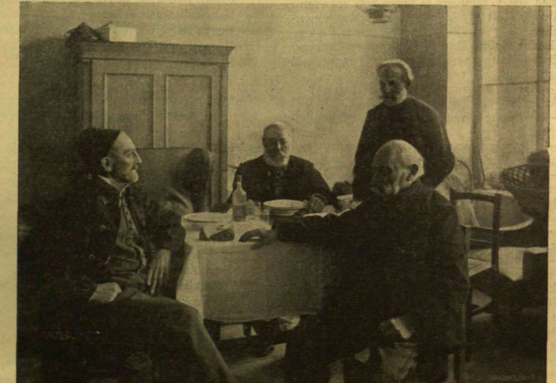
TISZTI SZOBA A HONVÉD-MENHÁZBAN.

ÖREG HONVÉDEK. FÉHÉR zuzmara a fák galyain, néma a nagy kert, hó fűdi be az utakat, virággyakat, a tél csöndessége mindenütt, — csak itt-ott mozog tova nagy lassúdan egy-egy jég-szürke szakállú öreg ember, mintha az az öreg ember is csak arra való volna e téli tájra, hogy még zordabb, szomorúbb legyen a hely. Az öreg honvédek között vagyunk, a kik a nemzet haláljából, — ez van írva a ház párnájára, — a Soroksári-út végén egy emeletes, régies állami épületben töltik napjaikat. Az öreg emberek élete mindenhol csendesen, zajtalanul múlik, de százzorta csendesebb akkor, ha az állam gondjaiban telik el. Az állam gondskodik itt mindenről, még zsoldot is fizet, csak jól érezzék magukat az öreg emberek a menedékházban. Fogy, napról-napra fogy az öregek száma, hiába akadnak mű-honvédek, a kik az öreg oroszánok számát szaporítanák. Lassan eljön az idő, hogy egyetlen honvéd lesz már csupán széles Magyarországon, — az utolsó honvéd. És talán az az utolsó honvéd se lesz már igazi honvéd. Mert érdekes, de való, hogy a ma élő „honvédek”-nek a fele sohase hallott