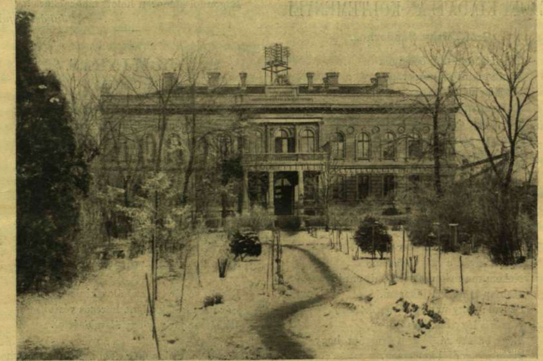
A HONVÉD-MENHÁZ A SOROKSÁRI-ÚTON.

Szerkesztőségi iroda: IV. Reáltanoda-utca 5. Kiadóhivatal: IV. Egyetem-utca 4. Előfizetési feltételek: Egész évre 16 koroná, Félévre 8 koroná, negyedévenként 80 fillérrel több. Negyedévre 4 koroná. A „Világkronika”-val külföldi előfizetésekhöz a postailag meghatározott viteldij is esatolandó.