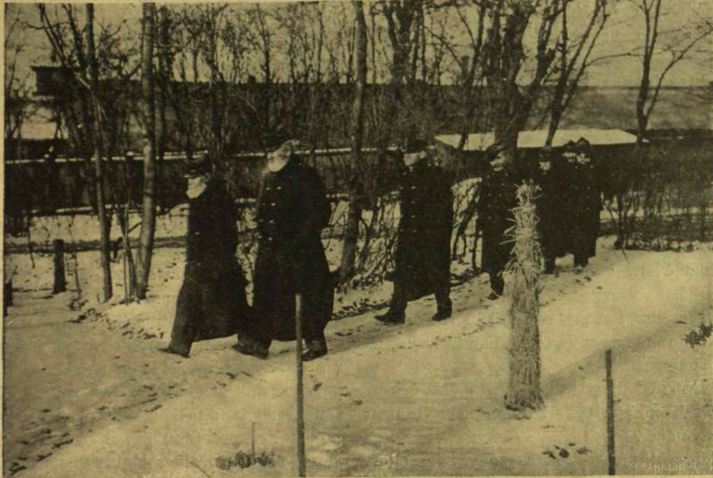
SÉTA A KERTBEN.

alatt. Csak a mikor jól ment a sorom: pihenem lehetett.