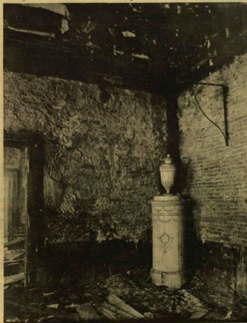
AZ A KÁLYHA A HÁLÓSZOBÁBAN, MELY A TŰZ OKOZÓJA VOLT. (AZ ALJÁN LÁTHATÓ KÉT ÚJNYI RÉSEN CSAPOTT KI A LÁNG).

Hanem a mi elpusztult, az oda van örökre, s a Szapáry-palota égése következtében szenvedett óriási kárt nem lehet pénzértékben felbecsülni. B. M.