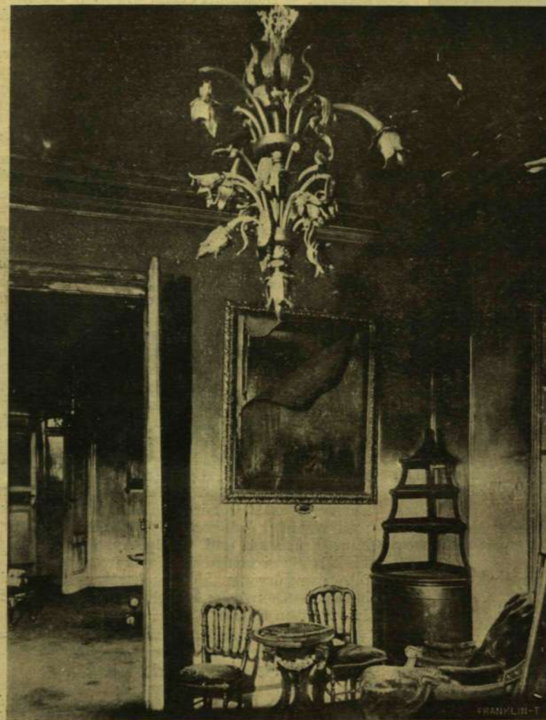
A RIS EBÉDLŐ LORENZO LOTTO ELÉGETT KRISZTUS-KÉPÉVEL.

«A rög» című kötetében egy híján húsz novelláját adta ki. Kétségkívül nemcsak új, hanem új jelenség is, a mely nem kapaszkodik senki előző-jébe, nem kap az irodalmi mesterség kész, klisé-szerű formáin, hanem maga teremtetette meg önmagát, mint író s önmagából vesz formát és tartalmat egyaránt. Mint manapság mondhatni mindenki a legfiatalabb nemzedékben, ő is az új romantikusok közül való; tisztára lírikus lélek, nem is titkolja lírai diszpozícióját, az életet, a világot nem apró részleteiben látja, mint a realisták, a kiken mi nevelkedtünk, hanem nagy, egyszerűsített vonalaiban, erősen markolt összefoglalásokban és misztikába olvadó szimbolumokban. A fantázia majd mindig túlcsapong benne, különösen a stílusában, a színek, a vonalak, a képek egymás hegyén-hátán vonulnak el szeme előtt, hol bizarr egyveleget adva, hol egymásba és egymásra tolván. Ez a képtörődés, a melyet tetszés szerint nevezhetünk túlgazdag-