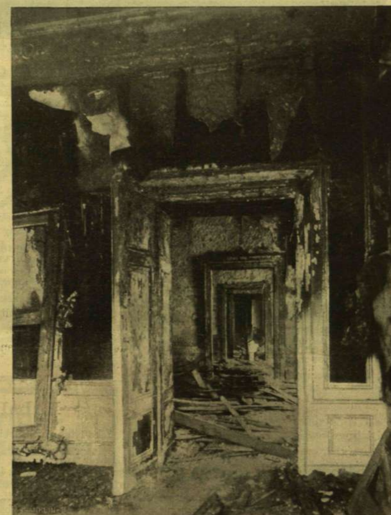
AZ ELHAMVADT SZOBÁK A NAGY FOGADÓTEREMBŐL NÉZVE.