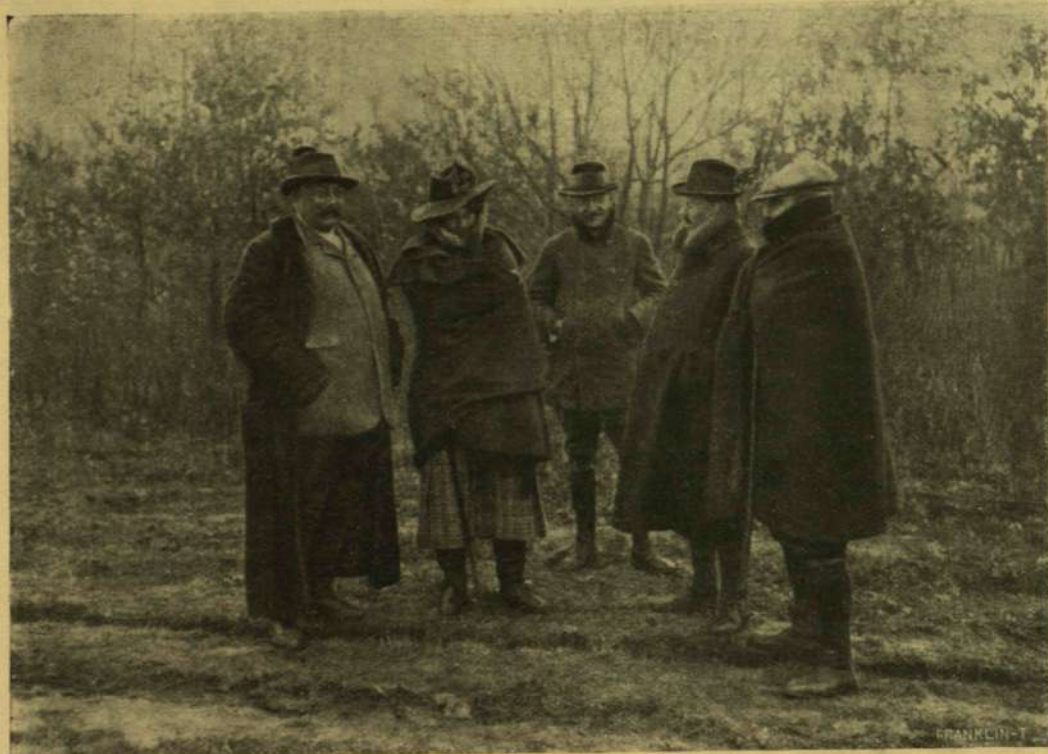
A KISJENŐI VADÁSZATOKRÓL. — ÉLES A LEVÉGŐ.