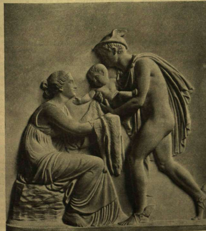
MERCUR BEMUTATJA A GYERMEK BACCHUST ENO NIMFÁNAK. Márvány-dombormű.