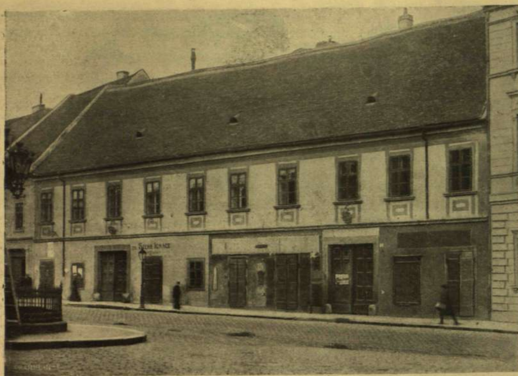
A KERESZTMÜNSTERI APÁTSÁG EGYKORI HÁZA, MELYET KLÓTILD FŐHERCEGNŐ SZÁMÁRA FOGNAK ÁTALAKÍTANI.

útrakeres azokat, akik kivéle a Szentlélekét képviselik. Hogy miért keresi föl őket, azt már nem tudta megmondani. De ezen már nem is gondolkodott. Talán elég lesz, ha látja, s aztán újra ott hagyja őket? Mit tudja ő?