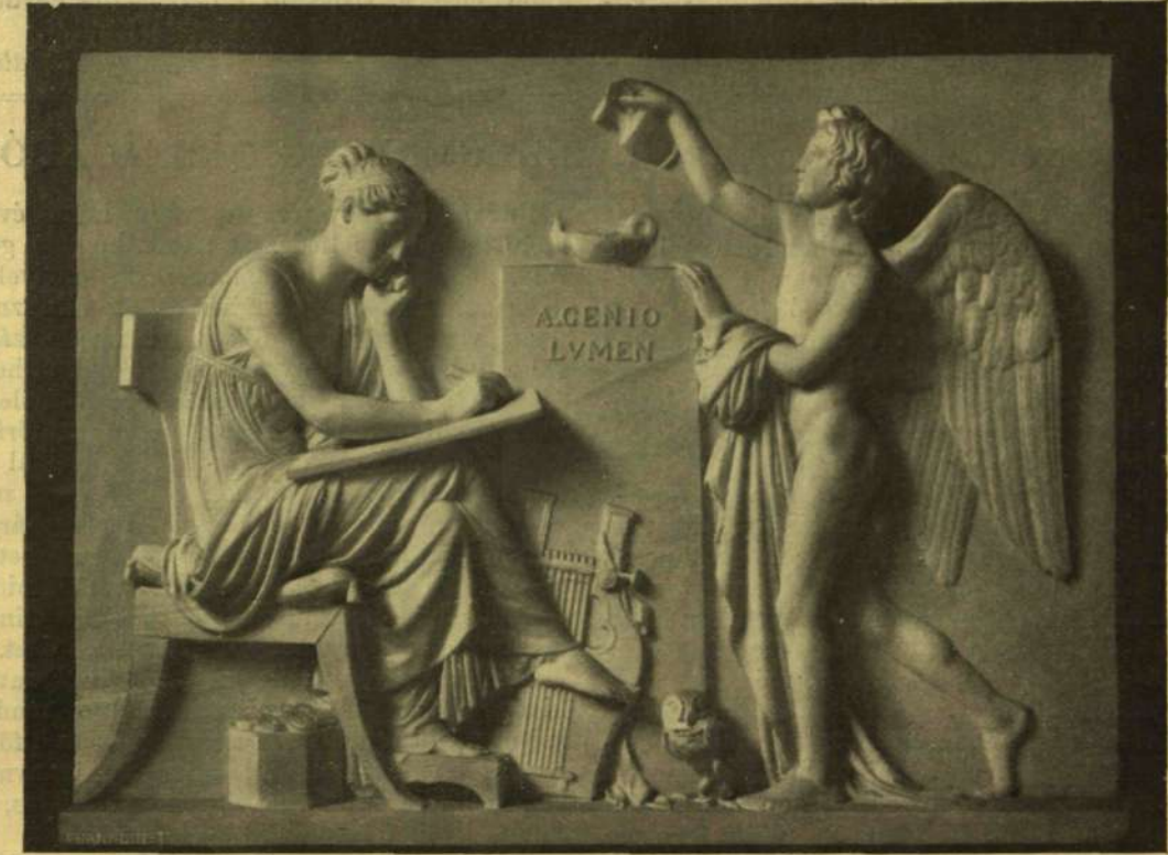
A GENIO LUMEN. Márvány-dombormű.

Gyors egymásutánban nyerte el az akadémia kis és nagy ezüstérmét s az apa már azt hitte, hogy fiának művészi nevelése ezzel teljesen befejezett nyert. Hogy Thorwaldsen pályája nem az apa műhelyében ért véget, ebben legnagyobb érdeme volt Abilgard festő-