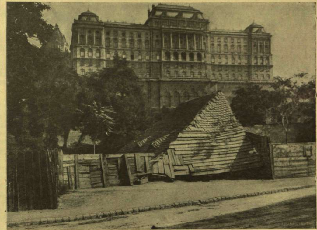
ÓCSKA VISKÓK A BUDAI KIRÁLYI PALOTA SZOMSZÉDSÁGÁBAN, AZ ÁROK-UTÓZÁBAN.

— Igen, igen, avatkozott bele Pataky, maga említette is nekem, doktorkám, ugy-e? Persze, persze! Ez az a Romvári Iván nevű színész. Gratulálok Szentléleki úr, mondhatom, hogy nagyon tehetséges fiatalember. Láttam egy francia drámában s igazán meg voltunk vele elégedve. A zsánere hősszerű. Azt hiszem,