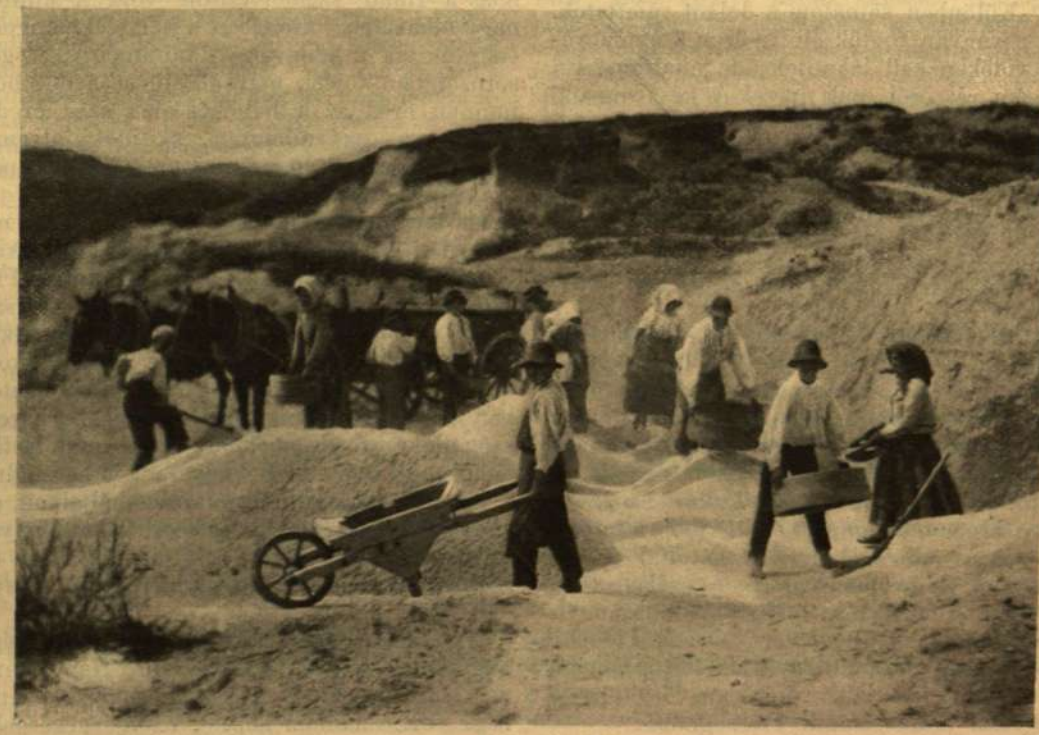
HOGY FEJTİK A KŐPORT VÖRÖSVÁRON? — A kőport kocsi rakják.

Az ajtó szép csendesen kinyílt egy kissé, a cseléd bedugta fejét a szobába és hívta Francót, a ki imádkozott egy széknel térdelve, a halott ágya mellett, Franco nem hallotta meg és Lujza kelt fel. Odament meghallgatni a leány kérdését, felelt neki valamit s miután az