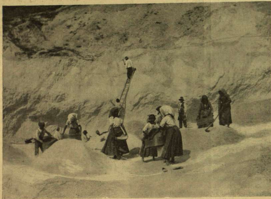
HOGY FEJTİK A KŐPORT VÖRÖSVÁRON?