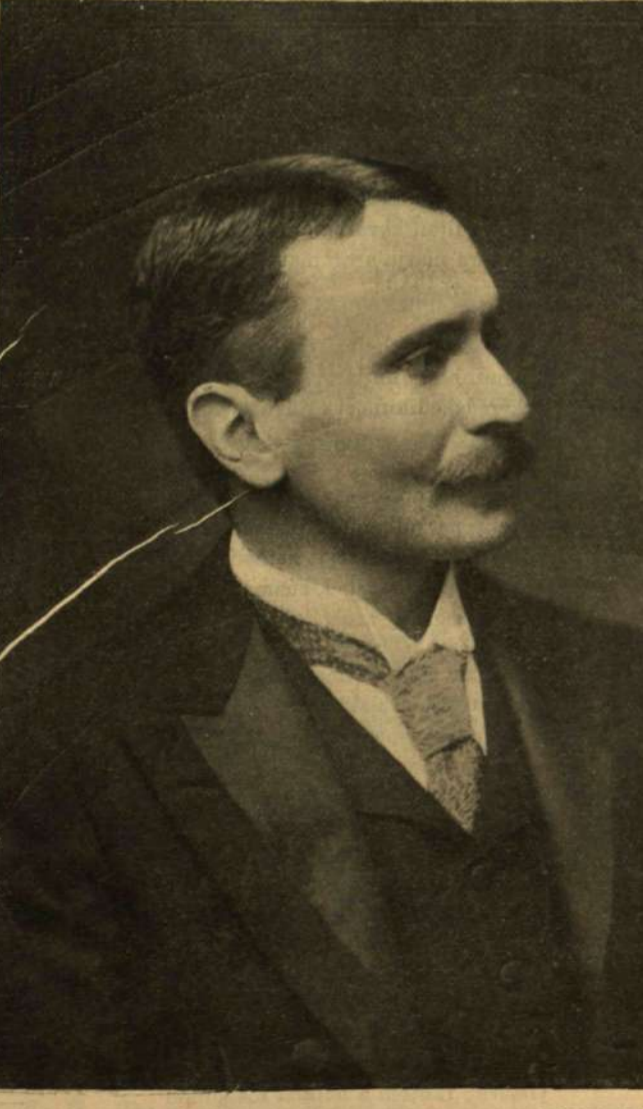
STEIN AURÉL. Londoni fénykép után.

Fejem fölött tiszta kék ég ragyogott s a magasabb szirtekről és kőszalákról vidám napfény tükröződött, mégis mondhatatlanul nyomasztóan hatott rám ennek a helynek a kihaltpusztasága s szürke homályossága. Végtelen megkönynyebülés érzetével üdözöltem a kies Mitáz-völgyet, a hova derűs fényben tüzték le a nap meleg sugarai. Édes élvezettel hallgattam a vidáman szökellő patak esőgözegetését a szurdokok leverő némasága után. Kis lovam hosszasan nyelte a soká nélkülözött pompás tiszta vizet, én meg letelepedtem