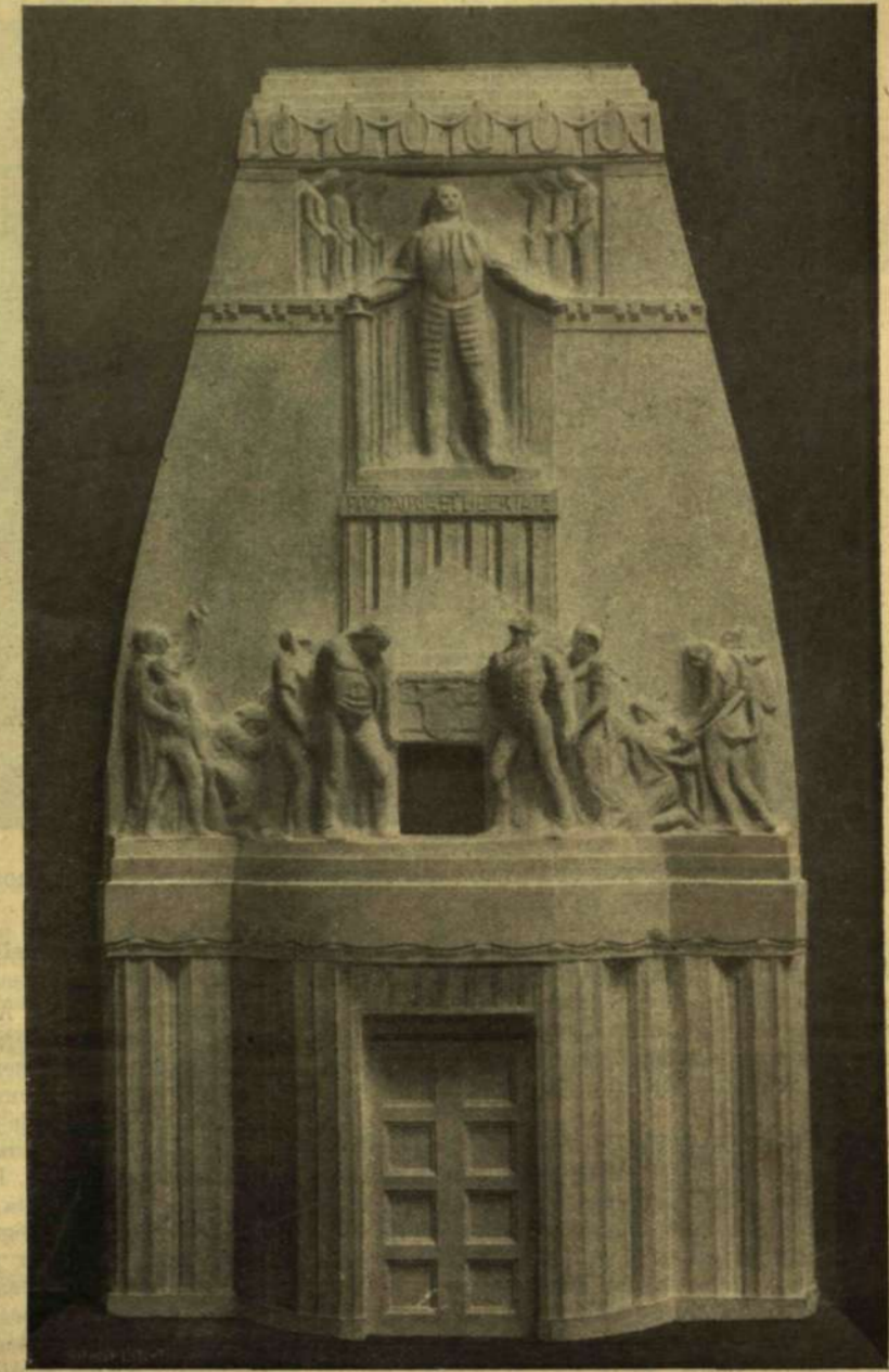
BECK Ö. FÜLÖP ÉS HIKISCH PÁLYATERVE.

A RÁKÓCZI-SÍREMLÉK PÁLYÁZATRÓL. — Erdélyi felvételei.