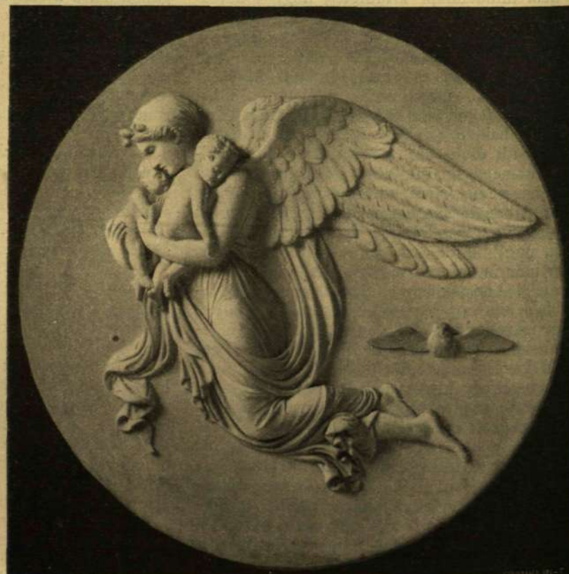
AZ ÉJ ALLEGORIÁJA. Márvány-dombormű.