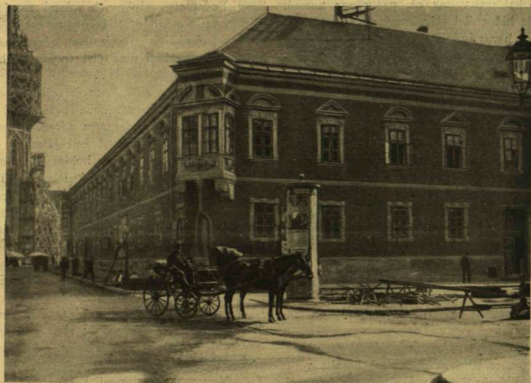
A RÉGI BUDAI VÁROSHÁZA, MOST I. KERÜLETI ELŐLJÁRÓSÁG.

Délután kiült a ház elé és süttette magát a nappal. Levette a kalapját, hogy a tavaszi nap-sugárral a koponyáját melegítse. Nem tervezett, csak álmodozott. Álmodozott az eddiginél kellemesebb öregségről. Néha lustán kinyitotta szempilláit s végignézett az udvarán. Bizony ezen az udvaron csak a növényvilág proletárjai és koldusai tanyáztak. Mindenféle úri udvarból és nemesi kertből kiltított dudva és virág: számtartó, ütilapu, királygyertya, kutyatej. Erzsók asszony nagyot bámult, mikor egyszerre csak a gazdája ráfordult, hogy ezt a sok gízgáz jó volna innen kikapálni és kihányni. Uram Isten! a tekintetes úr asszonyt akar talán a házhoz hozni, gondolta magában, de nem mondta ki. Régen leszoktatta őt már Szentlélek a beszédről. Egyszerre az öreg felugrott és bement a szobájába. Útt-kopott ruhadarabjai közül fölöltözködött a legjavába,