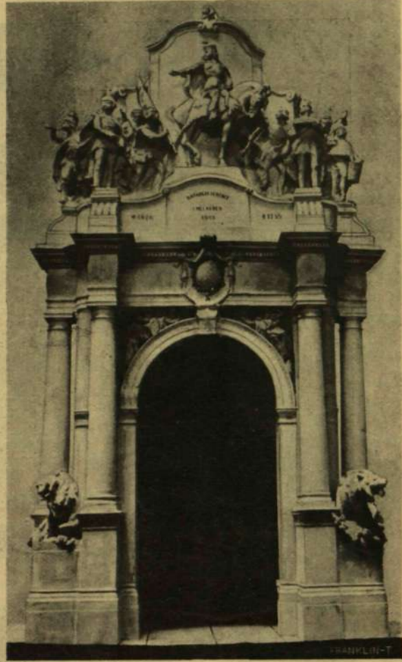
MARKUP ÉS SZEHTLÓ PÁLYATERVE.