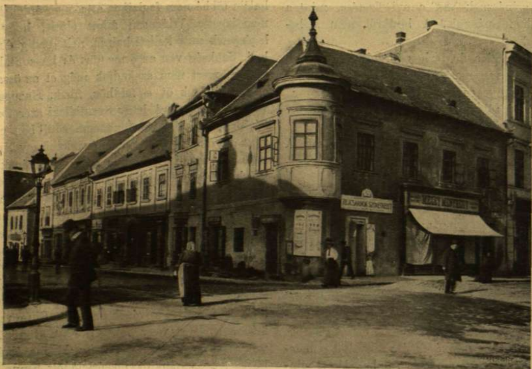
A SZENTHÁROMSÁG-TÉR ÉS ORSZÁGHÁZ-UTCA SARKA.