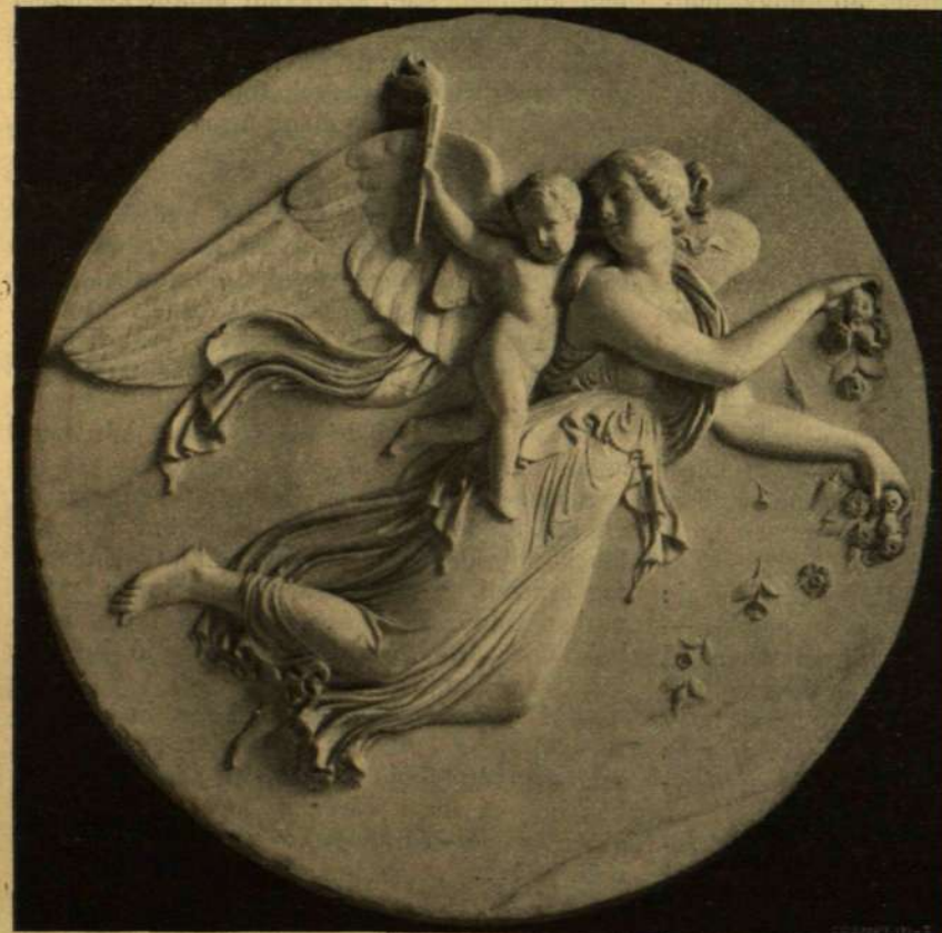
A HAJNAL ALLEGORIÁJA. Márvány-dombormű.