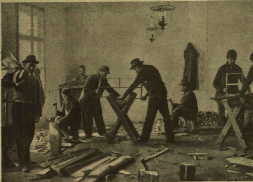
A MUNKANÉLKÜLEKET FOGLALKOZTATÓ MŰHELY EGY BUDAPESTI KÜLVÁROSBAN. — Fát aprítanak.

félve attól, hogy önmagukra mondanak kritikát... A munkanélkülieket foglalkoztató műhely egy budapesti külvárosban. — Fát aprítanak.