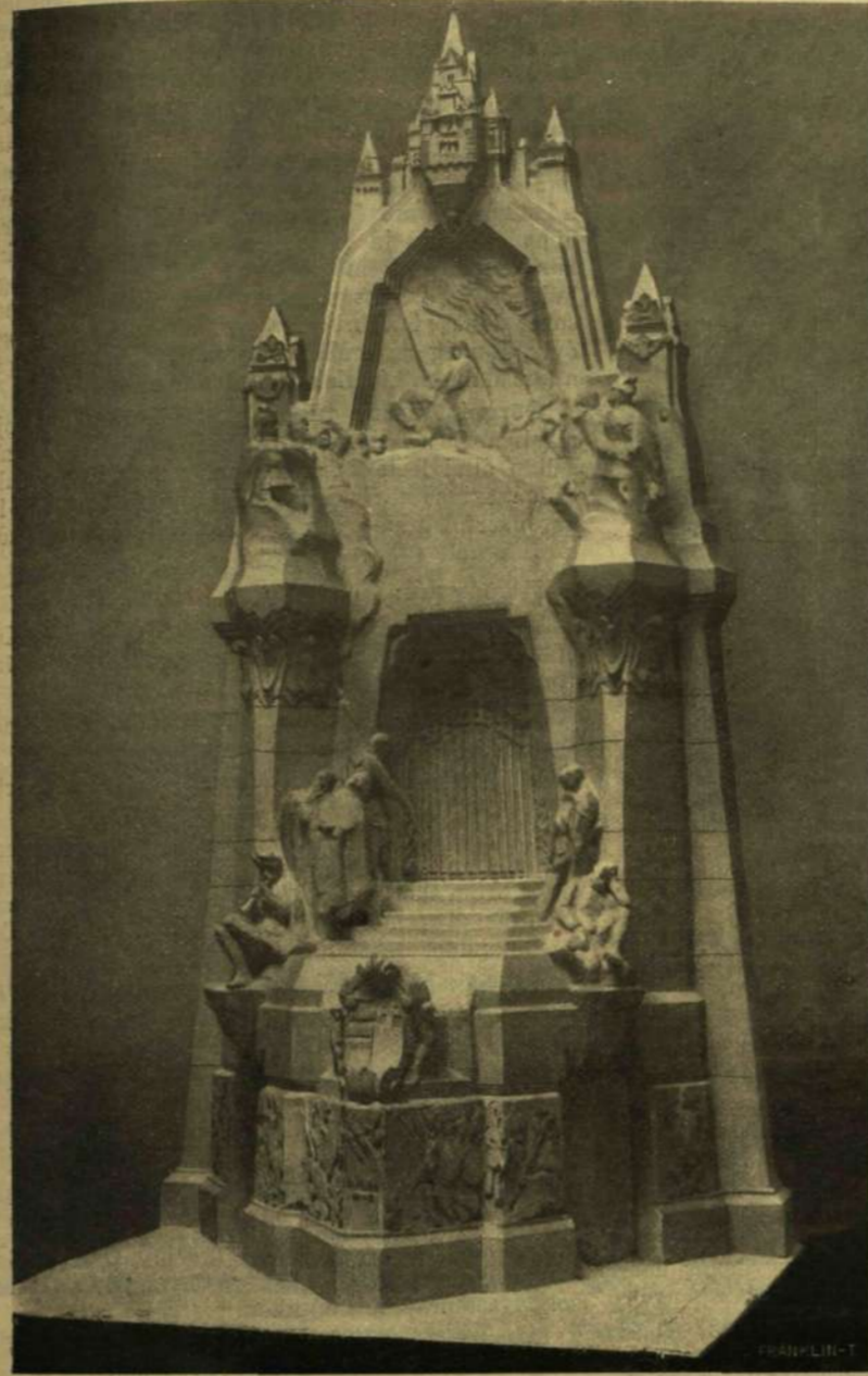
FÜREDI ÉS LECHNER PÁLYATERVE.

Aztán Flammarion várt néhány hónapig, kiváncsian lesve az eredményt. S tényleg, valamennyi üvegház ültvényei más és más fejlődési fokot mutattak. A kék ház ültvényeinek fejlődése teljesen megállt. Épen abban az állapotban találták őket, mint a melyben odahelyezte. Se jobban, se rosszabbul. Valóságilag aludni látszottak a növények, nyilván a kék szín hatása alatt, mely megállította fejlődésüket. A zöld házban mint sokkal nagyobbra nőttek a mimózák, mint a közönséges üvegházban, de növések szerföltött rendetlen volt és nedv-szegény. Egészen másként állott a dolog a vörös üvegházban, hol az ültvények valóságilag óriásokká fejlődtek, rendkívül jól táplált és szépen alakult példányok