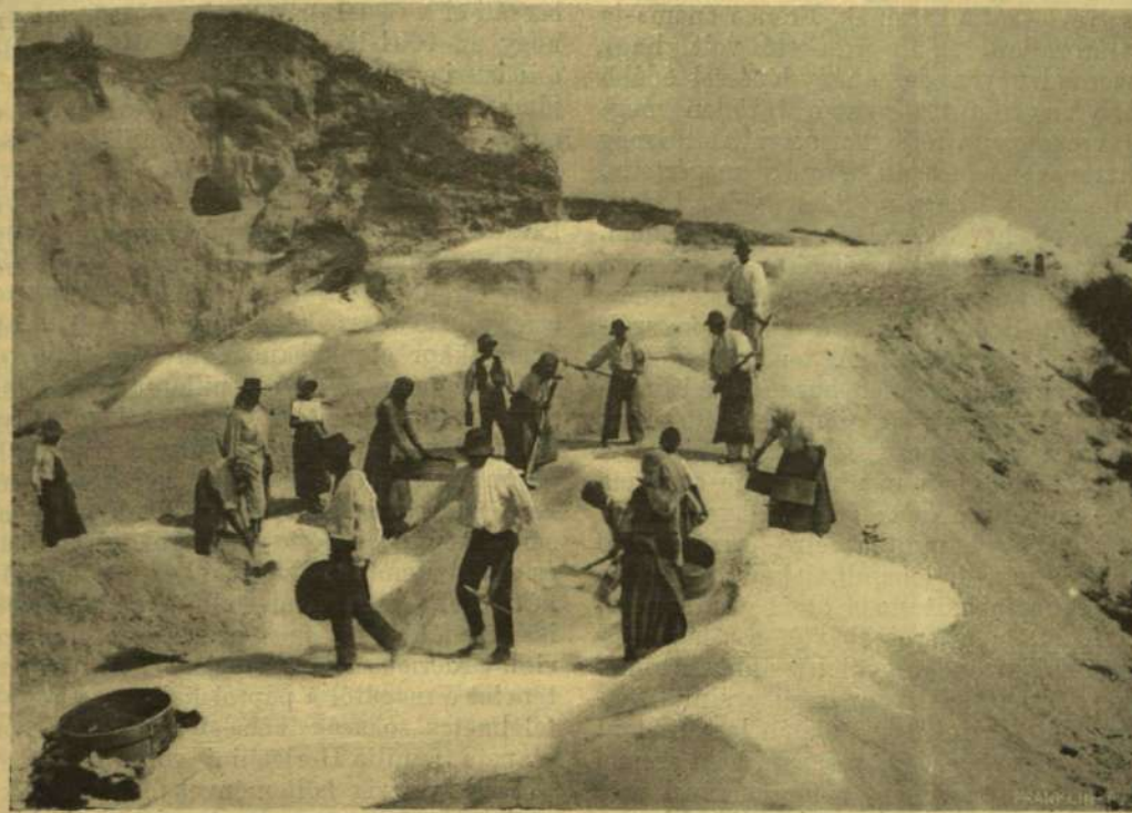
HOGY FEJTİK A KŐPORT VÖRÖSVÁRON? — A kőpor szállítás.