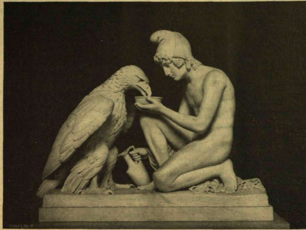
GANIMEDÉSZ, A MINT ZEÜSZ SASÁT ITATJA. Márvány-szobor.

mert ezek az urak mind olyan jókedvűek — biztatott, hogy csak legyek nyugodt, mert estére minden jóra fordul; az ő kastélyához érünk, majd lesz jó vacsora, jó ágy; aztán kipihenve érhetek haza, babáiraimon nyugatom, míg újból kitüntetnek valami komisszióval.