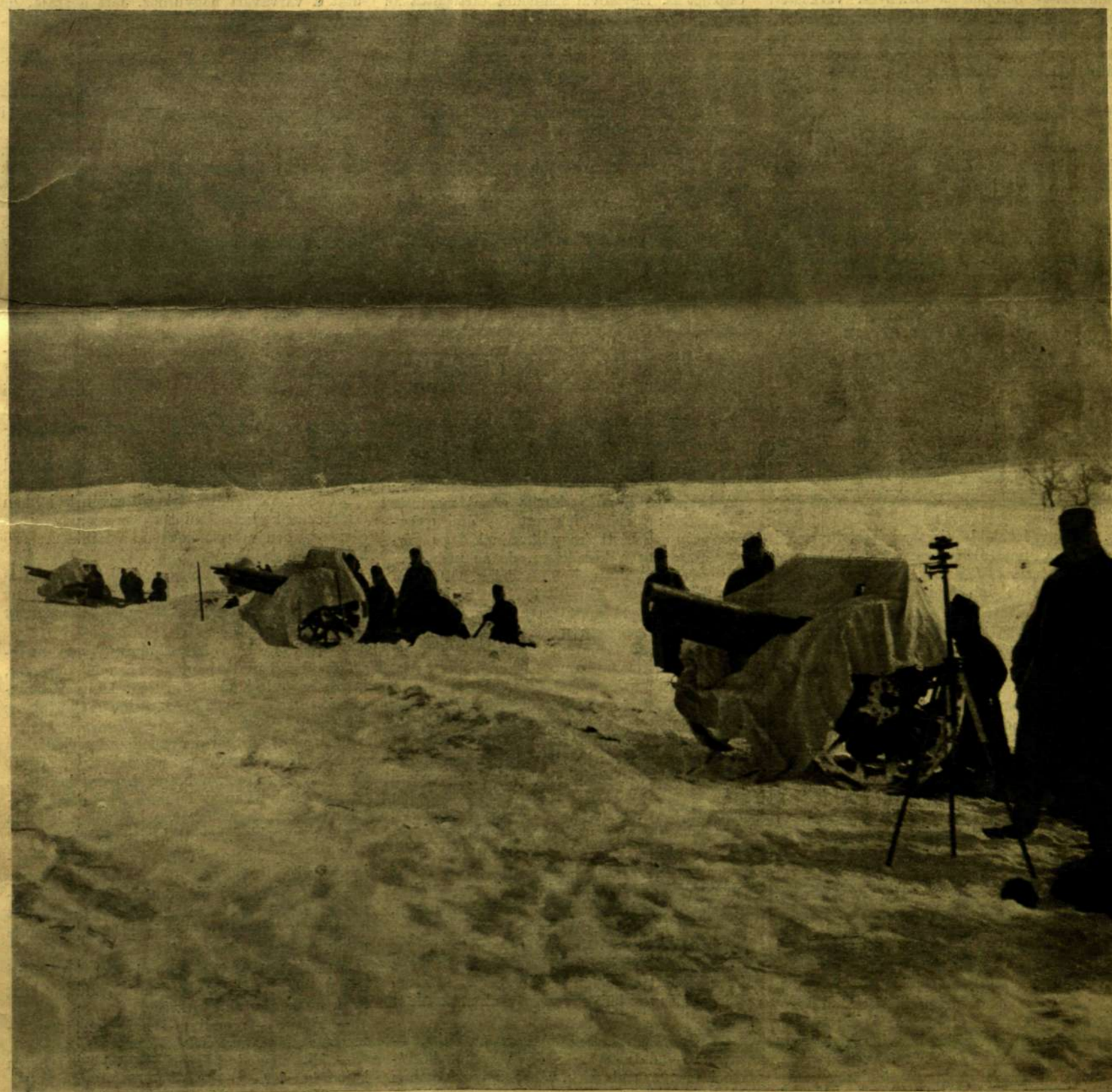
EGY ÁGYÚÜTEG FEHÉR LEPEDŐVEL LETAKARVA, HOGY A HÓBAN NE LEHESSEN LÁTNI.

Külföldi előfizetésekhez a postailag meghatározott viteldij is eszotolandó.