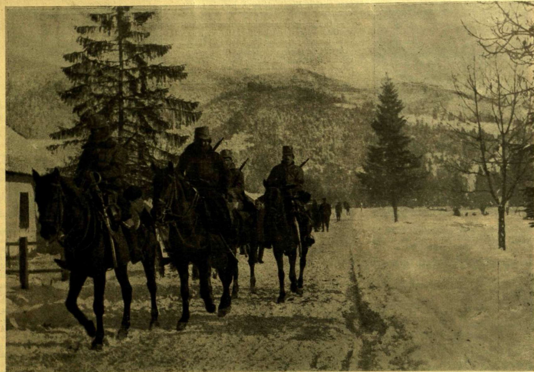
HUSZÁR JÁRÓR A BUKOVINAI SZOROSOKBAN.