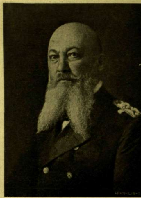
Tirpitz főtengernagy, a német tengerészeti hivatal államtitkára, a ki Angolországok tengerelatti hajókkal való blokádját intézi.

— Honne haragunék, mikor ojjan fekete. Tán még pogány is az istenadta.