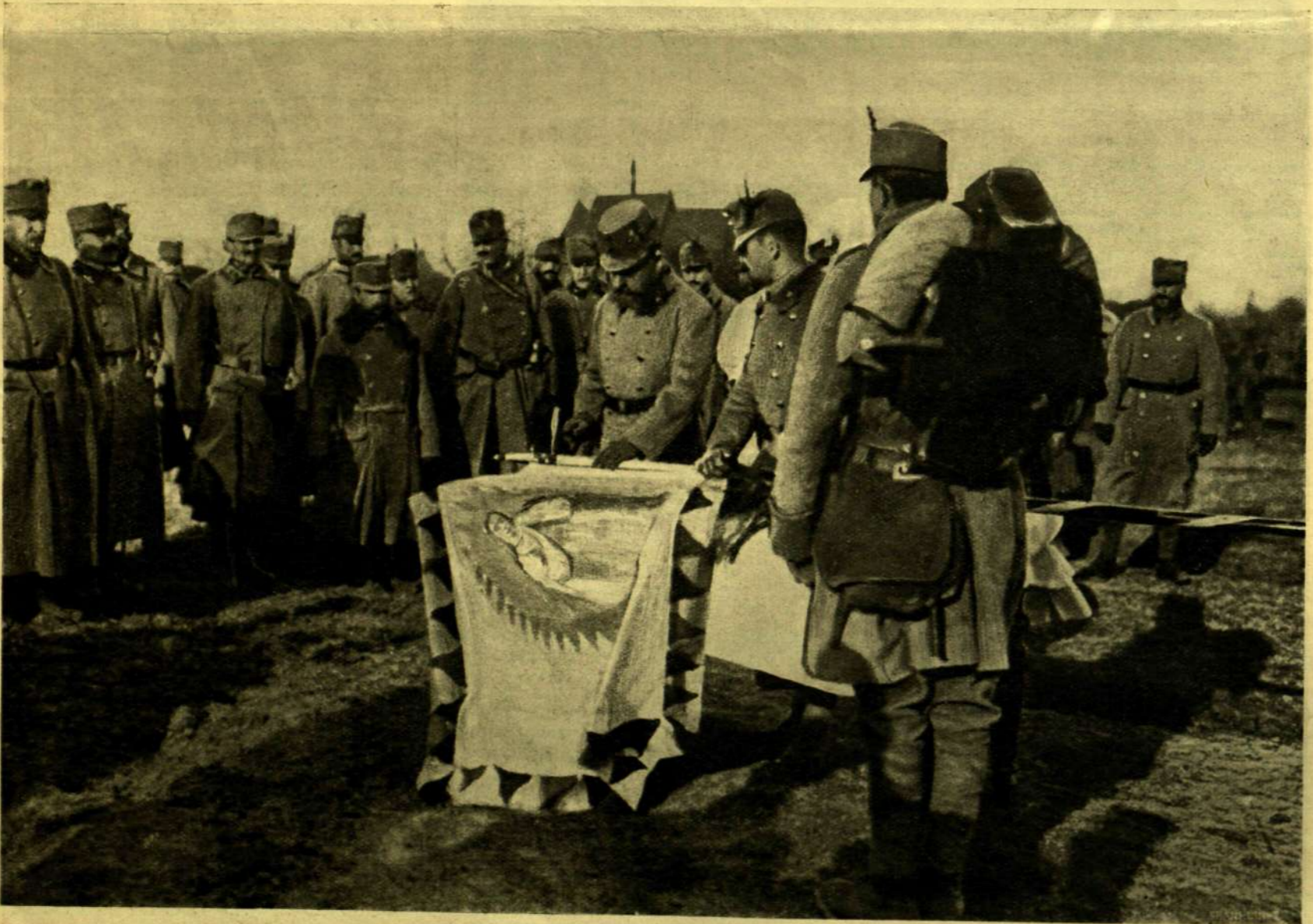
JÓZSEF FERDINÁND FŐHERCEG Ő FELSÉGÉNEK NEVÉBEN SZEGET VER A ZÁSZLÓBA.

A 2-IK TIROLI VADÁSZEZRED ZÁSZLÓT KAPOTT Ő FELSÉGÉTŐL, MELYET A CSATATÉREN SZENTELTEK FÖL.