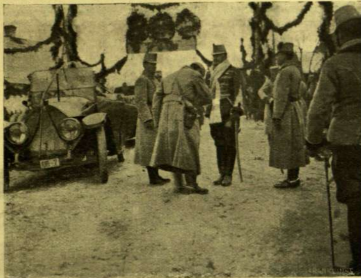
A TRÓNÖRÖKÖS MEGÉRKEZÉSE.

KÁROLY FERENCZ JÓZSEF TRÓNÖRÖKÖS LÁTOGATÁSA AZ OROSZ-LENGYEL HATÁRON.