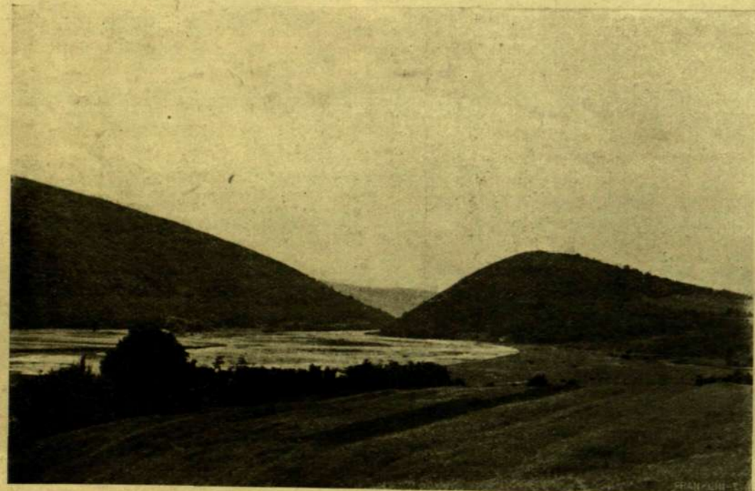
A KASTÉLYHEGY, MELYEK BIRTOKÁÉRT ERŐS HARCZOK FOLYTAK TETEJÉN ÓSKORI SÁNCZCAL ÉS AZ ONDAVA FOLYÓ FELSŐ VÍZKÖZ MELLETT.

Valaha a csehek alkalmazták előszeretettel a tüzérségnél. Úgy találták, hogy azok közül kerül ki legtöbb olyan altiszt, ki az ágyúk irányításához legjobban ért. Legújában ez a nézet megváltozott s kitűnt, hogy a magyarok még a csehekénél is különb tüzérek. A hadihajókon levő tüzérségnek nem kevesebb, mint nyolcvan százaléka magyar származású. S ez a hajótüzérség első helyen áll ma a világon: száz lövése közül kilencvenhat célba talál.