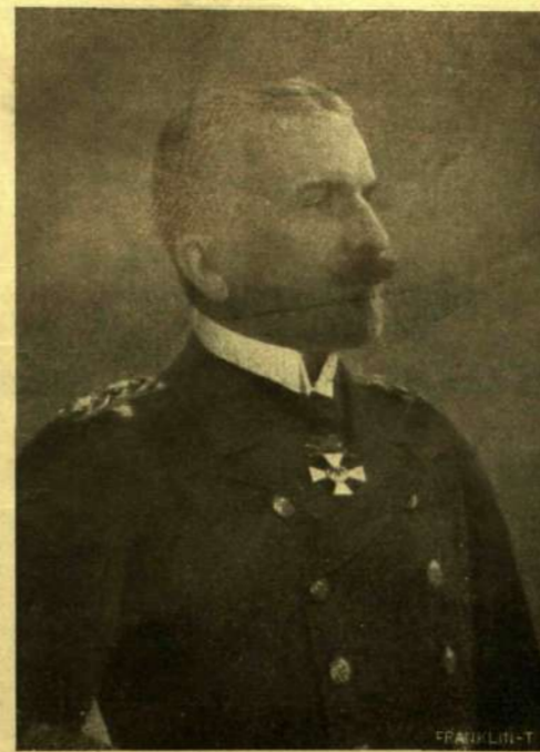
Pohl tengernagy, a német tengerészeti vezérkar főnöke, a ki az Anglia körüli vizeket hadiszíntérré nyilvánító hirdetményt kibocsátotta.

— Nem a veszedelemtől félek, a boldogságtól, a mi most a szemembe nevet, de ki tudja, nem fog-e nekem rögtön hátat fordítani, ha hazakeresznek.