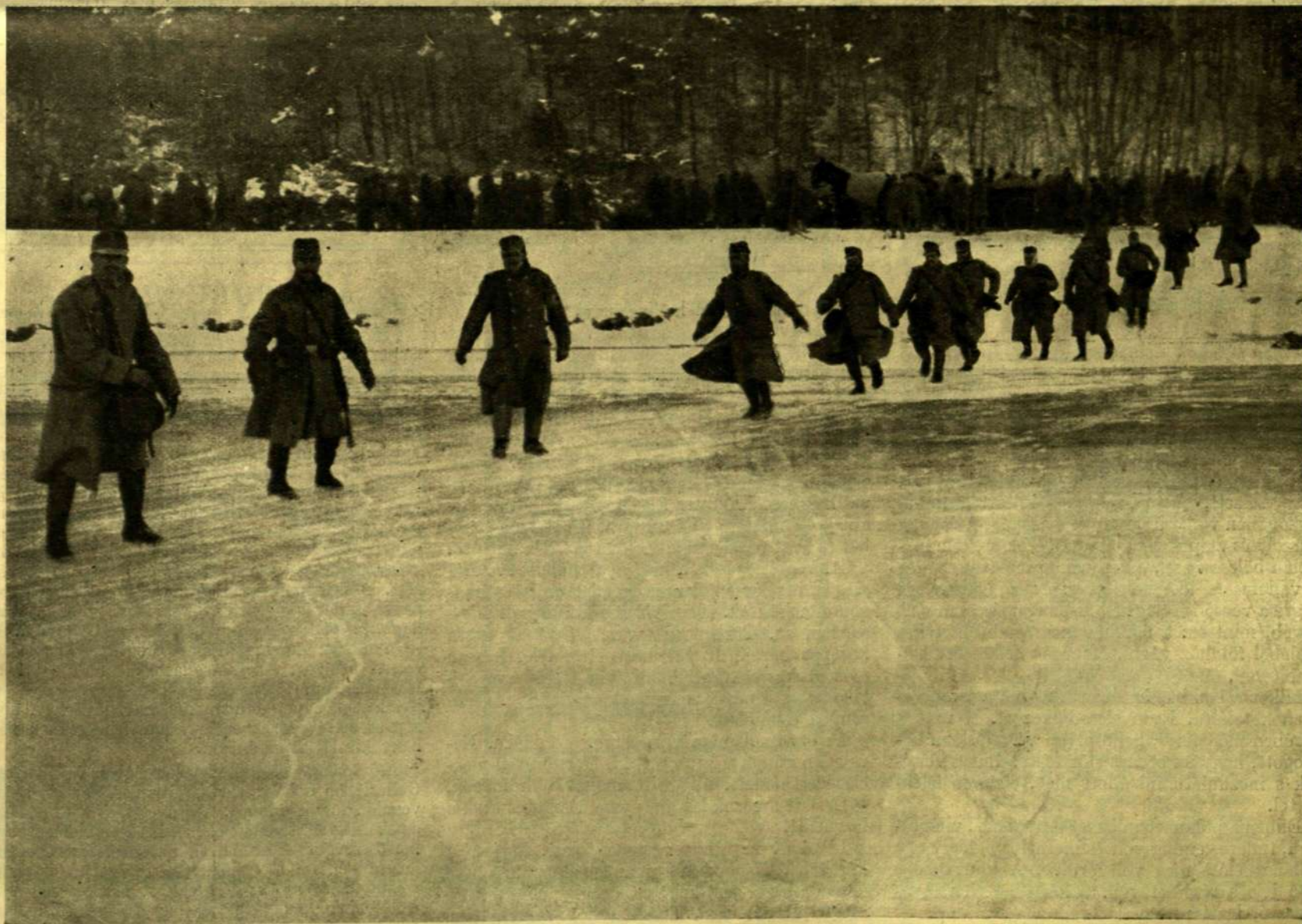
CSUSZKÁLÓ MAGYAR KATONÁK A LÖVÉSZÁROKBA VALÓ INDULÁS ELŐTT.

A mi az országban ez idő szerint végbement és a mihez a maga módja szerint ő is hozzájárult, úgy érdekelte őt, mint egy szokatlan, megrázó színjáték, tele meglepetésekkel, rejtelmekkel, borzadálylyal. Saját tudatos akaratából közlekedett ezekhez a dolgokhoz, de különös szándékból. Ha e mellett hasznára volt a forradalomnak, ez nem az ő érdeme volt. Ezzel tiszt-