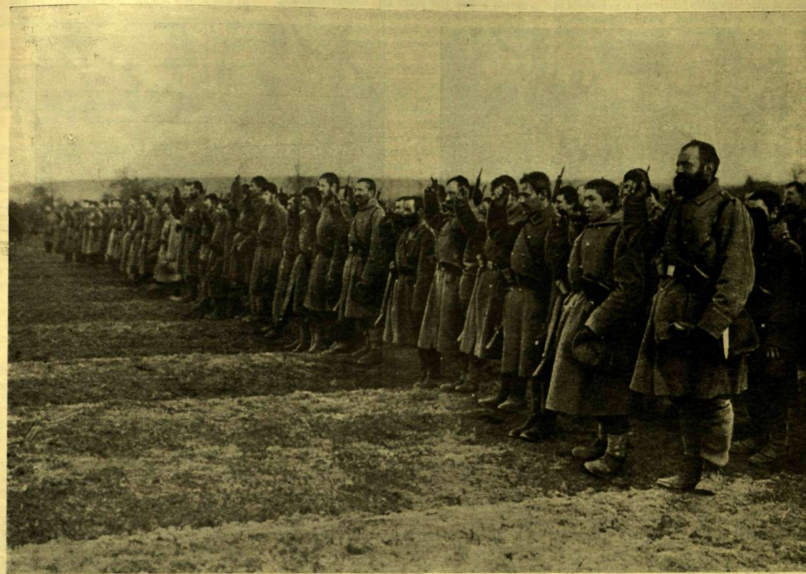
A LEGÉNYSÉG FÖLESKÜSZIK AZ ÚJ ZÁSZLÓRA.

A 2-IK TIROLI VADÁSZEZRED ZÁSZLÓT KAPOTT Ő FELSÉGÉTŐL, MELYET A CSATATÉREN SZENTELTEK FÖL.