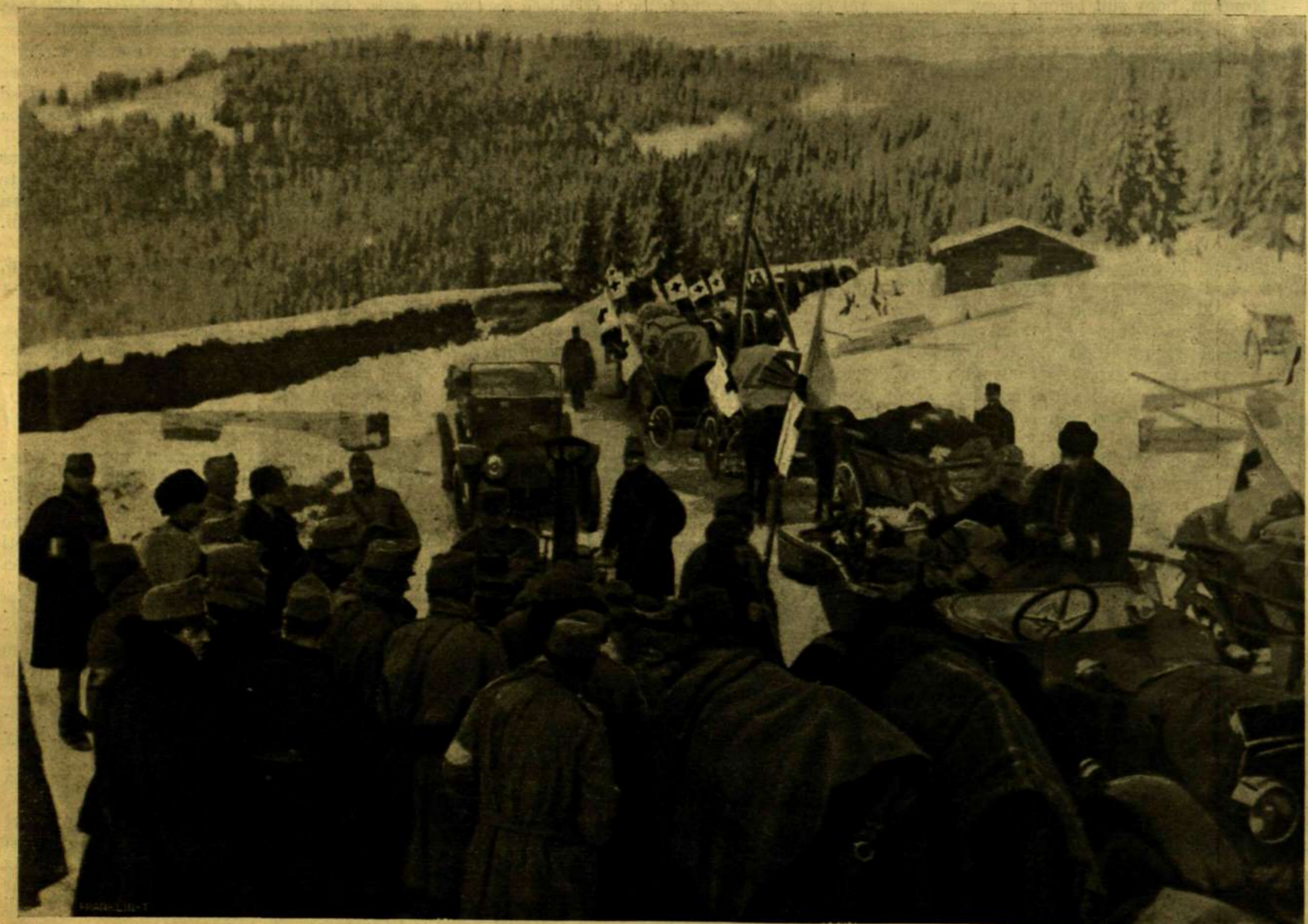
A VÖRÖS-KERESZT KÓRHÁZ MEGÉRKEZÉSE A PRILUP-NYEREGRE.