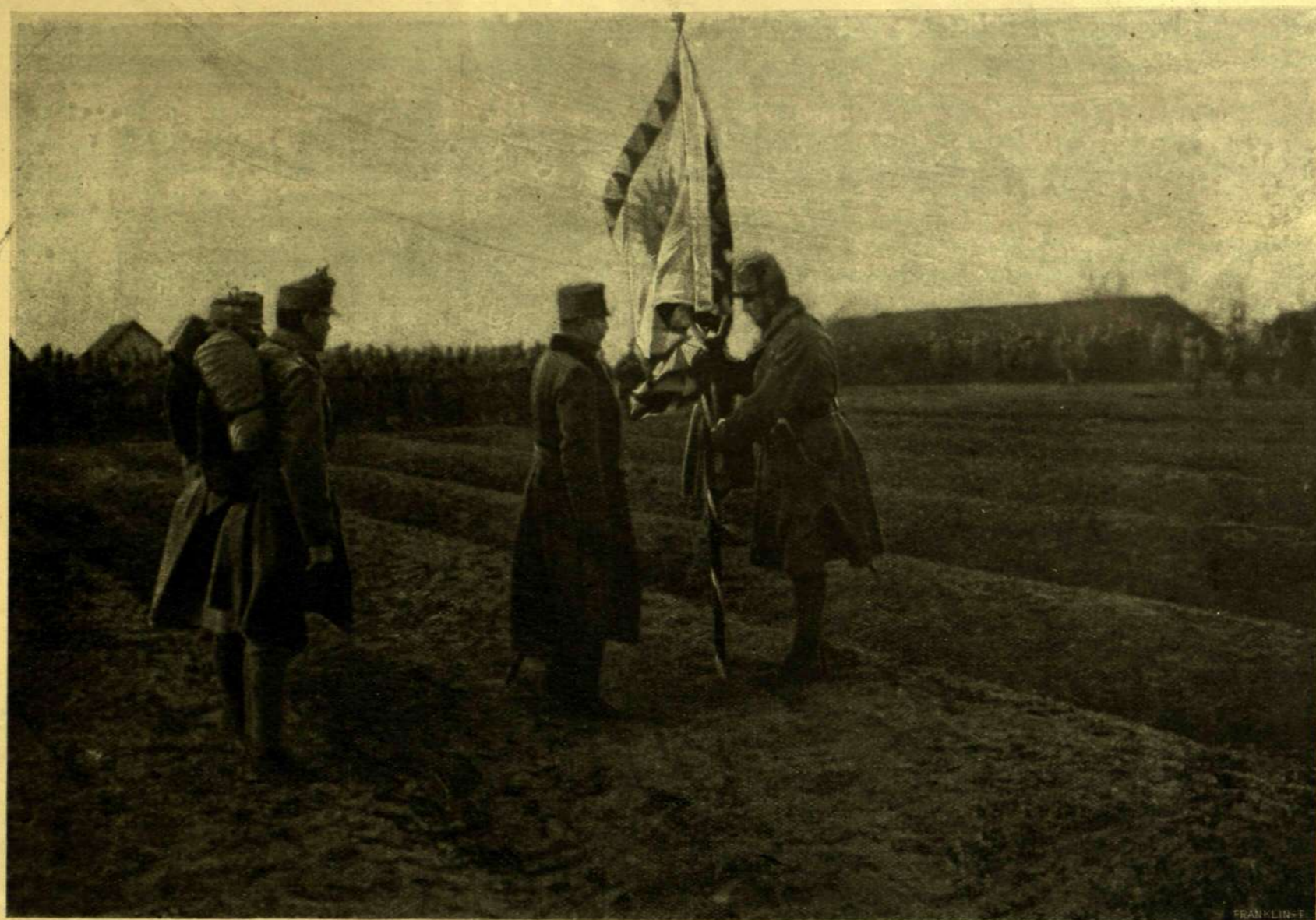
AZ EZREDPARANCSNOK ÁTADJA A TISZTHELYETTESNEK A ZÁSZLÓT.