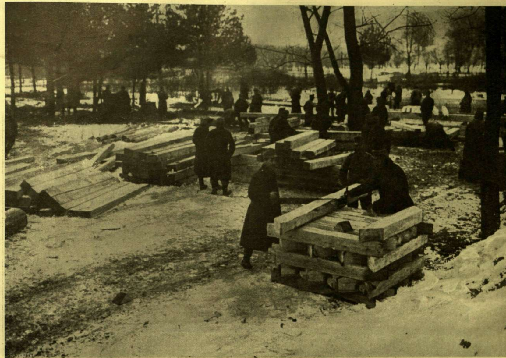
KATONA-ÁCSOK HÍDVERÉSHEZ KÉSZÜLNEK.