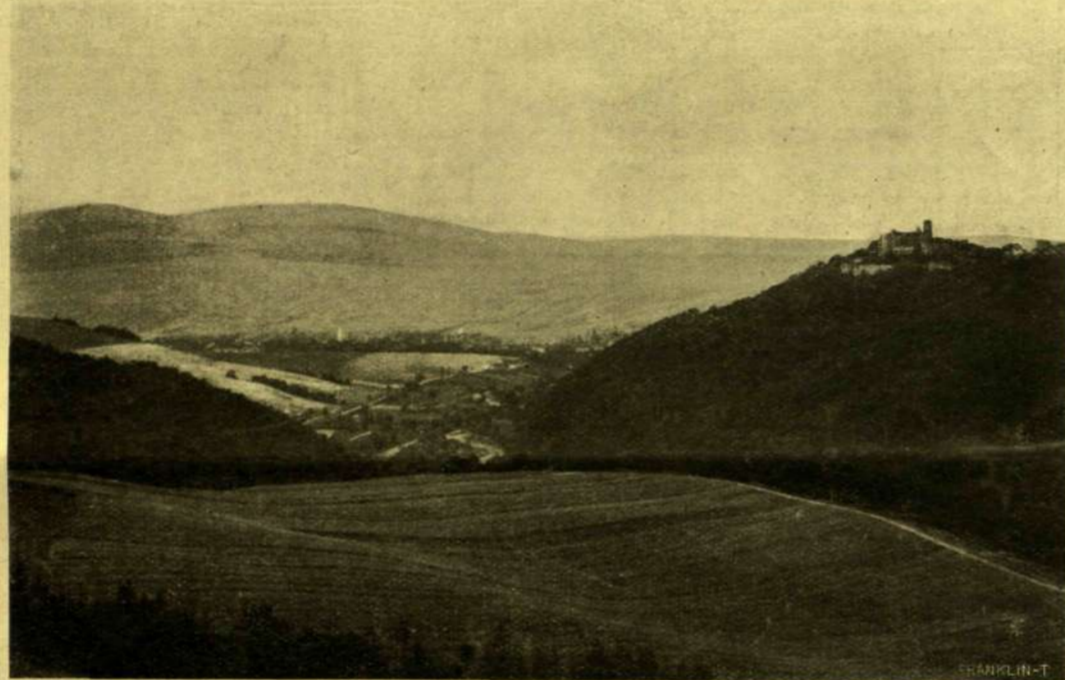
A ZBORÓI VÖLGY; JOBBRÓL A HEGYEN RÁKÓCZI VÁRÁNAK ROMJAI.

XI. Lajos francia király az ő olasz háborújában már nagyobb számú ágyút alkalmazott, melyeknek egy részét Leonardo da Vinci, a híres festő és még híresebb mechanikus öntötte a számára. Ugyan e korban a mi Hunyadi Mátyás királyunknak is voltak ágyúi, még pedig olyanok, a melyek idehaza készültek. Több városunkban volt ágyúöntő műhely, így Budán, Pezsonyban, Bártfán, Kassán és Brassóban. Ez utóbbi városból a megmaradt számadási könyvek azt is megtartották részünkre, hogy mennyibe került