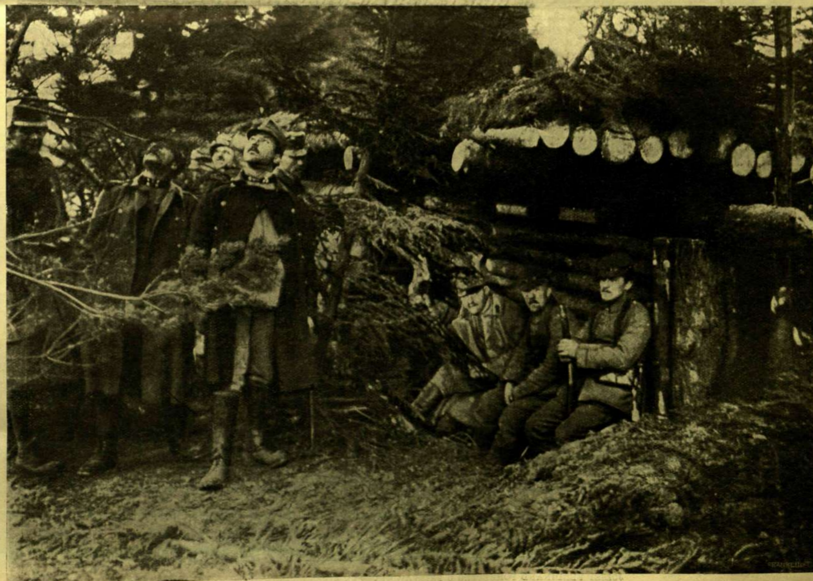
JÖN AZ ELLENÉGES REPÜLŐGÉP.