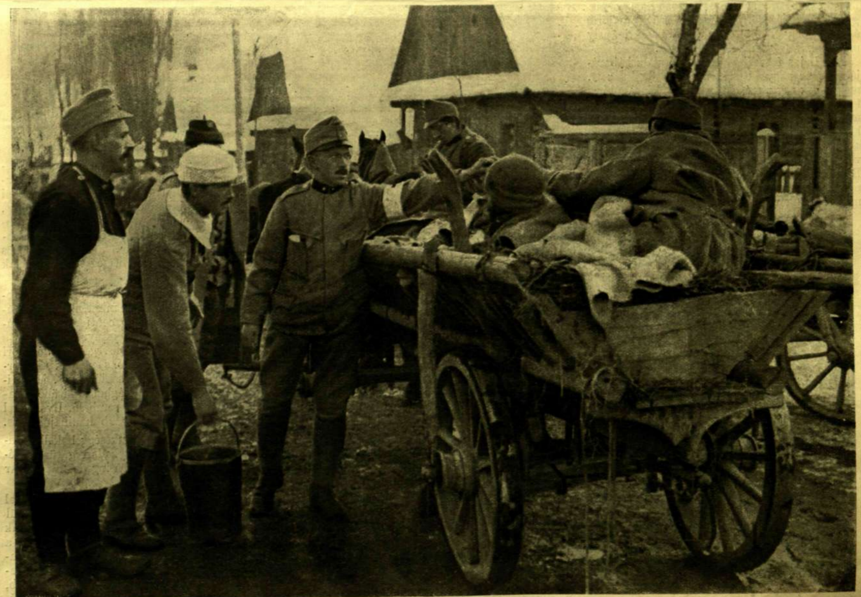
FRISÍTŐ ÁLLOMÁS KIRLIBABÁN.