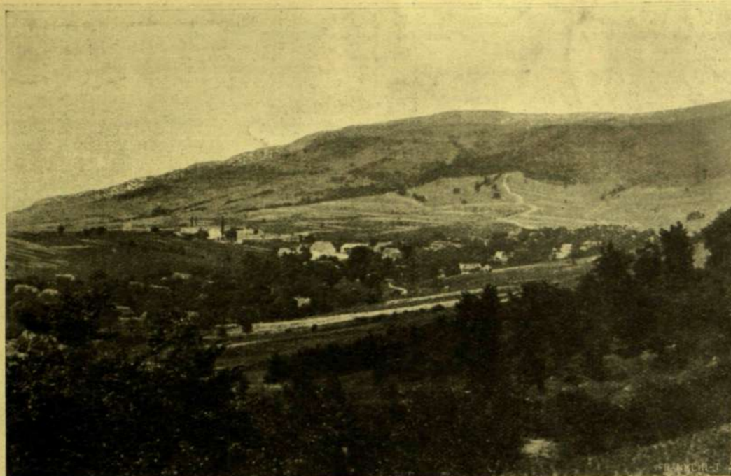
A CERNA HORA VÍZKÖZ ALATT, TÖVÉBEN RÓNA KÖZSEGGE.