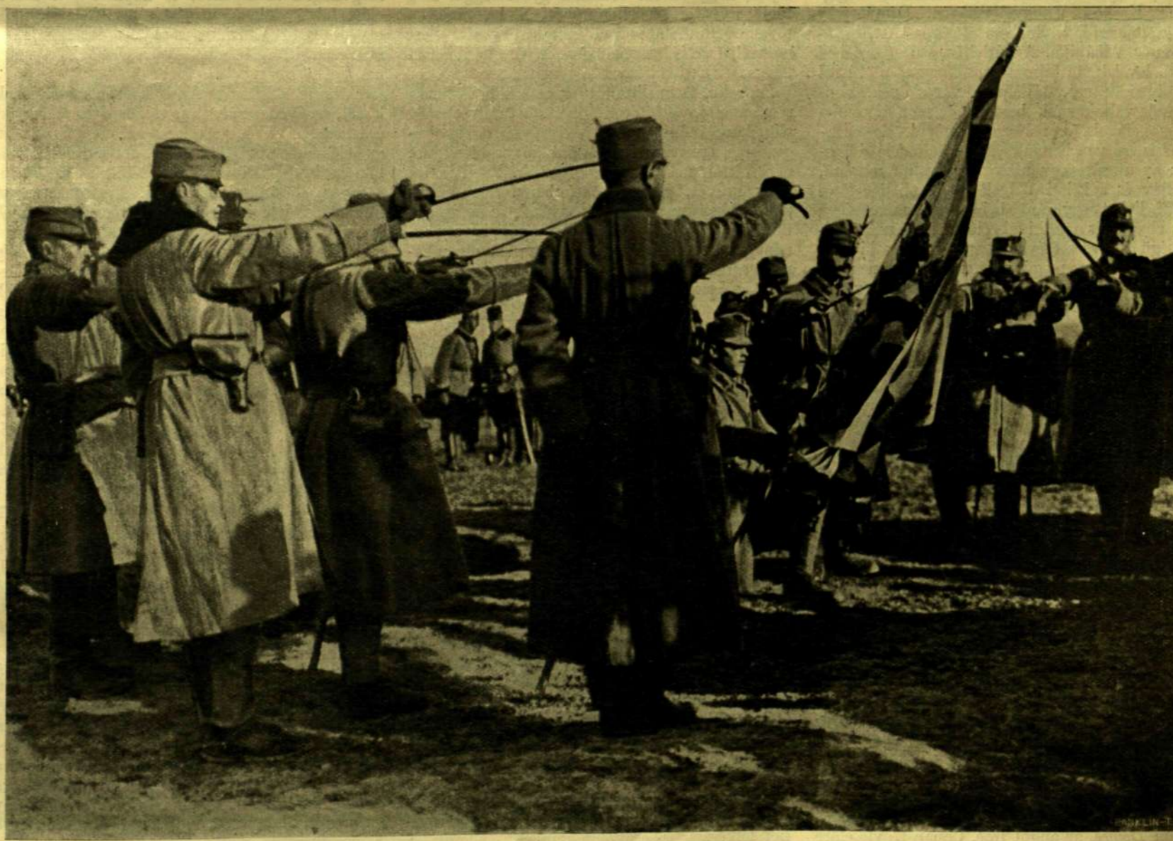
AZ EZRED TISZTJEI FÖLESKÜSZNEK AZ ÚJ ZÁSZLÓRA.

A 2-IK TIROLI VADÁSZEZRED ZÁSZLÓT KAPOTT Ő FELSÉGÉTŐL, MELYET A CSATATÉREN SZENTELTEK FÖL.