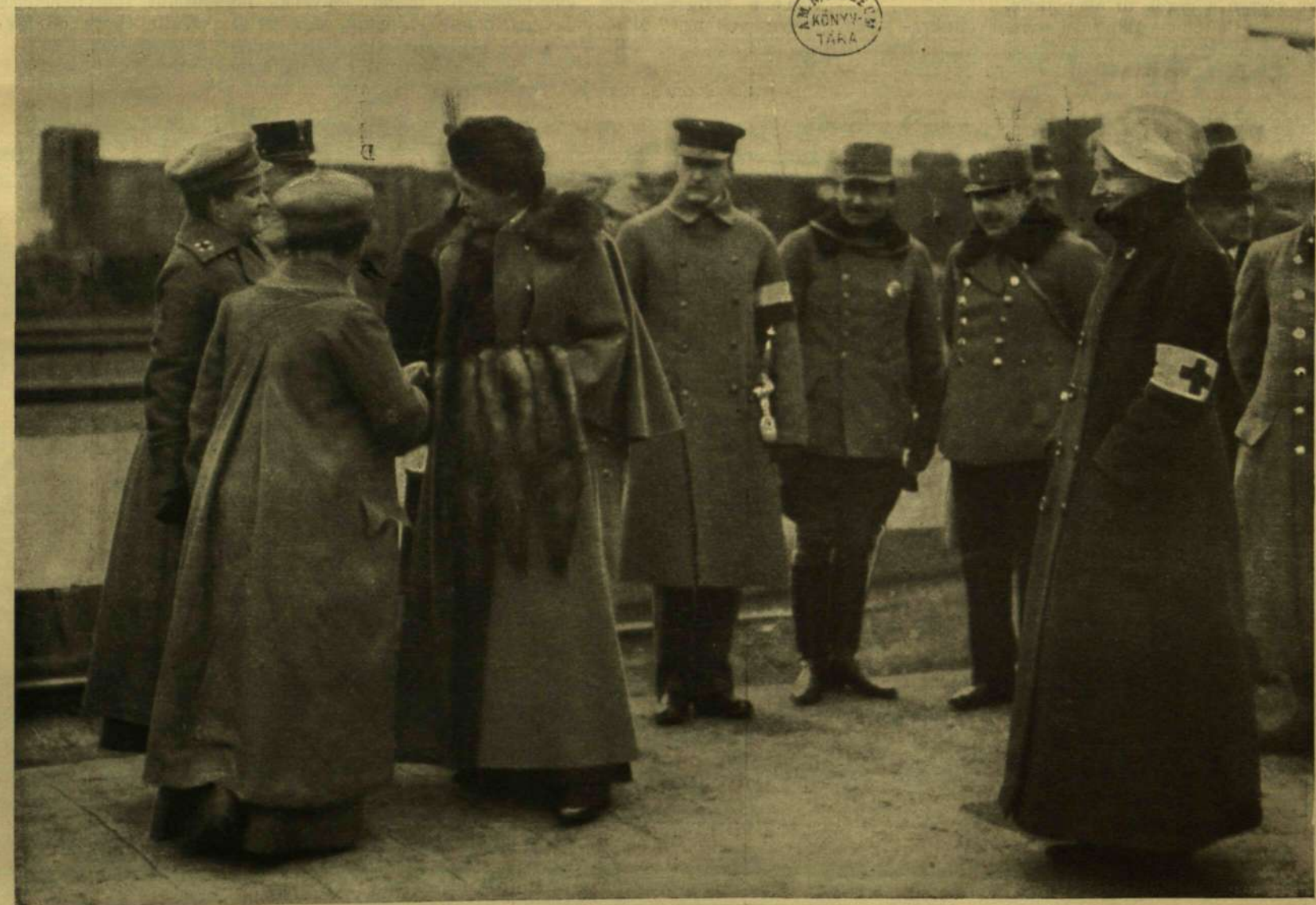
A KIRÁLYNÉNÁK BEMUTATJÁK A KÓRHÁZ-VONAT SZOLGÁLATÁBAN ÁLLÓ HÖLGYEKET.

És milyen szép volt minden, milyen nyugodt, milyen egyszerű... Főként ezt köszönöm neked Istenem, kinek köszönök mindent és kihez jó akarok maradni a házasságban is... Gyermekek maradhassanak mindig, még ezt kérem Tőled, a Tiéd, két anyám gyermeke és két halott apámé is. (Folytatása következik.)