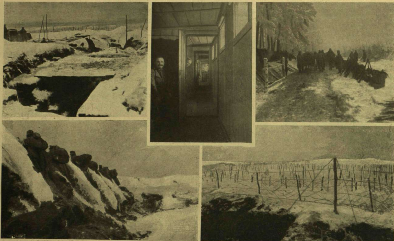
1. Havat lapátolnak a lövészárokból. — 2. Egy dandárparancsnokság földalatti palotája. — 3. Borkiosztás. — 4. Orosz támadás visszaverése. — 5. Az áttörhetetlen drót-akadályok.

A KELETI HADSZÍNTÉRRŐL.