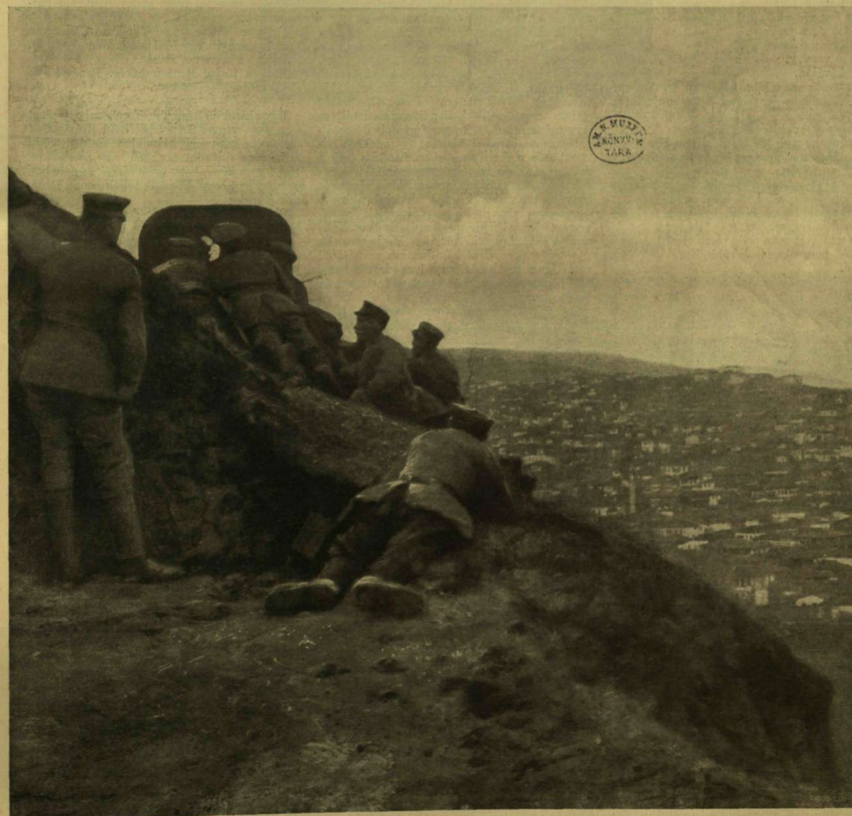
NÉMET GÉPFEGYVER-OSZTAG EGY MACZEDÓNIAI HATÁRHEGYEN.

Külföldi előfizetésekhöz a postai meg- határozott viteldíj is csatolandó.