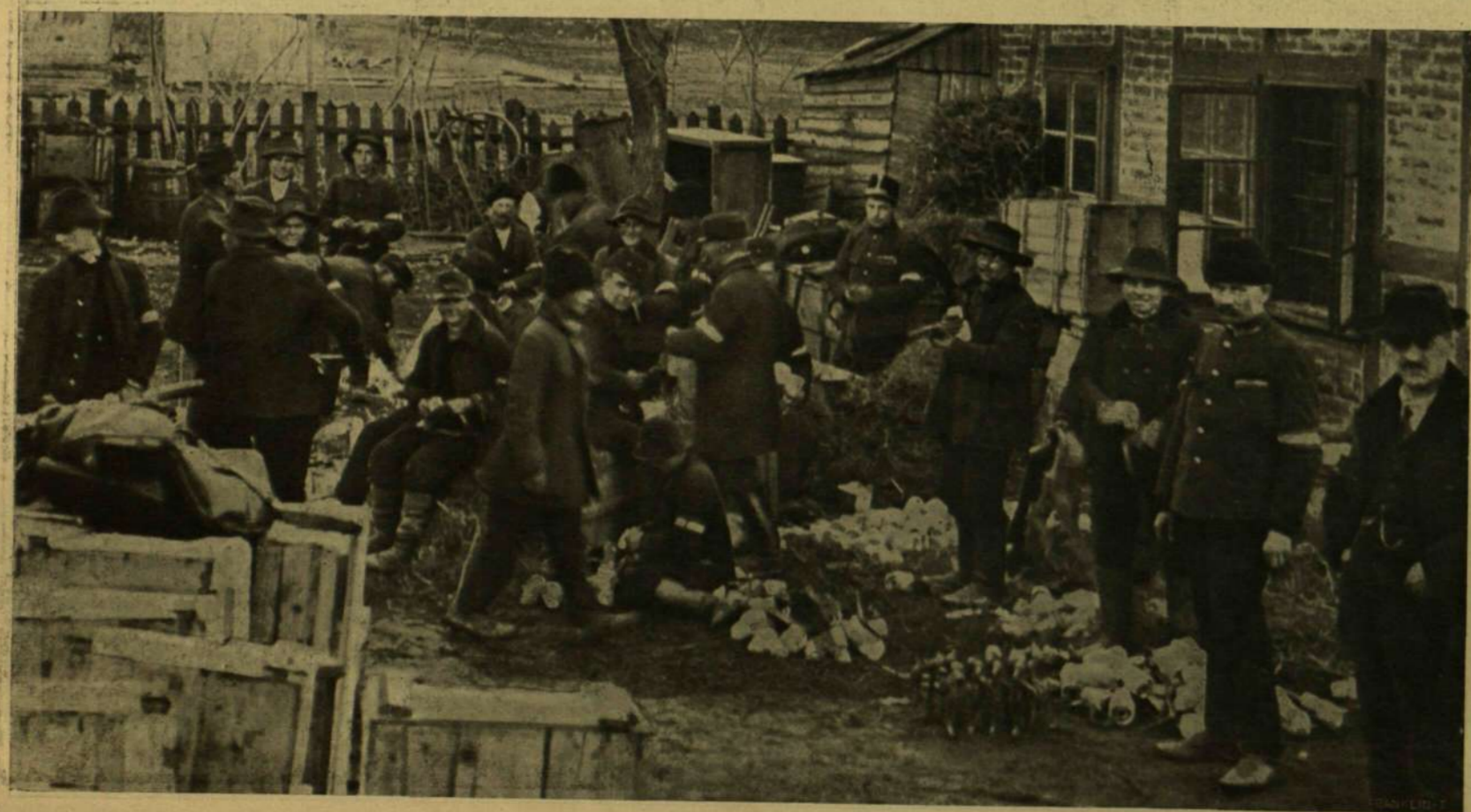
MAGYAR TÁVIRÓ-ÉPÍTŐ CSAPATOK BELGRÁDBAN A BELGRÁD-SZÓFIAI VONAL RENDBEHOZÁSÁRA INDULNAK.