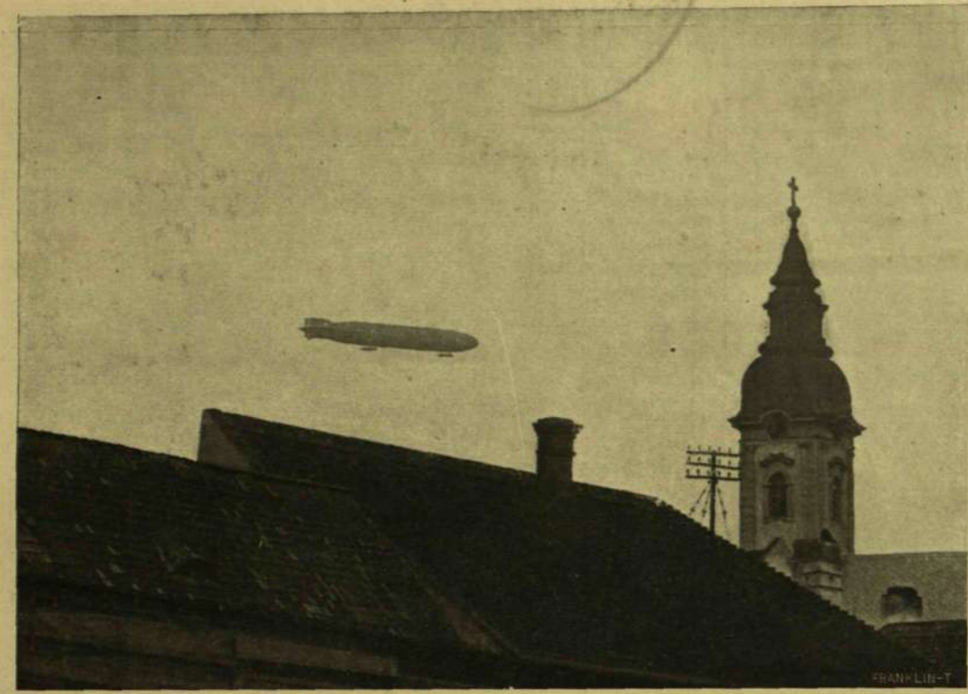
ZEPPELIN LÉGHAJÓ SZEGED FELETT.

között, szabad érintkezés lehetősége nélkül, de annál inkább vágyódott, hogy teljesen nyugalomban lehessen, a közelgő boldogságról álmodva. Még az utolsó percben is szeretett volna otthon maradni otyajáság félelem fogta őt el; de hisz most már csak arról volt szó, hogy még néhány órát várjon, aztán új nap hajnalodik számára. Holnap reggel Erich el fog jönni, azt tudta egészen bizonyosan.