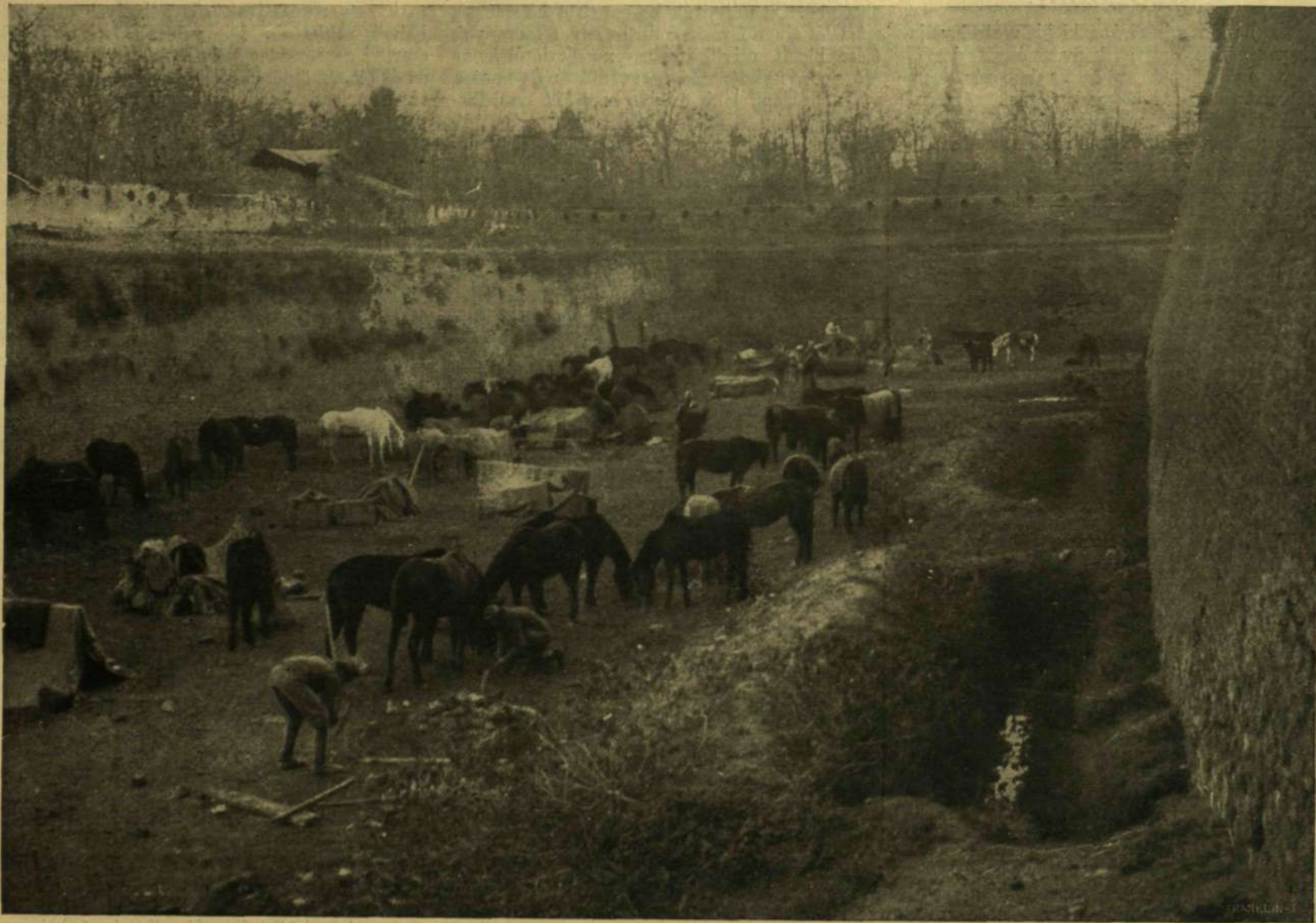
HEGYI TRÉN-OSZLOP A BELGRÁDI VÁRÁROKBAN.