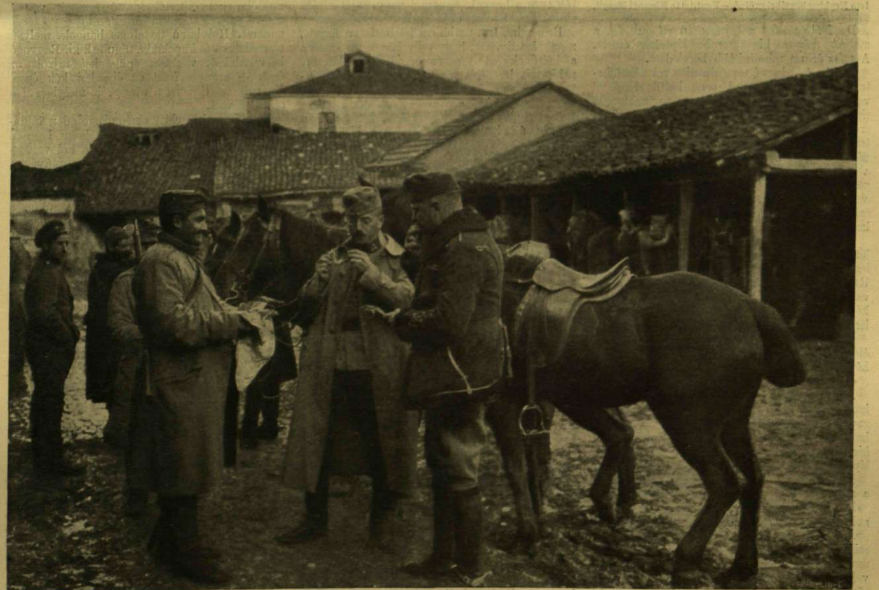
TISZTJEINK EBÉDJE KUMANOVO UTCÁJÁN.

A BALKÁNI HADSZINTÉRRŐL.