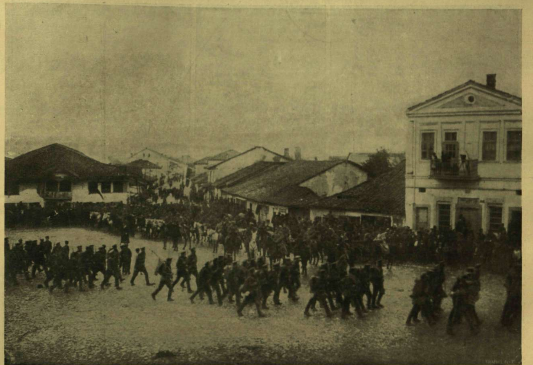
A GYŐZTES BOLGÁR CSAPATOK BEVONULÁSA KUMANOVÓBA.

A BALKÁNI HADSZINTÉRRŐL.