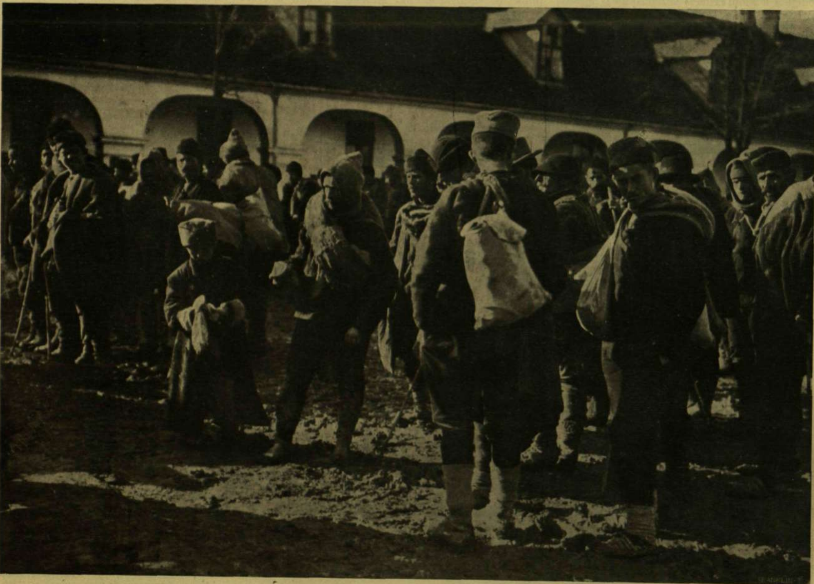
MONTENEGRÓI ÉS SZERB HADIFOGLYOK.

A BALKÁNI HADSZINTÉRRŐL. — Balogh Rudolf, a harostérre kiküldött munkatársunk felvételei.