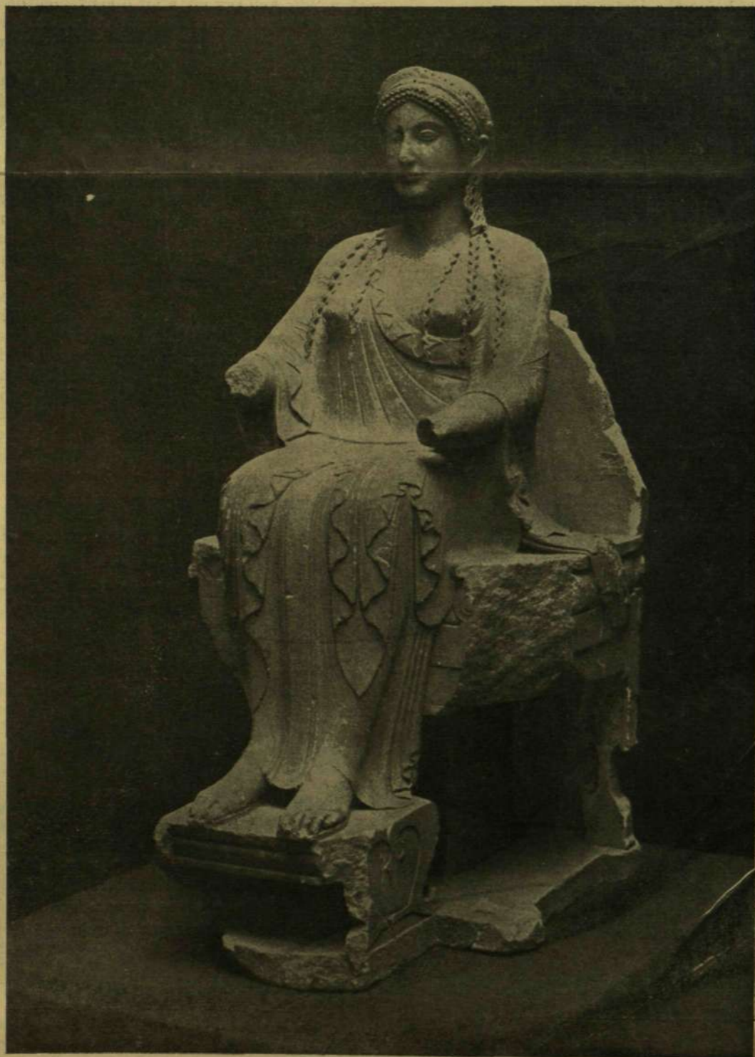
GÖRÖG ISTENNŐ ÚJONNAN TALÁLT SZOBRA, MELYET MOST SZERZETT MEG A BERLINI MUZEUM.