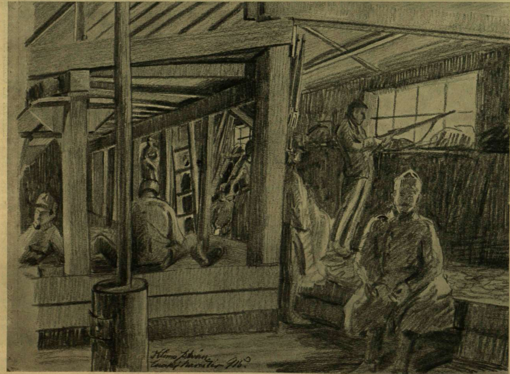
EGY JÓL ELKÉSZÍTETT SZÁLLÁS. — Klimó István rajza.