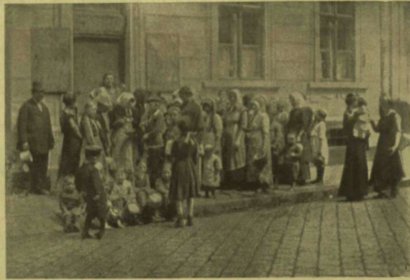
A tejesbolt előtt.

BUDAPEST ÉLELMÉZÉSE. — VÁRJÁK AZ ÜZLETEK KINYITÁSÁT S AZ ELÁRUSÍTÁS MEGKEZDÉSÉT.