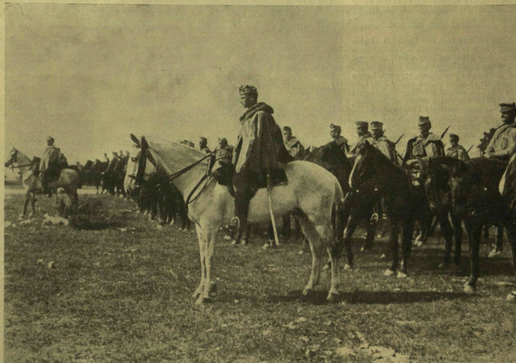
KÁROLY MIRSA FŐHERCEG FŐHADNAGY, A TRÓNÖRÖKÖS ÖCSUCE.