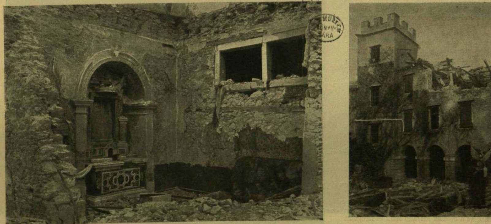
A KASTÉLY KÁPOLNÁJA.