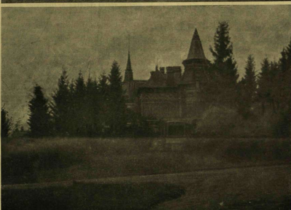
Földalatti tiszt lakás. — A bialovicki czári vadászkastély.