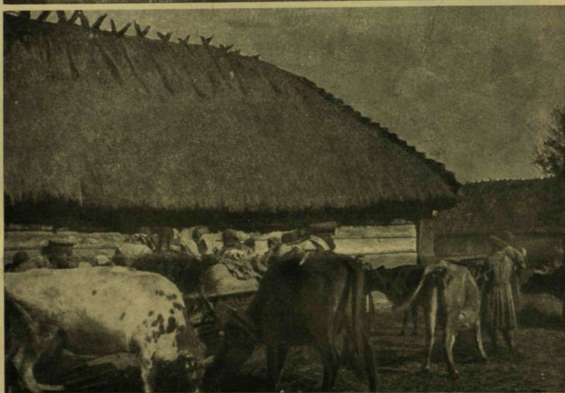
Régi toronyvár. — Orosz menekültek Kolkiban.