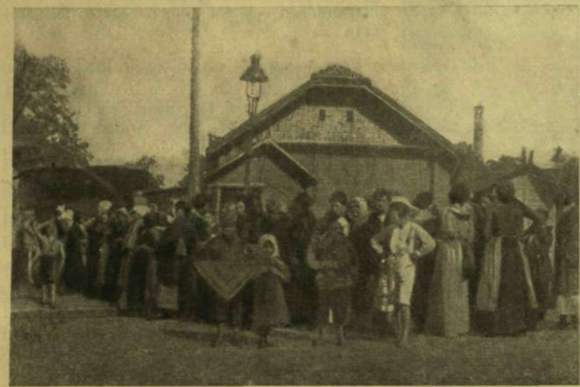
A községi zsírásítás előtt.