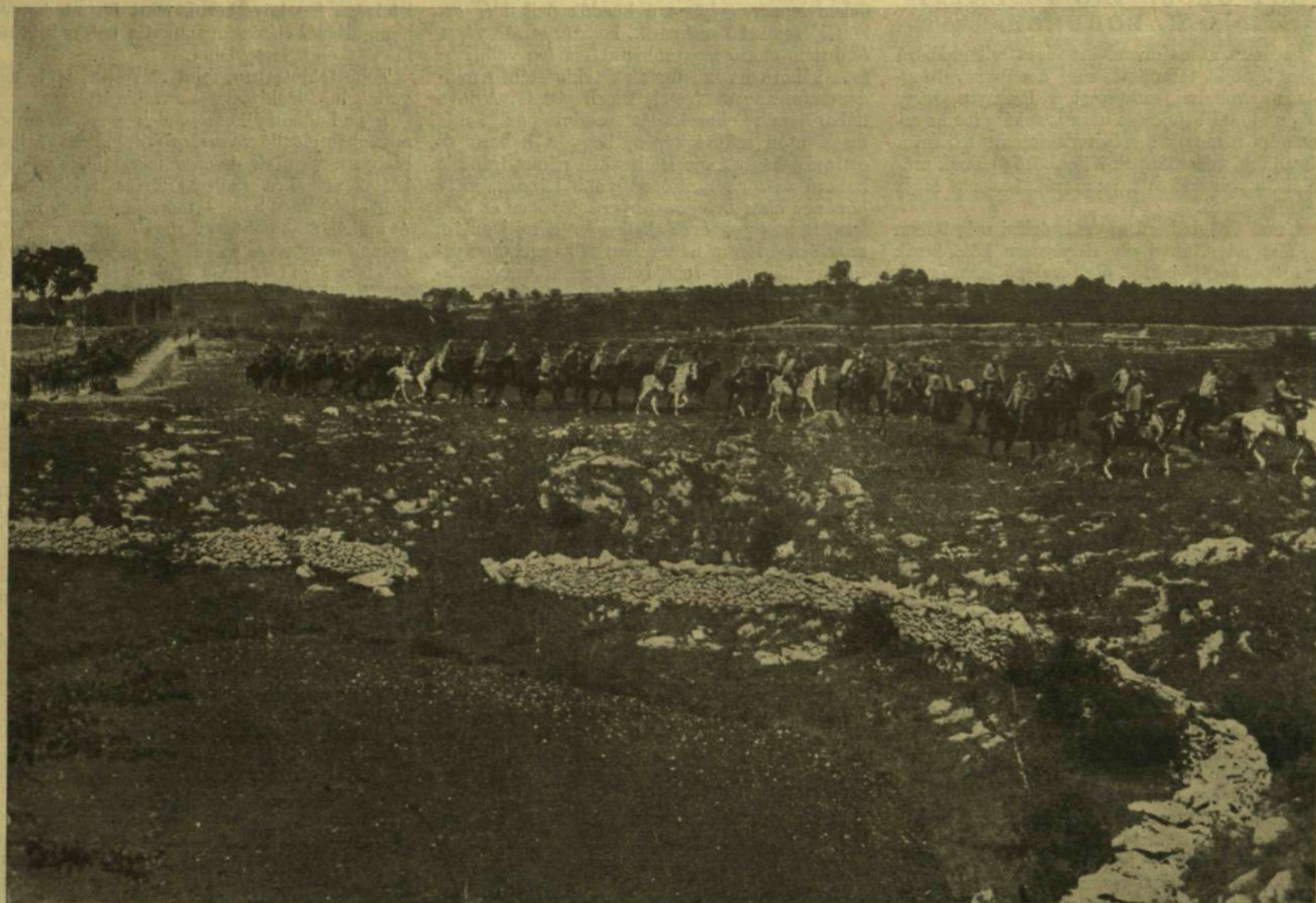
ULÁNUSOK A KARSZTBAN.