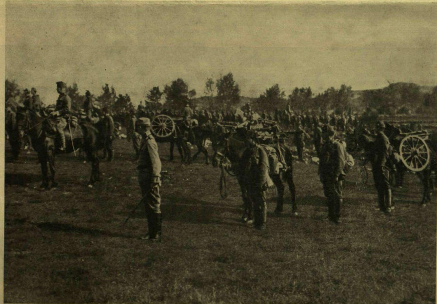
HEGYI ÁGYÚK ÚTRA KÉSZEN.

AZ OLASZ HARCZTÉRRŐL.