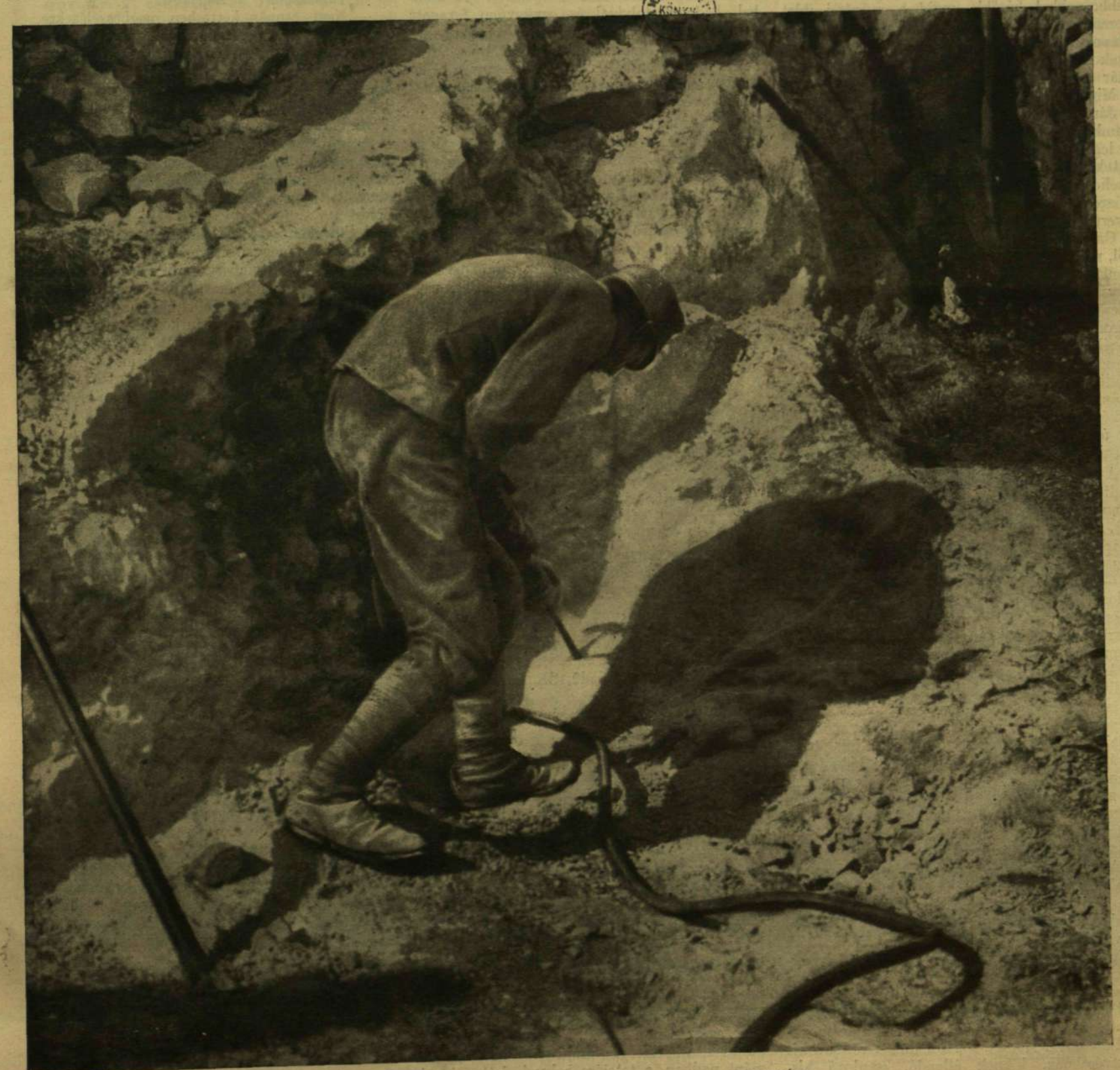
FEDEZÉK-CSINÁLÓK FÜRÖGÉPPEL DOLGOZNAK A KARSZT SZIKLÁIN.

Külföldi előfizetésekhöz a postailag meg- határozott viteldíj is csatolandó.