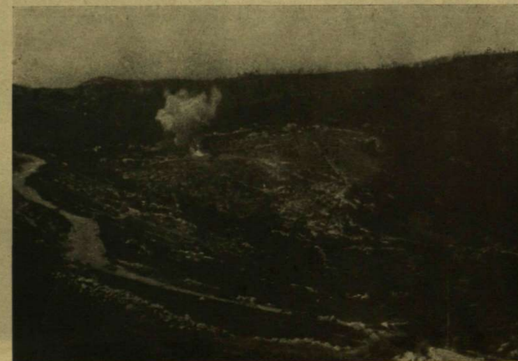
GRÁNÁT CSAP LE A TÜZVONAL MÖGÖTT.