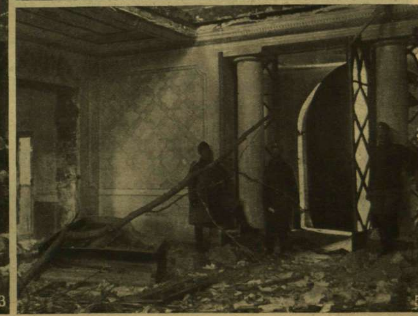
1. Kórház, melyet az olaszok összelöttek, bár vörös kereszttel volt jelölve. — 2. Oszelött ház. A város házainak nagy része ilyen állapotban van. — 3. A Piazzetta templom belseje az olasz bombázás eredményeivel. — 4. Gránátok nyomai a Castello falán. — 5. Egy kastély előcsarnoka a város mellett.

MILYEN ÁLLAPOTBAN KERÜLT GÖRZ AZ OLASZOK KEZÉRE. — Balogh Rudolf, a harcstérre kiküldött munkatársunk felvétele.