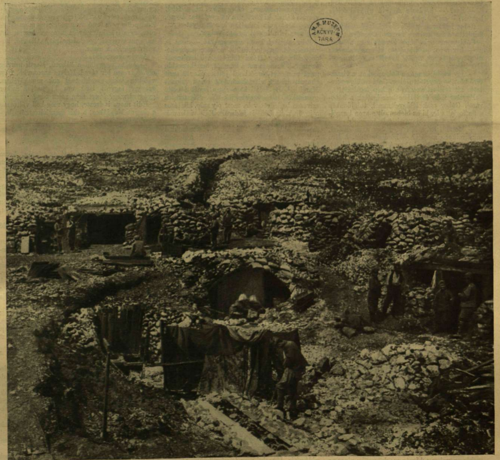
TARTALÉK FEDEZÉKEIBEN, A KARSZT SZIKLAI KÖZÖTT.

Külföldi előfizetésekhöz a postai meg- határozott viteldíj is csatolandó.