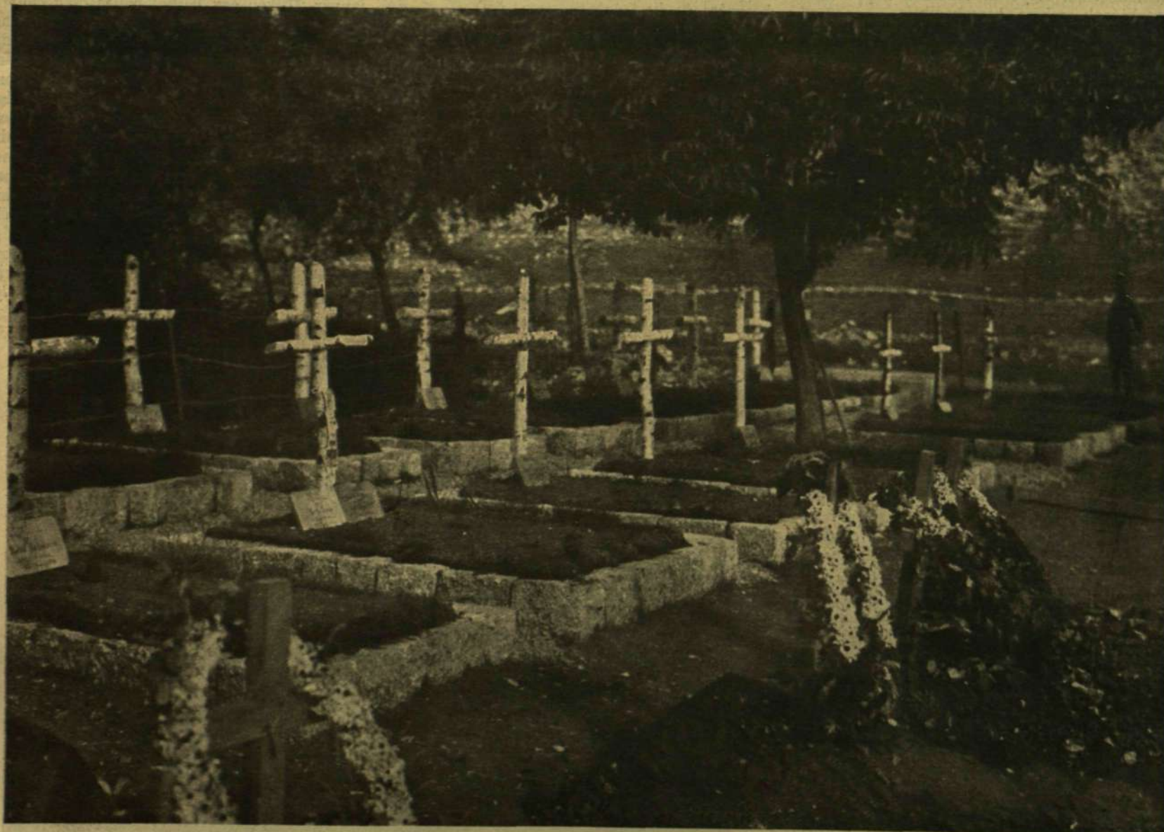
TEMETŐ A PLAVA TÖVÉBEN.

AZ OLASZ HARCTÉRRŐL. — Balogh Rudolf, a harcstérre kiküldött munkatársunk felvétele.