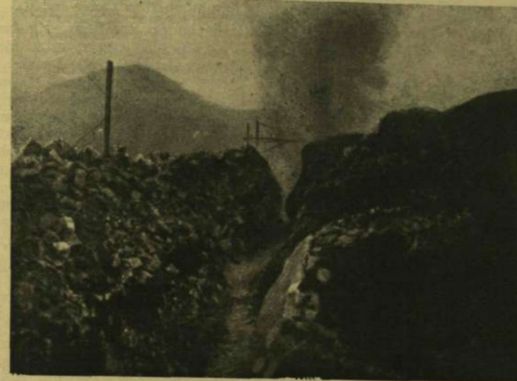
GRÁNÁT CSAP BE A FUTÓÁROKBA. — AZ OROSZ GŐZHENGER: FOGOLY OROSZOK UTAT HENGERELNEK BARAKTÁBORUKBAN.

Cécile melyet lélekzett, mikor teljesítette apja parancsait. Aztán egyedül maradt és szegény, sokat szenvedett fiatal szíve ismét belevonszolódtott a bolond kavargásba. Úgy látszott, az