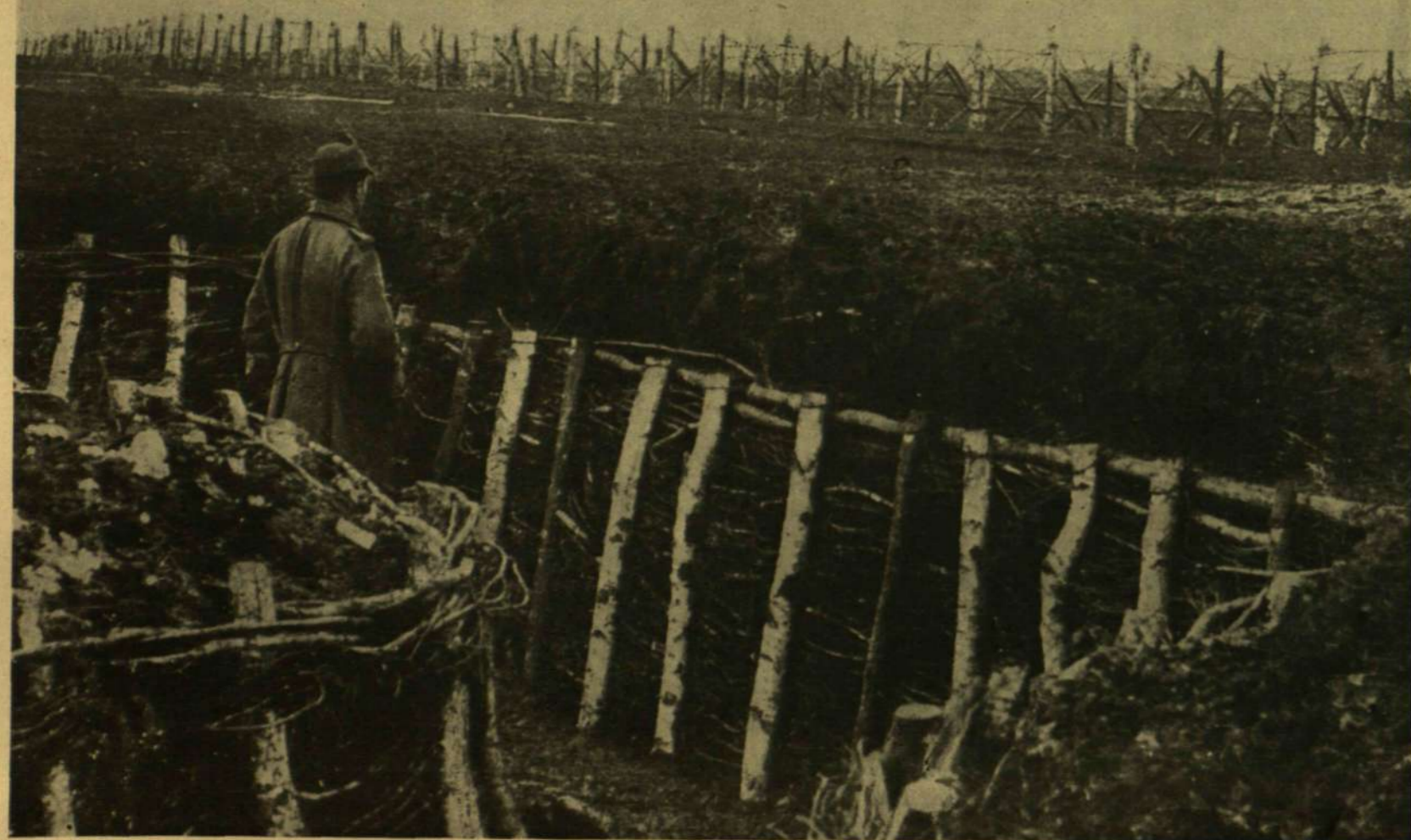
ŐRSZEM A LŐVÉSZÁROKBAN. ELŐL DRÓTSÖVÉNYEK ÉS SPANYOL LOVASOK. — Deutsch féltetei.

Dehát persze, ha az embernek ropog minden esontja a köszvénytől, akkor végre is örülnie kell, hogy a kancsó sőre mellett ülhet s nem kell