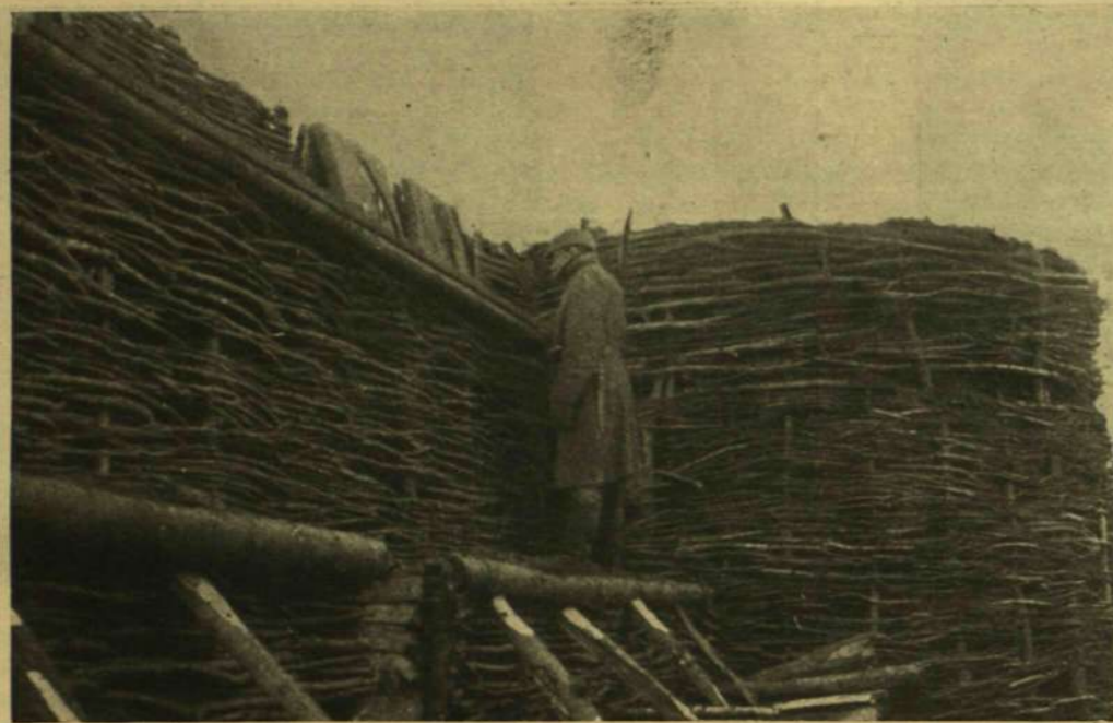
EGY JÓL KIÉPÍTETT ÁLLÁS RÉSZLETE. — Szántó főhadnagy felvétele.

húsz fok Celsius hidegben a havas hegységben Bourbakira várnia.