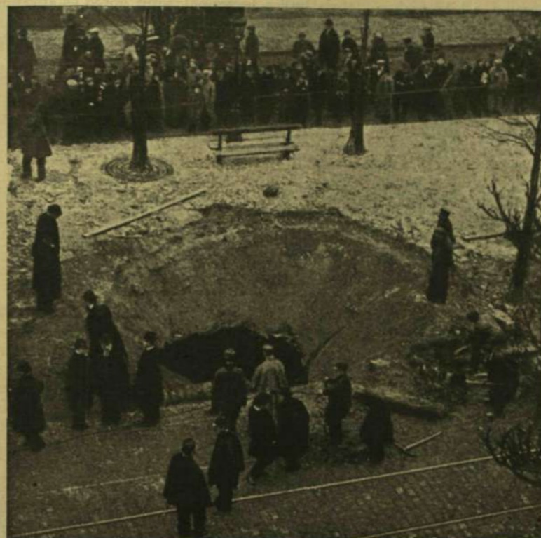
EGY ZEPPELINRŐL LEDOBOTT BOMBA HATÁSA PÁRISBAN; ÁTSZAKITOTTA A FÖLDALATTI VASUT BOLTOZATÁT S MOST MÉLY ÜREG TÁTONG A HELYÉN.

Nem lesz annyira szemünk előtt a másé, talán jobban meg tudjuk majd becsülni a magunkét. A magunkét, a melyet vérbullás özönében, áldozatok rettenetességében tartottunk meg. Jobban meg fogjuk becsülni fegyverrel fenyegetett és fegyverrel megtartott országunk szépségeit, véres verejtékkel megteremtett kulturánk áldásait, mindazokat a szépségeket és örömeiket, a melyeket itthon megkaphatunk. S ha majd megint megnyílnak valamikor a sorompók — nemcsak a politikaiak, hanem a lelkiek is — akkor ezzel a megerősödött otthon-érzéssel fogjuk fölkeresni a külföldet s nem fogjuk olyan könnyen az itthoni jókkal való elégedetlenség szellemét hazahozni utazásainkból.