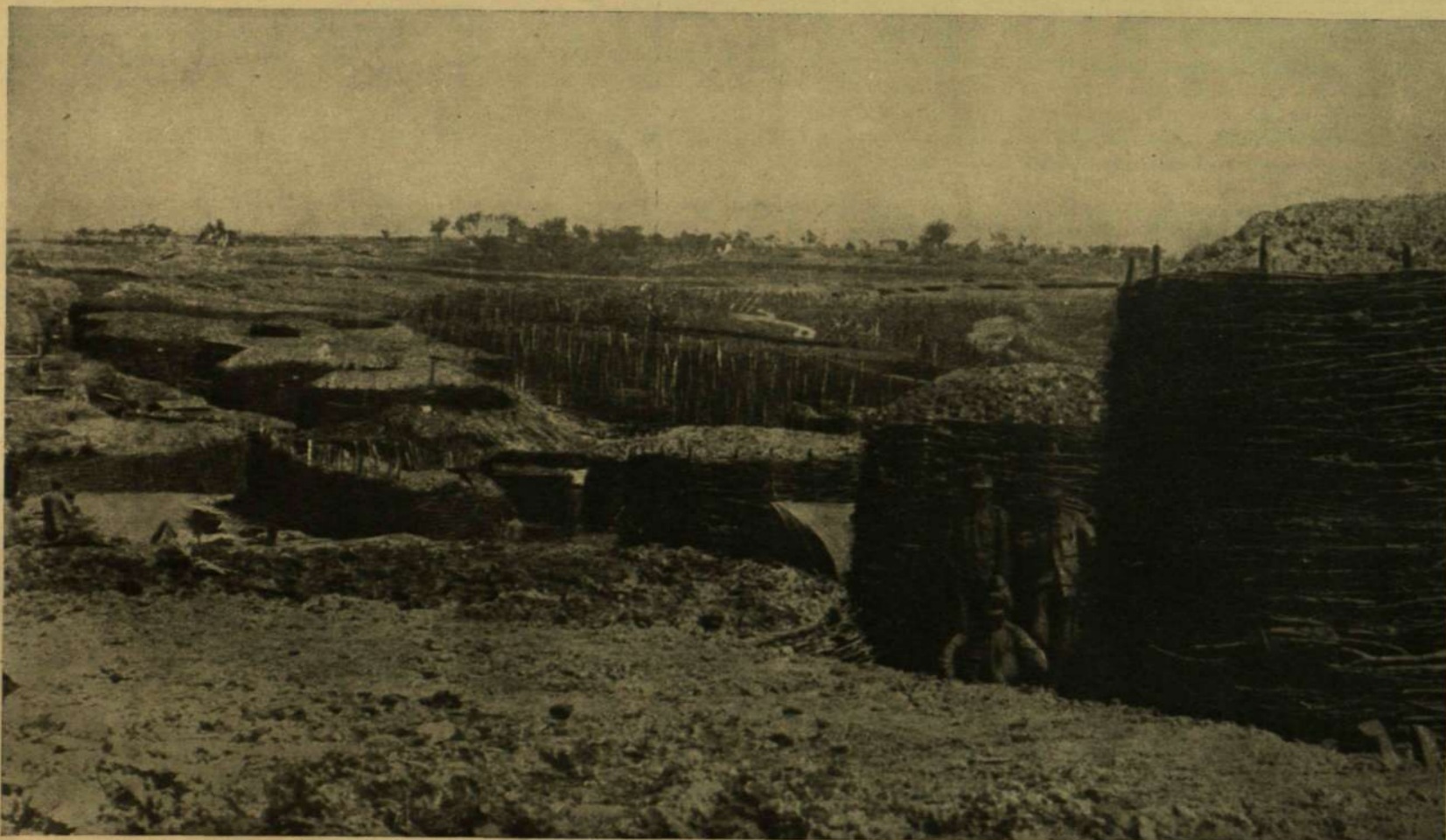
LÖVÉSZÁROK ÉS FUTÓÁROK RENDSZERE A MOCSARAK KÖZÖTT.