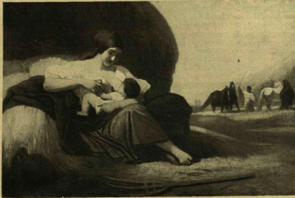
Lotz Károly: Nyár.