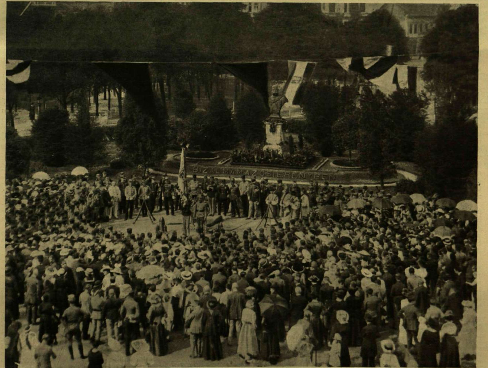
TISZTAVATÁS A LUDOVIKA AKADÉMIÁBAN A KIRÁLY SZÜLETÉSE NAPJÁN.

Cécile egy darabig némán figyelve állt mellettük. Ügyilátszik, a most érkezett leány arra kérte a barátját, segítsen neki, hogy megértse magát, a francia sebesülttel, a ki még Cécile számára is nehezen érthető tájnyelven beszélt — talán provánszi volt — s keservesen igyekezett sebesült karjainak nehezes gesztusaival megmagyarázni a két nőnek,