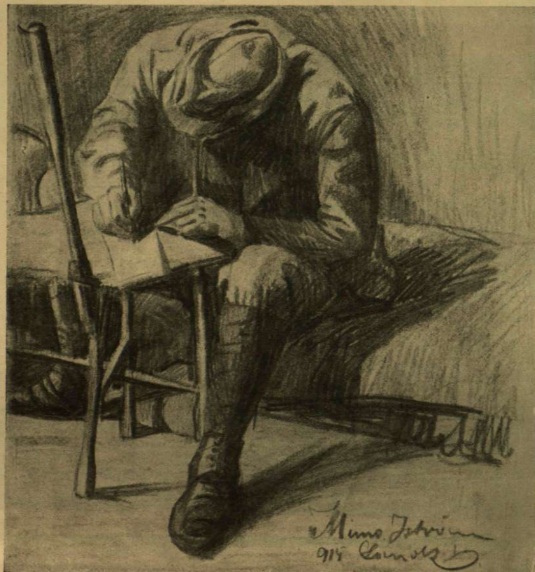
LEVÉL HAZA. — Klimó István rajza.