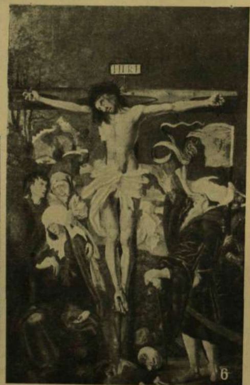
3. Kolosvári Tamás: Jelenet Sz. Miklós püspök életéből (1427). 4. M. S. mester: Krisztus útja a Kálvária (1506; Hont-Szentantálról). 2. Kolosvári Tamás: Krisztus a keresztén (1427). 1. Szent János-túl: (XV. sz.; Garamszentbenedekről). 5. Kolosvári Tamás: Jelenetek Sz. Benedek és Sz. Egyed életéből (1427). 6. M. S. mester: Krisztus a keresztén (1506; Hont-Szentantálról).

RÉGI MAGYAR FESTŐK AZ ESZTERGOMI PRIMÁSI KÉPTÁRBAN.