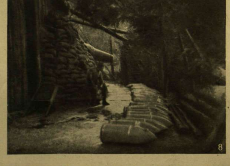
1. Piazza látkepe. 2. Drótkötél-pálya készítése az olasz harctéren. 3. Sátortábor Albániában. 4. Csapatunk Volhyniában álarccezel arcukon gáztámadást várnak. 5. Kerékpáros őrzőjárat átmászik egy kert falán. 6. Szállító osztagok. 7. Orosz gáztámadást várnak Volhyniában. 8. Offenzívánk alkalmával az olaszoktól elfoglalt 28-as mozsarak.