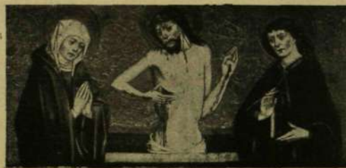
A jánosréti oltár mestere: Predella-kép.