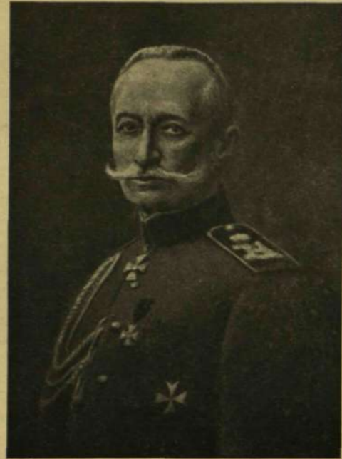
BRUSZILOV TÁBORNOK, AZ ELLENÜNK FOLYÓ OROSZ OFFENZÍVA VEZÉRE.

Két esztendő óriási véráldozatának tapasztalatai kellettek hozzá, hogy az orosz hadvezetés felismerje e népháború legdöntőbb tényezőjét: azt, hogy minden nemzet hadseregeinél a nemzeti tulajdonságoknak, a nemzeti temperamentumnak megfelelő módon kell alkalmazni a stratégiát és taktikát. Az orosz hadvezetés számára a legsúlyosabb probléma volt: hogyan lehet ellensúlyozni a tömegek lomhaságát. A többi, nem kevésbé fontos feladatot: az offenzíva organizálását, a műszaki kiképzést, a front mögötti szolgálat pontosítását, a hadiszerekkel való ellátást elvégezte