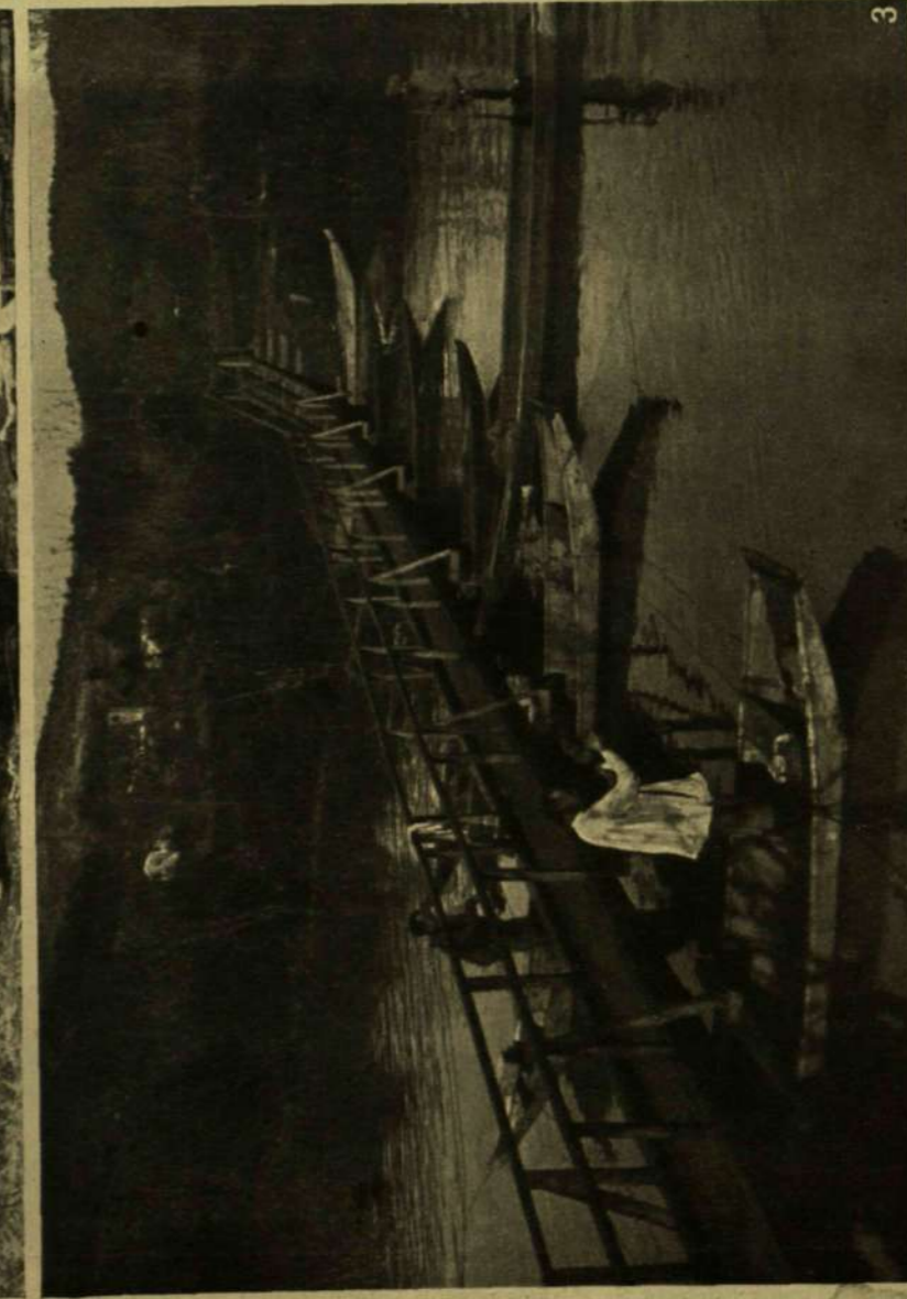
1. A tábori rabbi rituális könyvéje a harsztéren. — 2. Figyelő órs a Monte San Michelen. — 3. Rögözött híd. — 4. A Bourbonok koronája Görzben. A korona a Bourbon-család kriptájában van s az ór szívesen mutogatja katonáinknak. — 5. Balogh Radófi, a harsztéren kiküldött munkatársunk fértéle.