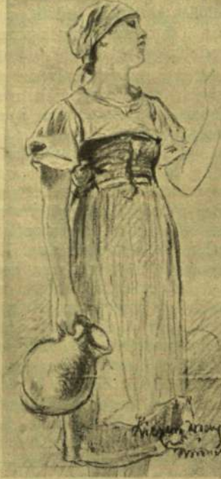
Liezen Mayer Sándor: Tanulmányrajz.

jellegzetesen mutatja be a mester eszményítő természeti felfogását, míg Ferenc fia révén a primári képtárba került két vázlatkönyve művészetének kulisszatitkaival ismert meg s elárulja, hogy mily gondos tanulmányokat végzett tájképeinek odavetett apró alakjaihoz. Orlai Petrics egy kis képe Petőfivel való barátságának meghatározó emléke, egy nagyobb kompozíciója pedig a hivatott történeti festőt juttatja szóhoz. Ligeti Antal négy monumentális tájképe igazi «grand art»; jobbat e nemből seholsem festettek akkor Európában. Liezen Mayernek a képtár alapítójáról, Simorról készített arcképe és a Menekülest Egyiptomba, ill. Magyarországi Szt. Erzsébetet ábrázoló két nagy vászna is kiállja az összehasonlítást a