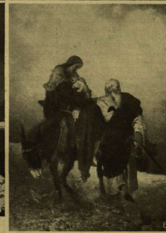
1. Id. Markó Károly: Eszményi tájkép (1847) 2. Szentgyörgyi János: Virágcsendélet. 3. Ligeti Antal: Betlehem (1874). 4. Molnár József: Templomi áhitat (1876). 5. Liezen Mayer Sándor: Simor János arcképe (1886). 6. Liezen Mayer Sándor: Menekülés Egyiptomba.

UJABB MAGYAR FESTŐK AZ ESZTERGOMI PRIMÁSI KÉPTÁRBAN.