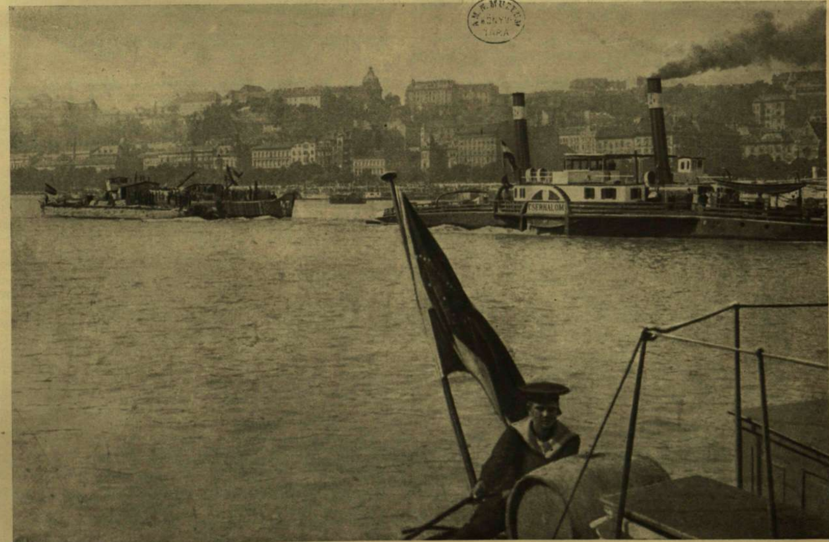
A TEMEST BUDAPESTRE VONTATJÁK. (AZ USZÁLYHAJÓ MELLETTI VILÁGOSABB SZÍNŰ HAJÓ A TEMES).

volna. Gyönyörködött benne, hogy kaphják el a bokrok nyurga vesszői a legkisebb szellőt is, csakhogy mozoghassanak. Sok apró örömet talált most is, de mindez beleszövődött félig jó, félig rossz hangulatába, a nyugtalanságba. Úgy érezte, a gyönyörűséget nem tudja kifejezni s nincs kívül megosztania s a lelkében halmozódó szeretet idővel talán önmagában hal el, talán nemskóra megfakulnak kincsei, mert valójában egyedül van. Így érzi, bár meleg otthonban és egy sereg gyermek közt él, valójában senkije sincs. Most gondolt először arra a különbségre, a mit eddig nem vett tudomásul, az idegen és a saját gyermek között. Arra, a ki az övé egészen, s azé is, a kit nagyon szeret. De nincs ilyen, Vilnovszkij igazán gyermekálmom, ahnak kell hogy tekintse egy ilyenkorú nő. Az ilyet csak egészen titkosan gondolta el, csak Margitnak súgta meg, ki a régi, várakozó szemű kis Edit-nék láthatta most is. (Folytatása következik)