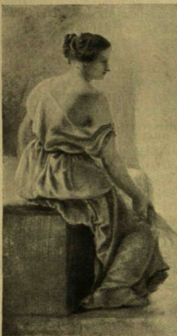
Id. Markó Károly: Tanulmányrajz.