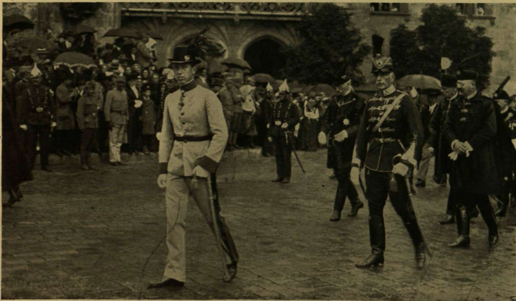
AZ IDEI SZENT ISTVÁNNAPI KÖRMENETRŐL. — ALBRECHT FŐHERCEG, A KIRÁLY KÉPVISELŐJE A MENETBEN.