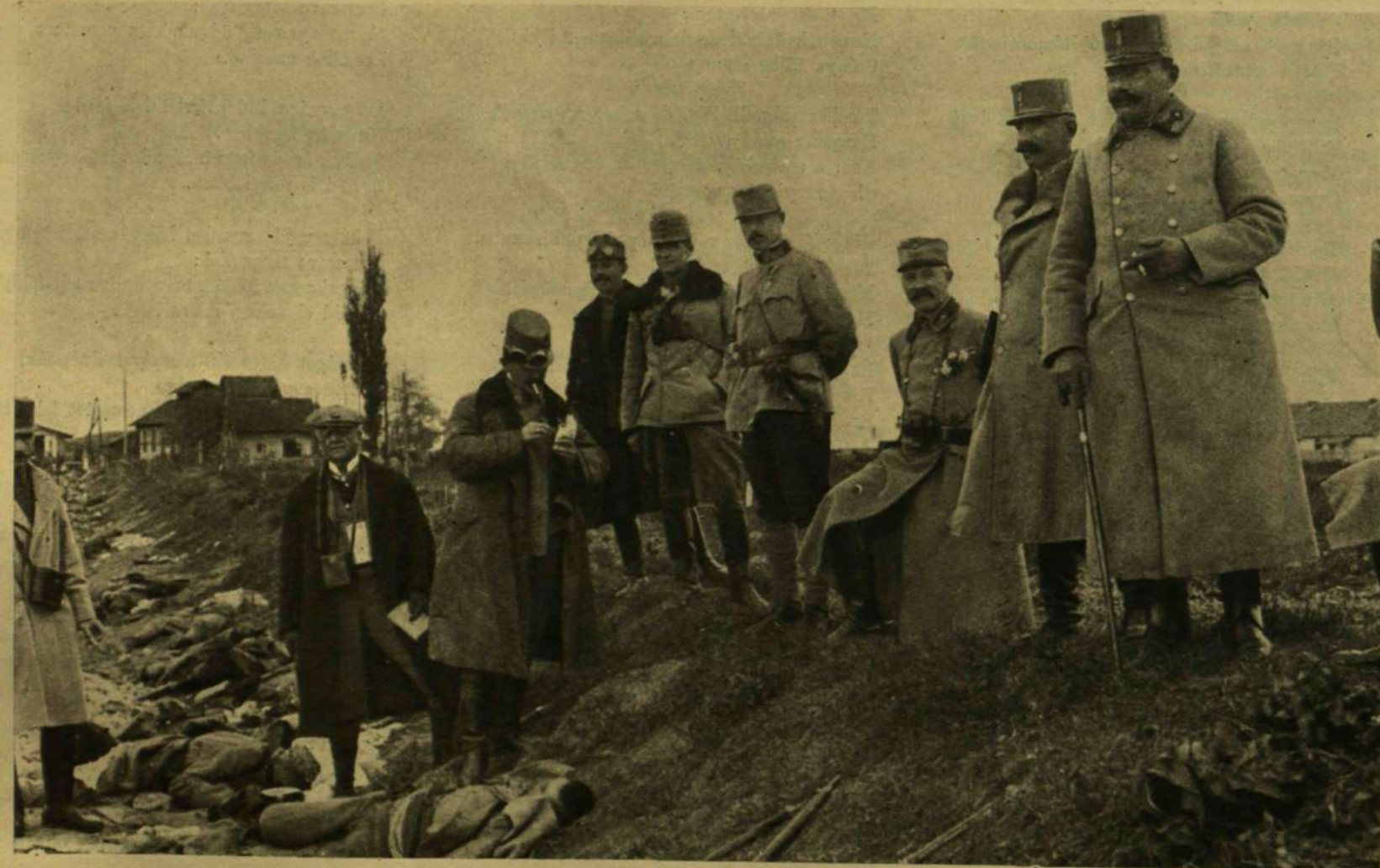
TANÁRKY TÁBOROK TÖRZSKARI TISZTJEIVEL A BRASSÓI CSATATÉREN.

A ROMÁNOK KIÜZÉSE ERDÉLYBŐL.