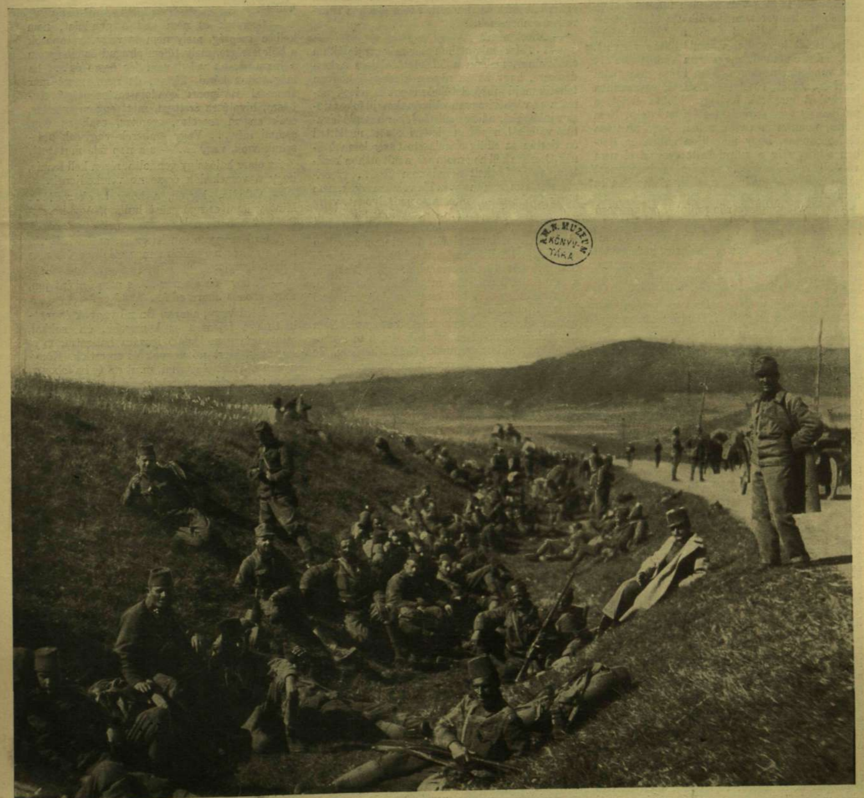
PIHENŐ CSAPATOK AZ OJTOZI SZOROSBAN.

Külföldi előfizetésekhöz a postai meg- határozott viteldíj is csatolandó.