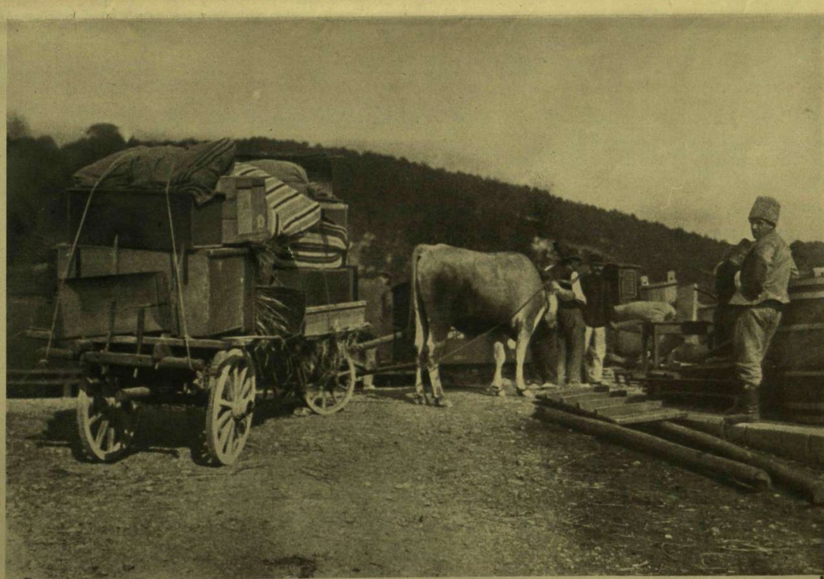
MENEKÜLŐK EGY VASUTI ÁLLOMÁSON.

AZ OLASZ HARCOZTÉRRŐL. — Balogh Rudolf, a harcstérre kiküldött munkatársunk felvétele.