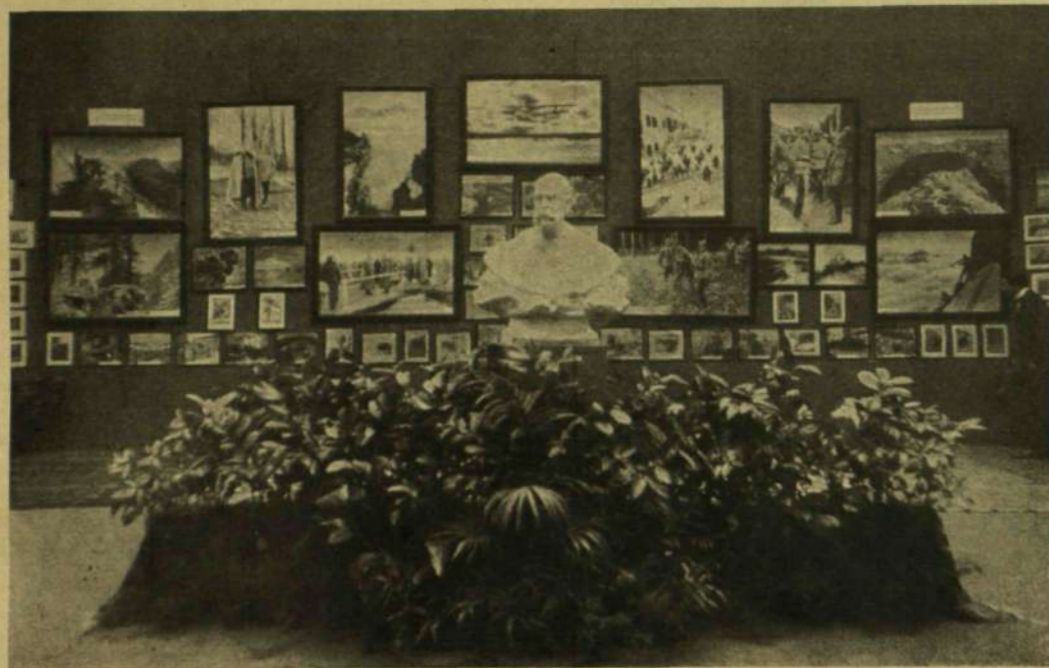
A HADÜGYMINISZTERIUM CSOPORTJA.