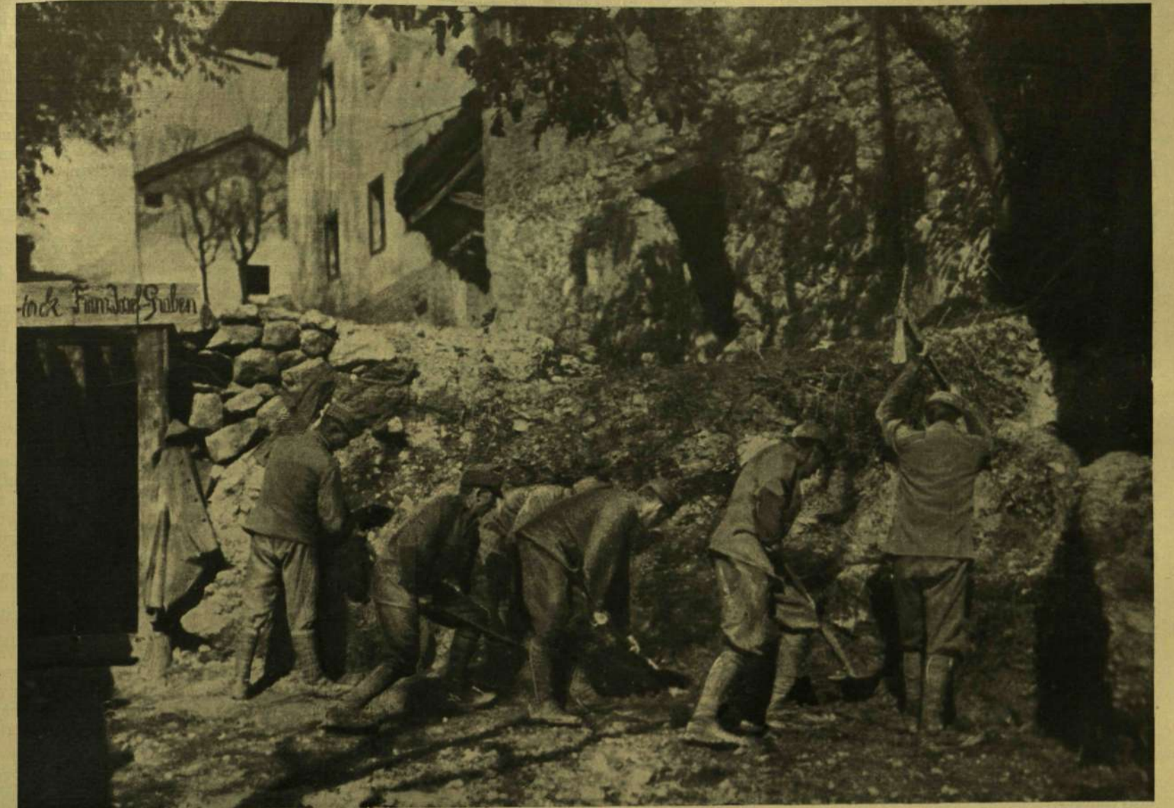
LÖVÉSZÁROK EGY FALUBAN.

A ROMÁNOK KIÜZÉSE ERDÉLYBŐL. — Jelfy Gyula, a harcotérre kiküldött munkatársunk felvételei.