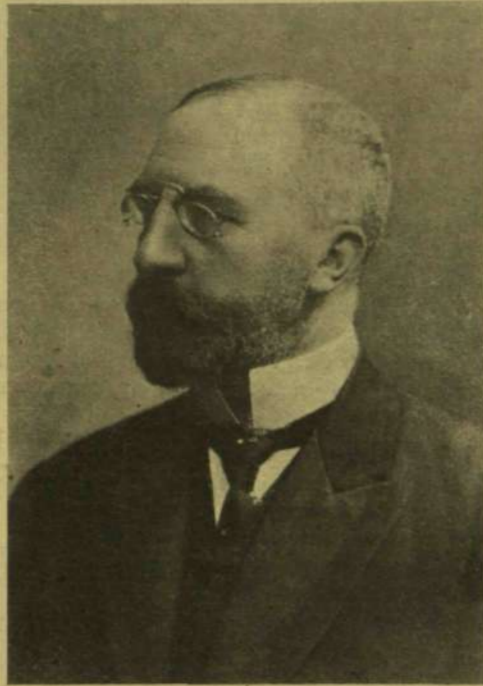
STÜRGGH KÁROLY, A MEGGYILKOLT OSZTRÁK MINISZTERELNÖK.

Ez a jószág és derékség öröklött tulajdona volt a bécsi merénylet áldozatának. Stürggh gróf az egyszerű és hűségesebb lelkületű stájer nép köréből, annak is egyik legrégebbi törzsekéből sarjadt. Az ősapja, kinek életét ismerjük, Stürggh György, Grác óségi városának pol- gára volt. A Stürggh nemzetség, mint az új- kor akárhány, nála ragyogóbb nevé és hatal- masabb családja, a kereskedők tisztessé- géből vált ki s lett feudális úrrá. A családot me- galapító régi Stürggh valahonnan Regensburg tájáról jutott el vándorútján Stájerországba s minthogy már középkori ősei józan becsületes- ségükről voltak ismeretesek, a jó családi hagyomá- ny és a tiszta értelem előkészítette boldo- gulásuknak útját. Ő maga is még a középkor alkonyatán, 1475-ben született, de vagyonának alapjait már az új korban vetette meg. Grác- ban telepedett meg, s előbb egy nagy keres- kedőház alkalmazottja volt, aztán, mint ön- álló kereskedő vagyonra, tekintélyre tett szert,