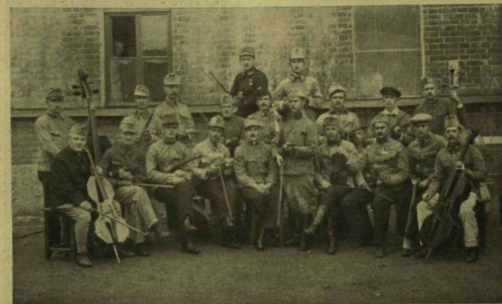
ORSZ FOGSÁGBA ESETT MAGYAR TISZTEK ZENEKARA STRETENSKBEN.

Most aztán az ágyánál ült, figyelte bágyadt lélekzetét a férfúnak, a kinek létét köszönheti.