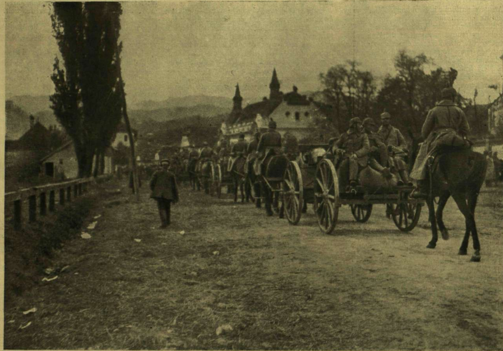
NÉMET TŰZÉRSÉG BEVONULÁSA BRASSÓBA OKTÓBER 9-ÉN.