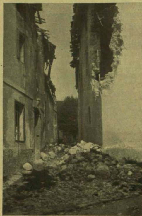
AZ ÖSSZELŐTT TOLMEINBÓL.

— Igen ám, — magyarázza a többi — mert szegényei, hogy ő csak közlegény, a Mihály meg