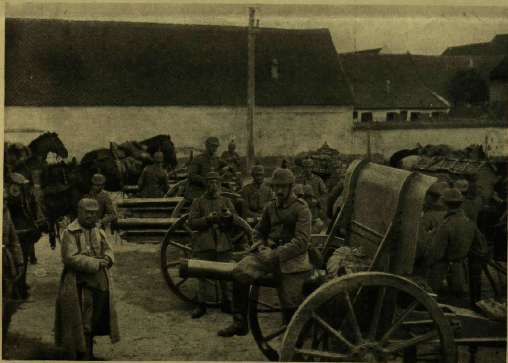
A BRASSÓI HARCZOKBAN ZSÁKMÁNYOLT ROMÁN ÁGYUK.

A ROMÁNOK KIÜZÉSE ERDÉLYBŐL.