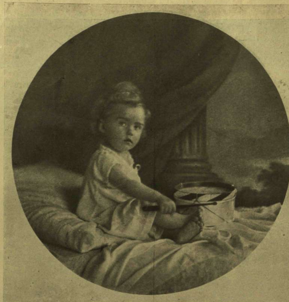
FERENCZ JÓZSEF OTTÓ FŐHERCEG, ÚJ TRÓNÖRÖKÖSÜNK.

— Drámát írt? — Hát persze. Drámát írt. És odaadta a Nagyszínháznak azzal, hogy ez az élete egyetlen műve, ettől függ, maradhat-e író, vagy sem, ennek a sikerétől. Ha ennek nem lesz sikere — leteszi a tollat.