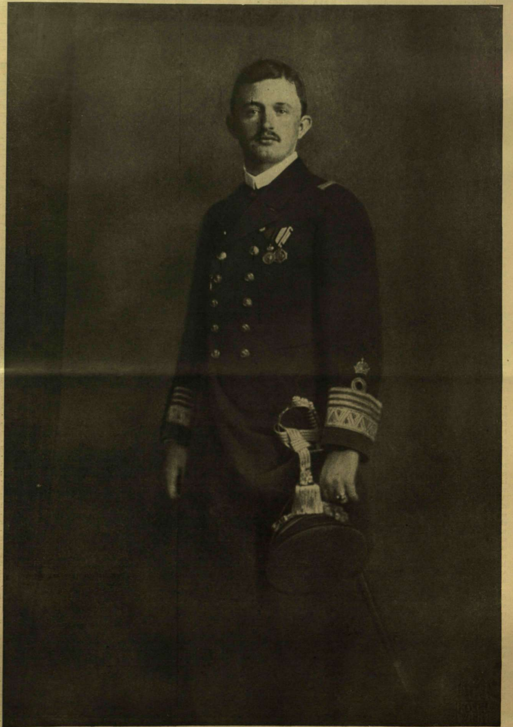
IV. KÁROLY KIRÁLY TENGERNAGYI EGYENRUHÁBAN.