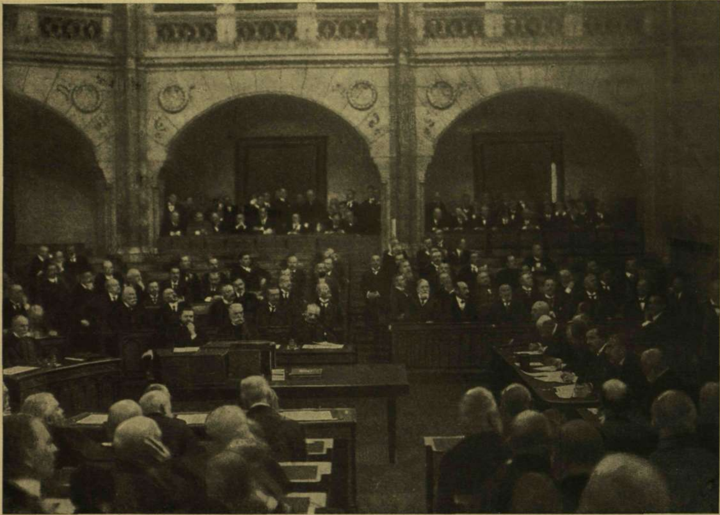
A MAGYAR KÉPVISELŐHÁZ GYÁSZULÉSE I. FERENCZ JÓZSEF HALÁLA ALKALMÁBÓL. — AZ ELNÖK ELŐTERJESZTÉSE KÖZBEN.