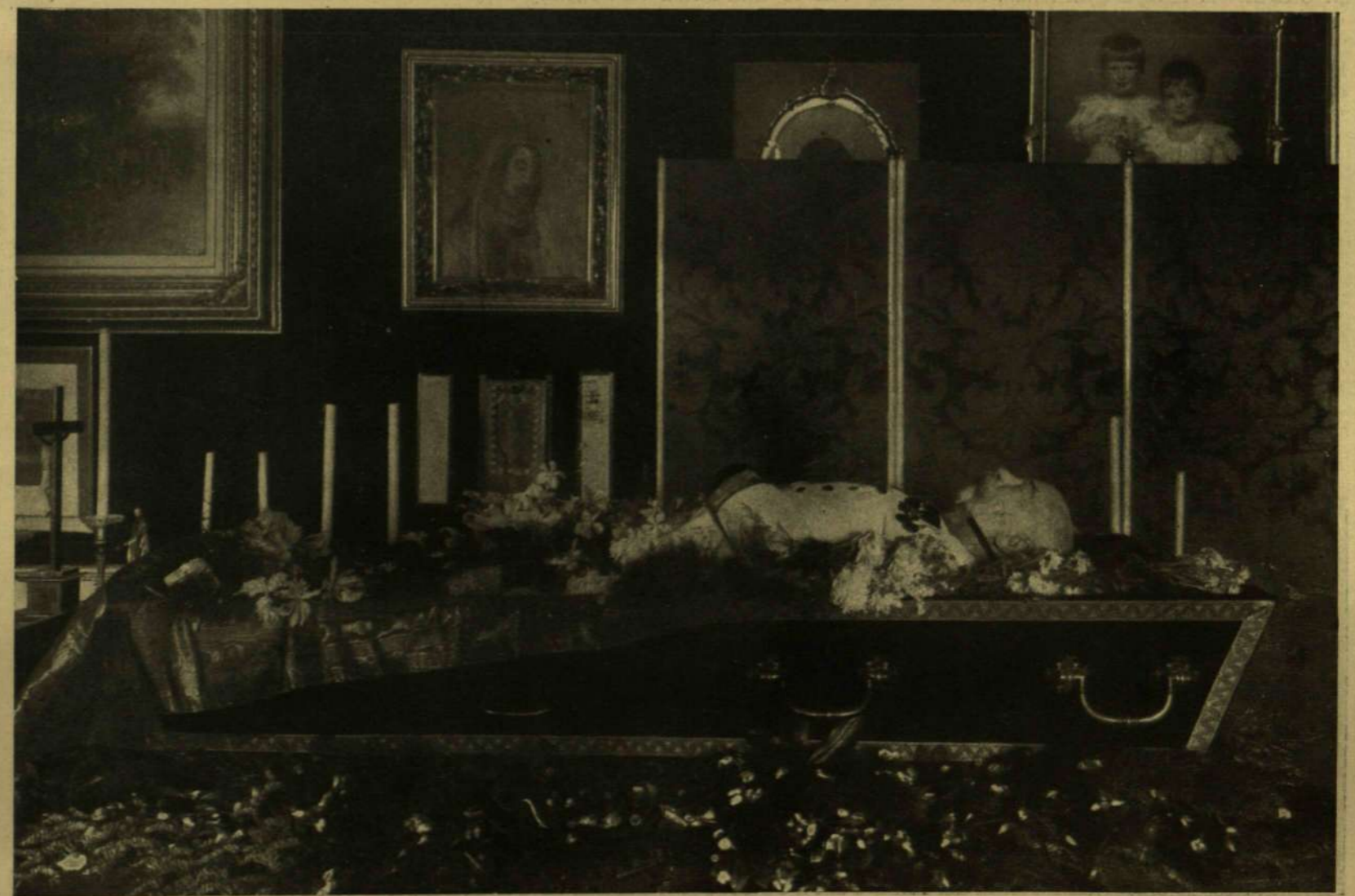
I. FERENCZ JÓZSEF HAVATALON SCHÖNBRUNNBAN.