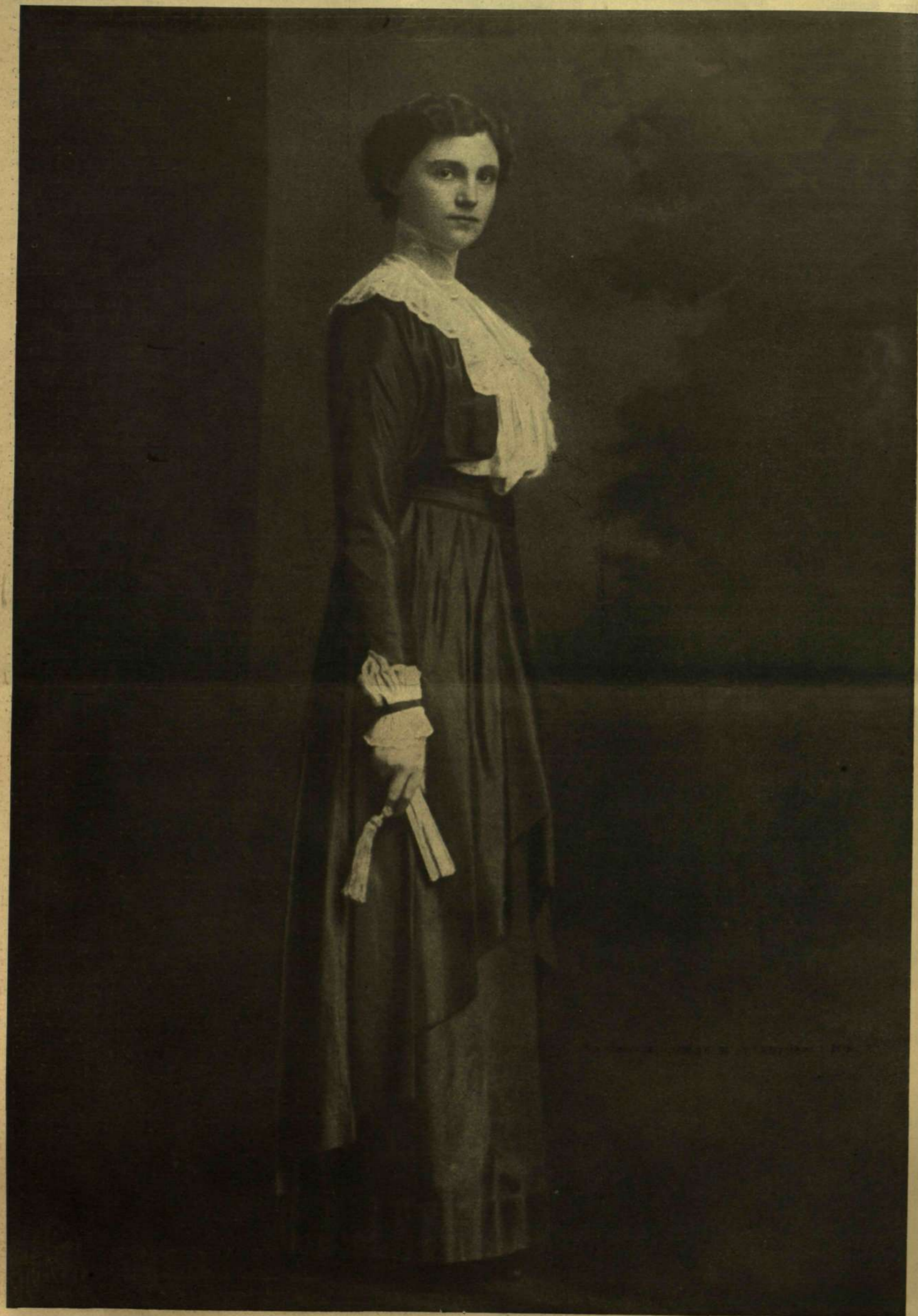
ZITA KIRÁLYNÉ. — Kossel fényképe.