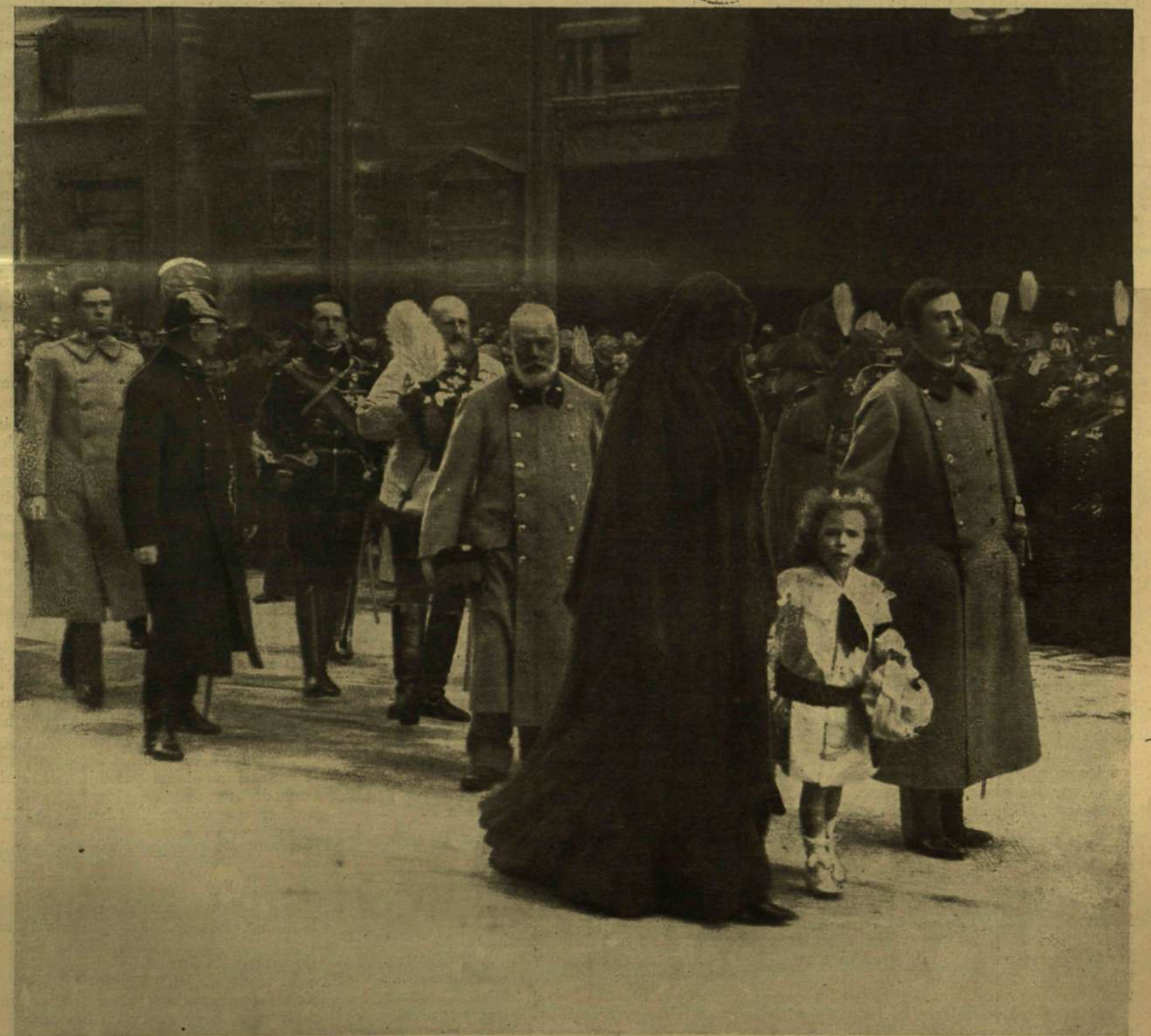
IV. Károly király, Ottó trónörökös és Zita királyné a koporsó után mennek a Szent István templomból, mögöttük Lajos bajor király, Ferdinánd bolgár ezár, Frigyes Vilmos német trónörökös, Frigyes Ágost szász király és Gusztáv Adolf svéd trónörökös.

Külföldi előfizetéseket a postai meg- határozott viteldíj is csatolandó.