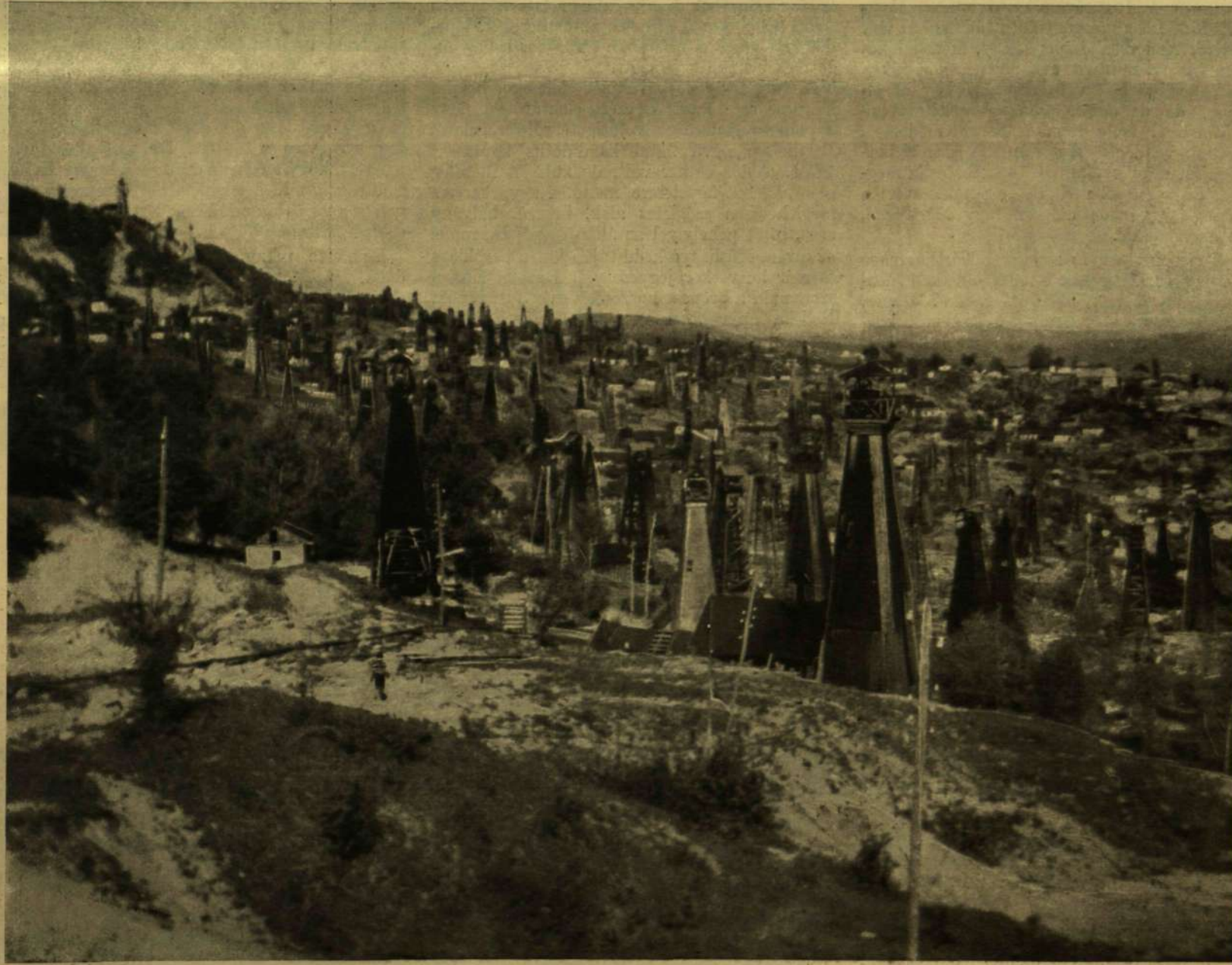
PETROLEUM-KUTAK PREDEAL ALATT, ROMÁNIÁBAN.