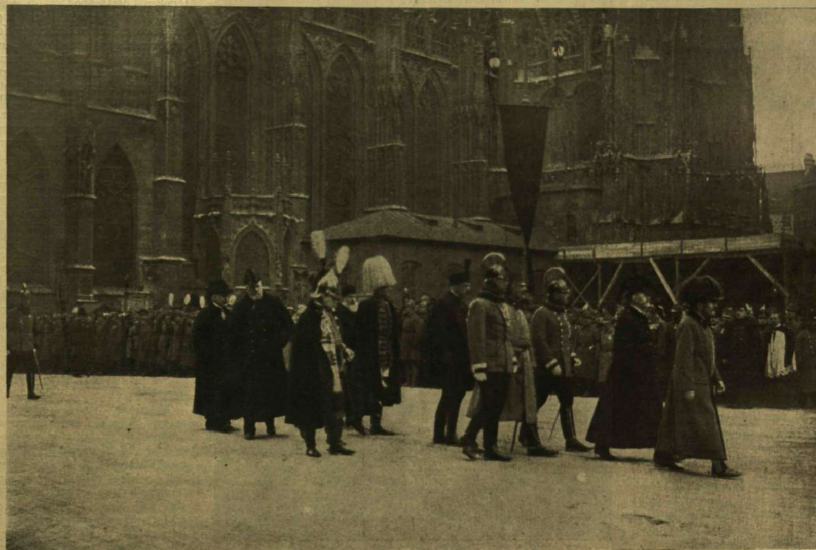
AZ UDVRTARTÁS TAGJAI.

I. FERENCZ JÓZSEF TEMETÉSE.