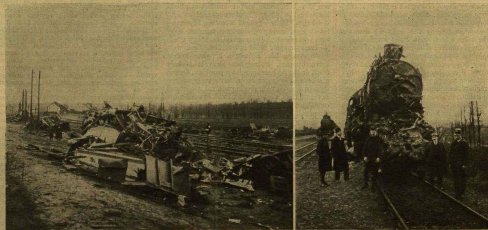
Az összeütközött vonatok roncsai.

Ma is egész világosan látom még magam előtt