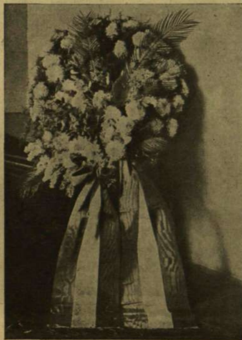
A KIRÁLY KOSZORBÚJA THALLÓCZY KÖPORSÓJÁN.

itikai, illetőleg hivatalnokai karrierjének. Történeti tanulmányai fiatal korában a balkáni dolgok felé fordították figyelmét, a melyek régi történelmünk számtalan földérintetlen problémájának adják a kulcsát. Ezzel magára vonta Kállay Béni jóindulatát, a ki mint közös pénzügyminiszter keresve kerestett a balkáni ügyek iránt fogékonyságot tanúsító magyar embereket. Így került Thallóczy Bécsbe, a közös pénzügyminisztériumba. Teljes erővel a balkáni szláv népek multjának, kultúrájának és gondolkodásmódjának tanulmányozására adta magát s nem sok idő múlva a másféle gondolkodásmódokba magát könnyen beleélő tudó fogékonyságával a legkiválóbb balkáni szakemberek egyike lett. A multon át értette meg a jelent, — senki nálánál jobban nem ismerte a balkáni ember lelki világát, a módokat, a hogy vele bánni kell, — tudott bosnyák lenni a bosnyákok közt, szerb a szerbek közt. De azért meg tudott maradni magyarnak és sohasem lett hűtlen