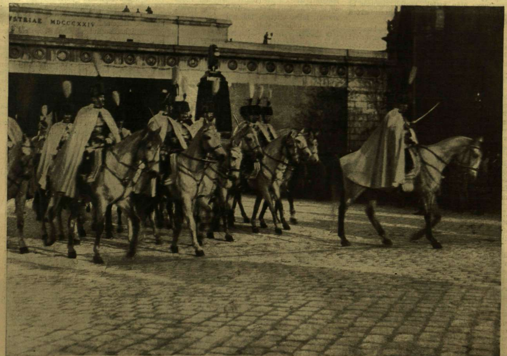
A MAGYAR TESTÖRSÉG.