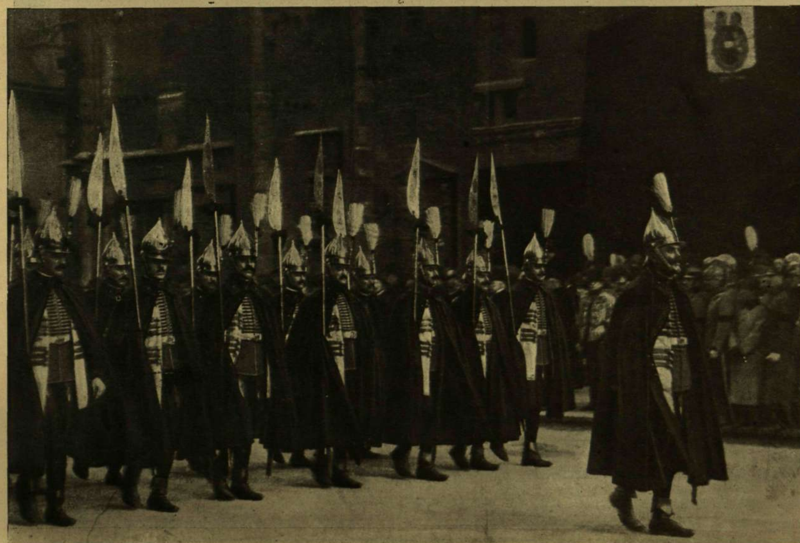
I. FERENCZ JOZSEF TEMETÉSE. — MAGYAR DARABONT-TESTŐRSÉG.