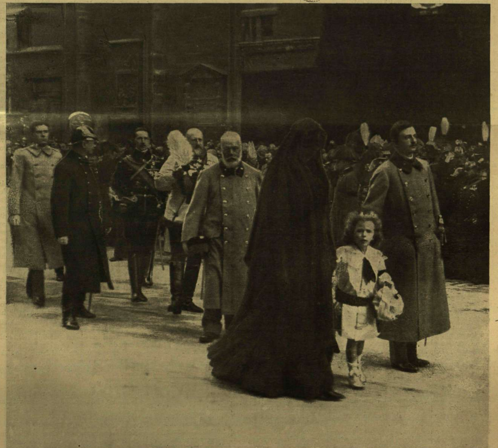
IV. Károly király, Ottó trónörökös és Zita királyné a koporsó után mennek a Szent István templomból, mögöttük Lajos bajor király, Ferdinánd bolgár ezár, Frigyes Vilmos német trónörökös, Frigyes Ágost szász király és Gusztáv Adolf svéd trónörökös.

Külföldi előfizetéseket a postai meg- határozott viteldíj és csatlakozó.