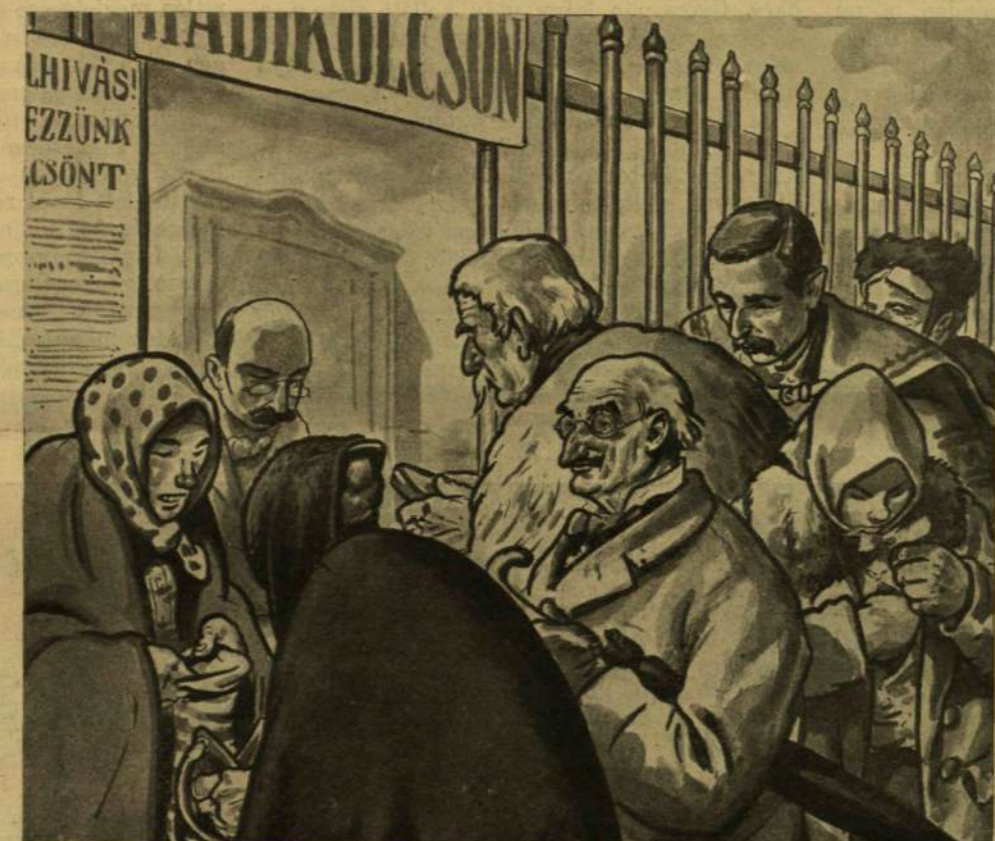
HADIKÖLCSÖN JEGYZÉS A FRONTON ÉS ITTHON.

takarékpénztár sem fizet. Pedig a magyar állam biztosabb adós, mint a világ leggazdagabb pénzüintézete.