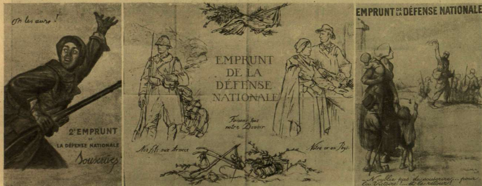
1. «Jegyeztek!» — 2. «Fiainkat a hadseregnek! Aranyunkat a Hazának!» — 3. «Ne felejt el aláírni a győzelemre s a mi visszatérésünkre!»