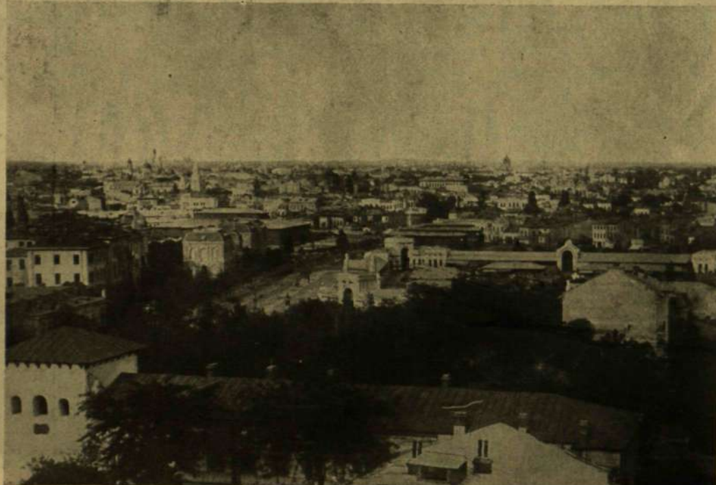
BUKAREST, MELYET CSAPATAINK DECZEMBER 6-ÁN ELFOGLALTAK.