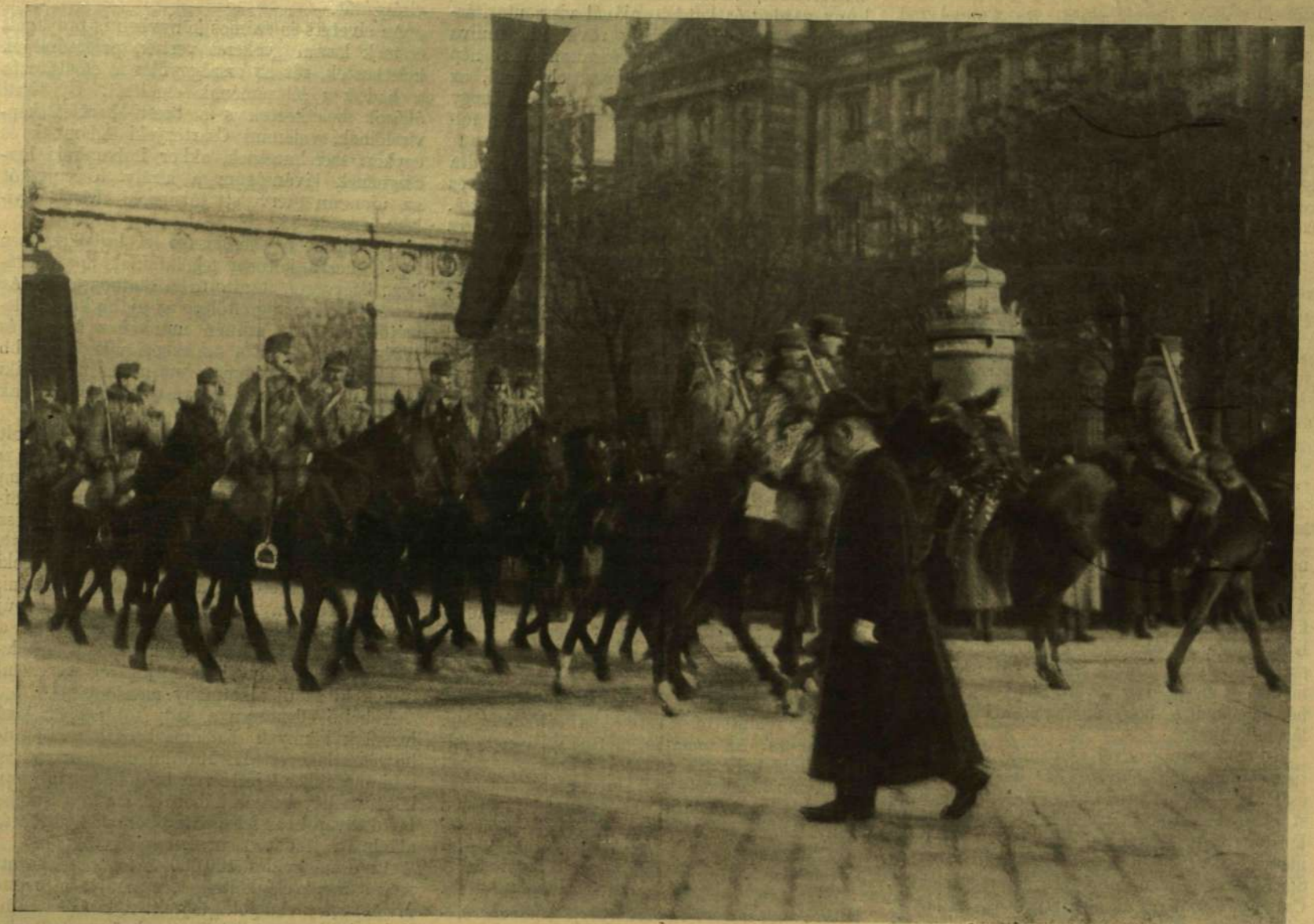
MAGYAR HUSZÁROK A MENET ELÉN.

Gondolja meg a haza minden polgára, kicsi és nagy egyaránt: hogy ő a hazát szolgálja és a győzelmes békét mozditja elő, mikor hadikölcsönt jegyez!