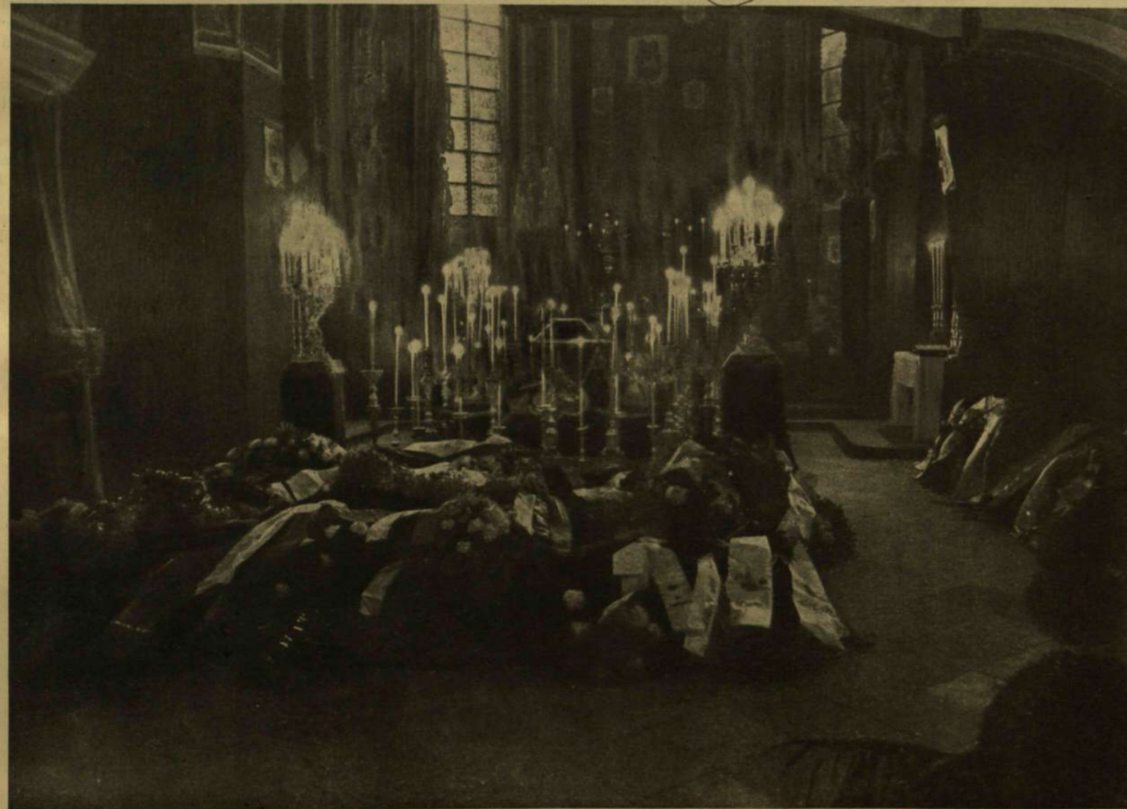
I. FERENCZ JÓZSEF RAVATALA A BÉCSI BURG KÁPOLNÁJÁBAN. — Jelfy Gyula főrajtala.