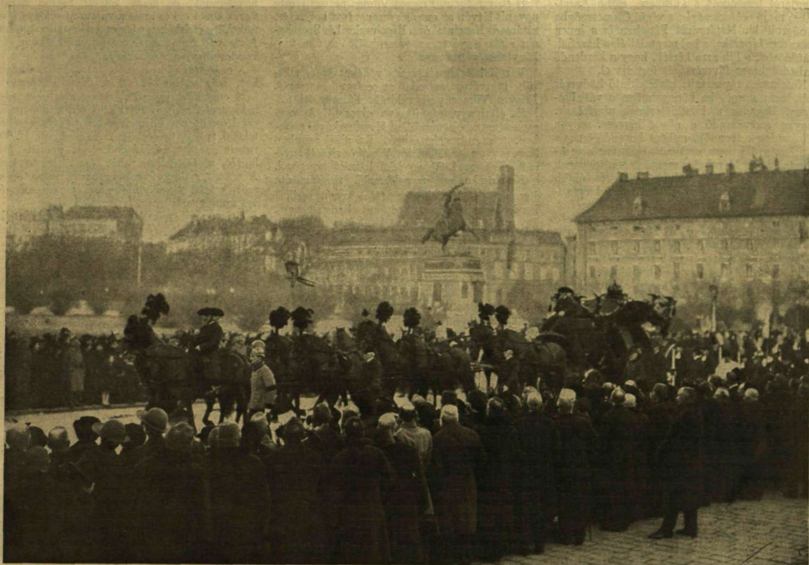
A GYÁSZKOCSI ELHAGYJA A BURGOT.