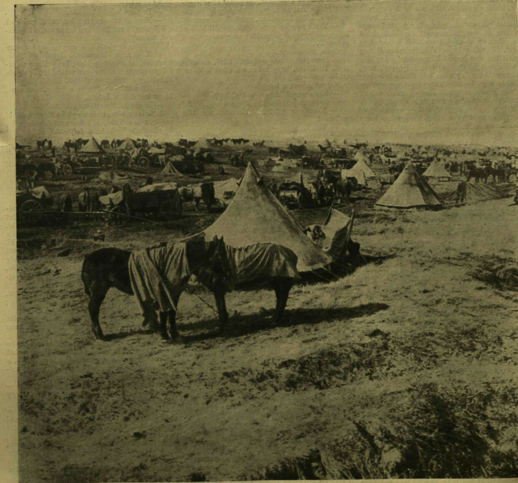
NÉMET TÁBOR ZSÁKMÁNYOLT ANGOL SÁTRAKKAL A SOMME-SZAKASZON.

Szerkesztési iroda: IV. Vármege-utca 11. Egyes szám ára 80 fillér. Előfizetési feltételek: Egészévre — 40.— korona. Félévre — 20.— korona. Negyedévre — 10.— korona. Külföldi előfizetésekhöz a postailag meg-határozott viteldij is csatolandó.