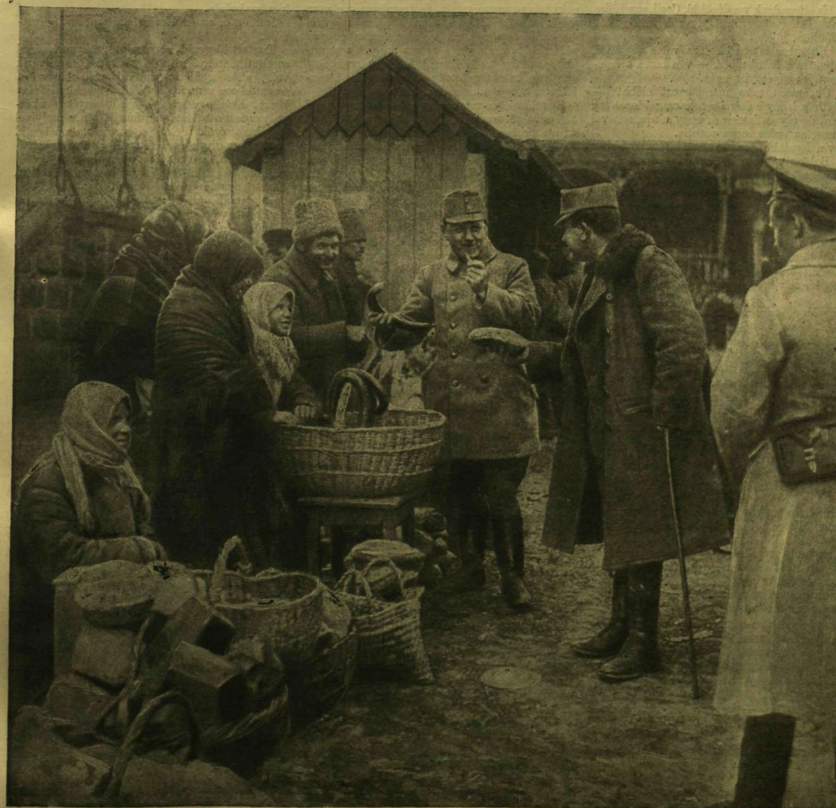
A ZMERINKAI VASUTI ÁLLOMÁSON UKRÁNIÁBAN: TISZTJEINK VÁSÁROLNAK AZ ÁLLOMÁS ELŐTTI ÁRUSORTÓL.

Külföldi előfizetésekhöz a postailag meghatározott viteldíj is esatolandó.