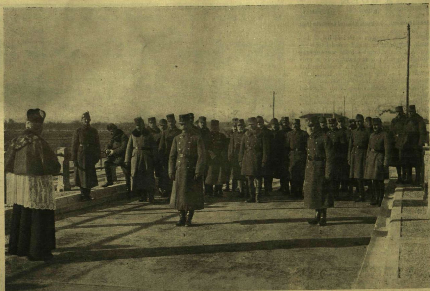
A KATONÁINK ÁLTAL ÉPÍTETT TAGLIAMENTO-HÍD FELAVATÁSA. (A hid közepén állnak Boroevics tábornagy és Wurm vezérezredes.)