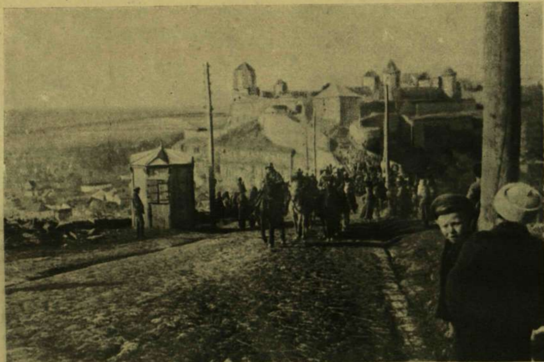
CSAPATAINK BEVONULÁSA KAMENIECZ-PODOLSKRIBA.

Denry aznap délután véletlenül az újság kiadóhivatalában volt. Ő nem gyakorolt semmi befolyást a szerkesztés részleteire, mert a részletes megszervezés nem tartozott az ő különleges tehetsége közé. Az ő különleges tehetsége csak a nagy vezető szemérmelermelésében mutatkozott. Nem is tudott semmit sem a tudósítókkal és a különböző tudósítói irodákkal kötött meg-egyezségekről, sem a lóversenyszolgálatról, sem a nehézségekről, melyek az írók szövetségével felmerültek, sem a küzdelemről, melyet azért folytattak, hogy a papír árát minden font után