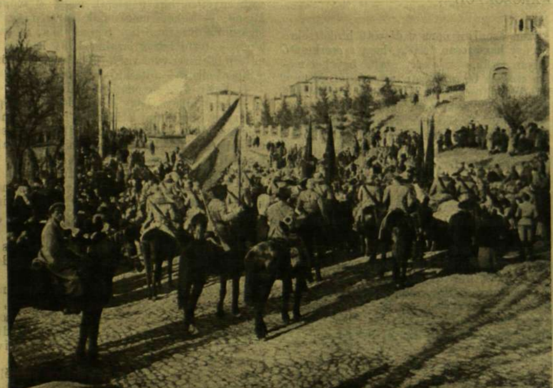
MAGYAR HUSZÁR TEMETÉSE UKRÁNIÁBAN.

Az új napilap megjelenése napján, az újság kiadóhivatala bizonyos tetteit egyszerű szerkesztéséről, a mennyiben minden részletre kiterjedőleg a legcsodálatosabb pontossággal működött. Az alagsorban a Marinoni-gép dühögött, hogy előállíthasson tizenöt ezer példányt egyetlen óra alatt. A földszinten bámulatosan