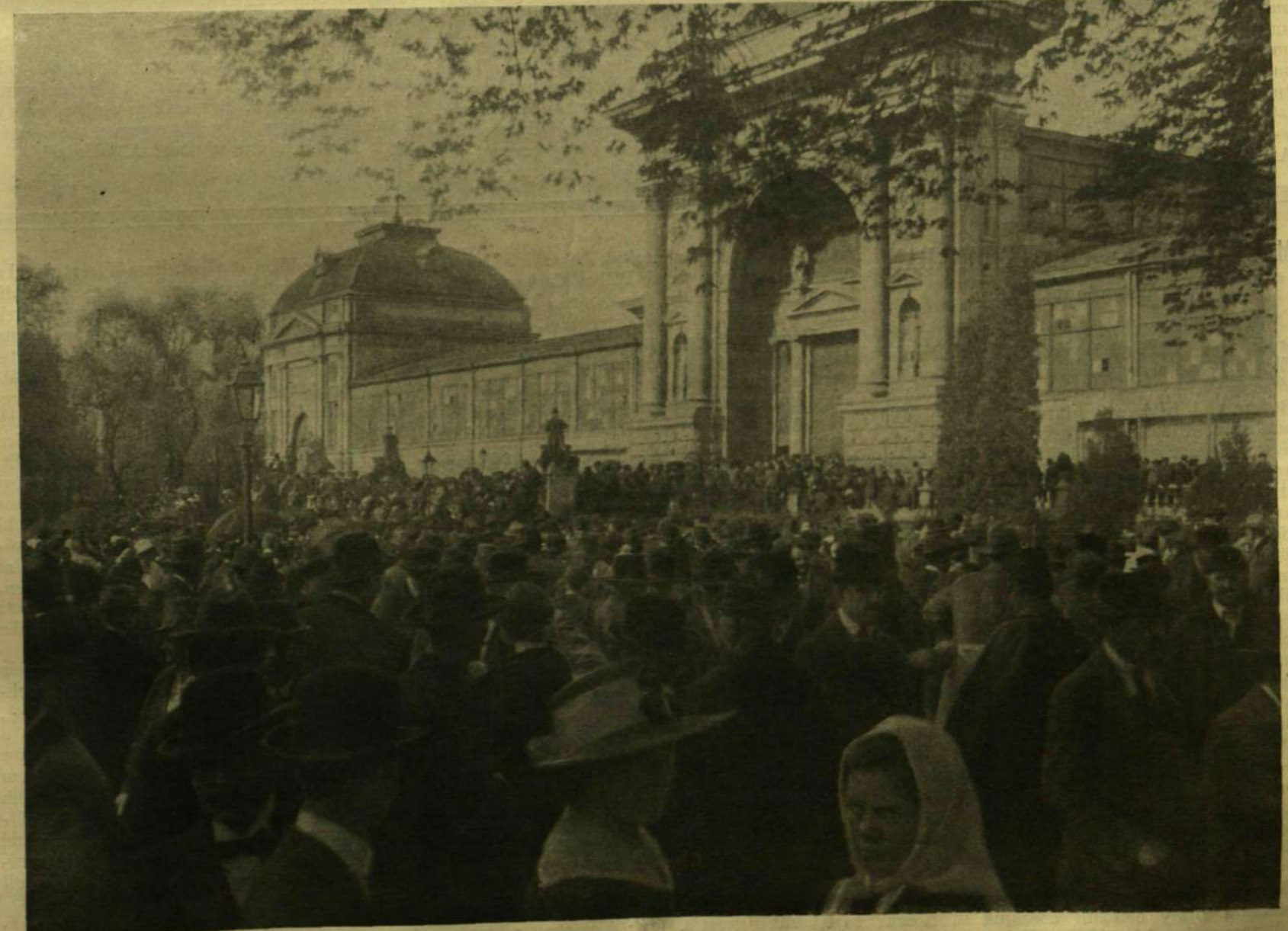
A MUNKÁSOK ÁPRILIS 22-IKI TŰNETŐ GYŰLÉSE A VÁLASZTÓJOGÉRT A VÁROSLIGETBEN.