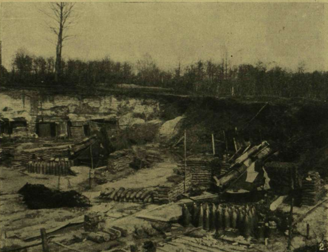
1. Pihenő német csapatok a frontra vonulóban. — 2. Meghódított angol tüzérségi állások a Holnon-erdőben.