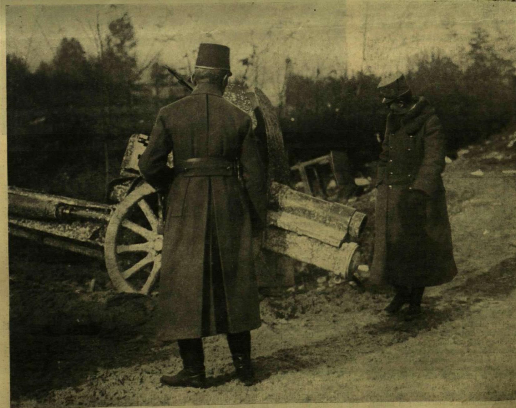
AZ OLASZ HARCZTÉRŐL. — A KIRÁLY EGY ZSÁKMÁNYOLT ÁGYÚT SZEMLÉL.