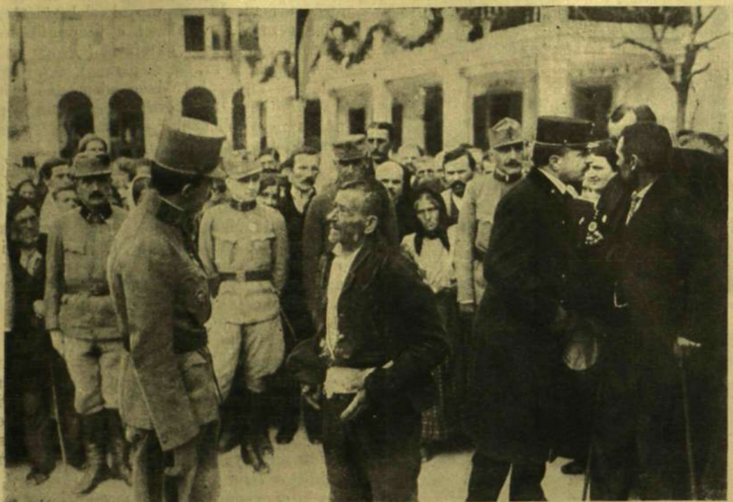
A KIRÁLY KÖRÜTJE A TENGERMELLÉKEN: AZ ALBONAI LAKOSSÁG KÖZT.

jelenni és az elsőrangú estila pok mintájára fogják szerkeszteni.