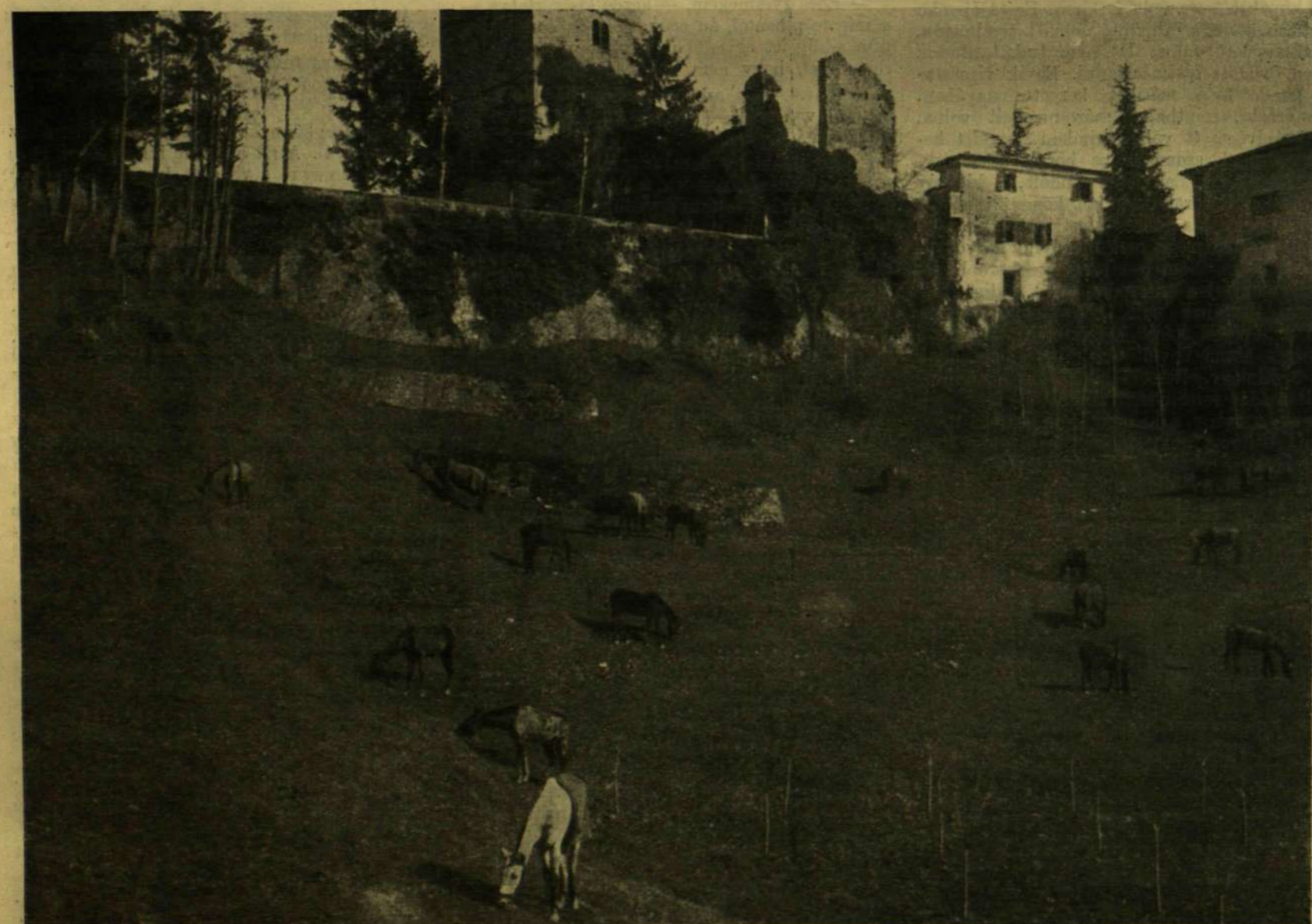
AZ OLASZ HARCZTÉRŐL. — LOVAINK LEGELŐJE EGY VÁRROM ALATT.