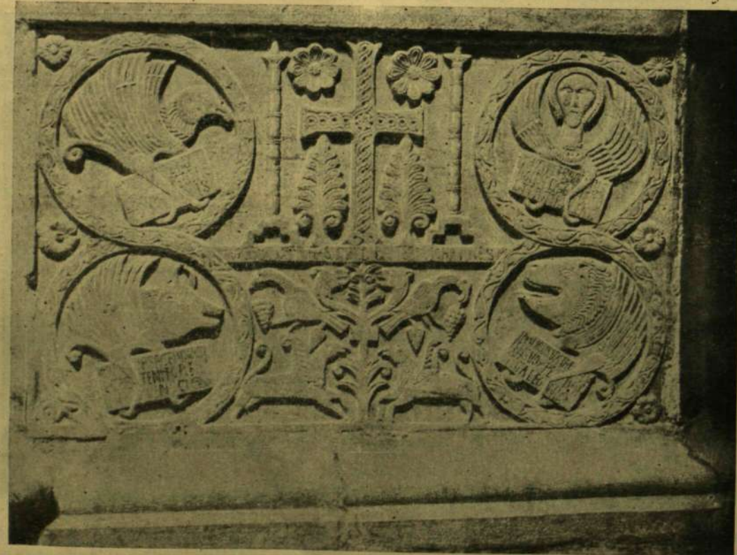
FARAGVÁNYOK A BAPTISTERIUMON.