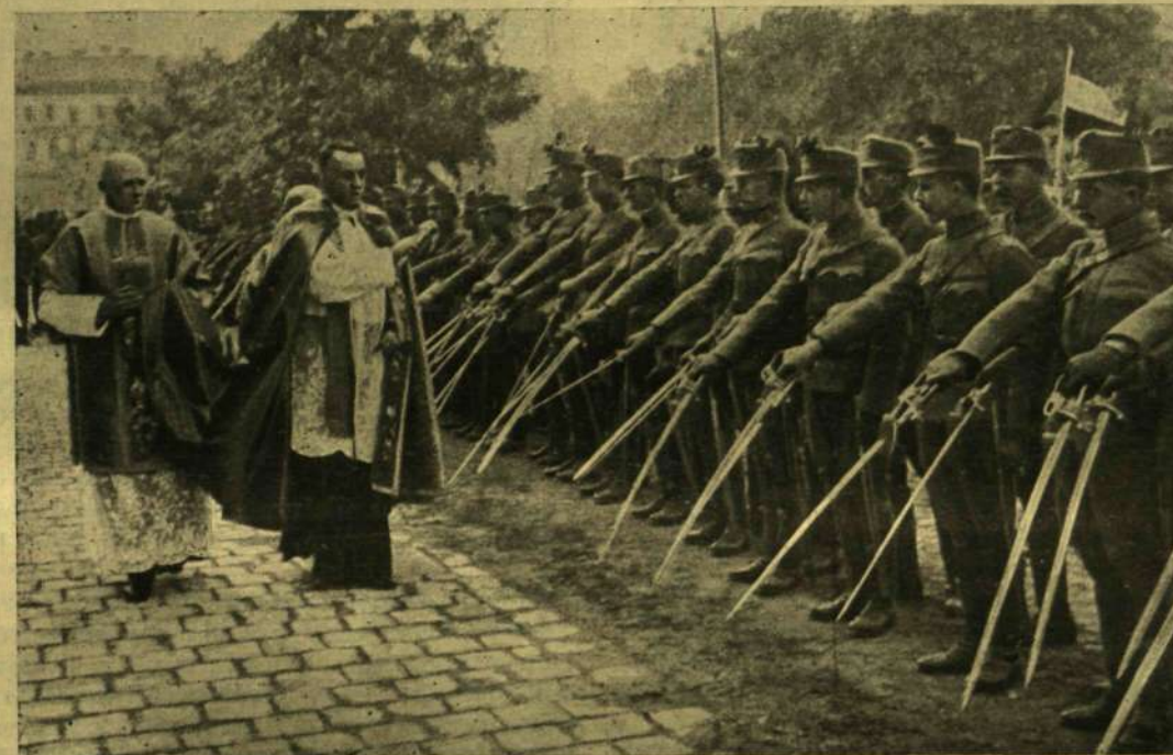
A KARDOK MEGÁLDÁSA.