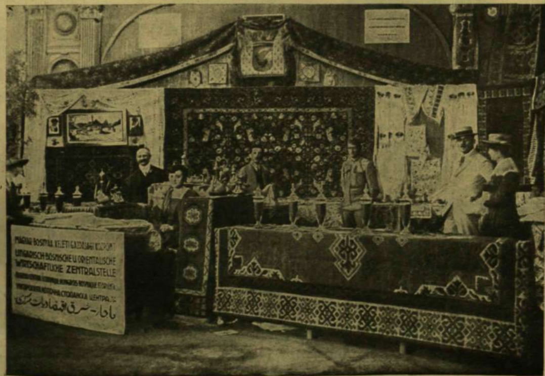
A MAGYAR-BOSNYÁK KELETI GAZDASÁGI KÖZPONT KIÁLLÍTÁSA A BUDAPESTI KELETI VÁSÁRON.