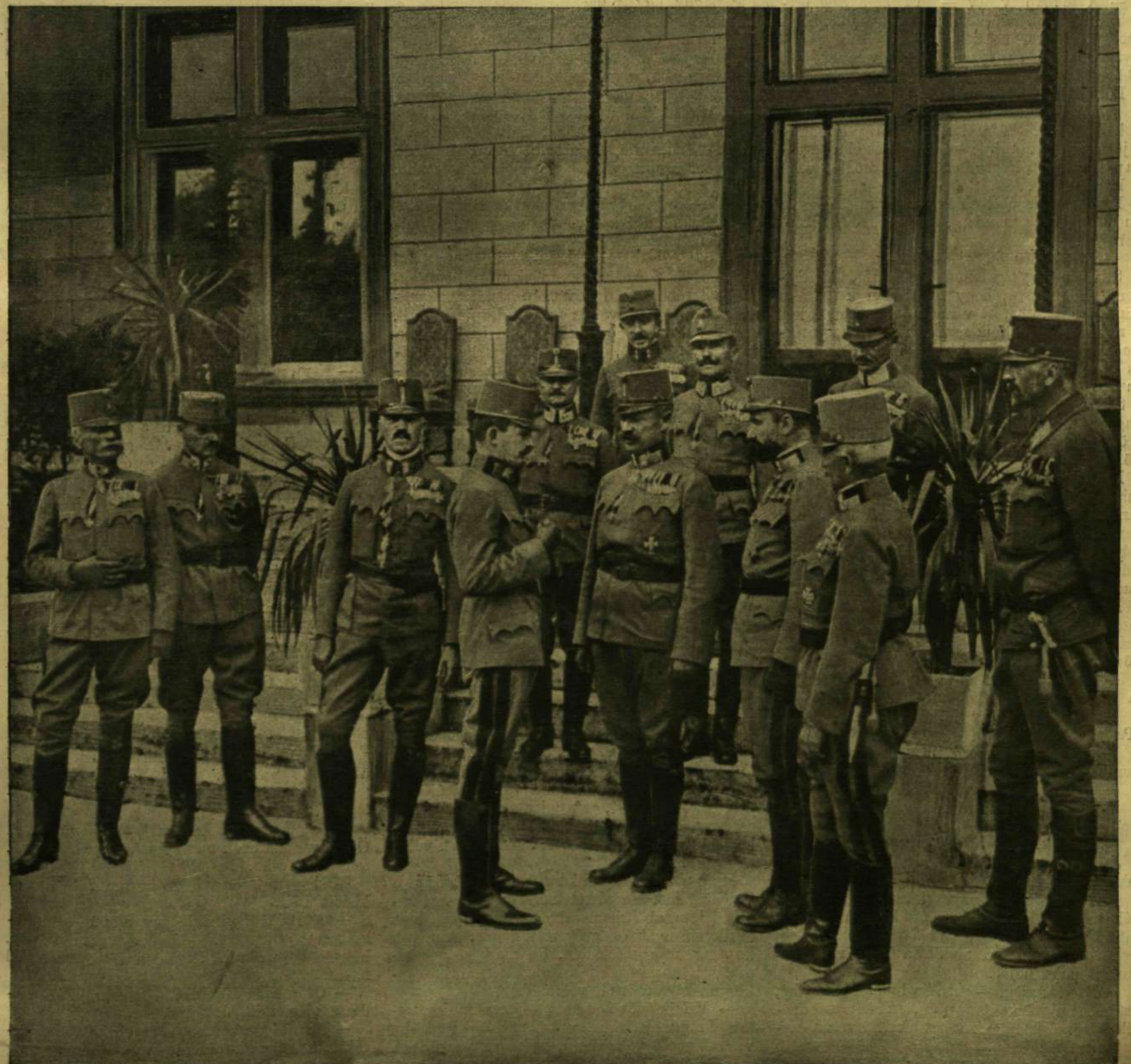
A MÁRIA TERÉZIA-REND ÚJ LOVAGJAINAK FELAVATÁSA. — A KIRÁLY AZ ÚJ LOVAGOK KÖRÉBEN.

Külföldi előfizetésekhöz a postailag meghatározott viteldij is csatolandó.