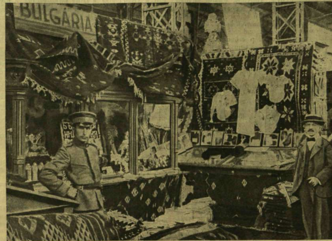
BULGÁRIA KIÁLLÍTÁSA A BUDAPESTI KELETI VÁSÁRON.