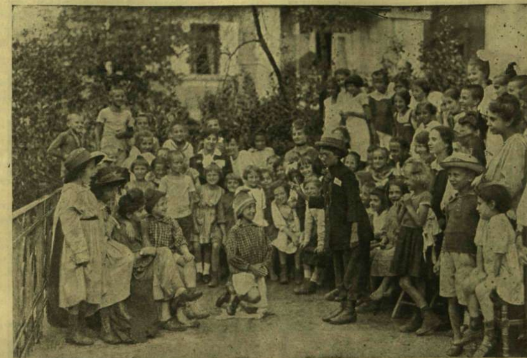
ABBÁZIÁBAN NYARALÓ MAGYAR GYERMEKEK SZÍNHÁZAT JÁTSZANAK.