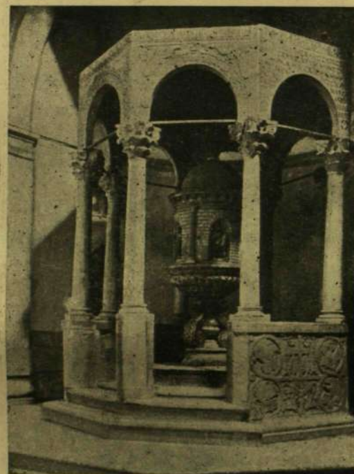
LONGOBARD BAPTISTERIUM A DOMBAN.