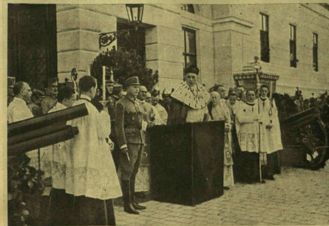
CSERNOCH JÁNOS HERCEGPRIMÁS BESZÉDET MOND A FELAVATANDÓKHOZ. (Jobbra József Ferenc főherceg, a király képviselője áll.)

Ez a maga szelid humorában oly megkapó közigazgatási okirat, a melylyel a gyakorló vadász főjegyző segítségére sietett a megtámadott költői szabadságnak, csak olaj volt a tűzre, már mint a Herman Ottó egyébként mély kedélyű, de minden vitában (pedig de sokat vívott meg életében!) szenvedélyes lelkületére.