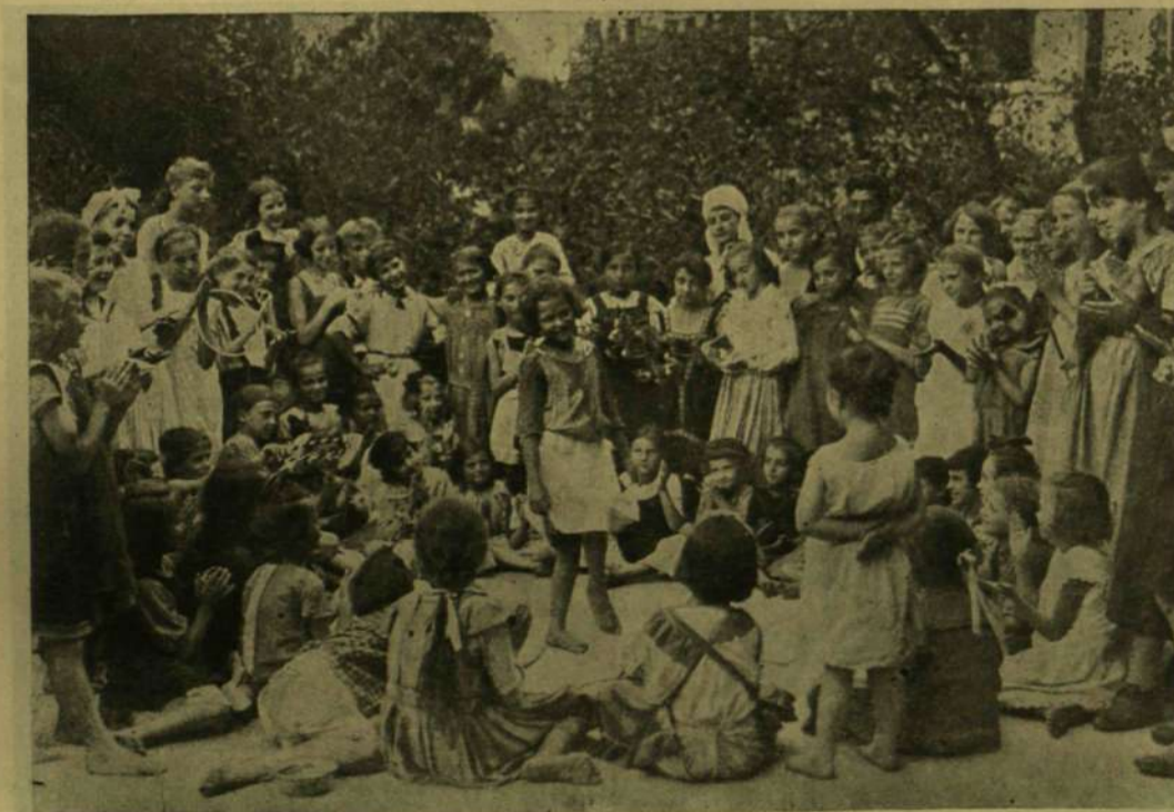
TÁNCZÜNNEPELY. (A szülő tanzenéső föllepte.)

Munkácsy Mihály fiatalkori arcképe abból az időből, a mikor Petőfi bucsuja című képét festette.