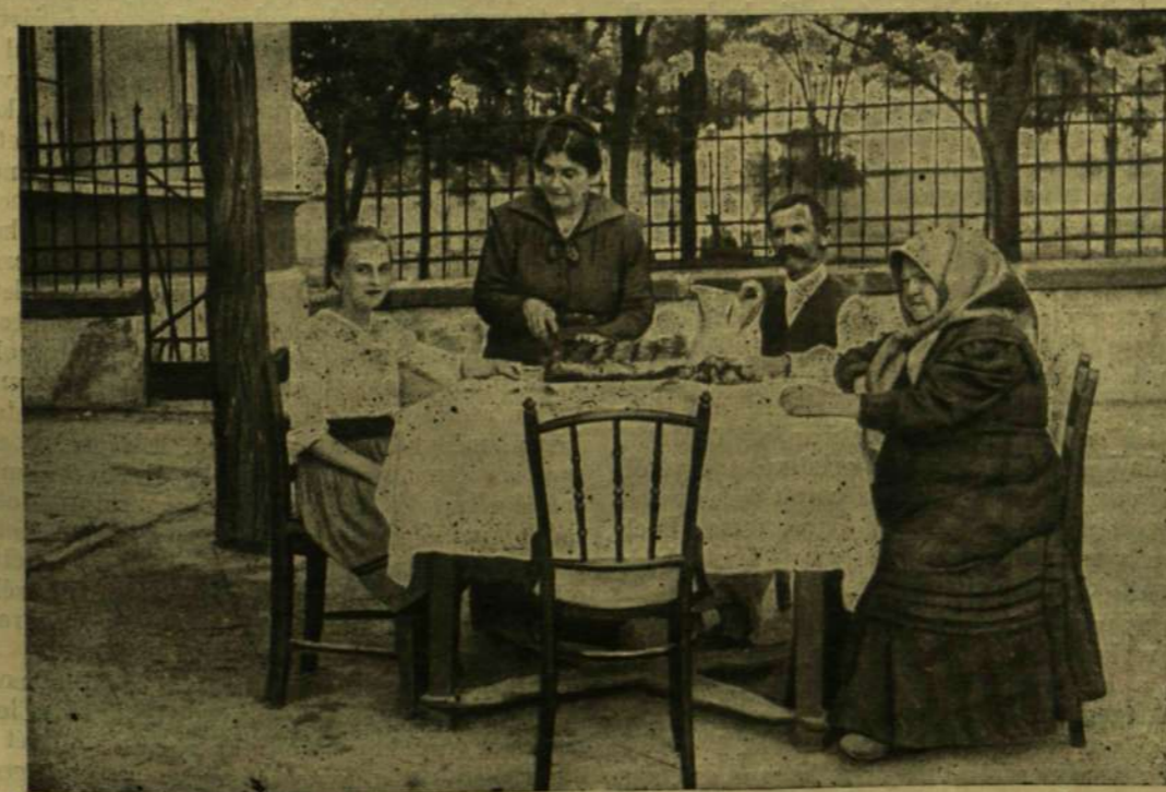
OSZTRÁK LEÁNYKA EGY CSALÁDNÁL.

Parlaghy hirtelen arra gondolt, hogy talán Bibor segédei érkeztek meg. Jöttek, hogy elégtételt kérjenek. Itt vannak, hogy megkezdjék a még rejtett botrány ismeretlen redőinek és ránczainak a kisimítását.