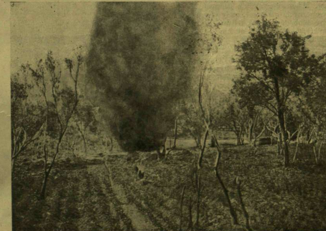
ELLENESÉGES REPÜLŐGÉP BOMBÁJÁNAK LECSAPÁSA EGY CATTARÓI ZÖLDSÉGES KERTBEN.

Herman Ottó posthumus, eddig ki nem adott kéziratá szerint pedig «Gyulai Pál a gerlét nem érthette, mert az költőileg más fogalomkörbe tartozik; a gerle a hitvesi hűség, a vadgalamb pedig a szerelmi bánat madara; Gyulai költeményének hangulata határozottan az utóbbira mutat, el kell tehát fogadni, hogy a tulajdonképeni vadgalamb (Columba venas) bűgása értendő. Ez a faj fészke táján bűg, fészke pedig régi fákon, különösen odvasokon áll. A hámori erdőkerülő háza (mert ez a megénekelt «erdei lak») táján merőben fiatalos erdő van, a Szeleta rész pláne csak bokros. Magában véve már ez is kizárná a megénekelt erdei lak háza tájáról a vadgalambot, így bűgását is.»