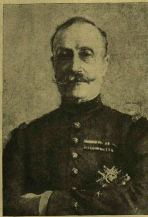
FOCH TÁBOROK, FRANCIA FŐVEZÉR.

hadsereg morálja minden ráhulló kemény kálapácsütés ellenére intakt maradt. Foch tanító-mestere nemcsak a francia tisztikarnak, a háborús Franciaország egész közvéleményének is.