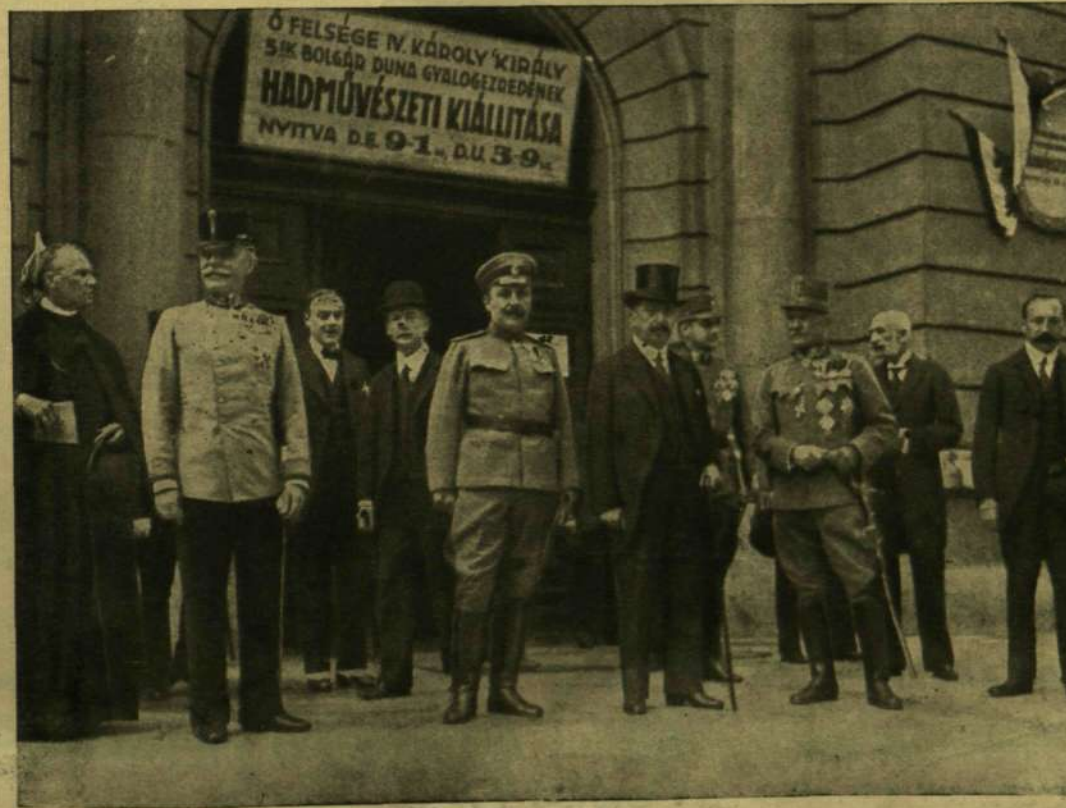
A KIRÁLYUNK NEVÉT VISELŐ BOLGÁR EZRED HADMŰVÉSZETI KIÁLLÍTÁSÁNAK MEGNYITÁSÁKOR BUDAPESTEN A MEZŐGAZDASÁGI MÚZEUMBAN

A mezitlábás görkissasszony. Minden írón meg lehet ismerni azt az ideálképet, a melyet munkájáról, czéjairól s általában az irodalomról alkotott magának. Ez tulajdonképen az író programja s ezt igyekezik megközelíteni s ehhez igazodik munkája módjában. Pekár Gyulánál a kinek új novellás könyve jelent meg A mezitlábás görkissasszony címen, egész feltűnően megismerjük