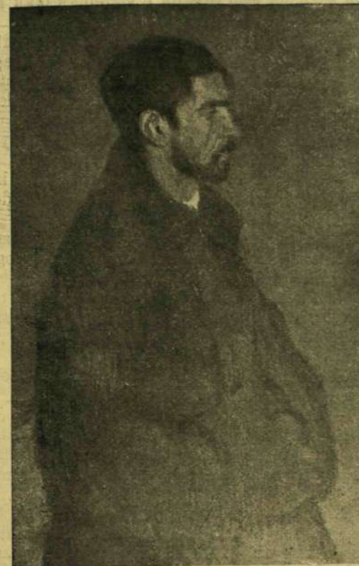
Rudnay Gyula: A bűnös.