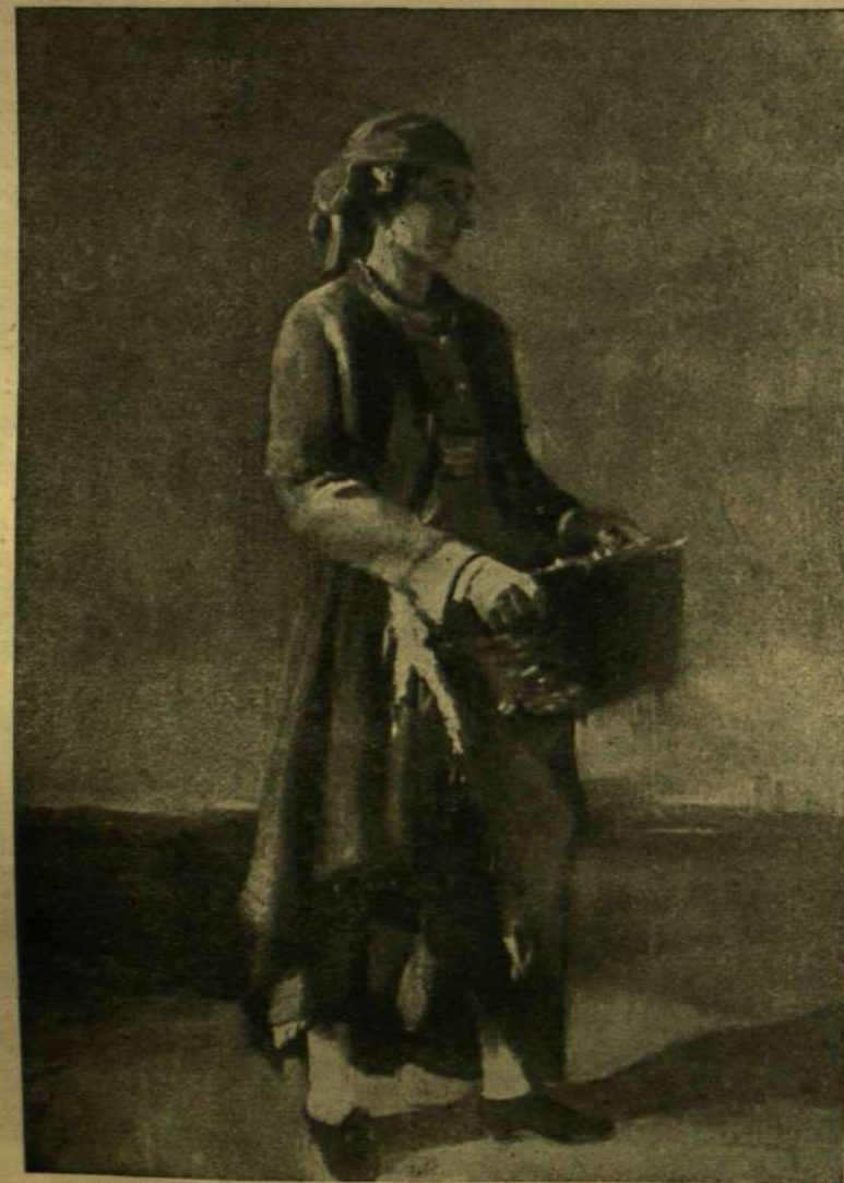
Rudnay Gyula: Vízfordó lány.