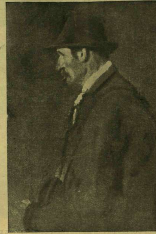
Rudnay Gyula: Pipázó ember.

években megszoktunk. Az árnyaláshoz nem használt kék színeket, hanem feketét, a melynek külömben is nagy szerepet juttat. Színei külömben is nagyrészt sötétek, fehérrel még jobban kiemelte, gyakoriak nála a téglavörös színek is, úgy hogy sok tekintetben újat és mást jelent az az irány, a melyben dolgozik. Mintegy tizenöt éven át egyebet sem kapunk festőinktől, mint napot, derűt, csillogást, mosolyt, örömet, a világos színeknek tarka özönét, mely végül az impresszionista epigonok kezén olyan lélektelen festékké vált, mint a többi irányok iparosainak kezében a régebbi alkotásmódok. Ma már