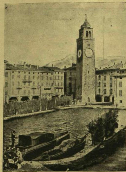
ÓRHAJÓ A RIVAI KIKÖTŐBEN.

— Micsoda lesz? — kiáltott a tanácsos, most már nem tudva, mit csináljon, haragudjon-e vagy névessen, ugratja-e őt ez a fizető vagy elment az esze?