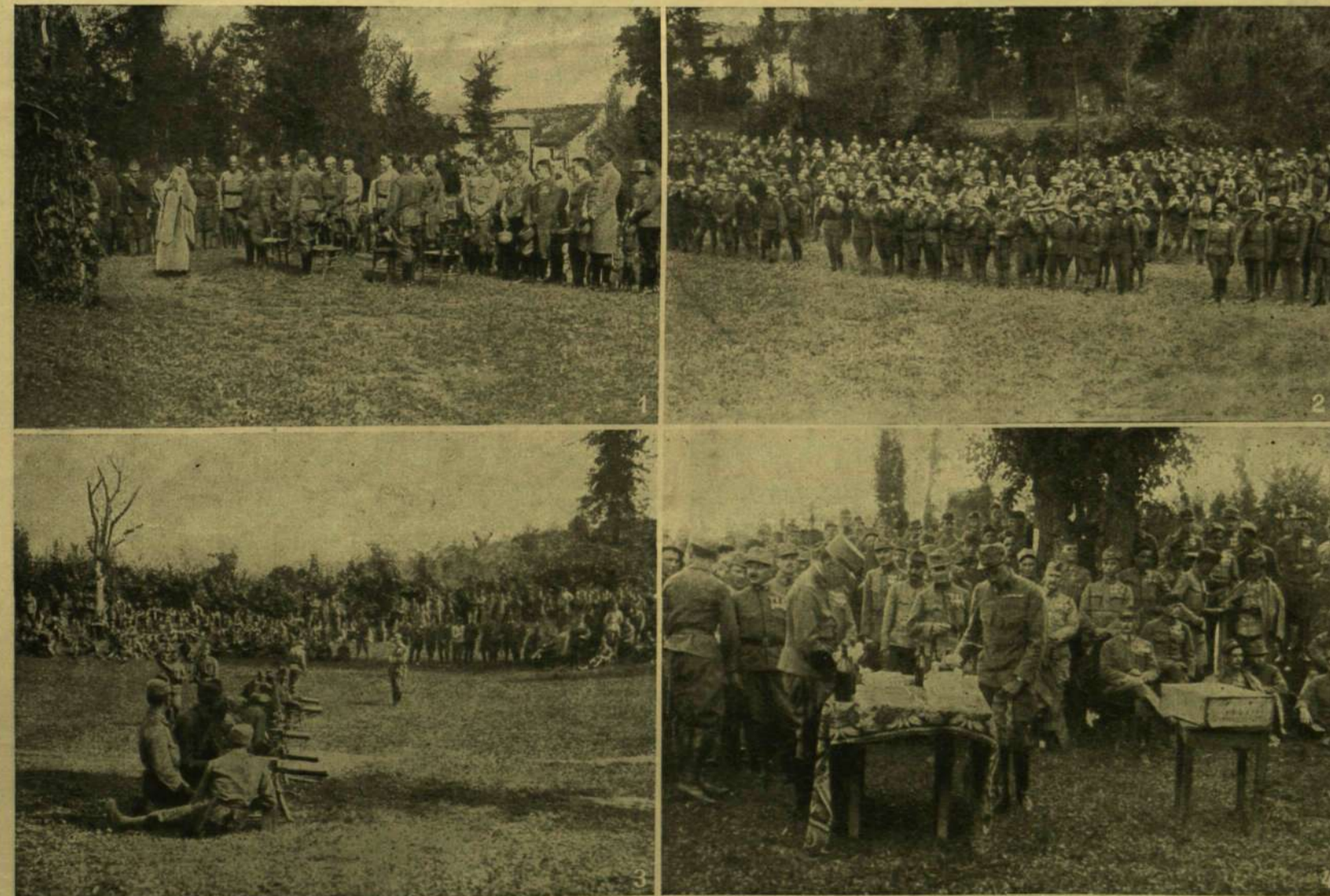
A m. kir. I. honvédegyalozezred azon alkalomból, hogy Ő Felsege az ezred tulajdonosa lett, ünnepi miót, díszbédet és népnépelet rendezett olasz földön.

1. AZ ÜNNEPI MISE. — 2. A LEGÉNYSÉG. — 3. A GÉPPUSKÁSOK VERSENYE. — 4. A DÍJAK KIOSZTÁSA.