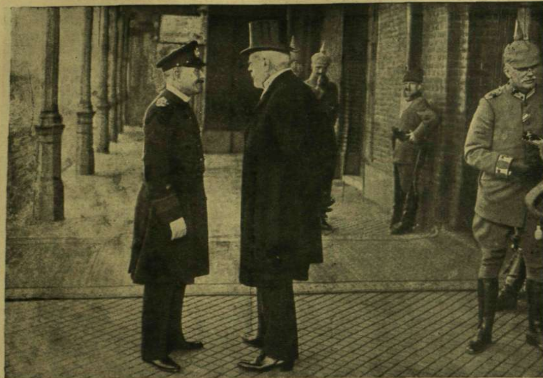
GRÓF BURIÁN ISTVÁN KÜLÜGYMINISZTER, HINTZE TENGERNAGY NÉMET KÜLÜGYI ÁLLAMTİKÁRRAL A NÉMET NAGY FŐHADISZÁLLÁSON.