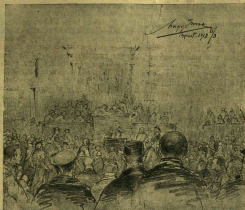
A KATONATANÁCS ALAKULÓ ÜLÉSE A RÉGI KÉPVISELŐHÁZBAN.