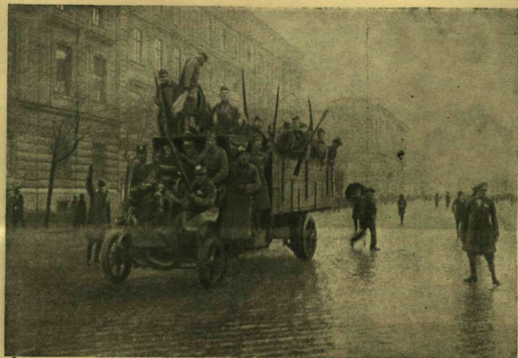
A NEMZETI TANÁCS KATONÁI A VILMOS-CSÁSZÁR ÚTON.