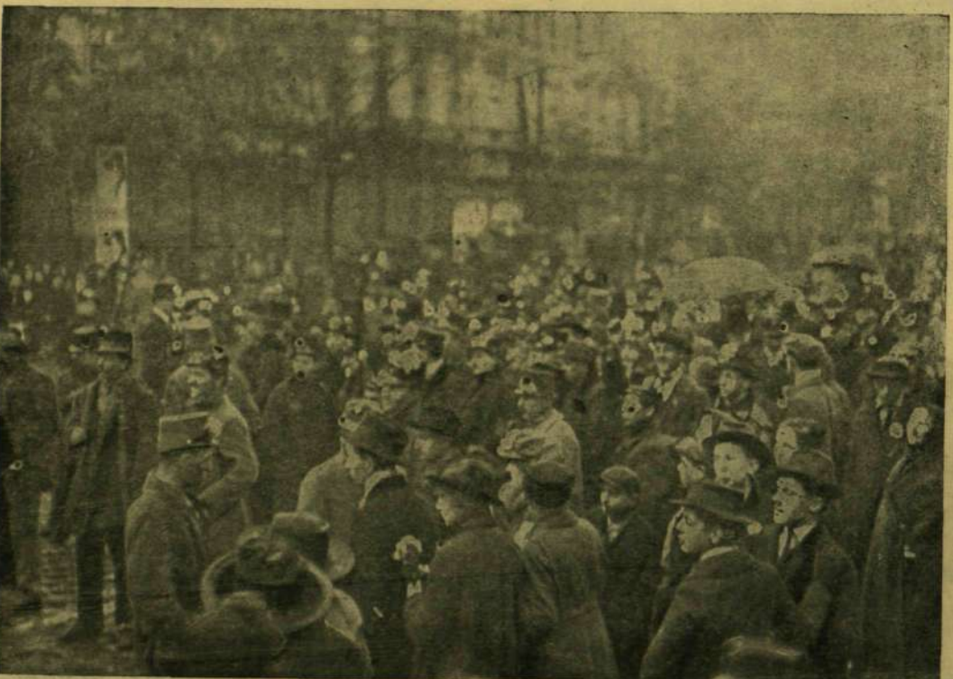
A NÉPTÖMEG AZ ASTORIA-SZÁLLODA ELŐTT, A HOL A KATONA-TANÁCS HELYSÉGE VOLT.