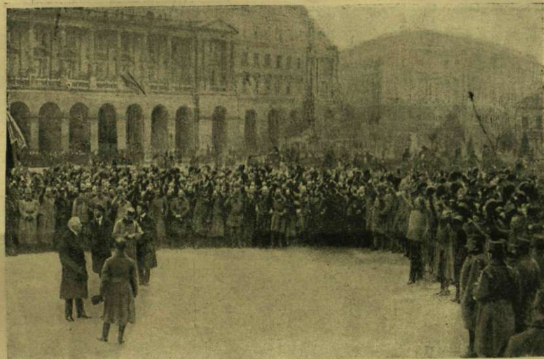
LINDER HADÜGYMINISZTER BESZÉDET MOND A TISZTEKHEZ.

És furcsa dolog, az előbb mindenütt hiába kerestem, most itt találtam egy barna papir-csomagot, a melyet aztán feladtam a postára, arra a címre, a melyet a pap adott. Most már nem emlékszem a címre, valahol Westminster-