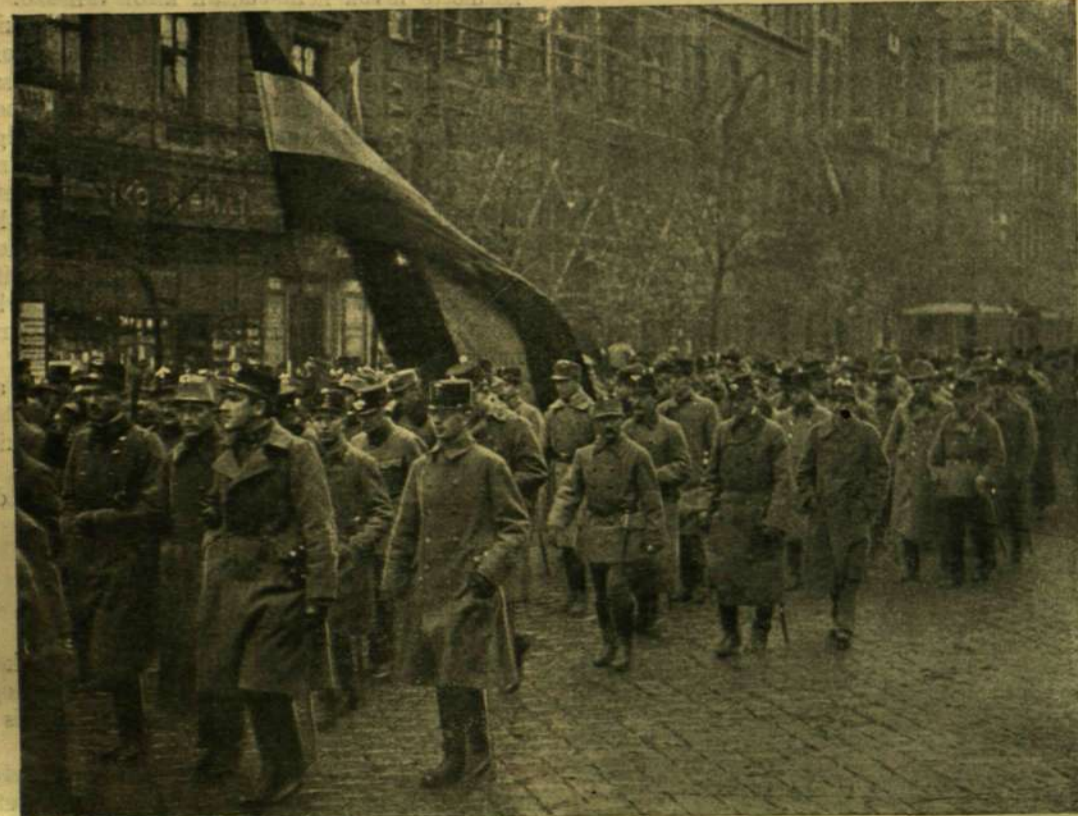
KATONATISZTEK AZ ESKÜTÉTELRE MENNEK.

Nos, a mi az eddigieket illeti, minden pontosan és elég észszerűen összevágott. Valentin tudta nyomozásai eredményeiből, hogy egy Brown nevű plébános Essexből hozott magával egy szafírral díszített keresztet, tetemes értékű ereklyét, hogy a kongresszuson megmutassa a külföldi papoknak. Ez volt kétségkívül az a kék kövekkel kirakott ezüst és Brown tisztelendő nem volt más, mint az a kis balek a vasúton. Abban pedig nem volt semmi csodálni való, hogy a mire Valentin rájött, arra rájött Flambeau is; Flambeau kifürkészett mindent. Abban sem volt semmi csodálni való, hogy Flambeau, hírt hallva a szafir keresztnek, megpróbálta ellopní. Ez volt