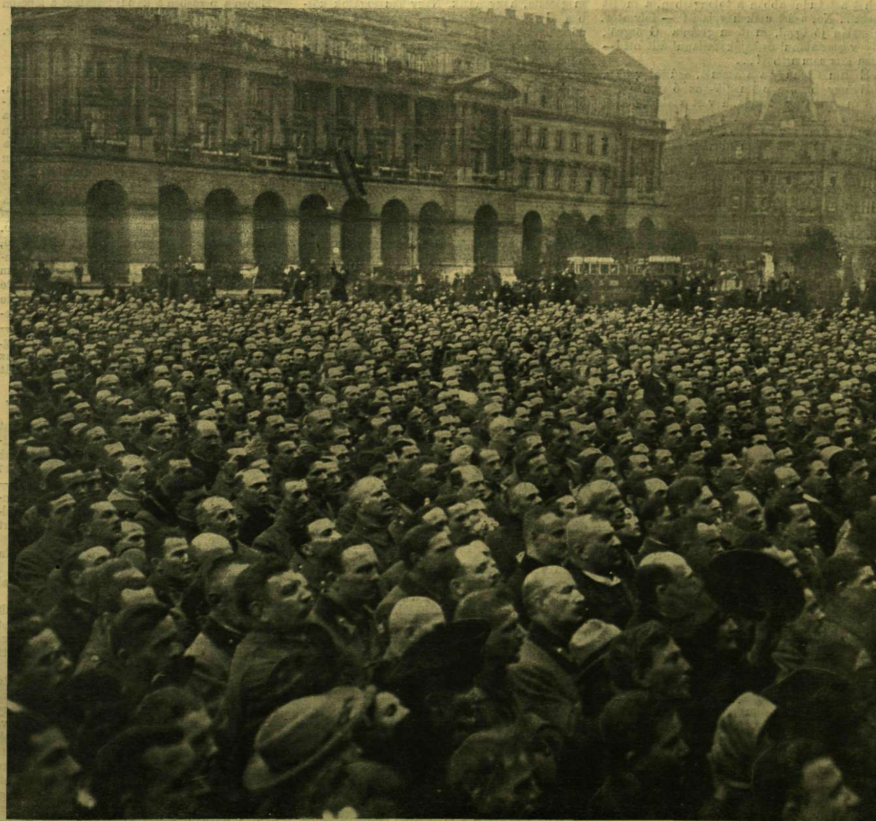
A TISZTEK LETESZIK AZ ESRÚT A NEMZETI TANÁCSNAK NOVEMBER 2-ÁN, A PÁRLAMENT ELŐTTI TÉREN.

Külföldi előfizetésekhöz a postailag meg- határozott vitéldij is csatolandó.