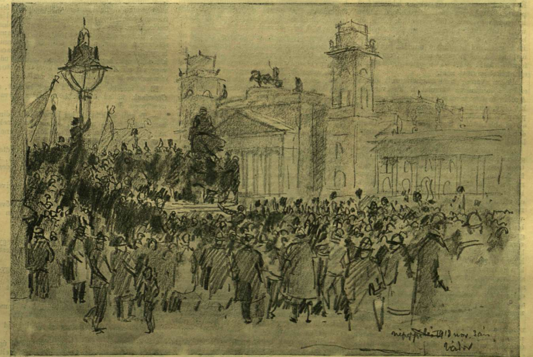
NÉPÜGYÉS A PARLAMENT ELŐTTI TÉREN NOVEMBER 3-ÁN. (A háttérben az igazságügyi palota.)

Mi e lapokon nem szeretünk politizálni. Nem kutatjuk, mi hogyan kellene tenni, minő czélok minő módon lennének megvalósítandók, de a nemzet érdekében kívánjuk a legelődsőbb sikert!