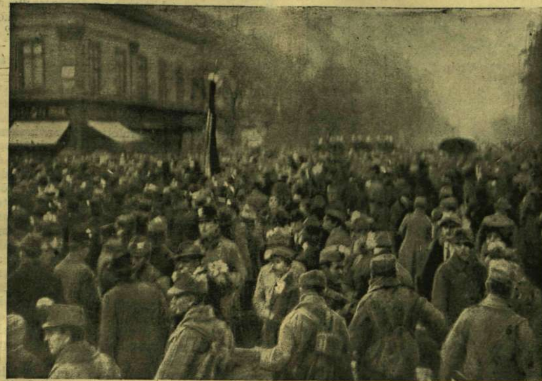
A NÉPTÖMEG A RÁKÓCI-ÚT ELEJÉN.