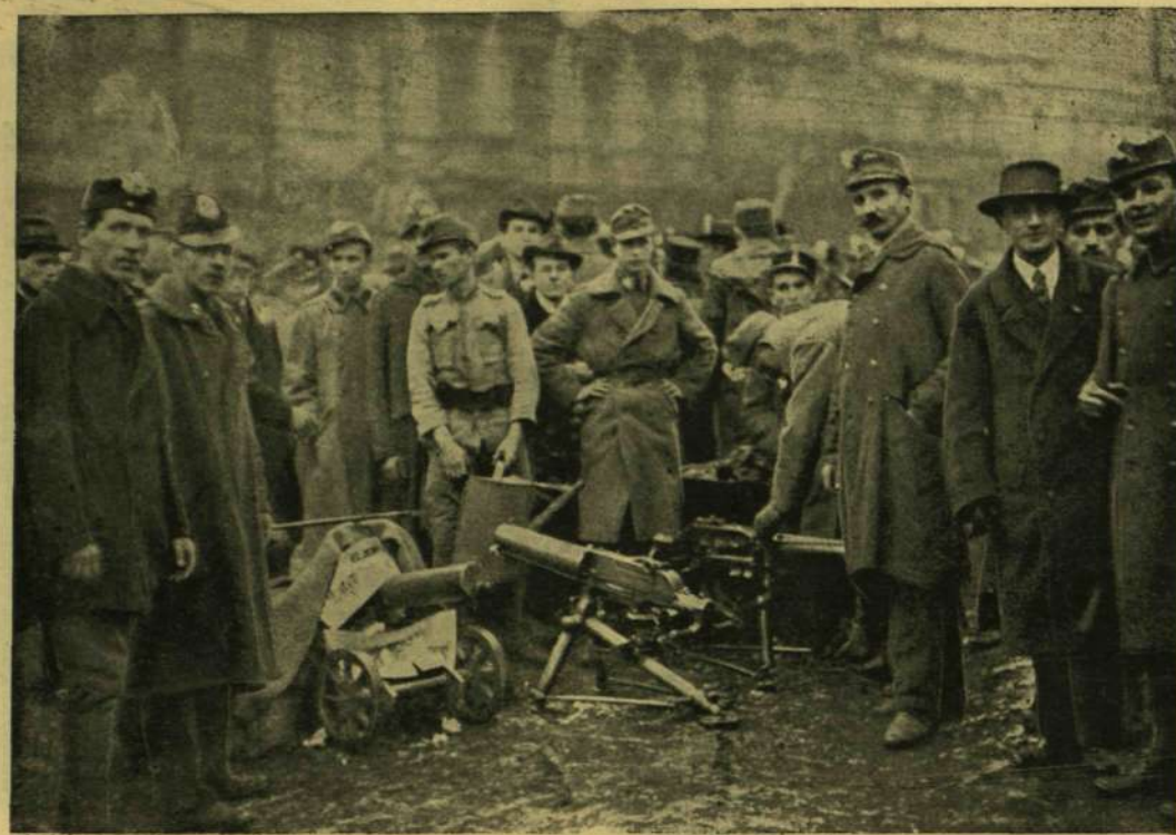
KATONA-ÖRSÉG GÉPFEGYVEREKSEL A KOSSUTH LAJOS-UTCZA TORKOLATÁNÁL.

— Kinek a palotája ez? — kérdezte, de senkit se látott, Volford is, Svidrony is eltűntek. egyedül állott egy óriási tereben és egy nagy fekete kandúr dörgölőzött a lábaihoz.