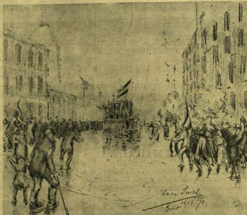
UTCAI JELENET OKTÓBER 31-ÉRŐL.