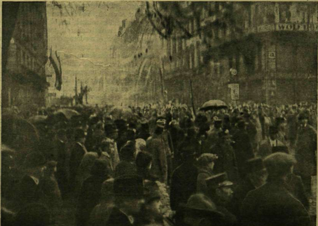
A KOSSUTH LAJOS-UTCZA REGGEL.