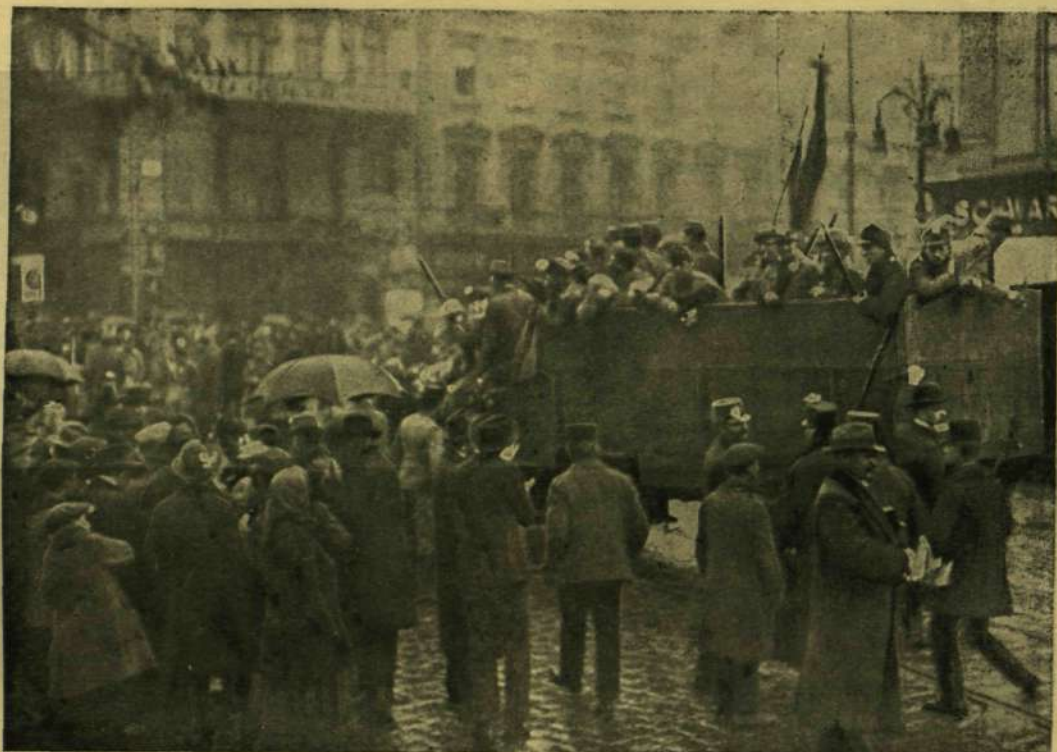
TEHERAUTÓN ÉRKEZŐ KATONÁK A NEMZETI TANÁCS SZOLGÁLATÁBAN.