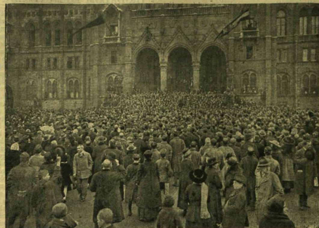
AZ ESKÜ A PARLAMENT ELŐTT.

A két alak, a kiket üldöztek, úgy mászott, mint két légy egy domb óriási zöld körvonalán. Láthatólag beszélgetésbe voltak elmerülve és talán észre sem vették, merre mennek, de