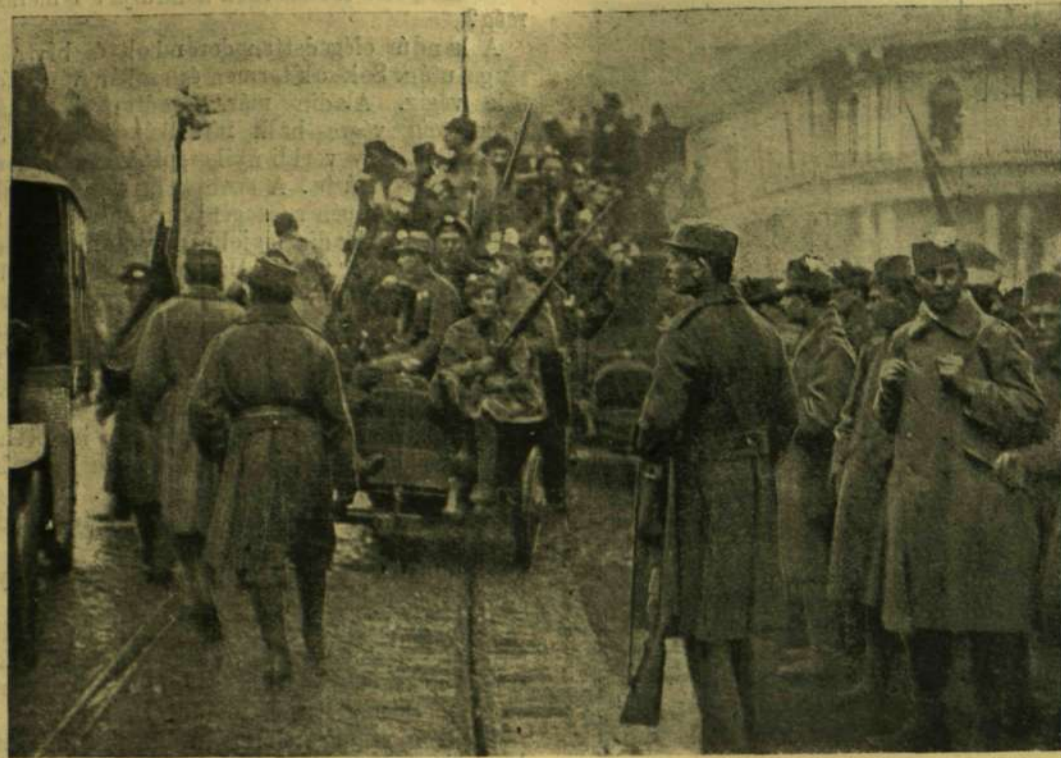
KATONAŐRSÉG AZ ASTORIA-SZÁLLODA ELŐTT.