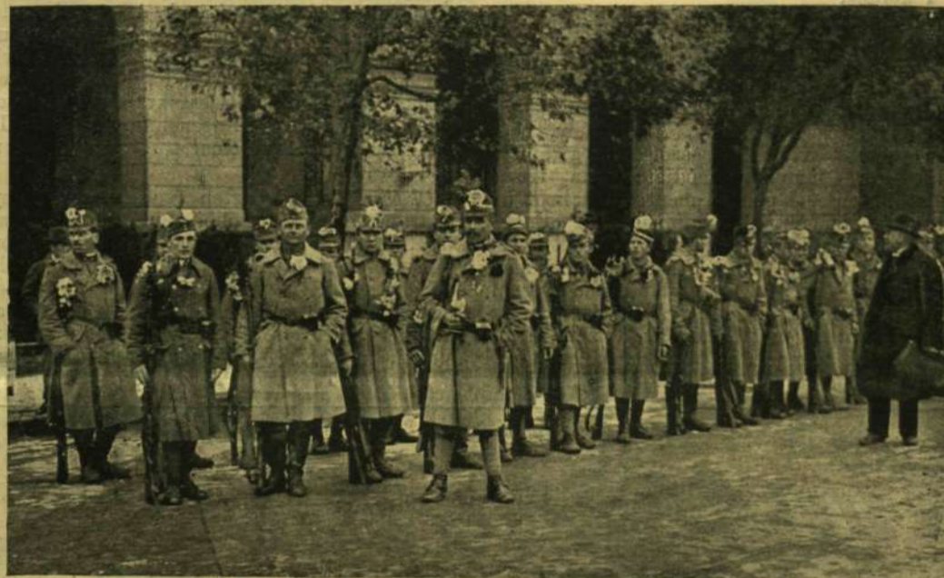
KATONASÁG A FÖLDMIVELÉSI MINISZTERIUM ELŐTT.

biztosan a Heath elhagyottabb és csöndesebb magaslati felé mentek. Mikor üldözőik közelebb jutottak hozzájuk, a szarvas-cserkészek nem épen méltóságjeljes mozdulataival kellett menniök, elbújniok fatuskók mögé, sőt hason is csúszniok a mély fűben. Ilyen kellemtelen mozdulatokkal a vadászok már olyan közel jutottak zsákmányukhoz, hogy meghallhatták a beszélgetésük neszt, de csak egy szót lehetett megérteni, azt, hogy ész, a mely gyakran visszatért magas és csaknem gyermekes hangon. Egyszer egy hirtelen horpadásban és a sűrű bokrok között a detektívek csaknem elvesztették szemük elől a két alakot, a kiket üldöztek. Kínos tíz percig nem találták meg újra a nyomot, egy nagy dombhajlás, a mely egy gazdag és elhagyott alkonyati tájkép fölé emelkedett. Ezen a megragadó, de elhanyagolt helyen egy fa alatt volt egy régi korhadt fapad. Ezen a padon ült a két pap komoly beszélgetésbe merülve. A ragyogó zöld és arany még mindig ott függött a sötétedő horizonton, de fölötte a boltozat páva-zöldből lassankint páva-kékre változott és a csillagok mindinkább valódi ékkövek módjára tűntek elő. Valentin némán intve kísérőinek, az ágbogas nagy fa mögé kúszott és halálos csöndben állva itt, most először hallotta a különös papok beszédét.