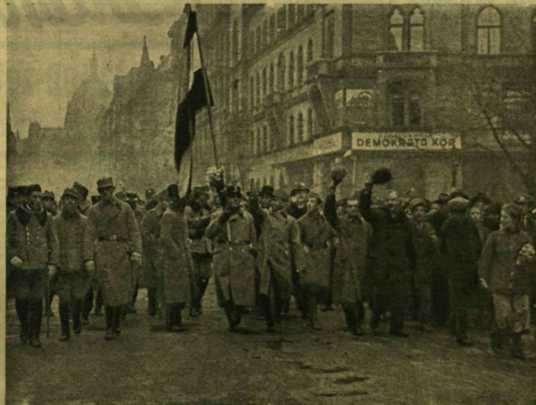
TISZTEK TÁVOZÁSA AZ ESKÜTÉTELÉRŐL.

Vagy másfél percig hallgatta őket, ekkor pokoli kétség kezdte fojtogatni. Hátha hiába vonszolta magával a két angol rendőrt az elhagyott esti pusztaságba, akárcsak mintha