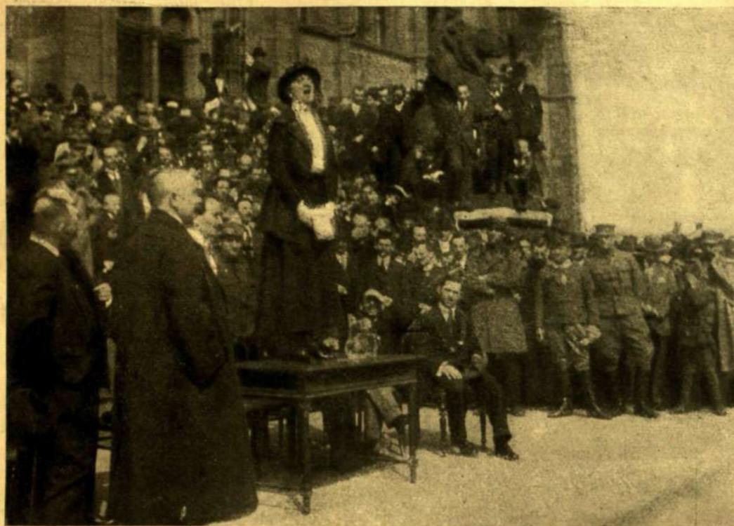
HETTYEY ARANKA, A NEMZETI SZÍNHÁZ MŰVÉSNŐJE SZÁVAL A SZÉKELY CSAPATOK FRONTJA ELŐTT.