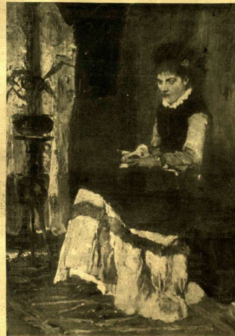
Munkácsy: Női arckép.

Elmosolyodott, a hátára csapta a zsákmányát s lesiklott a völgybe, mint a prédájával elsuhanó sas.