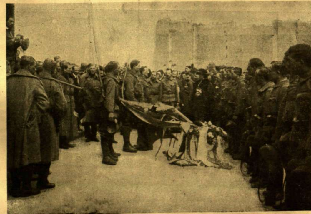
Az ezred zászlaját meghajtják a fogadalomtételkor

Ásitok, mialatt ő leszedi a szennyes tányérok