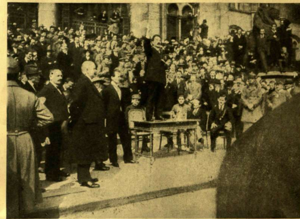
BOKÁNYI DEZSÓ NÉPBIZTOS LEKESÍTŐ BESZÉDE AZ INTERNATIONALE CSAPATOKHOZ.

papirdarabkára van kirakva, a süteményrészem egy mustártartóban, — itt ülök, szorosan közel egymáshoz, a homlokunkat és kezeinket ugyanaz a világosság egyesíti, többi részünket szegényesen beburkolja a végtelen homály. A mint itt ülök a roskadt karosszékekben, a kezemmel a rossz egyensúlyú asztalon, a mely ha az ember rátámaszkodik az egyik oldalán, sántikálni kezd a másikon, mélyen odaplántálnak érzem magamat, a hol vagyok, ebbe az ócska szobába, a mely rendetlen, mint egy kert, kopott, a homálytól ellankadt, a hol halkán belepi az embert a por.