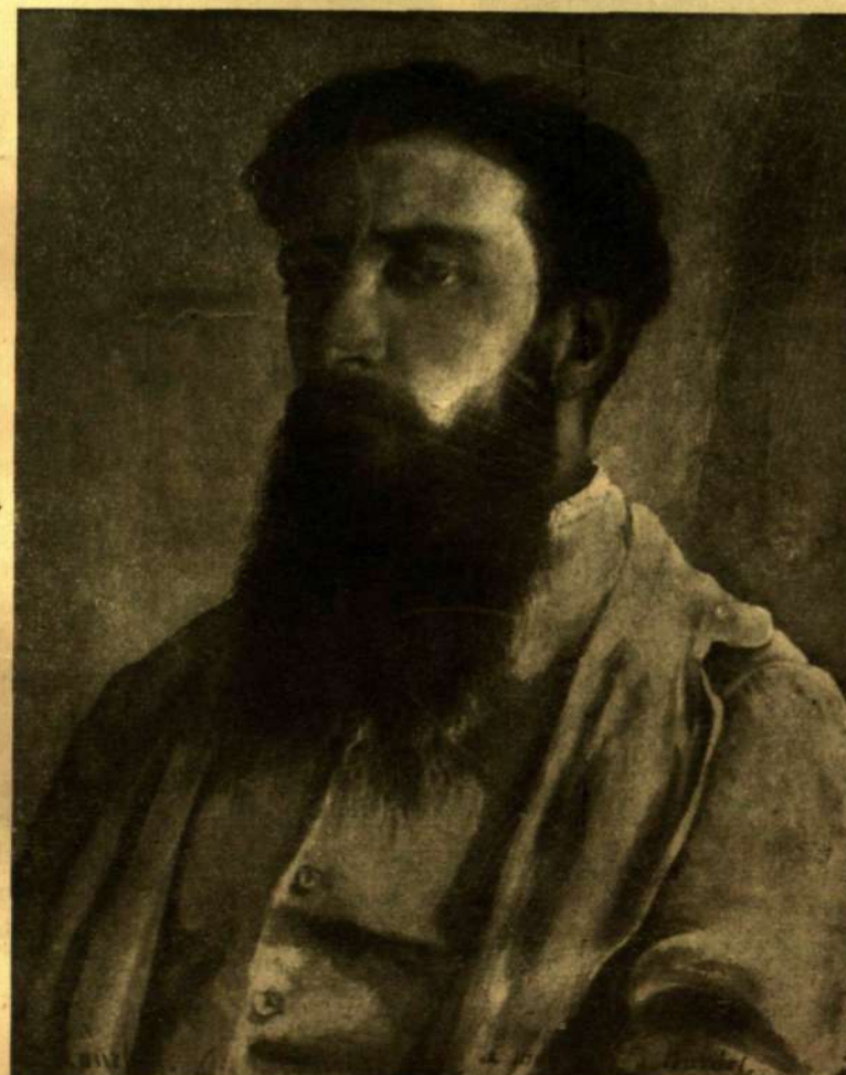
Courbet: Férfi arckép.