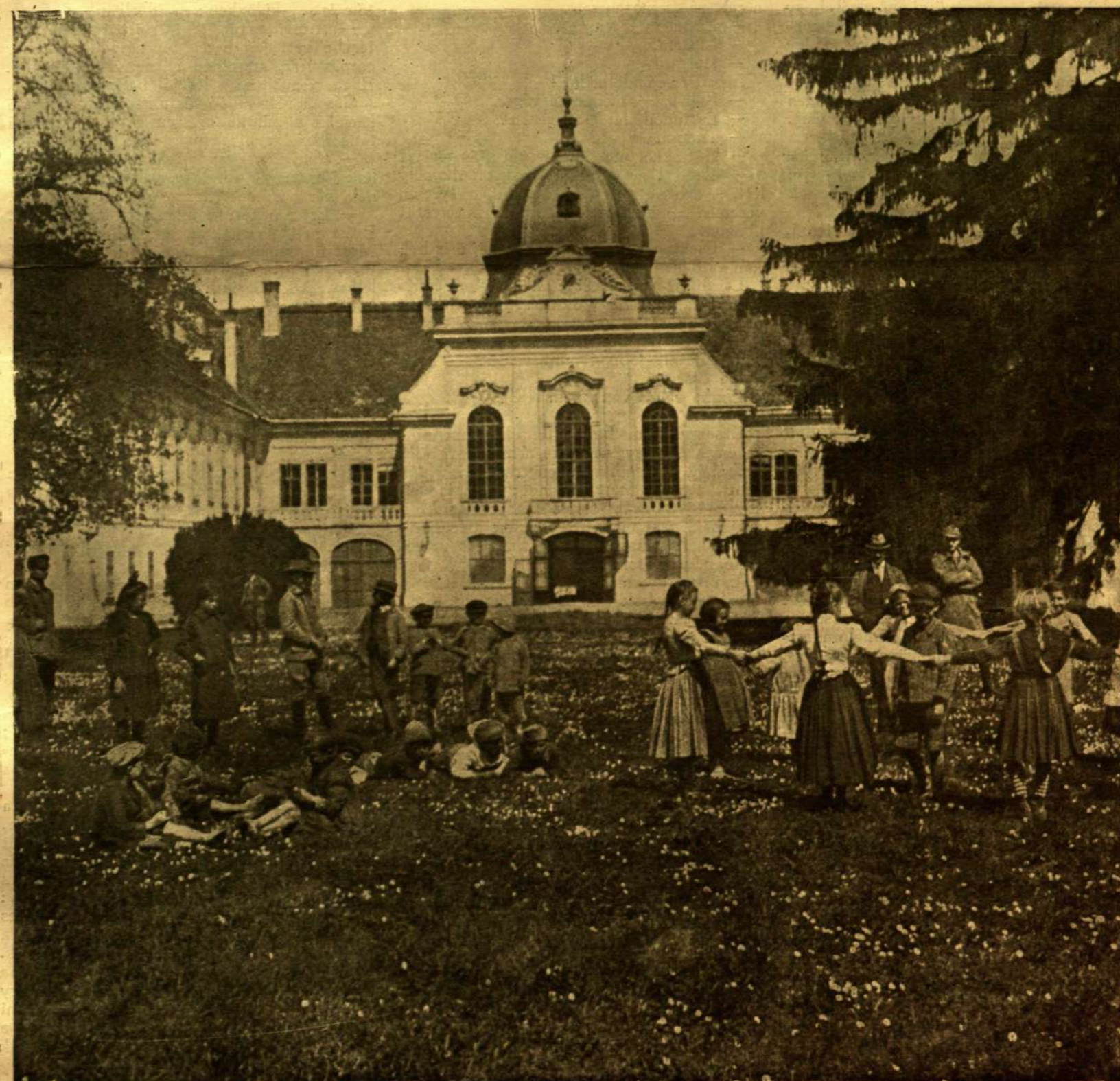
PROLETÁR GYERMEKEK JÁTSZANAK A GÖDÖLLŐI VOLT KIRÁLYI KASTÉLY KERTJÉBEN.

Külföldi előfizetésekhöz a postailag meg- alapított vitélő is csatolandó.