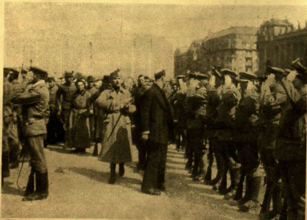
SZÉKELY EZRED FOGADALOMTÉTELE UTÁN FIEDLER REZSÓ HADÜGYI NÉPBIZTOS MEGSZEMLÉLI A CSAPATOKAT AZ ORSZÁGHÁZ ELŐTTI TÉREN ÁPRILIS 20-ÁN.

Egyszerre azonban hirtelen hozzámleptem. Rajta van a szürke és fehér szalagos köpeny-