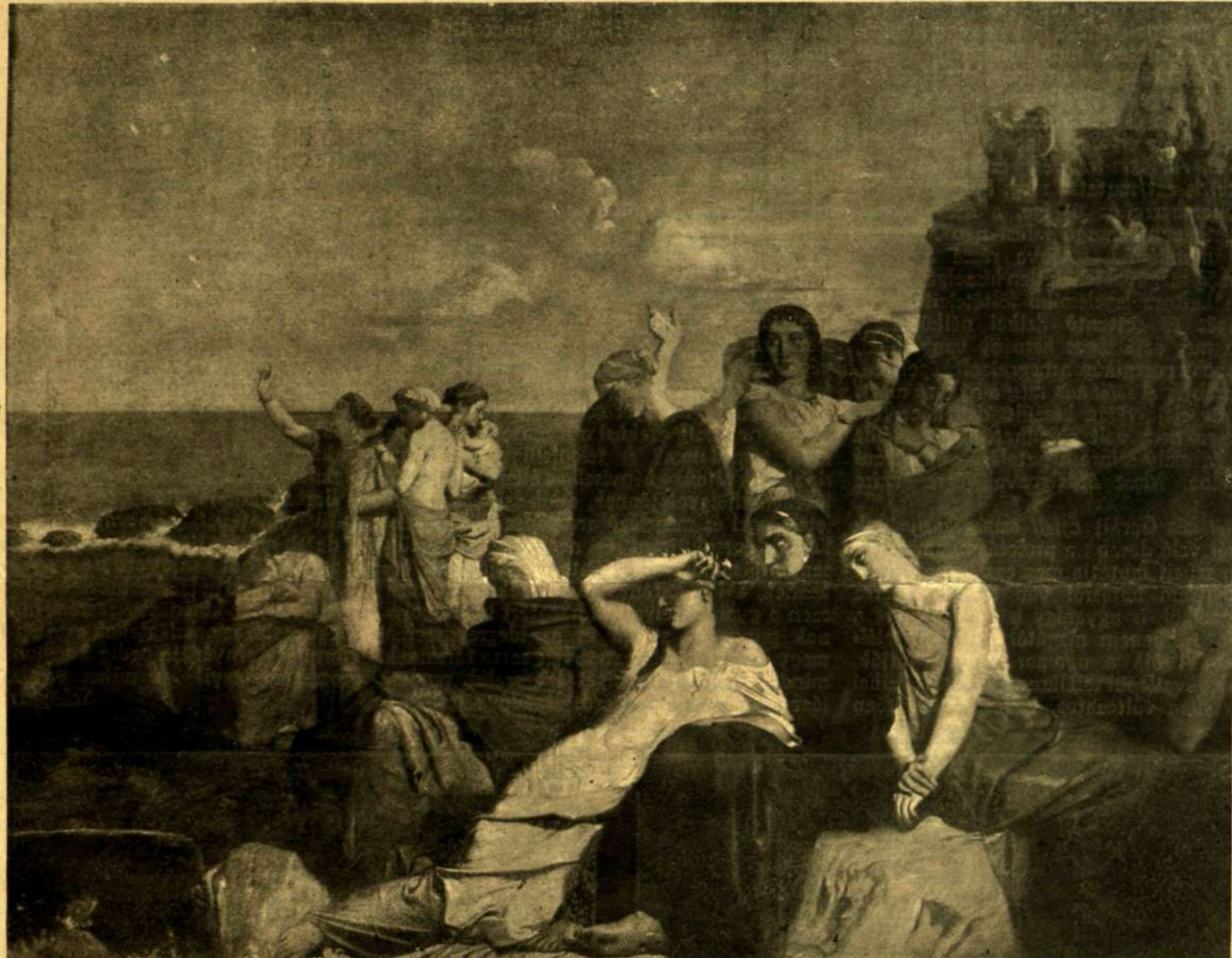
Chasseriau: A trójai nők siralma.

Jó széllel cserkészett a Magas-hegy borókásain végig; a legjobb nyúlvtó közelében hirtelen megtorpant. Valami finom parfüm ütötte meg az orrát: gyenge, de ingerlő peccenyellat. A lába is alig érte a havat, a mikor nesztelenül arra lopódzott. Az útról egy kis tisztásra nyílt a kilátás, a tisztás közepén álló mogyoróbokor tövében fagyott madárka feküdt hanyatt a hóban, mellének