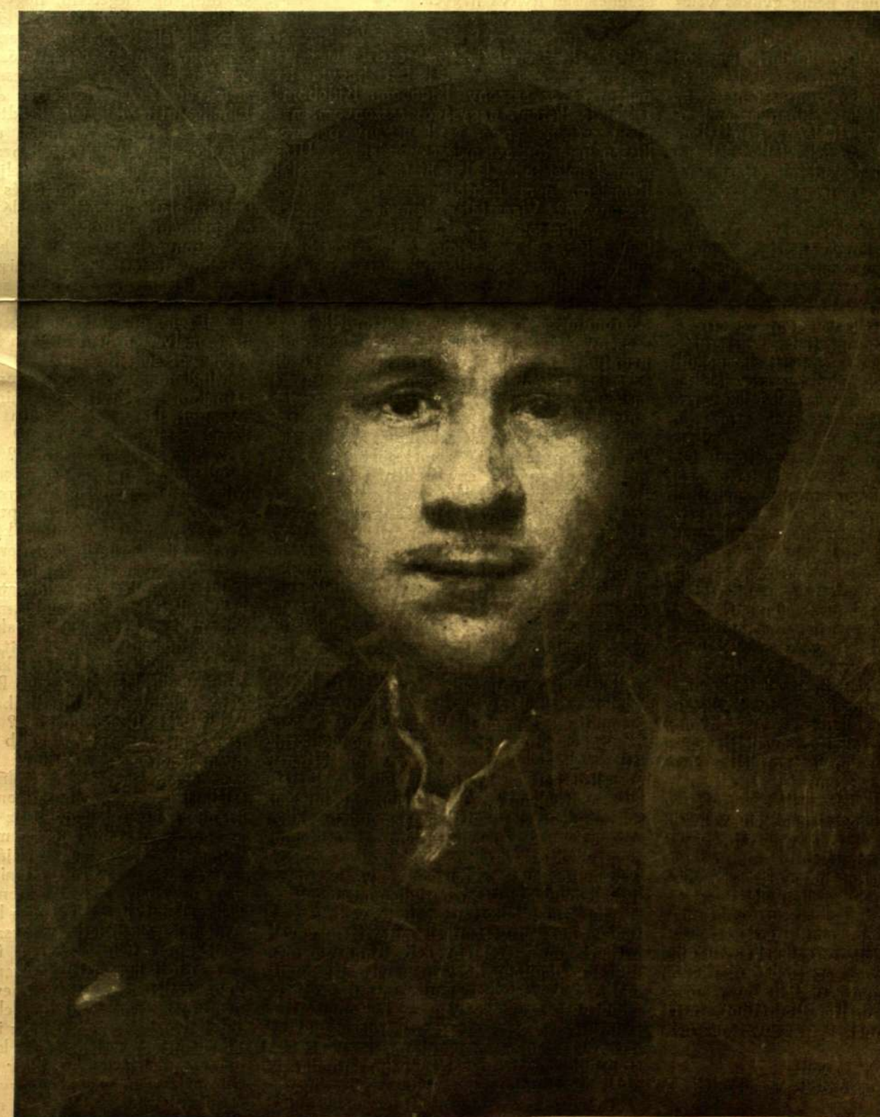
Rembrandt: Önarckép 1630-ból.

Külföldi előfizetésekhez a postallag megállapított viteldíj is csatolandó.