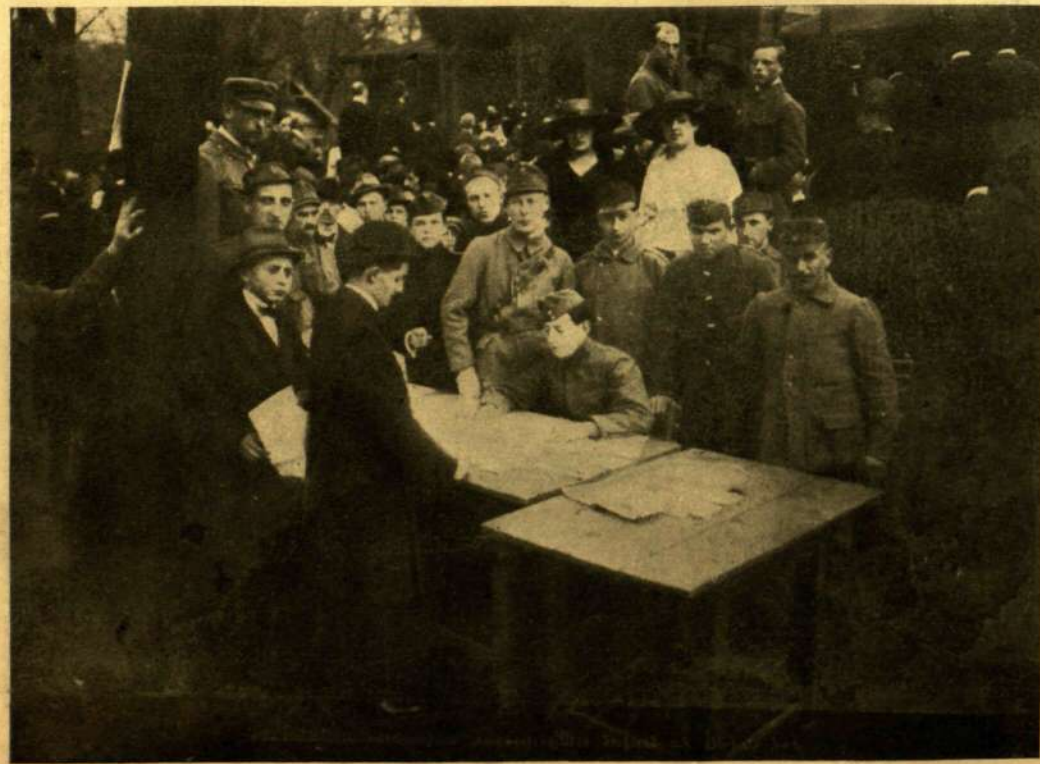
TOBORZÓ ÜNNEP A NÉPLIGETBEN.

A domb lejtőjén, a mely a patak partjáról emelkedik a gyár fensíkjaig, kibontakozik a kastély fehér geometriája. E körül a fehér-