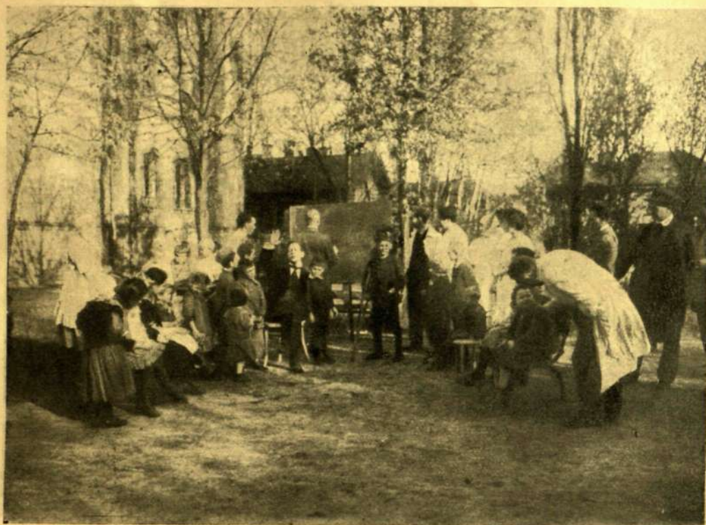
MESEDÉLUTÁNK A KÓRHÁZBAN A BRÓDY ADÉL GYERMEKKÓRHÁZ KERTJÉBEN ÁPRILIS 20-ÁN.

rint gondolkodás nélkül vetem bele magamat a szerelmi históriák szövevényébe, a melyeket most már közönségeseknek tartok. De nem tudok sohasem ellenállni az első varázslatos kísértésnek.