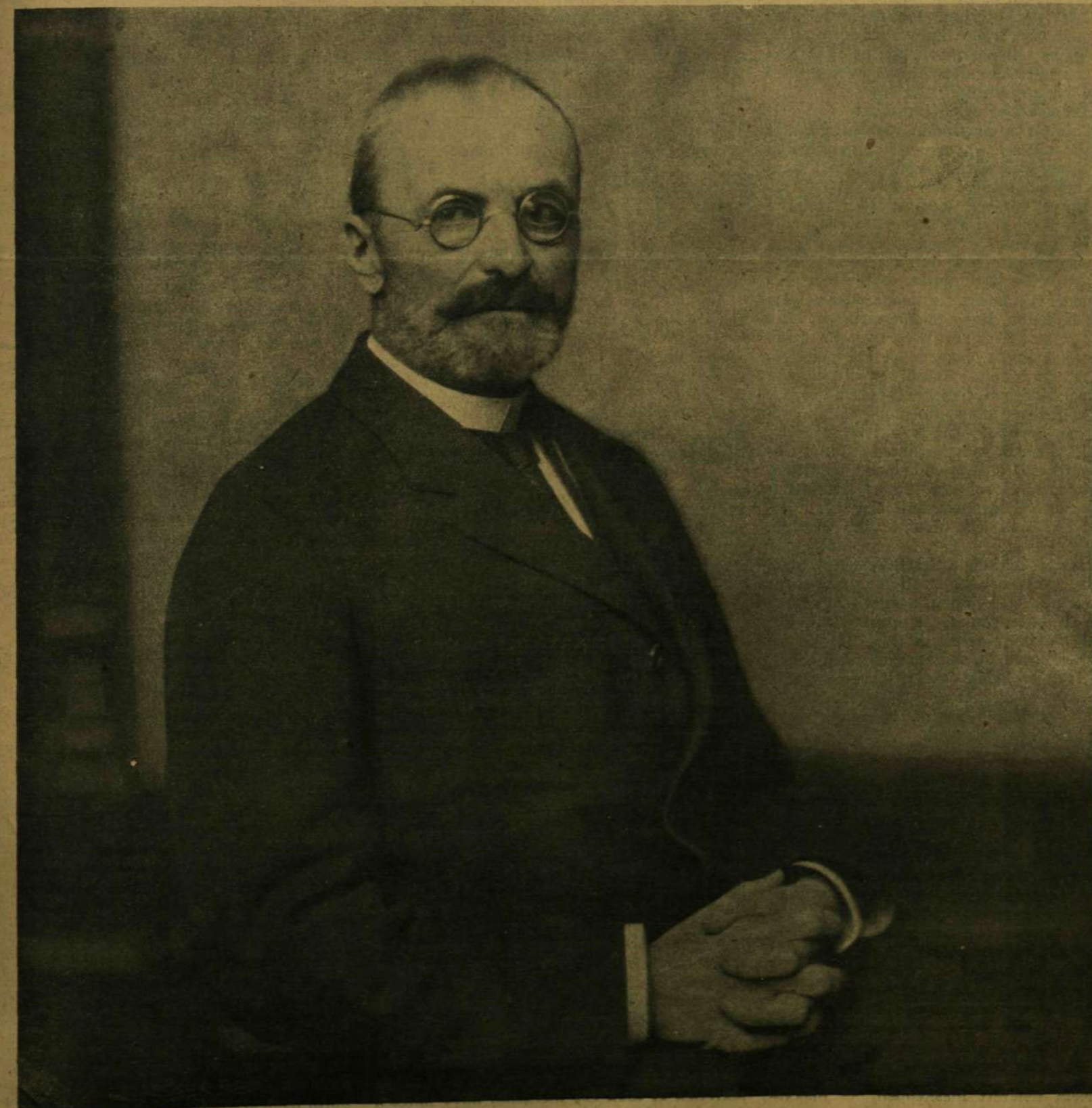
GRÓF TISZA ISTVÁN.

Külföldi előfizetésekhöz a postailag meg- állapított viteldíj is csatolandó.