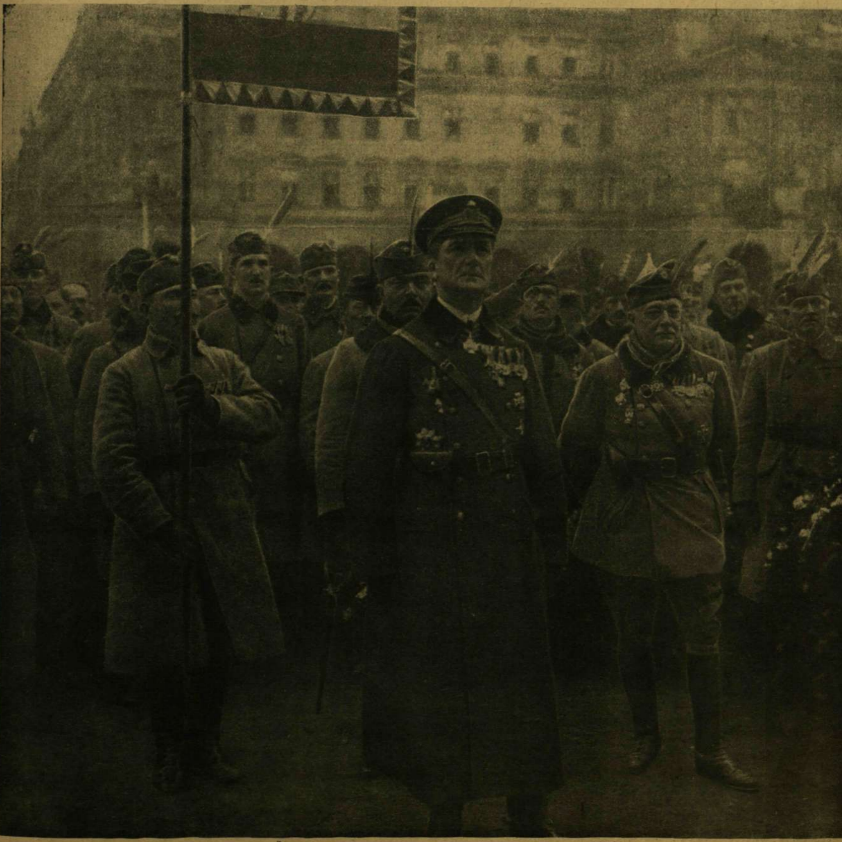
A MAGYAR NEMZETI HADSEREG BEVONULÁSA BUDAPESTRE. — HORTHY MIKLÓS FŐVEZÉR VEZÉRKARÁVAL AZ ORSZÁGHÁZ-TÉREN.

Külföldi előfizetésekhöz a postailag meg-állapított viteldíj is csatolandó.