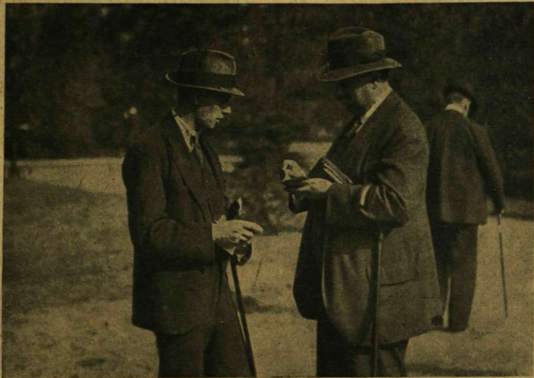
VALUTA-SPEKULÁNSOK A BUDAPESTI TŐZSDE ELŐTT.