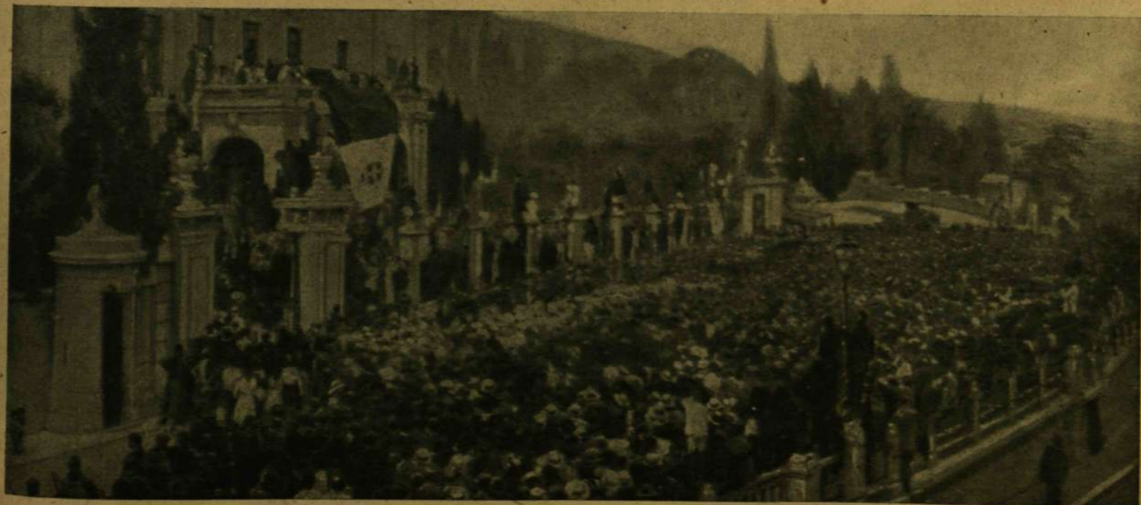
D'ANNUNZIO FIUMÉBAN. — D'ANNUNZIO A KORMÁNYZÓI PALOTA ERKÉLYRŐL BESZÉDET MOND FIUME LAKOSSÁGÁHOZ.