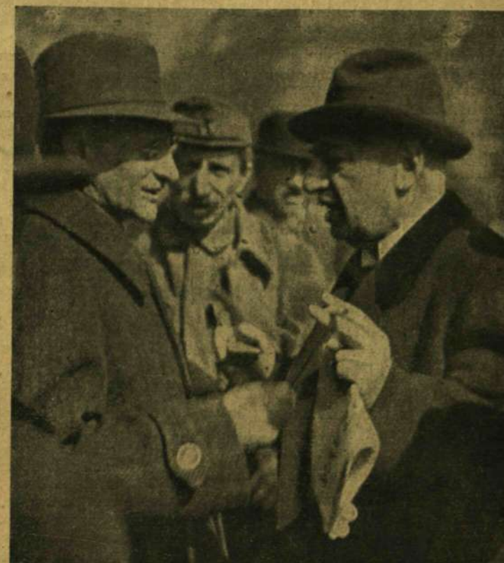
PÁR SZÁZALÉKOS VÉLEMÉNYKÜLÖNSÉG.

indulattal, de számukra én is csak egy voltam a sok közül. A front mögötti munkák szünetében kelletlenül csatagoltam, megfosztva énemtől a nyomorúságos közkatona- egyenruha által, a kit mindenki tegezhet s a kin nem állnak meg a nő szemek, melyeket a sarzsik vonnak magukra.