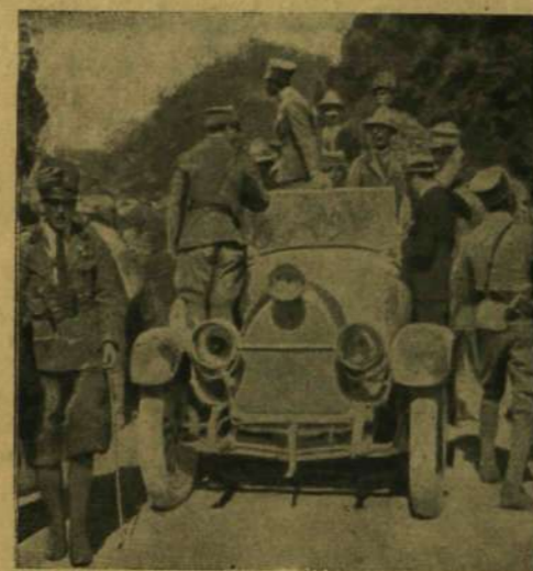
D'ANNUNZIO ÚTKÖZBEN AUTOMOBILRÓL SZÓNOKOL KATONÁIHOZ.

— Ugye?! — Pardon, se egyik, se másik. Az ön hevessége mit se változtat az én tudományos meggyőződésemen... — De uram, — vettem át a szót, — ez a kép pár hónappal ezelőtt, a tavaszi Frollo-péléri nage-kor még Laura volt, igaz-e? — Ugy van, Monsieur. — Nos, mi az ördög fordított ily rövid idő alatt ekkorát az önk úgynevezett tudományos meggyőződésén? — Megmondom, Monsieur: a Frollo halála. Nézze, mi régóta tudjuk már, hogy ez