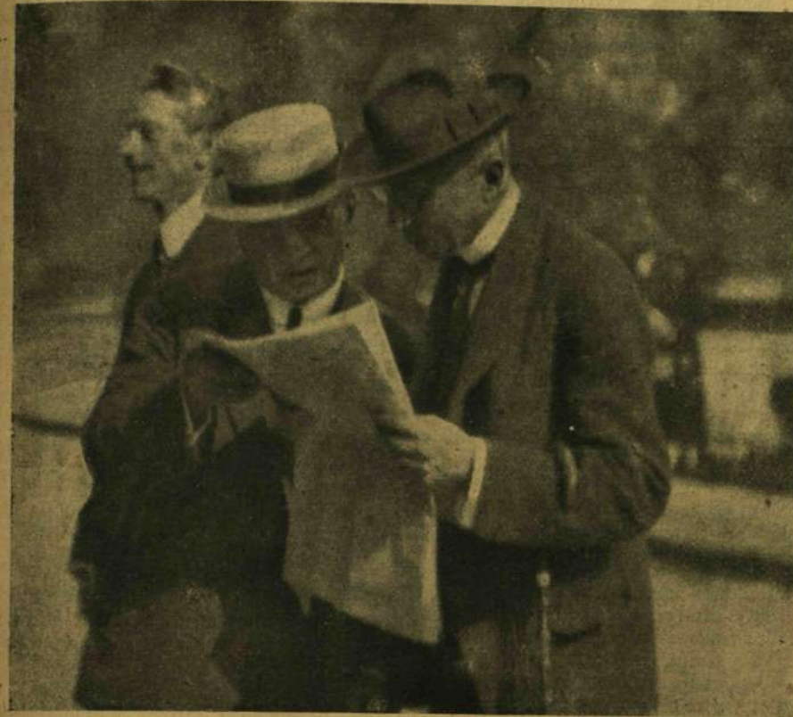
A BÉCSI TŐZSDE HIREK.

Nem volt már rajtam a hátizsák, sem a kenyeres tarisznya, beleburkolóztam köpenyembe. Csendben maradtam, körülvéve a láthatár széléig a mechanikus háborútól, fejem fölött az eleven mennydörgésekkel. Szép csöndesen megkönnyebbittem, megnyu-