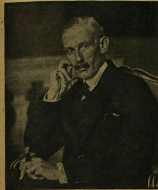
SIR GEORGE CLERK, AZ ÁNTÁNT BUDAPESTI MEGHATALMAZOTTJA.

— Ugy van, hiszen ez csak világos, kedves tudatlan testvérem, — felelte Ilon rögtön, egy pillanatnyi tétovázás nélkül, a legtermészetesebb hangon — az egyik nem zárja ki a másikat, hiszen nincsen ember fenéki tejfel, ezt te is tudod... de ez a Borbáth veled szemben mindig és minden körülmények között ideálja lesz a finom férfinak, tudod miért? mert föltétlenül imád téged, ezt én mondom neked, a ki értek a dolgokhoz, és ez nem is olyan nehéz eset, tudod, hogy nem vagyok hiszélő, hanem őszinte, igaz, szókimondó természetű vagyok, és én mondom neked, hogy ő imádja benned a nagy tehetséget és imádja a finom, előkelő, jószág asszonyt, mert te ez vagy, és ha ő máskülönbön gazember is, a miről adataim egyelőre nincsenek, de veled szemben föltétlenül gyöngéd, bájos, meghatóan szerelmes, finom, ő, én mindezt jól látom, és azt a sok virágot is jórészt ő adta, te! ha nekem egyszer ilyen kifogástalan férj kínálkoznék, mert ő itt nagy úr, pénze is van bőven, szép vagyona, én mondom, mert érdeklődtem ezek iránt az apró, mellékes körülmények iránt is, két kézzel kapnék utána és úgy fogná, hogy soha többé el ne vesztsem, mert nagyszerű dolog,