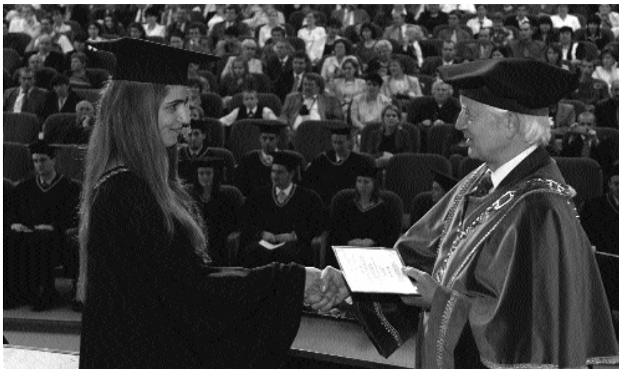
Az első diplomaátadás a karon 2005-ben