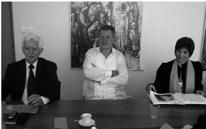
Az Árpád fejedelem-emlékdíj átvétele 2007-ben