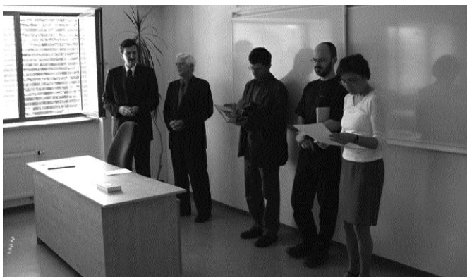
A kari TDK megnyitója