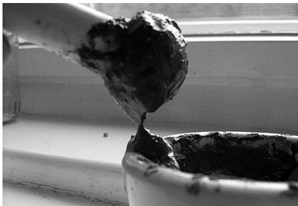
1. ÁBRA: Fonálpróba a kötöttség meghatározásánál

A vizsgálat menete a következő: 100 g légszáraz talajt mozsárban eldörzsölünk, majd bürettából (kisebbsé elvárt pontosság esetén ml-es beosztású fecskendőből, mérőhengerből) apránként ioncserélt/desztillált vizet adagolunk hozzá, közben a mintát a vízzel eldörzsöljük. Mikor a talaj a vizet nehezebben nyeli el, dörzsölés közben is megcsillan felületén a víz, úgynevezett fonálpróbát lehet rajta bemutatni. A mozsártörőt lassan kihúva az eldörzsölt mintából a talajminta és a mozsártörő között néhány milliméter hosszú, közepén elkeskenyedő talajhíd, fonál képződik (1. ábra), amely elszakadva visszakunkorodik. Ekkor leolvassuk a fogyott vízmennyiséget milliliterben, és a 3. táblázat alapján meghatározzuk az