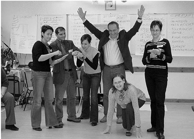
Lions Quest képzés a kisvárdai Bessenyei György Gimnázium és Kollégiumban Aki a rajtot indítja, a tanulmány szerzője

részvételt követően lehet hozzájutni, és a képzés teljesítése a feltétele az anyagok saját oktatói tevékenységben történő felhasználásának is. Így történt, hogy kíváncsiságomnak engedve kollégákkal, szülőkkel együtt én is teljesítettem a harminc órát.