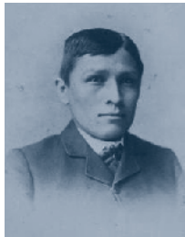
Carlisle előtt és után