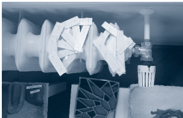
GYIK40 A radiátoron falapocskákból készült legyező mesél a fényről az asztalon fekvő festett ólomüveg lapocskának

Karácsony Sándor filozófiai eszméit Nyugati világnézetünk felemás igában c. könyvében foglalta össze (Budapest, Szövétnék, 1933), neveléstudományi művei kiegészítéséül a Csökmei Kör ezt is megjelentette 2012-ben (Széphalom Könyvműhely, Budapest).