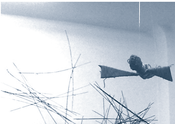
GYIK40 Magányos piros madár az égi bozótban