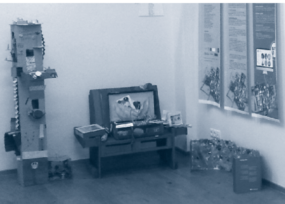
GYIK40 Az egyik sarok, felbőkarcolóval és apró kincsekkel

A tankönyvi változtatások szükségesek – az OFI szerint is azonnal ki kell javítani, amit egyszerűen lehet – nyilvánvaló azonban, hogy a társadalmi feszültségek csökkentéséhez ennél jóval többre van szükség. Jelenleg jó munkakapcsolatok alakultak ki, és ez a kölcsönös bizalom rendkívül fontos ahhoz, hogy megszűnjön a „rosszban sántikáló tankönyvszerző” és a „kákán is csomót kereső elemező” sztereotípiája. Minden roma témájú tartalom a cigányság helyzetének jobb megértése szándékával került be a tankönyvekbe, de valóban előfordulhat, hogy ezek a tartalmak az osztályteremben másként értelmeződnek – ezért fontos, hogy a kontextus megelőzze az előítéletes értelmezést, főleg az olyan szövegek esetében, amelyek célja éppen a különböző gyerekek egymásról alkotott képének és viszonyának közelítése lenne.