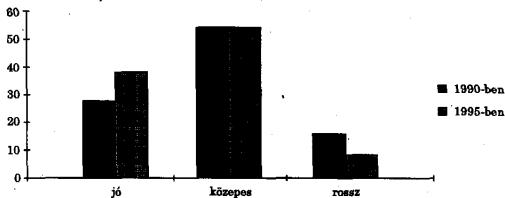
2. ábra – Az oktatás színvonalának alakulása az elmúlt tíz évben 1990-ben és 1995-ben százalékban