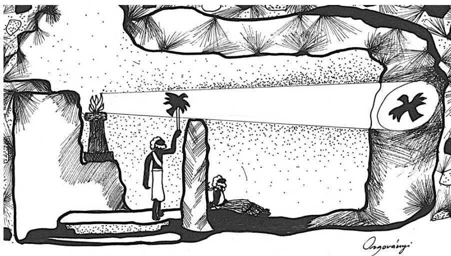
„Illusztráció Platón barlanghasonlatához”