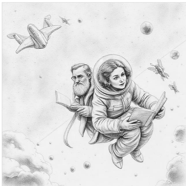
Híres tró a liminalitásban, emberekkel (2)