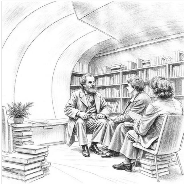
Híres tró a liminalitásban, emberekkel (1)