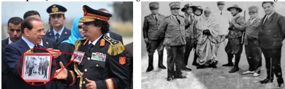
1 számú kép: al-Qaddzafi és Berlusconi kézfogása 2009-ben, illetve Omar al-Moktar elfogása