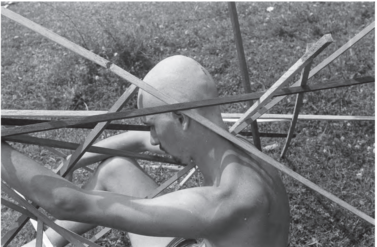
Personaj Strungar (Esztergályos), 1975