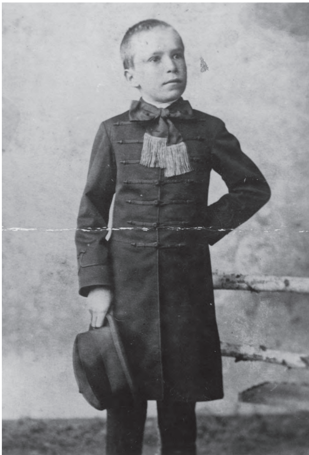
Juhász Gyula 13 évesen. A nagyváradi Ady Endre Emlékmúzeum gyűjteményéből