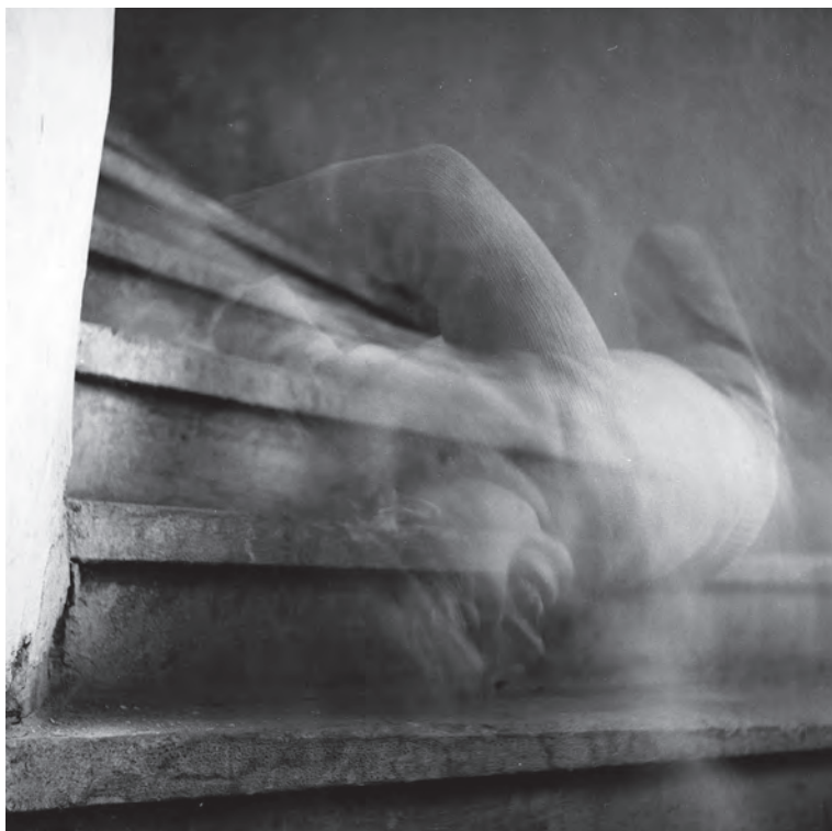
Personaj căzând pe scări ( Lépcsőn guruló alak ), 1986