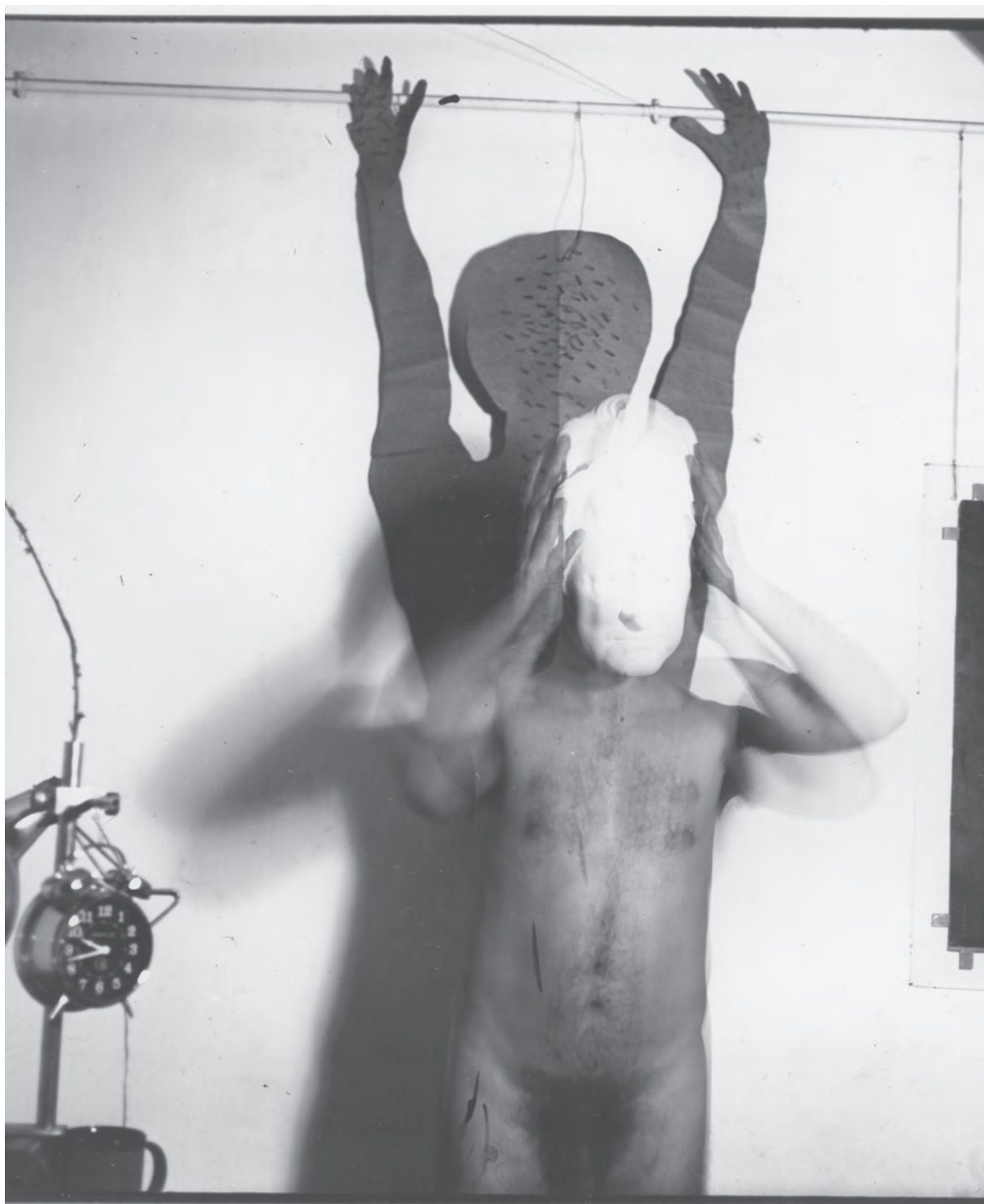
Personaj în mișcare în spațiu închis II (Mozgó alak zárt térben II), 1987