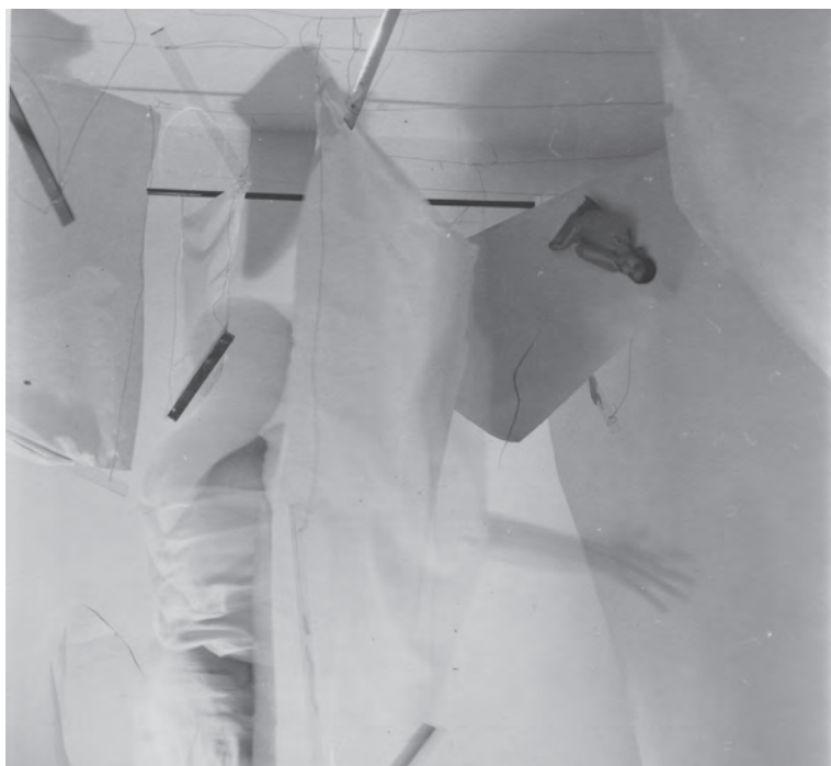
Studiu instalație cub II ( Kocka installációtanulmány II ), 1987

dék hasonlósága alapján, hanem inkább a dada szellemiségében fogant műtípus okán. Az 1990-ben a belső szervek anatómiájának szemléltetőeszközével kollázsolt önarcképét ( Autoportret ca mulaj anatomic ) Man Ray Ruhafogásával lehetne összevetni, minden szempontból annak az ellentétét látjuk itt. És amikor férfi művészsünk egy női önarckép montázsban mutatkozik ( Self Portrait in Drag , 1985), kénytelenek vagyunk idézni Marcel Duchamp L. H. O. O. Q. Ceruza a Mona Lisa reprodukcióján című művét és annak „margójára” írt idézetét: „Muszáj vitatkoznom magammal, nehogy alkalmazkodjam a saját ízlésemhez” 8 . A fiatal, bajszos Király sem szeretne saját ízléséhez alkalmazkodni, akár Duchamp, ő is identitás-játékot követ el, saját testére női melleket vetít, semmi sem konkrétan az, ami, kicsit ironikus, kicsit szimulákrum. A szürrealista maszkok vagy tükrök mögé bújtatott Ego mágikus tetteinek árnyékában, fényérzékeny hordozófelülete vagy a mai technikai képe éppen olyan rejtőzködés, mint amit a „nagyok” fényképein látunk; mindegyik más-más problémát feszeget. A kommunikáció különös változatára bukkanunk akkor is, amikor aktképeket helyez a térbe és ő maga áttetsző nejlonfóliák mögé húzódik, de hasonlóan érdekfeszítő látványt nyújtanak disznócsülkökkel mixelt aktfotói a Drems (Álmok) sorozatból.