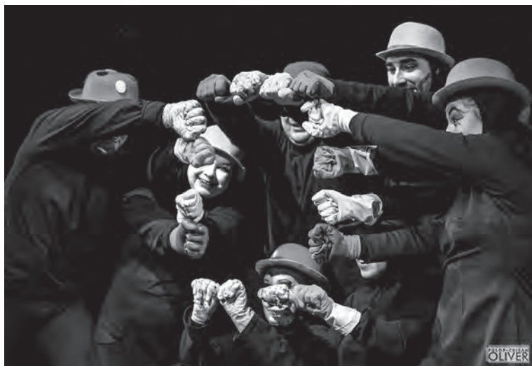
A Négyszögletű Kerek Erdő lakói

Mivel már nincs meg Iszkázon a szülői ház, a Nagy László- emlékház alkotószobájában fog lakni. Hozzáfűzte: Göncz Árpád ott fordította A Gyűrűk Ura trilógiát. Csoóri Sándor is