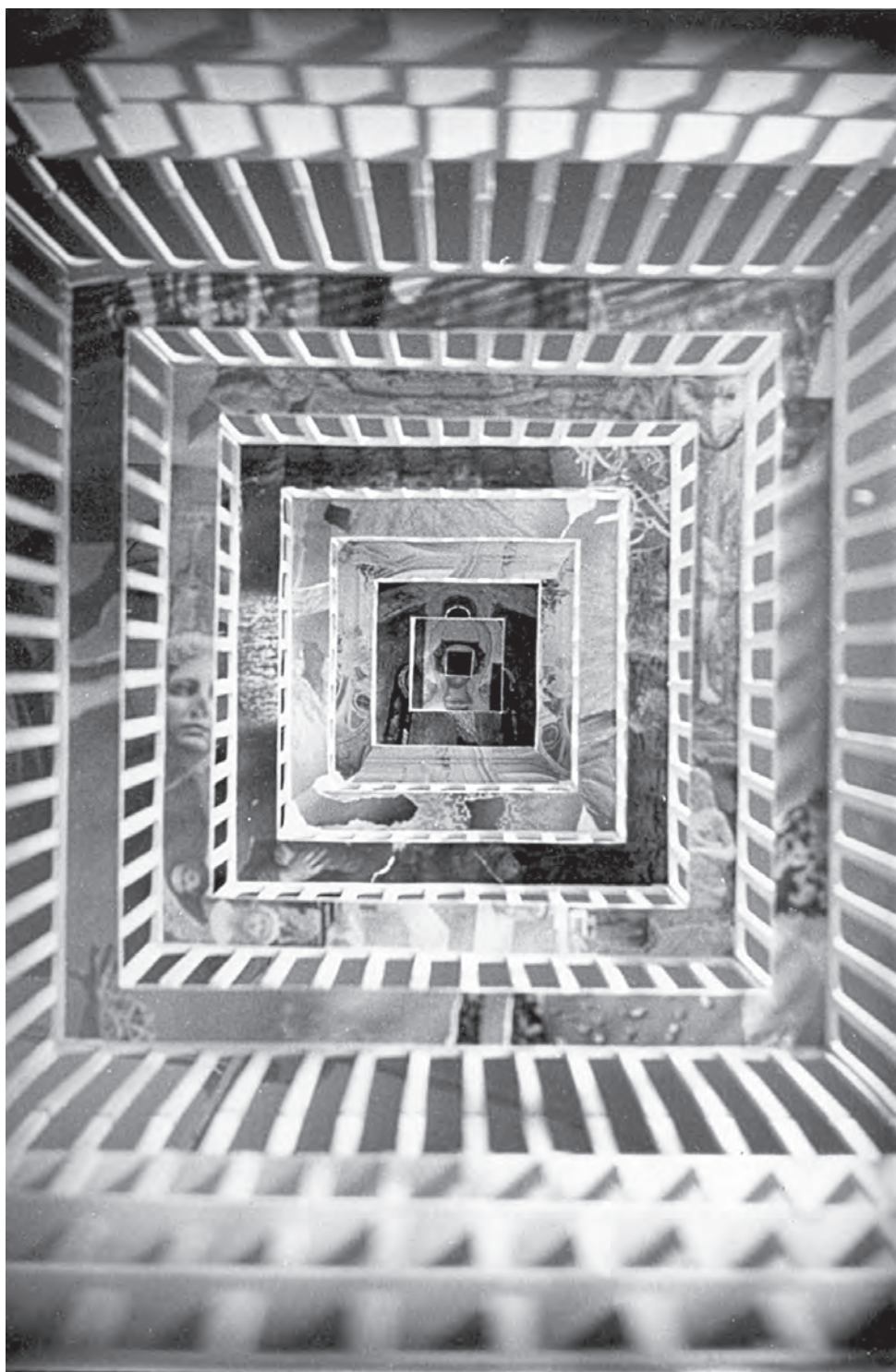
Antibabel (Antibábel), 1983