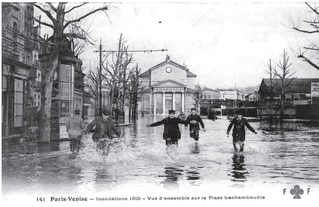
141 Paris-Venise — Inondations 1910 - Vue d'ensemble sur la Place Lachambaudre

ha jön. De most szörnyű volt a veszély, egész Párizst fenyegette mindenestül, s ha csak a Louvre elpusztul, nagyobb világkatasztrófa történt, mint Trója pusztulása. És a modern Ninive népe odaállt az ár elé, ez a léha Párizs elhatározta, hogy leckét ad a komolyságból és emberi méltóságból a világnak. Ez a tragikai fenség, mikor az emberek odaállnak megvadult elemek elé, s azt mondják: nem félünk, föl vesszük a harcot.