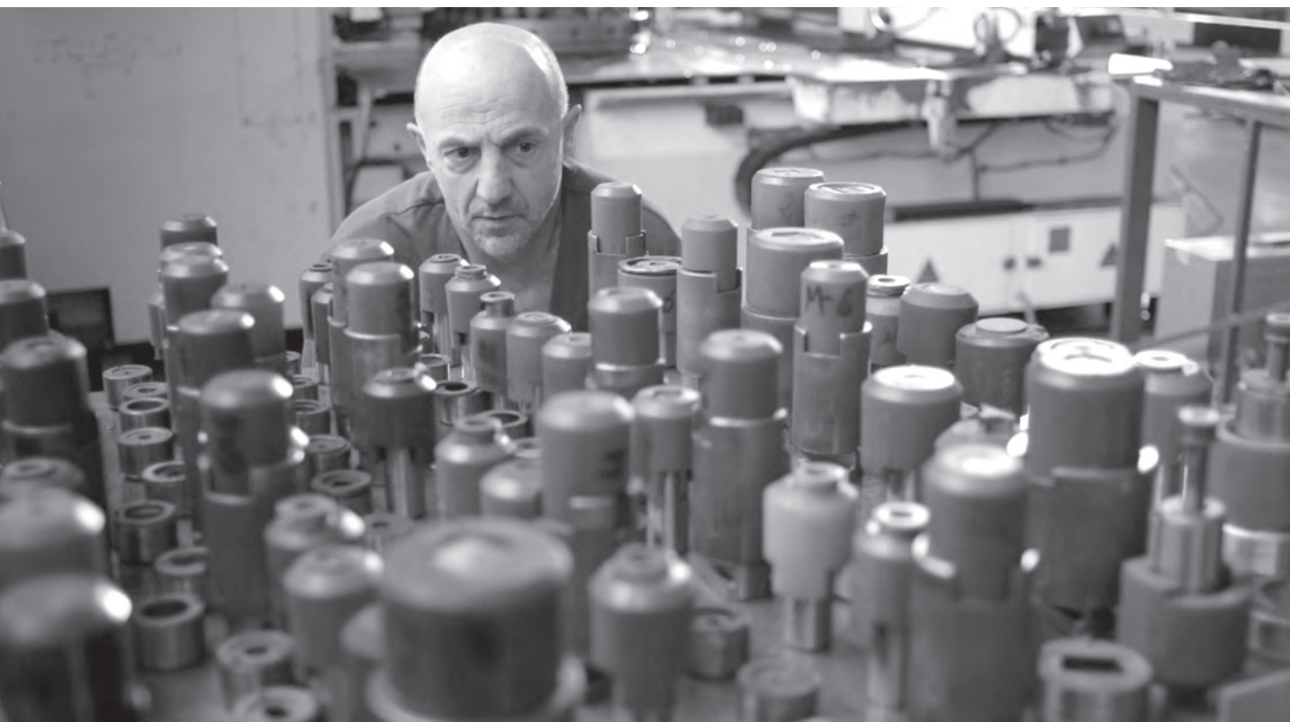
Deus et machina, Koldo Almandoz, 2012