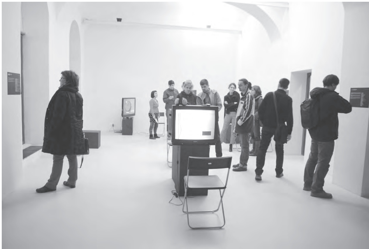
Részlet a kiállításról