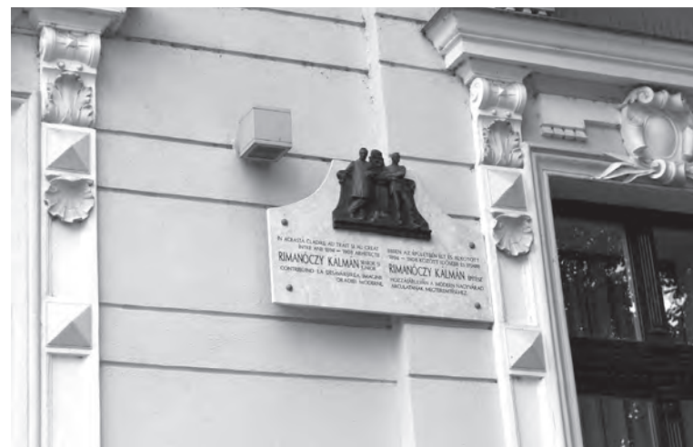
Fura elhelyezést kapott a Rimanóczy-emléktábla

Rimanóczy Kálmán ról van utca elnevezve, az azonban, hogy ifjabb Rimanóczyról (Nagyvárad, 1870. május 1. – Bécs, 1912. június 11.) vagy idősebb Rimanóczy Kálmánról (Kapu-