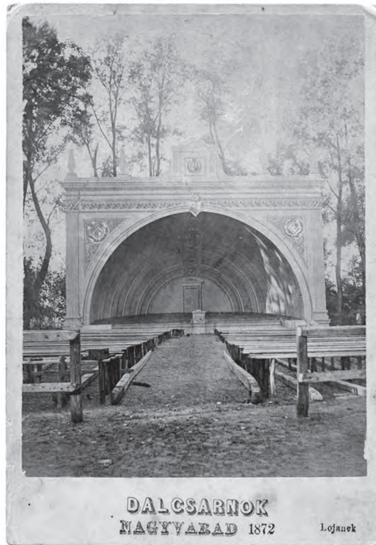
A Rhédey kerti dalcsarnok

őket a pécsi és a kolozsvári dalkörök követték. Nincs lehetőségünk arra, hogy a szeptember 7-i díszhangversenyt is magába foglaló többnapos rendezvényt ismertessük. Azt ellenben tisztáznunk kell, hogy mi lett a sorsa a Rhédey kerti dalcsarnok épületének. Véletlenül akadtam rá a Színháztudományi Szemle 1991/28. számának egyik tanulmányában arra, hogy a váradi dalcsarnokot később csőd miatt bezárták. Ebből arra lehet következtetni, hogy rövidesen le is bonthatták, hiszen K. Nagy Sándor az 1885-ben megjelent Bihar-ország című útirajzának második kötetében többek