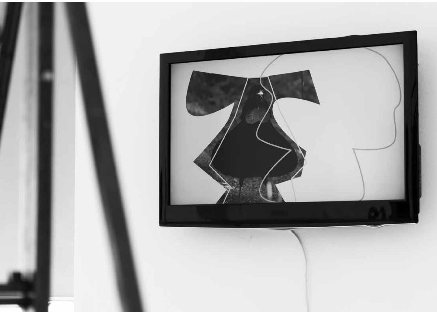
Komoróczy Tamás: Megjelenés, 2017, full HD, 10:30