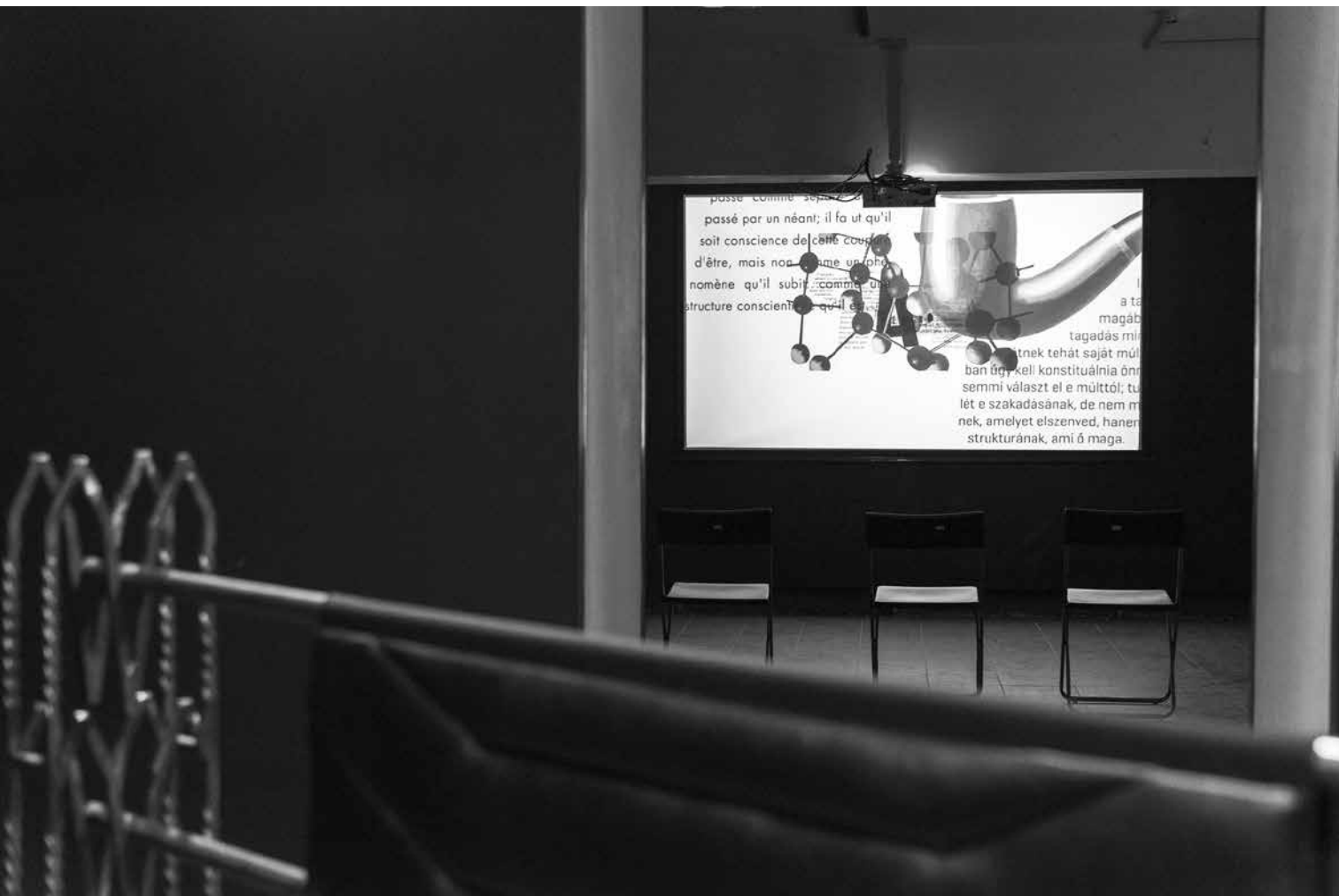
Komoróczy Tamás: Oszd meg és lépj ki, 2018, full HD, 07: