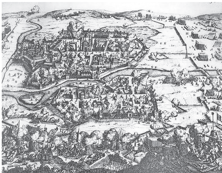
Az 1691. évi ostrom ábrázolása az Olaszi feletti emelkedőről nézve

Az 1691. évi térképen a Nagyváros nyugati falán túl egy sarkain bástyaszerűen megépített erődítmény is látható, ez