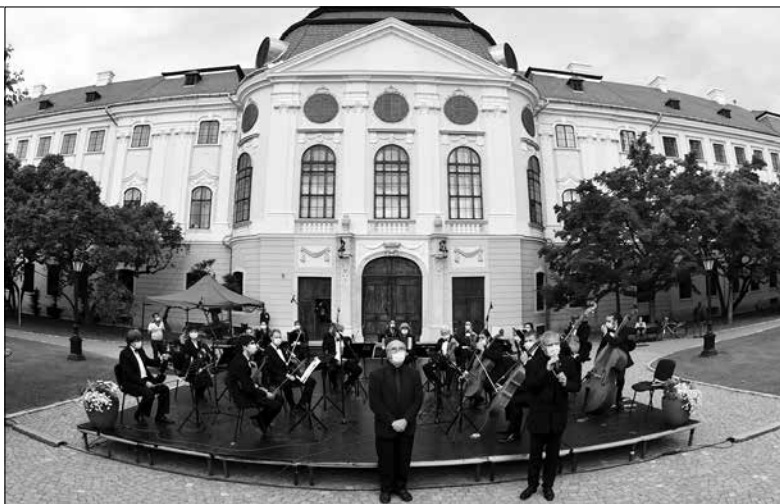
A zenészek nem tartottak tőle, hogy „kiveszi a kezükből a hangszert”

tíz évig vezettem a Csapat elnevezésű színjátzó csoportot, a helyi televízióadás, a TVO is lekötött hét évet az életemből, nagyra törő célokkal hoztuk létre a színtanodát, de aktívan részt vettem a Kiss Stúdió Színház és az MM Pódium alapításában és tevékenységében is.