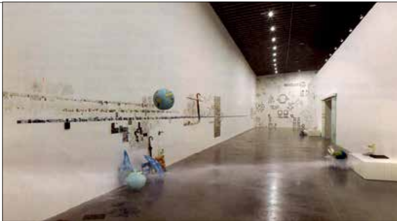
Lia és Dan Perjovschi: A műhely állapotai 1990–2015