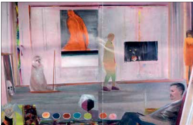
Ioan Aurel Mureșan: A művész műterme (2020)