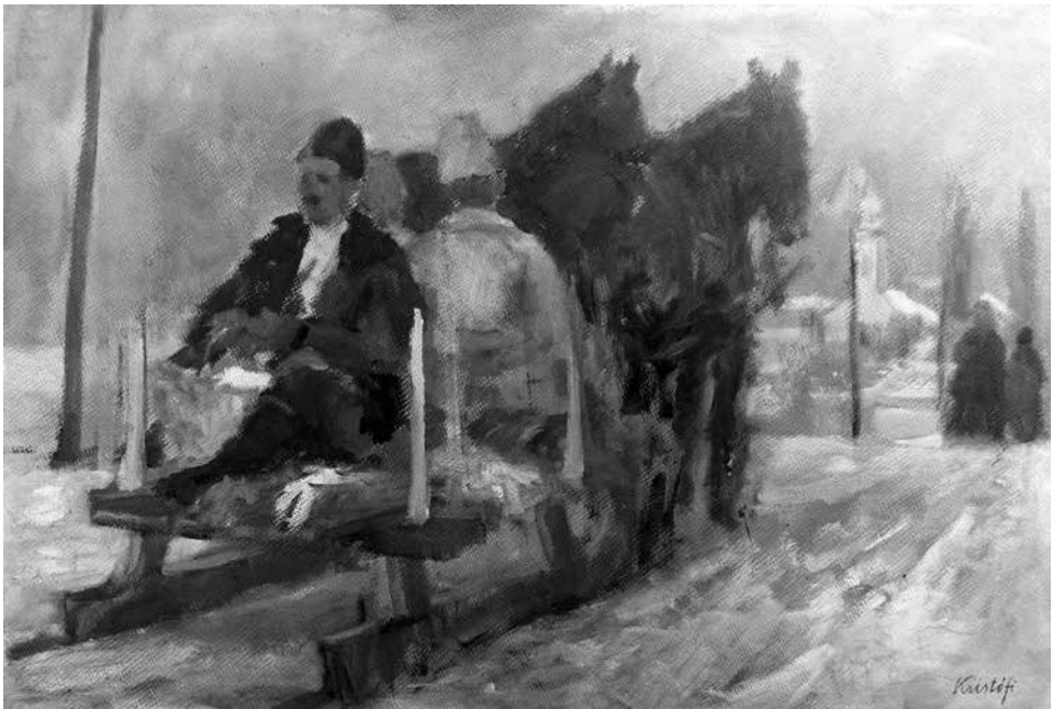
Lovasszán, olaj, karton, 64 × 94 cm

(Részletek az Otthonom Szatmár megye sorozat 60. köteteként rövidesen megjelenő, Kannibália kannibáltalanítása című kötetből.)