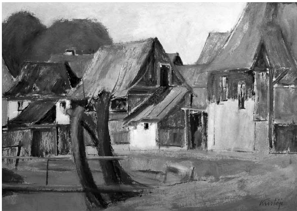
Zsögödi patakpart, olaj, karton, 50 × 70 cm