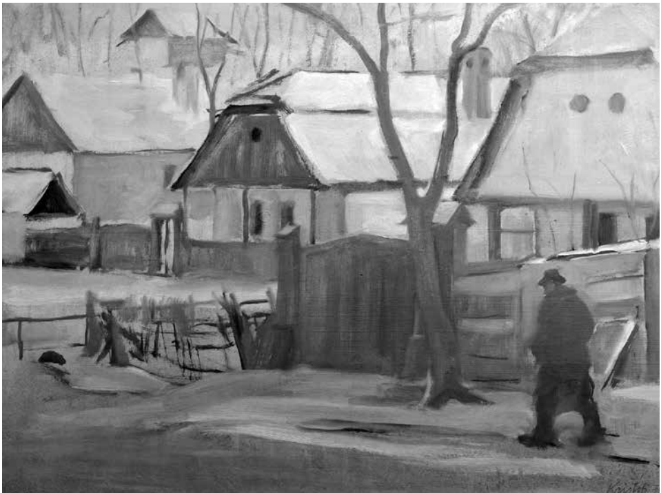
Tél Micskén (1979), olaj, karton, 53 × 70 cm