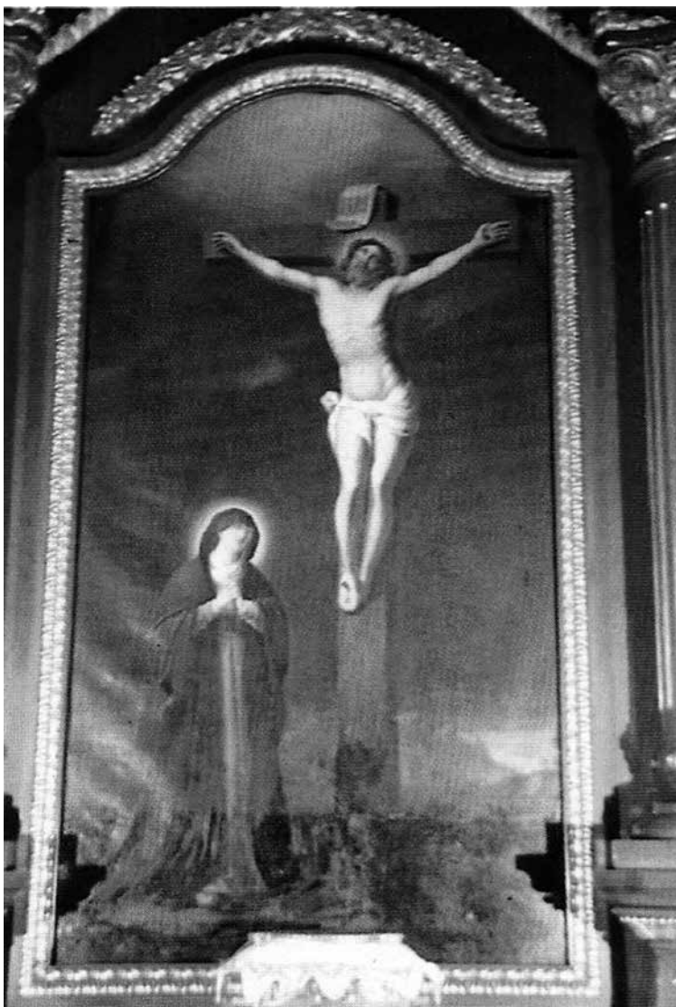
Mater Dolorosa, oltárkép, nagyváradí premontrei templom