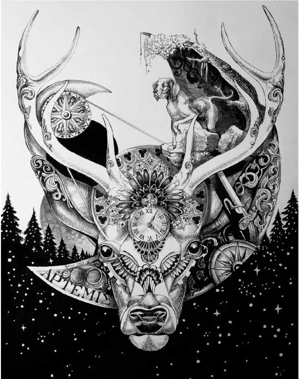
La luna del cacciatore (A vadász holdja)

Szinnyei, 1896. Szinnyei József: Magyar írók élete és munkái. IV. köt. Bp., 1896.