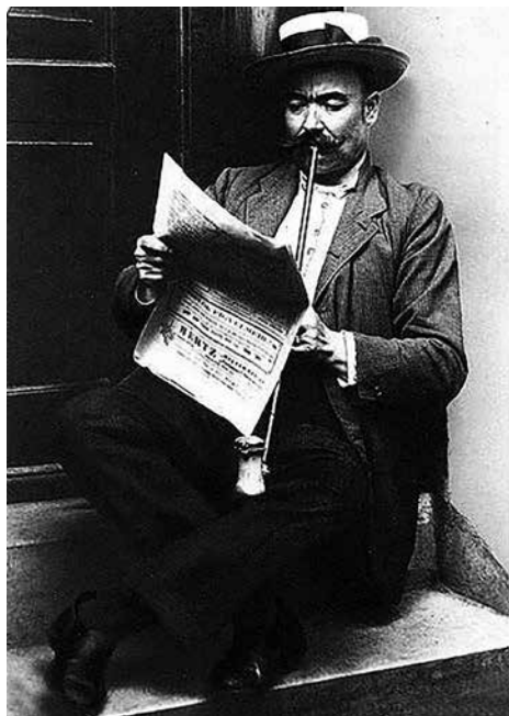
Újságolvasó nagyváradai polgár, 1900 körül