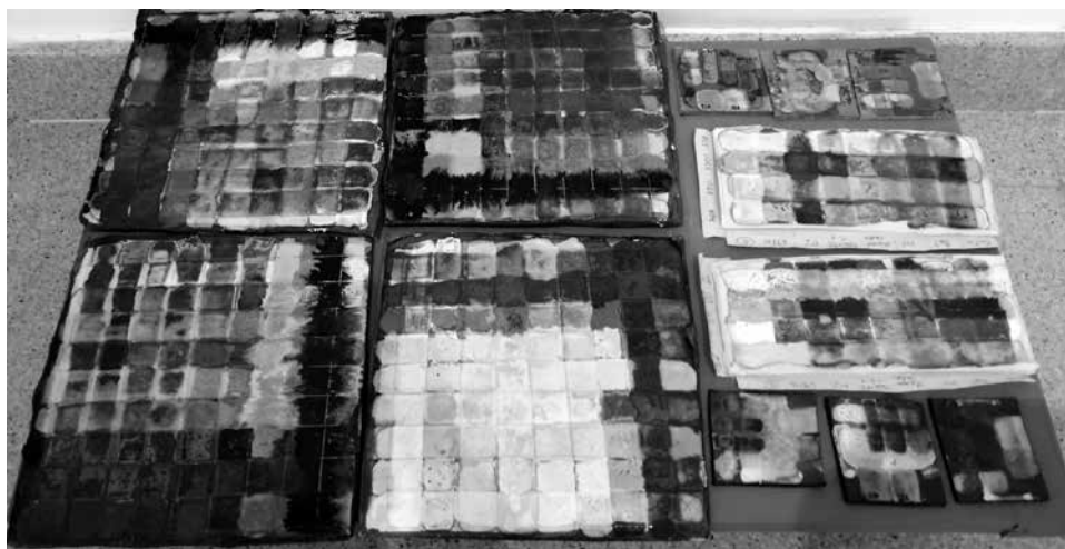
Kísérletek: máztesztek, 2022–2024

Nem kell más, csak egy majdnem üres élet, bor és bodzaszörp. Így ké- nyelmesebben és gyorsabban ér véget.