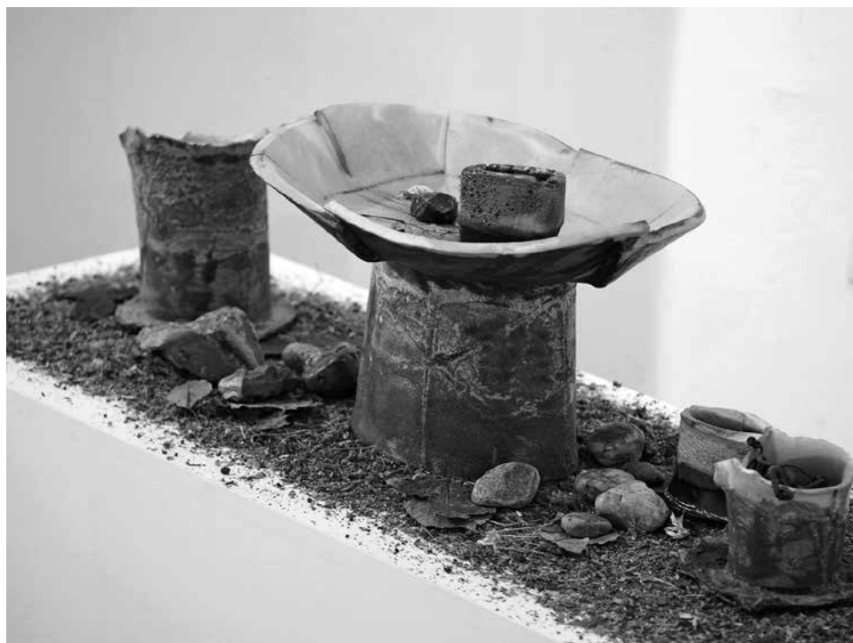
Türkiz csendélet, 2024