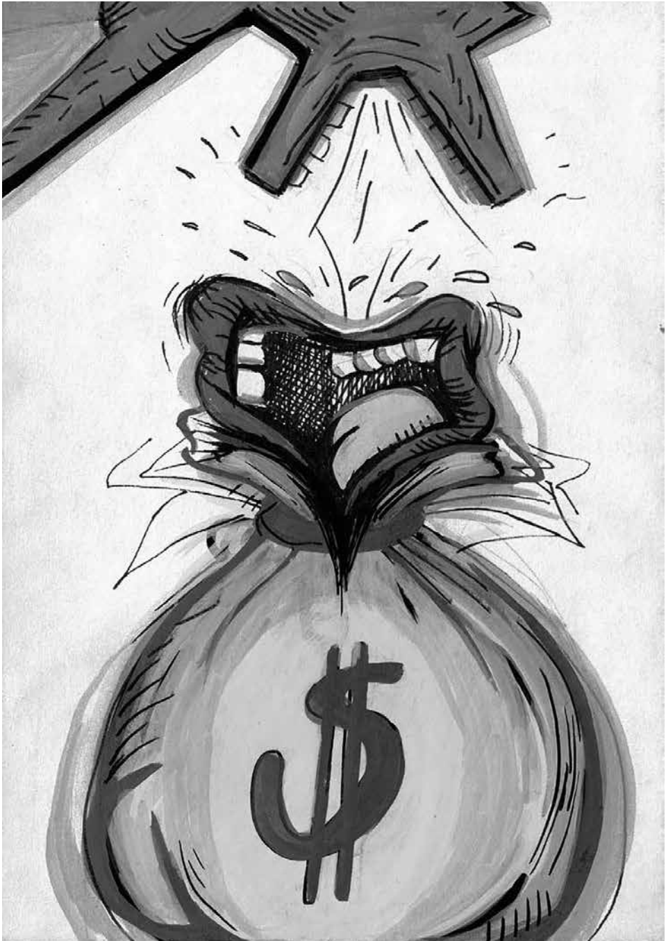
Pénz beszél, kutya ugat